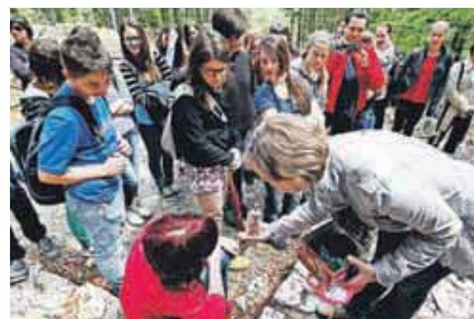
Dijaki so z zanimanjem poslušali pretresljivo pripoved o tem, kakšno je bilo življenje vojnih ujetnikov v času gradnje ceste na Vršič.