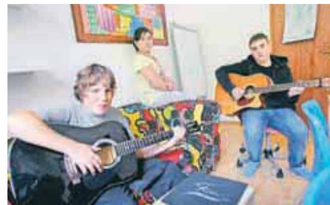
Mlade v Blok privabljajo tudi glasbene delavnice.

Instrukcije, številne delavnice in druženje ob zanimivih dejavnostih privabljajo v Blok kakih 30 mladih, z njimi pa po