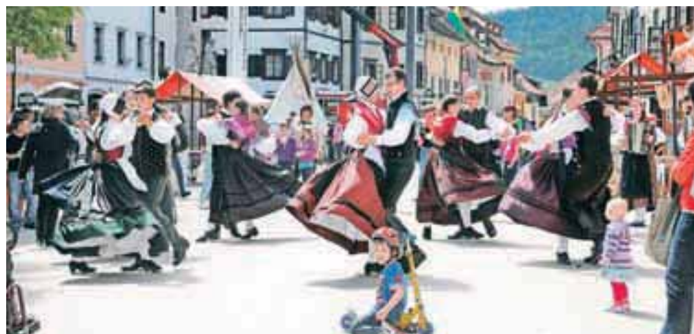
Ob tednu vseživljenjskega učenja so zaplesali tudi loški folkloristi.