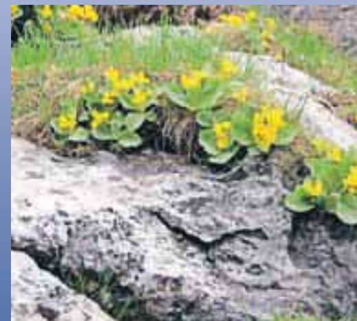
Spomladansko cvetje na Ratitovcu (avrikel)