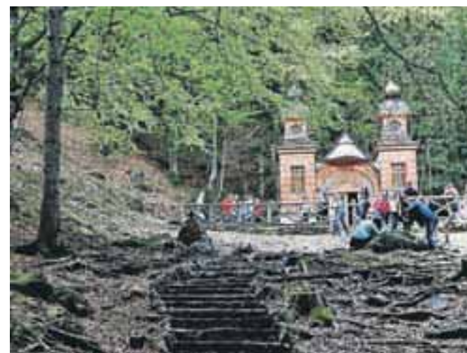
Ruska kapelica je v desetletjih po tragediji postala simbol prijateljstva med Slovenijo in Rusijo.

V okviru projekta se bodo mladi vključili še v ustvarjalni natečaj, kjer bodo izdelovali plakate, predstavitve, fotografije, videoposnetke in načrte za grafite. Projekt se zaključí s podelitvijo nagrad zmagovalcem in aktivnim udeležencem. Pet zmagovalcev natečaja pa bo odšlo na petdnevno potovanje v Moskvo.