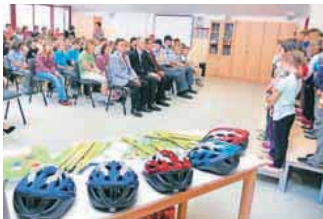
Žirovski petošolci so na kolesu (in ob njem) med najbolj spretnimi v Sloveniji.