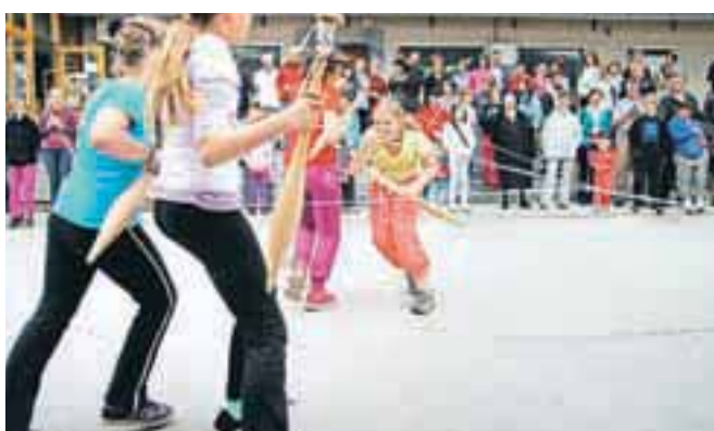
Na šaljivem tekmovanju so se pomerili mladi iz številnih slovenskih čipkarskih šol. Spomnimo, žirovska čipkarska šola šteje že 107 let!