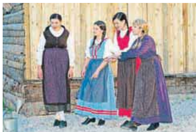
Prizor s privoščljivimi dekleti

Dražgoše – Igralska zasedba Kulturno-umetniškega društva Dražgoše (KUD) je v zadnjem mesecu navduševala z novo, že četrto predstavo na prostem. V gledališče Za plotom so umestili igro Krivoprisežnik avstrijskega avtorja Ludwiga Anzengruberja. Gre za več kot sto let staro narodno igro s petjem v treh dejanjih, zgodba pa se vrti okoli gospodarja bogate domačije, ki na podlagi krive prisege podeduje premoženje. Enaindvajset igralcev je igralo v narečju, saj je tako stik s publiko bolj domač in pristen. Žal so pri četrti igri imeli precej smole z vremenom. Uprizoritvi jim je uspelo pet predstav, ki si jih je skupaj ogledalo približno tisoč gledalcev. Štiri predstave so morali odpovedati, eno pa