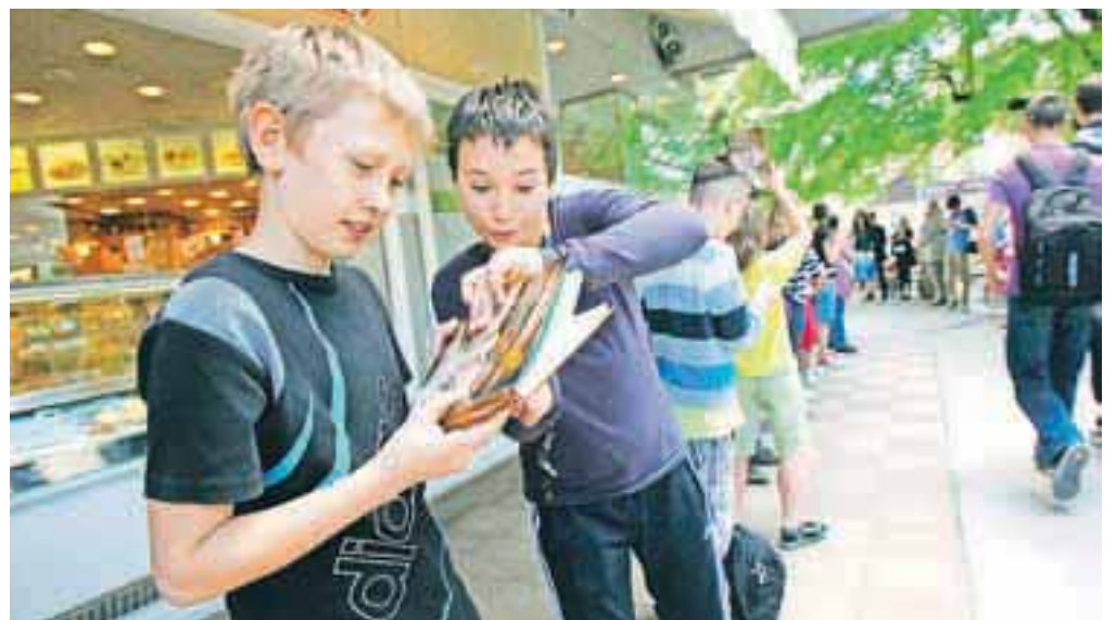
Knjige v živi verigi iz rok v roke / FOTO: TINA DOKL

Slovesno odprtje mladinskega oddelka knjižnice je potekalo na terasi Name, od koder je najlepši pogled na starodavno Škofjo Loko, zaradi česar knjižnico že imenujejo "knjižnica z raz-