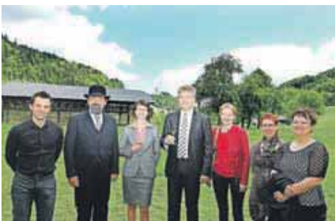
Skupina, ki je oblikovala projekt Poroka na Visokem. Do konca septembra je termin rezerviralo že 15 parov, čeprav oglaševanja še niso zagnali.