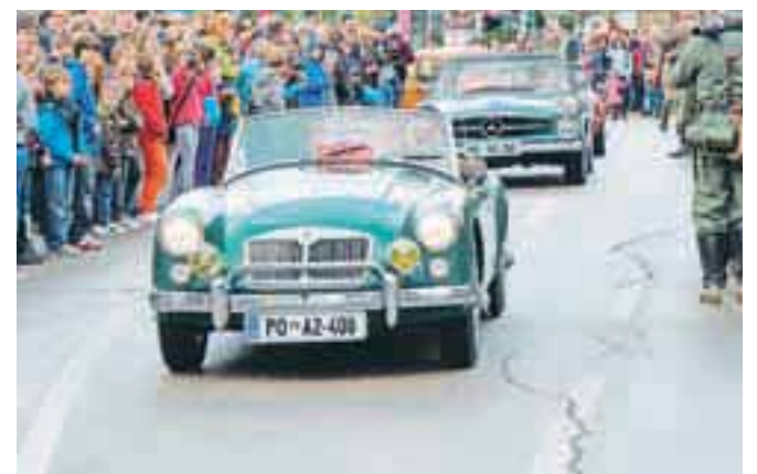
Nedeljsko dogajanje so razen bitke močno zaznamovali tudi starodobniki. Žiri so bile tokrat tudi v centru povsem polne, prometni infarkt pa še večji.