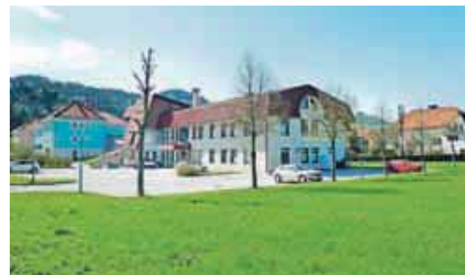
Načrt novega doma za starejše, ki bo ob zdravstvenem domu, bo nared letos.