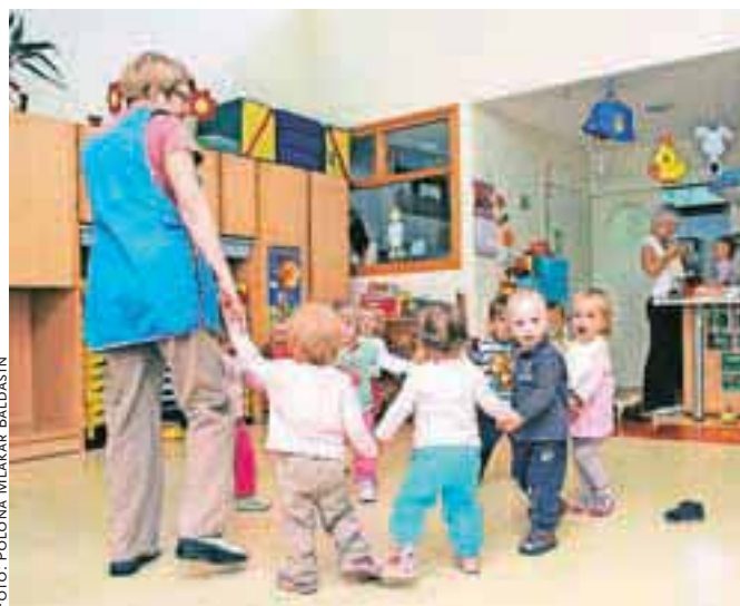
Za žirovske malčke je v vrtcu dovolj prostora.