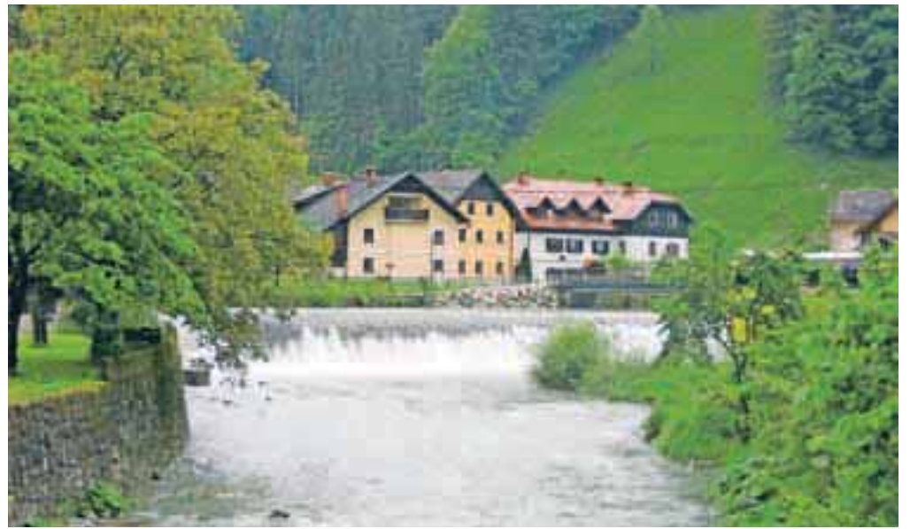
Letos nameravajo prednostno izdelati projektno dokumentacijo za najbolj kritičen odsek od Dermotovega jez (na sliki) do Dolenčevega jez.