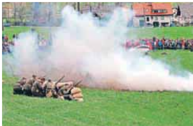
Tako kot lani je tudi letos prikaz bitke na Rupnikovi liniji privabil številne obiskovalce. Našteli so jih vsaj pet tisoč.

V bitki je sodelovalo sedemdeset vojakov iz Kulturno zgodovinskega društva Triglav in njihovi prijatelji iz sosednjih držav, okrog petdeset domačinov je nastopalo v vlogi beguncev. Vojaki so se že kak dan prej utaborili na Dobračevi, na nedeljski dopoldan prišli v center Žirov in umerili tudi kak strel. Na glavnem mostu so postavili mejno kontrolno točko in s tem ustavili kontrabant med Žirmi in Stari Žirmi oziroma med takratnima državama Jugoslavijo in Italijo.