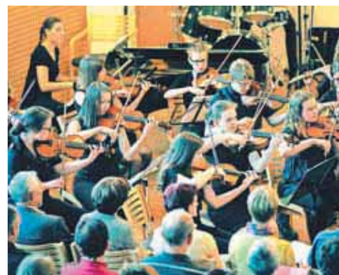
Simfonični orkester, ustanovljen lansko jesen, je odlično opravil svojo prvo veliko nalogo.