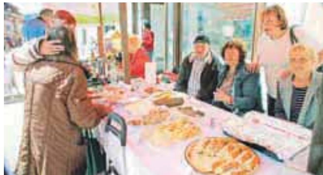
Med ponudniki znanja (in dobrot) na stojnicah so bili tudi loški gobarji.