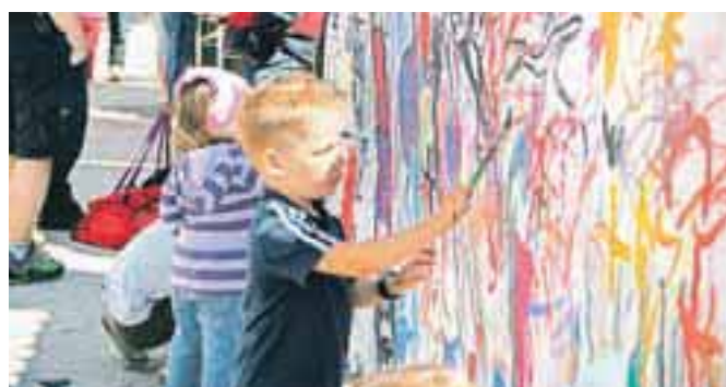
Otroška ustvarjalnost v Mestu v barvah