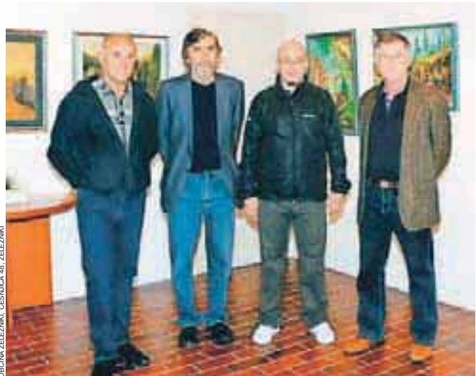
OBČINA ŽELEZNIKI, ČESNICA 46, ŽELEZNIKI