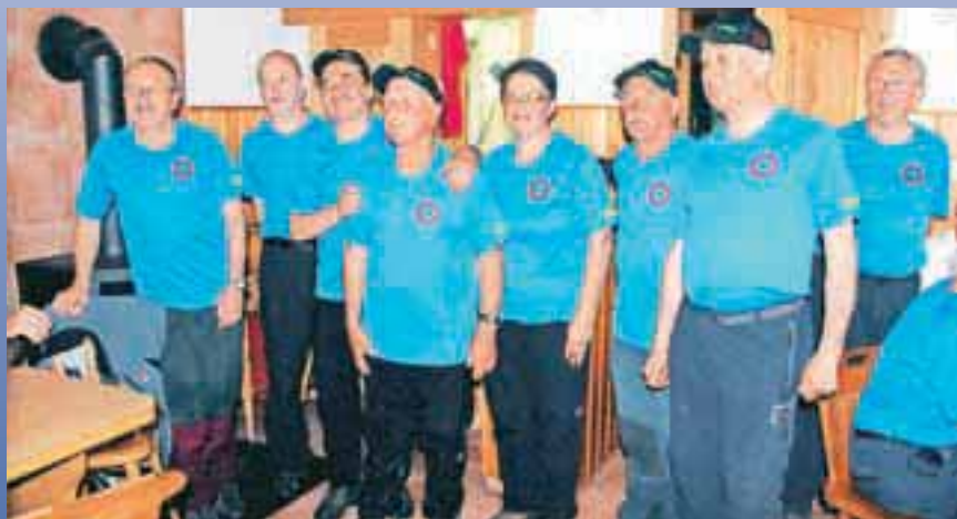
Najboljši v akciji Prijatelj Ratitovca 2012

Planinsko društvo za Selško dolino Železniki, Trnje 39, 4228 Železniki