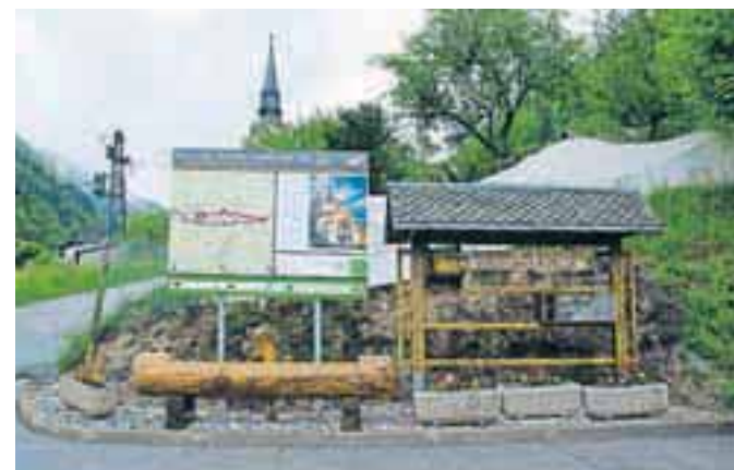
Info točko so uredili na parkirišču športnega igrišča.