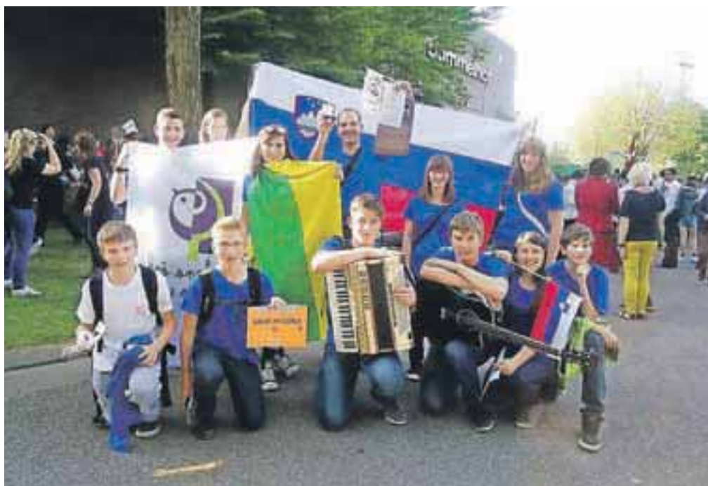
Uspešni mladi harmonikarji so na tekmovanju v Belgiji opravili z odliko.