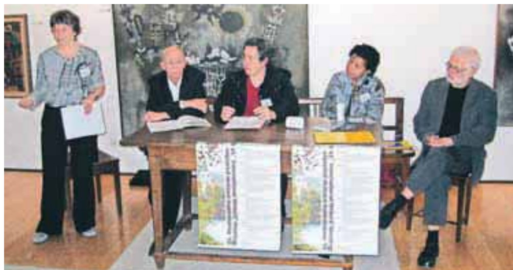
Poslanstvo organizacije PEN ostaja zaščita svobode izražanja in ohranitev duha razsvetljenstva: Drzni si misliti!

Škofja Loka – Mednarodni PEN že od svoje ustanovitve leta 1921 velja za organizacijo, ki si prizadeva za spoštovanje svobode izražanja in preprečevanje nasilja nad pisatelji in novinarji zaradi njihovih stališč. Osrednja tematika tokratnega srečanja literatov je bila posvečena spreminjajočim se razmerjem med kulturnimi središči in periferijo v sodobni digitalni dobi, ko je v ekonomsko-medijski globalni prepletenosti izvirna ustvarjalnost potisnjena na rob. PEN opozarja na zlonamerne mehanizme informacijskih združb, ki stremijo k centralizaciji družbe, pri tem pa razvrednotijo pišočje avtorje. PEN v tej situaciji ostaja eden izmed ključnih zaščitnikov raznolikosti kultur, ki odpira prostor dialoga na osnovi priznanja svobode in sožitja vseh civilizacijskih subjektov. V tem duhu je potekal tudi literarni večer v Miheličevi galeriji v Kašči, na kateri so