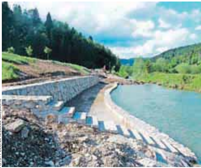
Brežina na Pustotniku bo kmalu urejena in bo ob toplih dneh marsikoga zvalila na osvežitev ob Sori.

»Letos dodatnih zadolžitve ne bo, nasprotno, v letošnjem proračunu smo planirali sto tisoč evrov dodatnega poplačila dolga. Naša naloga pred uresničevanjem večjih