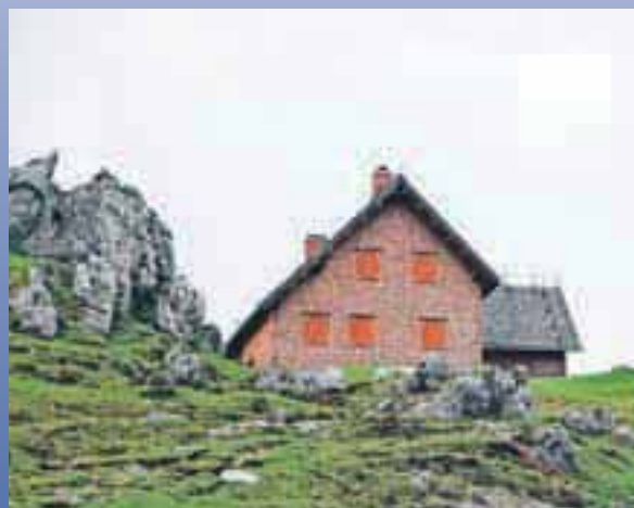
Krekova koč na Ratitovcu