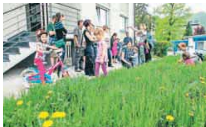
Urbane sprehajalce je pot vodila tudi do nekaterih loških vrtcev.

Ideja Jane's Walk spodbuja, da se ljudje po mestu čim več gibljemo peš, kar spodbuja tudi razvoj mestnih središč. Udeleženci pa so ugotavljali, da zlasti za ranljive skupine ljudi, med katere sodijo otroci, starejši, invalidi, to ni vedno enostavno. Otroke, ki so se včasih