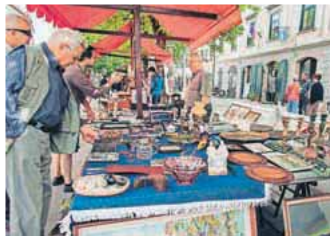
Na Mestnem trgu je zaživel sejem starin.