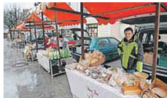
Takole pogumno so na hladno sredo sredi marca ponudniki vztrajali ob svojih stojnicah.

Letošnja zima se je zavlekla še pozno v marec. Kljub temu so se že prvo marčevsko soboto znova začele tržnice kmetijskih pridelkov in izdelkov, ki jih Razvojna agencija Sora in Društvo za razvoj podeželja Resje v občinskih središčih občin Gorenja vas – Poljane, Škofja Loka, Železniki in Žiri prirejajo že štirinajsto leto zapored. Prva je bila v Škofji Loki, na Mestnem trgu, kjer so se na stojnicah predstavili ponudniki izdelkov blagovnih znamk Babica Jerca in Dedek Jaka – Naravni izdelki iz škofjeloških hribov, ponudniki medu z oznako Slovenski med in ponudniki drugih visokokakovostnih izdelkov. Tržnice so tudi v ostalih občinah. Ob sredah popoldne pa Ločani lahko obišejo tudi ekološko tržnico v starem mestnem jedru. D. Z.