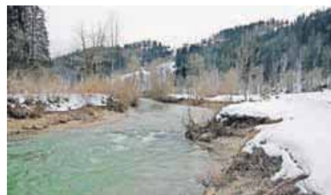
Ko bo skopnel sneg, se bo začelo urejanje brežine Sore za kopališče.

V Pustotniku občina že dlje časa ureja turistično rekreativni del Žirov. Pred časom je občina postavila otroška igrala, tu je načrtovan avtokamp, na tem mestu bo letos že petnajstič eden najbolj znanih moto zborov v Sloveniji in širše. Občina bo v neposredni bližini že letos spomladi uredila naravno kopališče. Skupaj z Agencijo za okolje in Vodnim gospodarskim podjetjem Kranj morajo namreč urediti strugo Sore, hkrati pa bo urejena brežina za kopanje in poležavanje, voda bo zajezena. »Dogovoriti se moramo le še za primerno ponudbo ob lepih dnevih,« pravijo na občini. B. B.