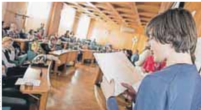
Mladi parlamentarci so letos govorili o odraščanju.