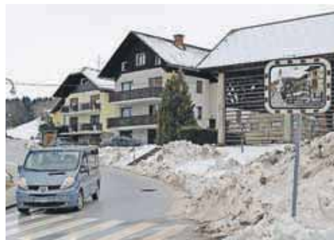
Zaradi obilice snega bodo na občini morali za zimsko službo nameniti za 60 odstotkov več od načrtov.

Če so v prejšnjih letih za zimsko službo porabili 351 oziroma 520 tisoč evrov, in predlani 360 oziroma lani 270 tisoč evrov, so v letošnjem proračunu rezervirali 400 tisoč evrov. Računi za zimsko službo pa so bili do sneženja prejšnji teden že nad 650 tisoč evri. »Trudimo se, da za vloženi denar dobimo največ, zato izvajamo analize in opozarjamo na racionalizacijo. Pa vendar, varnost je na prvem mestu, veliko mi pomeni, da so zadovoljni tudi krajani,« še pravi Čadež.