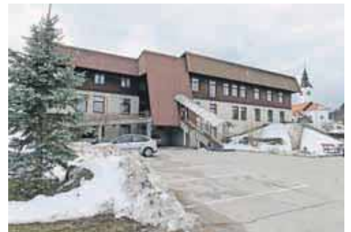
Za energetske sanacije zdravstvenega doma je občina pridobila več kot dvesto tisoč evrov.

Spomnimo, da je zelo podobna energetska sanacija že zaključena v Osnovni šoli Poljane, kjer je občina skupaj z Regionalno razvojno agencijo Gorenjske (BSC Kranj) uspela pri projektu REAAL – Obnovljivi viri energije v Alpskem prostoru pridobiti več kot pol milijona evrov. Zamenjali so energent ogrevanja oziroma postavili novo kurilnico na lesno biomaso, zamenjali večino oken na južni strani šole in postavili tudi sončno elektrarno. Infrastrukturno ministrstvo je januarja objavilo že nov razpis za sofinanciranje sanacije občinskih stavb, na katerega so prijavi energetsko sanacijo fasade in strehe Osnovne šole Gorenja vas. Župan pravi, da bo občina v prihodnje na tovrstnih razpisih kandidirala tudi s projektoma za podružnični šoli Javorje in Sovodenj, upa pa, da bodo lahko v prihodnosti sodelovali tudi s projektom za ureditev ogrevanja Osnovne šole Ivan Tavčar Gorenja vas z obnovljivimi viri, saj v zadnjem razpisu ta vsebina ni bila zajeta.