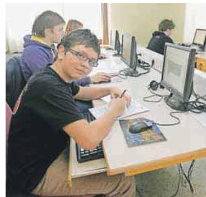
Učenci so tekmovali tudi v urejanju besedil s programom Word.

Kot je pojasnila ravnateljica Marjeta Šmid, je bila udeležba na letošnjem tekmovanju rekordna, kar dokazuje, da se na vse več osnovnih šolah s prilagojenim programom zavedajo, kako pomembno je pridobivanje računalniškega znanja za njihove učence. »Znanje programskih orodij, ki so vključena v tekmovalni del, so največjega pomena za učence, nadaljnje šolanje in zaposlitev, saj praktično ni področja, kjer ga ne bi potrebovali,« je poudarila. Kot pravi, učenci vsako leto pokažejo več računalniškega znanja, zato se nivo zahtevnosti na tekmovanju nenehno dviguje. Posebej se je zahvalila še vodji tekmovanja Ireni Ferlinc Brezovar, donatorjem ter glasbenikoma Boštjanu Gombaču in Janezu Dovču, ki sta poskrbela za prijeten kulturni program.