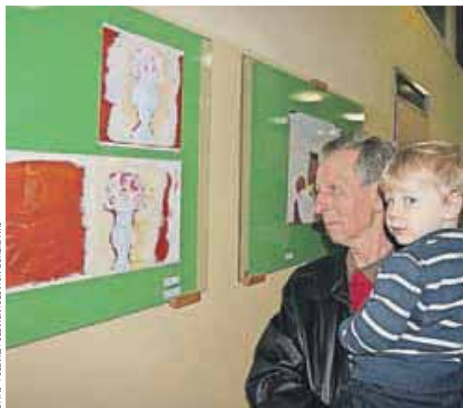
Razstava je pritegnila številne obiskovalce, ki so si z zanimanjem ogledali dela ljubiteljskih slikarjev.