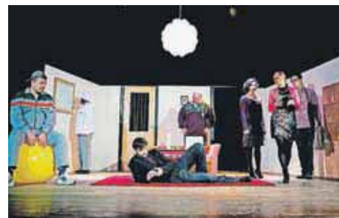
Komedija o vsakdanjih poteh in stranpoteh