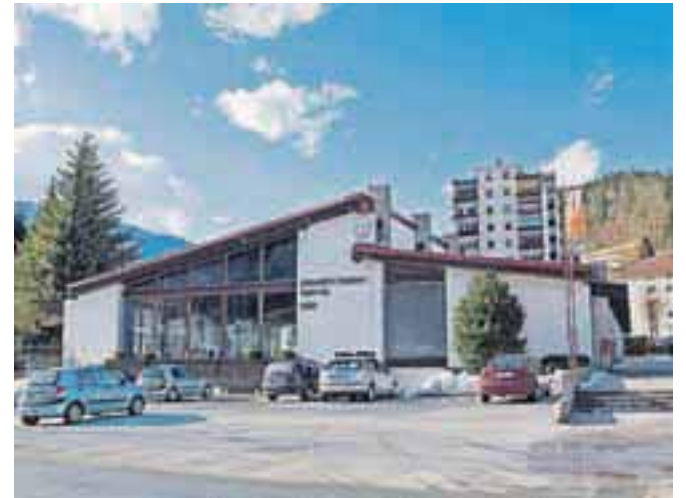
Prihodnje leto se bodo lotili tudi energetske sanacije 40 let starega plavalnega bazena.

Boljši časi pa se očitno obetajo tudi 40 let staremu plavalnemu bazenu. Njegova energetska sanacija je ocenjena na slabih 570 tisoč evrov, pričemer občina pričakuje 405