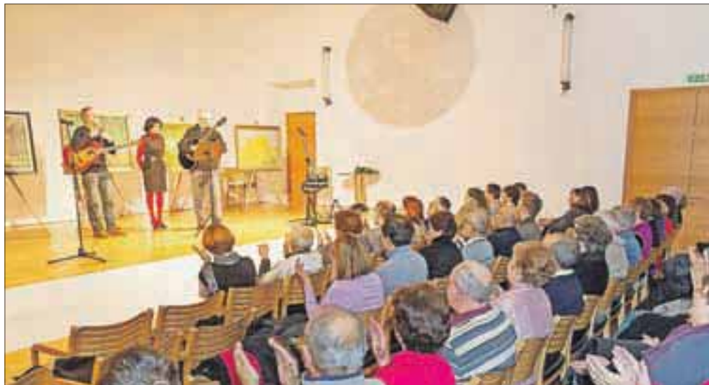
Člani Kluba zdravljenih alkoholikov dr. Viktorja Kocjančiča Škofja Loka so sami pripravili program ob štiridesetletnici kluba.