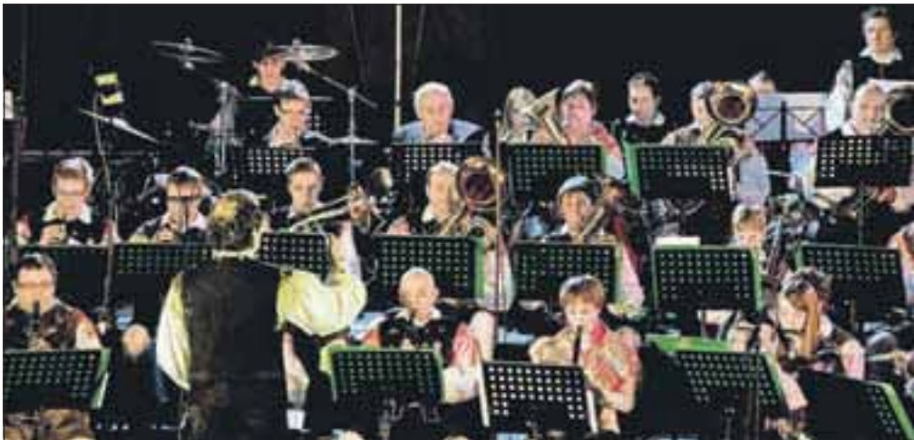
Pihalni orkester Alples tudi letos pripravlja božično-novoletni koncert.

Člani Pihalnega orkestra Alples imajo za seboj pestro leto. Še posebej si ga bodo zapomnili po gostovanju v Franciji, v bližini mesta Lyon, kamor smo se odpravili maja. »V mestu Aix en