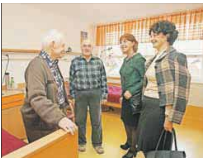
Obiskovalci so si ogledali eno od obnovljenih sob v četrtem nadstropju Centra slepih, slabovidnih in starejših.

»Za 320 kvadratnimi metri na novo položene keramike in pod 420 kvadratnimi metri talnih oblog se skriva 1.565 metrov vodovodnih cevi in 8.988 metrov električnega kabla. Si lahko zamislimo teh devet kilometrov? Škoda, da ob teh številkah ni podatka, koliko lukenj je bilo potrebno zavrtati v stene, pod in strope, kamor so mojstri vse to poskrili,« je zapisal v prispevku, ki so ga prebrali ob odprtju.