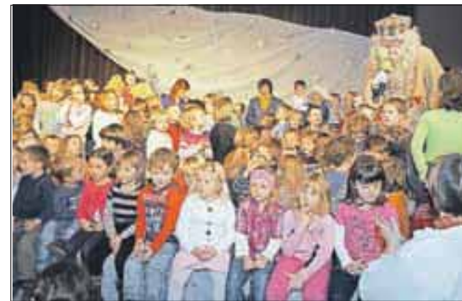
Prejšnji teden je žirovske malčke v DPD Svoboda obiskal dedek Mraz. Vse, tiste s subvencijo ali brez.