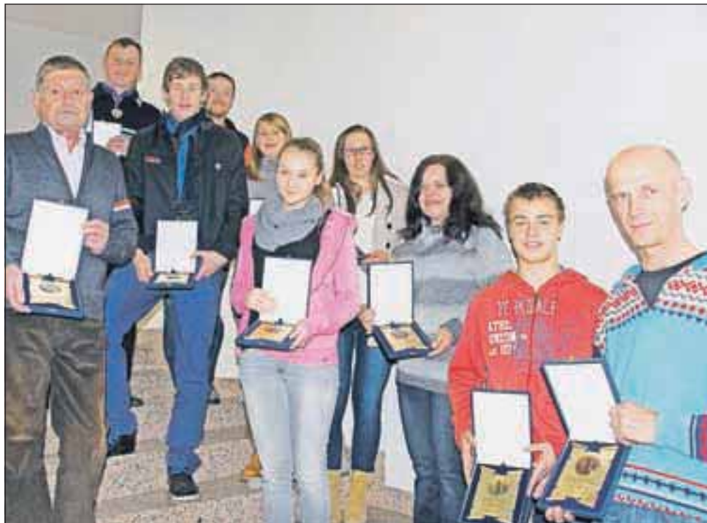
Dobitniki priznanj za najboljše športnike, športne delavce in društva