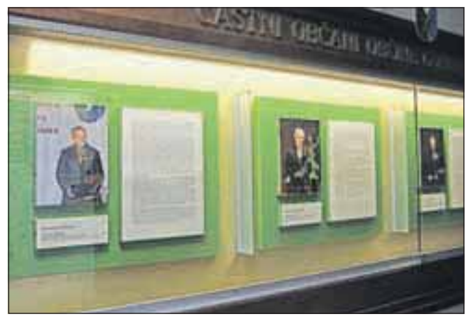
Vitrina s častnimi občani na hodniku v Domu občine