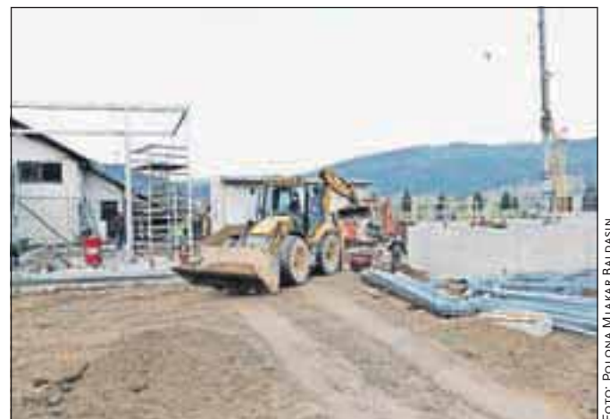
Ob zaključku nadgradnje čistilne naprave (to je konec prihodnjega leta) bo morala občina obračunavati tudi amortizacijo končnim porabnikom – gospodinjstvom.

Ali spremenjeni odloki pomenijo tudi povišanje cen? »Samo zaradi spremenjenih odlokov se cene ne spreminjajo, bo pa z državnimi predpisi usklajen način izračunavanja cen,« odgovarja župan Janez Žakelj. Prej zamrznjene cene je država sprostila s 1. januarjem, zato na občini pričakujejo povišanje cen, ki bodo zajemale tudi amortizacijo vodovodnega in kanalizacij-