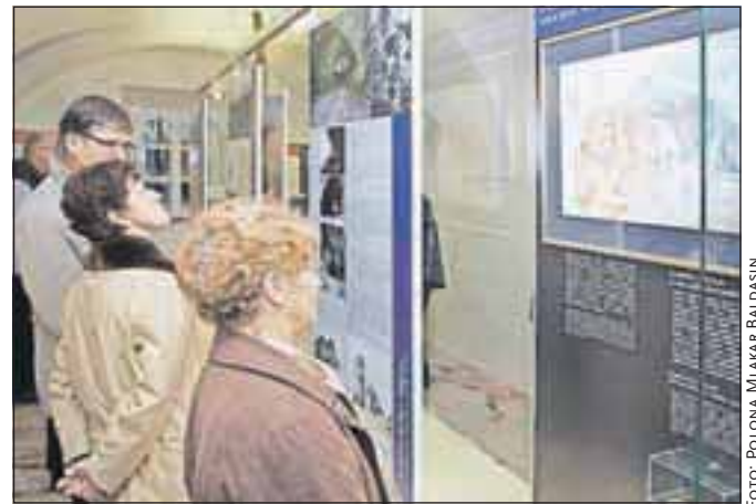
Ob vstopu na razstavo obiskovalci skozi Matjažev kamre najprej spoznava žirovsko daljno preteklost.