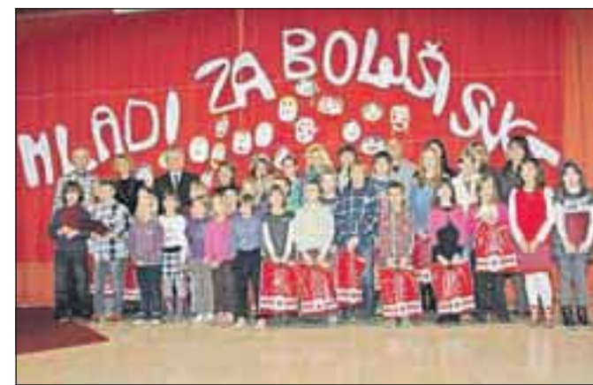
Mladi so za sodelovanje prejeli nagrade, najboljši tudi mini počitnice na Debelem rtiču.

Organizatorja sta letos prejela skoraj sedemsto del iz 63 zavodov, na zaključni slovesnosti pa so podelili devet glavnih nagrad, eno skupinsko in 21 tolažilnih. Najboljših devet je prejelo za nagrado vikend paket za vso družino na Debelem rtiču, ostali poleg priznanja še lepo darilo. V kulturnem programu so nastopili učenci glasbene šole. Razstava je na ogled v spodnjem hodniku šole.