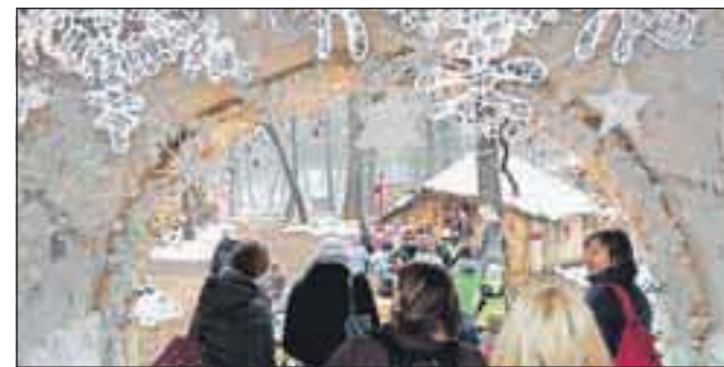
Skozi vrata v skrivnostno pravljicno deželo

Dedek Mraz tudi letos razveseljuje otroke v Pravljicni deželi Gorajte in jih vodi skozi tamkajšnji svet pravljic. Pravljicna dežela, ki je od letos naprej v organizaciji društva Oddih Gorajte, je zaživela že sredi decembra. Najprej so vanjo povabili (in jih obdarili) otroke in odrasle s posebnimi potrebami, od 19. do 29. decembra pa jo lahko obišejo vsi, ki se želijo srečati z dedkom Mrazem in pravljicnimi junaki. Z njimi se bodo vsak dan lahko srečevali ob 13., 15. in 17. uri, 24. decembra le ob 13. in 15. uri, 25. decembra pa bodo vrata v pravljicno deželo zaprta. D. Ž.