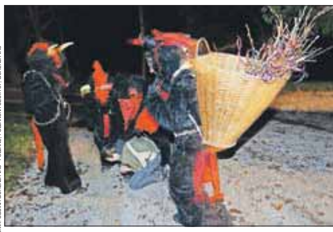
Kdo se je na Visokem ustrašil parkeljnov?