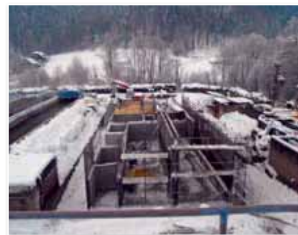
DIALOG-SINET d.o.o., Slovenska cesta 54, Ljubljana

Operacijo delno financira Evropska unija, in sicer iz Kohezijskega sklada. Operacija se izvaja v okviru Operativnega programa razvoja okoljske in prometne infrastrukture za obdobje 2007–2013, razvojne prioritete »Varstvo okolja – področje voda«; prednostne usmeritve »Odvajanje in čiščenje komunalnih odpadnih vod«.