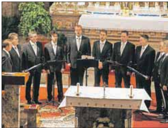
Škofjeloški oktet ohranja bogastvo kulture, zgodovine in narodne identitete, iz katerih vedno črpa novih moči.

brodelni bazar z ročno izdelanimi unikatnimi izdelki pevke zbora, katerega izkupiček so namenile izbranim prejemnikom na Škofjeloškem.