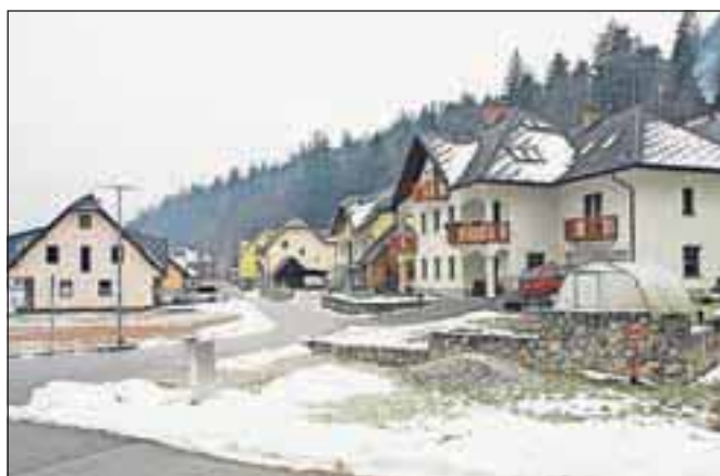
Koliko bo kdo plačeval nadomestila v prihodnje, je odvisno od pravilnosti podatkov v prejšnjih letih. Če so bili pravilni, bo nadomestilo celo manjše. Slika je simbolična.

»Višjo vsoto namenimo še ureditvi zbirnega centra Osojnica, več denarja kot prejšnja leta namenimo rekonstrukciji in asfaltiranju občinskih cest,« je pojasnil župan. Zadolževanja prihodnje leto ne bo, nasprotno, občina bo sto tisoč evrov namenila za poplačilo danes neugodnega stanovanjskega kredita. Med prvo obravnavo in