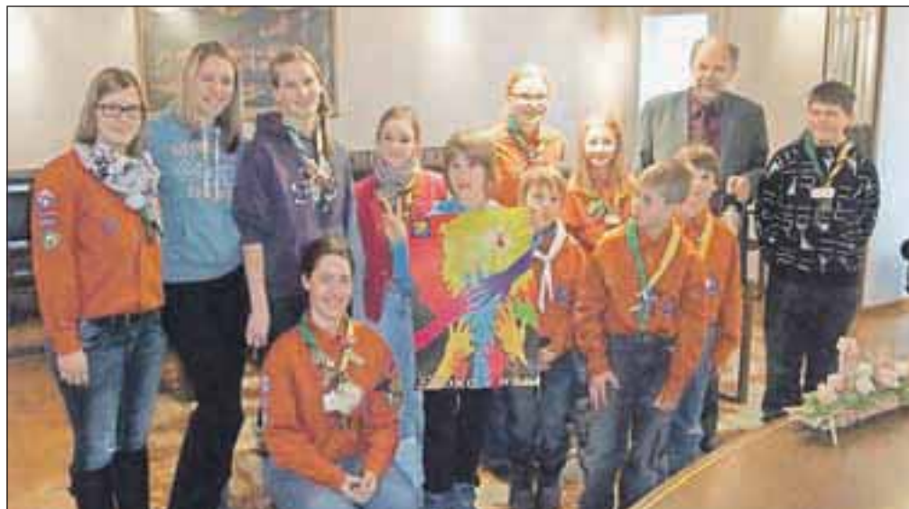
Skavti z lučjo miru pri županu Mihju Ješetju