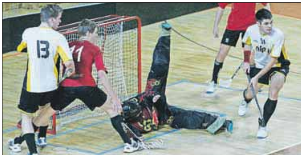
Ločani so bili za zmago proti Borovnici premalo učinkoviti.

Med temi tremi ekipami je pričakovati tudi najhujši boj za nov naslov prvakov, kamor pa se lahko vmeša še ekipa Žirov, ki je na zadnji