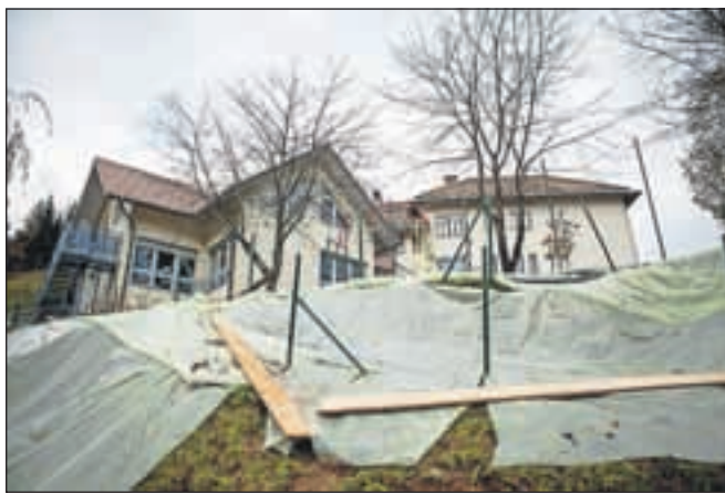
Na Sovodnju je odneslo zemljino pod šolo in vrtcem.

do 5. decembra. »Največji plaz se je utrgal pod šolo in vrtcem na Sovodnju, kjer je cesta že prevozna, opravili smo začasno sanacijo plazu in vodovoda,« pove župan. Dolgoročno rešitev morajo na občini še poiskati, odvisna pa je od dodatnih raziskav terena, v okviru katerih bodo izdelane tri inklinometrične vrtnice za določitev obsega morebitnega širšega plazišča, kontrolne meritve na izbranih geodetskih točkah pa izvajajo že od letošnjega aprila in še niso zaključene. Geodetski elaborati so v izdelavi tudi za številne druge plazove, ki so se utrgali novembra.