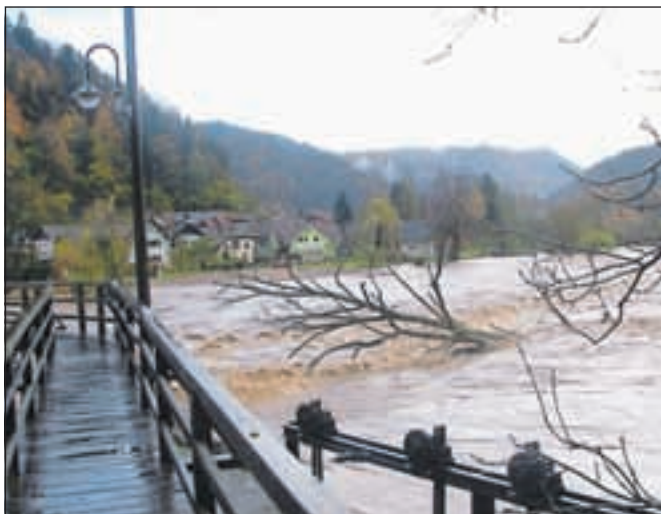
Narasla reka je igraje odnašala drevje.