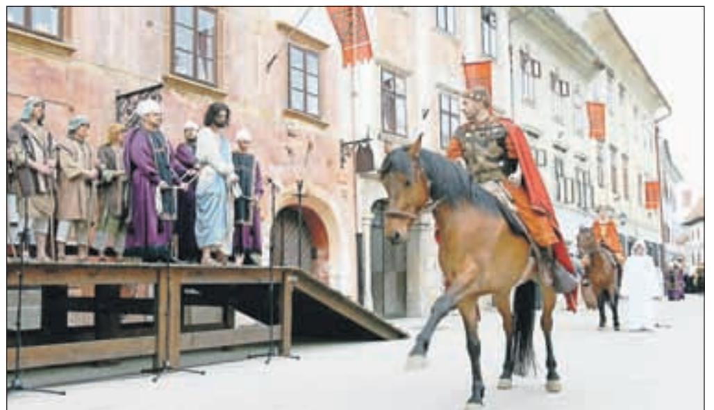
Prizor iz Škofjeloškega pasijona 2009