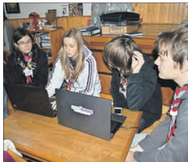
Po zaključku projekta so mladi svoje delo in ugotovitve strnili še v predstavitev, ki so jo izvedli na Občini Železniki.