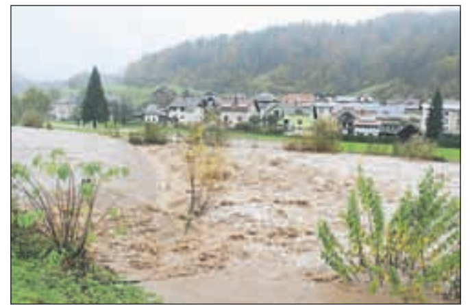
Poljanska Sora je v Gorenji vasi narasla povsem do roba brežine.