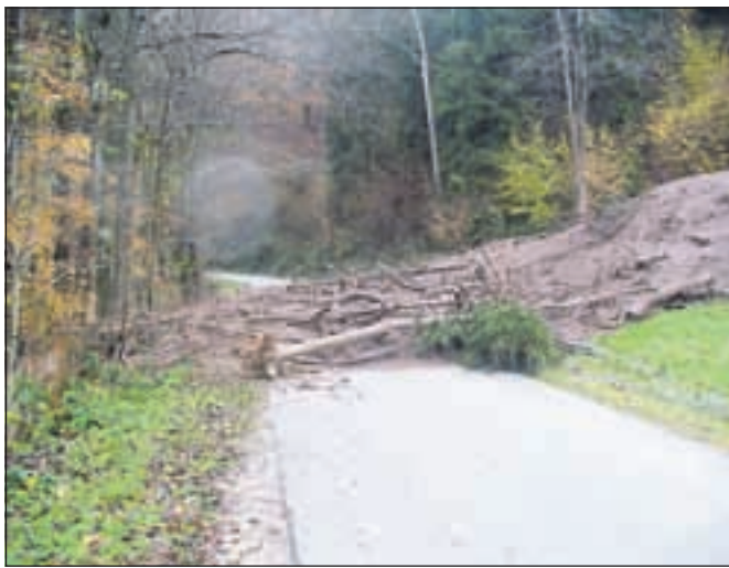
Plaz je zasul cesto v Sopotnici.