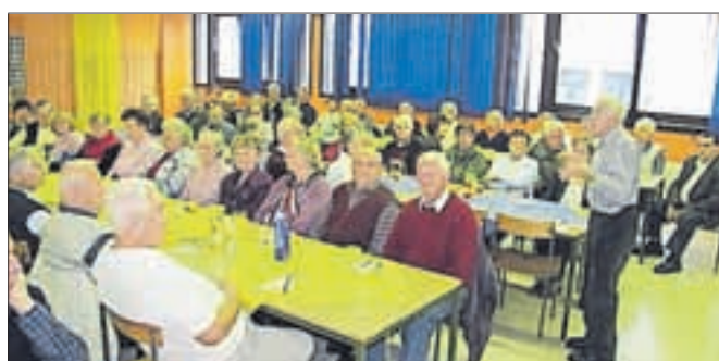
S srečanja starejših