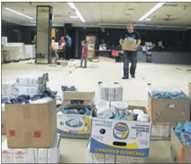
Takole so prostovoljci pripravljali pakete s hrano za socialno ogrožene.

ŽK posebno pozornost posveča tudi starejšim, za katere vsako leto priredijo sveto mašo, družabno srečanje in romanje v enega od romarskih krajev v Sloveniji. Ob božiču jih skromno obdarijo, ob rojstnem dnevu razveselijo z voščilnico, voščiljo jim tudi za veliko noč »Ob tednu Karitas, ki poteka prav ta teden, povabimo lju-