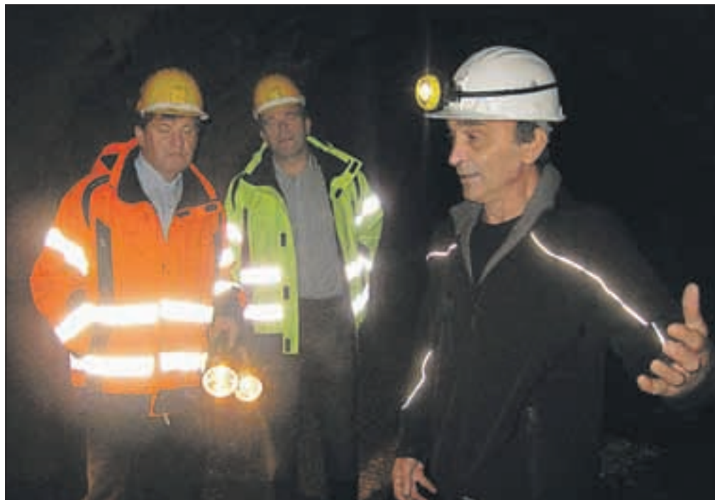
Leta 1995 zgrajeni drenažni rov jalovišča Boršt si je ogledal tudi minister Franc Bogovič. Rov odvede veliko zaledne vode, zgrajen je bil za zaustavitev plazanja in je učinkoval do pred dveh let.

»Kljub težavam je rudnik izvajal monitoring, druge naloge so bile izvedene okrnjeno ali zaustavljene. Tako smo ustavili tudi dejavnosti raziskovalnih vrtin na Borštu, kjer se je jalovišče samo letos premaknilo za štiri centimetre,« pojasnjuje v. d. direktorice Hiacinta Klemenčič. Sredi meseca je rudnik obiskal minister Franc Bogovič in si ogledal tudi Boršt in drenažni rov pod njim. »Ugotovil je, da so dodatna sanacijska dela na jalovišču nujna, in zagotovil, da bo denar zagotovil do 15. decembra. Tako obljubo