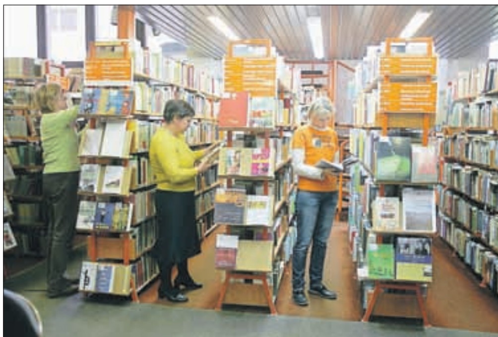
Knjižničarke v škofjeloški knjižnici izposodijo od ena in pol do dvakrat več knjig, kot je povprečje v Sloveniji.

brat časopise in knjige. V čitalnicah so občasno priredili tudi »besede« (s poudarkom na prvem zlogu), družabne prireditve, namenjene dvigovanju narodnega duha. Na njih so uprizarjali burke, »deklamovali«, poslušali vznesene govore veljakov, igrali na tamburice. Nekaj tega duha so hoteli ujeti tudi na petkovi prireditvi Beseda v Loki v Sokolskem domu. V literarizirani obliki (avtorja Ludvika Kaluže) so se sprehodili skozi 150 let, nastopili