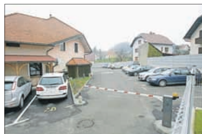
Za zaposlene in koncesionarje v zdravstvenem domu so oktobra odprli posebno parkirišče.