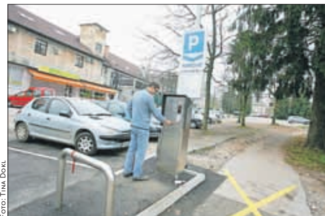
Škofjeločani se počasi navajajo na parkirne avtomate.

je - pod obzidjem, Novi svet – krožna pot, parkirišče pred veleblagovnico Nama, Šolska ulica – pokopališče, Frankovo naselje – ob pločniku Palermo, Frankovo naselje – ob cesti nasproti trgovine Mercator. Modre cone so tudi pred enotami škofjeloških vrtcev, kjer je dovoljeno do 15-minutno parkiranje, za potrebe dovoza in odvoza otrok med 7. in 8.30 ter 14. in 15.30. Tak parkirni režim bodo kmalu vzpostavili tudi pred vrtcem