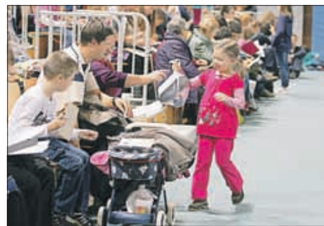
Med obiskovalci dobrodelne tombole so bile tudi letos številne družine.