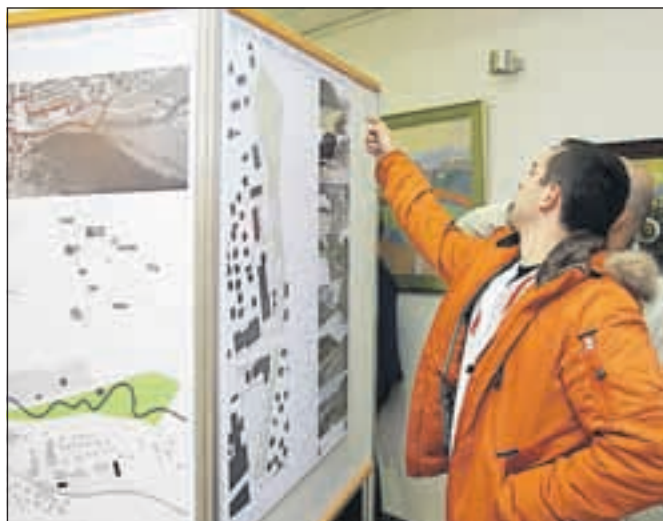
Razstavo s predstavitvijo idej si lahko obiskovalci ogledajo na občini.

Županu je všeč več idej, predvsem ureditev sedaj neizkoriščenega prostora ob Račevi: »Sedanje stanje je kot smetišče, prav bi bilo, da ga uredimo in izpostavimo.« Nekateri bi takoj (pre)uredili tudi Zadružni dom, a je Dolenc zagotovil, da se tega M Sora ne bo lotila in ga lahko takoj prodajo, drugi so izpostavili poplavnost Račeve in morebiten vpliv na predstavljene rešitve. Kakšen bo center Žirov, bodo odločili občani sami, rešitve pa so na ogled na razstavi na občini.