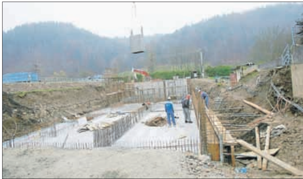
Na gradbišču čistilne naprave na Suhi

Škofja Loka – Posodobitev čistilne naprave na Suhi je del projekta Odvajanje in čiščenje odpadne vode v porečju Sore, ki vključuje še gradnjo nove čistilne naprave Reteče z 2400 populacijskim enotami ter gradnjo in izboljšavo skoraj 13 kilometrov kanalizacijskega sistema. Sodi v širši regionalni okoljski projekt Ureditev porečja Sore, ki ga partnersko izvaja vse štiri občine na Škofjeloškem in ga sofinancirata kohezijski sklad Evropske unije in naša država. Skupna vrednost projekta, ki naj bi do leta 2015 uredil komunalno infrastrukturo v občinah, je blizu 30 milijonov evrov. Čistilna naprava je v občini Škofja Loka prvi od infrastrukturnih objektov, kjer dela že potekajo, in sicer od avgusta letos, ko je gradbeno dovoljenje zanjo postalo pravnomočno. Naložba je vredna več kot šest milijonov evrov, njen potek pa so pred kratkim javnosti pojasnili župan Občine Škofja Loka Miha Ješe , podžupan Robert Strah , predstavnik podjetja GH Holding Teo Vida in predstavnik Inštituta za ekološki inženiring Matija Ce-