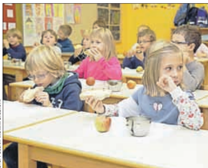
Malčki v vrtcu in šoli so slovenski zajtrk dobro sprejeli.

Še to: v Žireh so v začetku meseca odprli nov oddelek vrtca, nova uredba Vlade pa določa, da se morajo oddelki povečati za dva malčka. Kako bo to vplivalo na delo v vrtcih (morda ukinitve oddelka ali dveh), župan Žakelj ne želi ugibati. B. B.