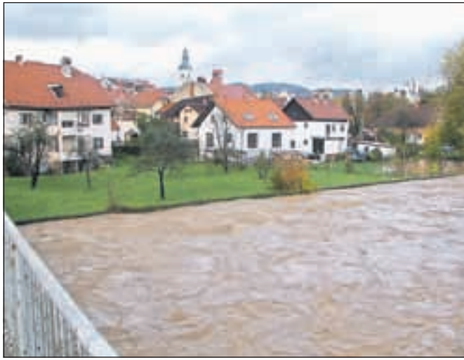
Narasla Poljanska Sora pod puštalskim mostom