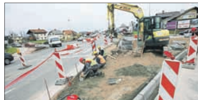
Gradnja krožišča Stari dvor zunaj prometnih konic prometa ne ovira preveč.

Pred kratkim so v Škofji Loki na Starem dvoru začeli urejati začasno krožišče. Zunanji premer krožnega križišča znaša 32 metrov, premer sredinskega otoka 15 metrov, širina krožnega vozišča pa 8,5 metra. Prometno opremo krožnega križišča predstavljajo montažni ločilni otoki na vseh priključnih krakih in montažni sredinski otok iz reciklirane gume. Krožno križišče bo zaradi izboljšanja prometne varnosti dodatno osvetljeno, svetilke nad prehodi za pešce bodo gorele vso noč. Vrednost investicije, ki jo izvaja investitor Ministrstvo za infrastrukturo in prostor (Direkcija RS za ceste) in Občina Škofja Loka, je 187 tisoč evrov, sofinancerski delež občine je 57 tisočakov. Občina bo dodatno uredila tudi manjkajoči pločnik med krožiščem in priključkom na staro Ljubljansko cesto. Gradbena dela izvaja Gorenjska gradbena družba in bodo predvidoma končana v drugi polovici decembra. Zaradi gradnje je na tem delu ceste delna zapora, ki bo v dnevnem času trajala do 21. decembra. D. Ž.