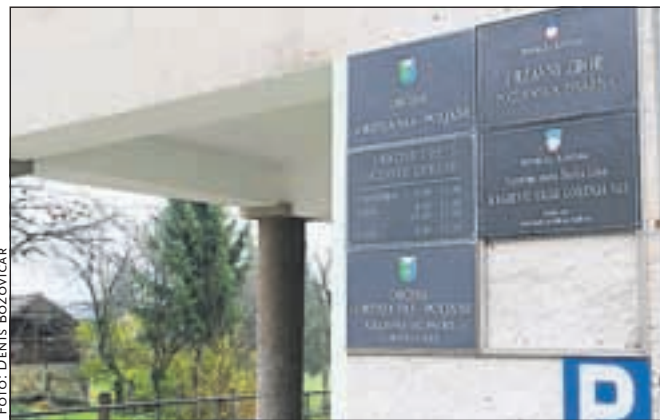
Policija bo na Dom občine pritrdila novo tablo.

»Tudi na tem področju si želimo več sodelovanja z občani,« pravi Šuštar in dodaja, da morajo zbrati obvestila in dokaze. Policijska pisarna v Gorenji vasi deluje od lani in je dobro obiskana. O kraji table Policijske komandir ni odgovoril, povedal je le, da bodo kmalu namestili novo in dodal: »Policisti Policijske postaje Škofja Loka ne želimo, da bi bil naš vsakdanji trud za boljše varnost občanov prikazan pavšalno, zato bomo na povabilo z veseljem predstavili naše delo.«