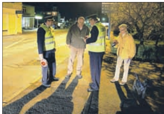
Žirovski šoferji in avtomehaniki so sredi meseca pešce opozarjali na preventivno obnašanje v prometu.