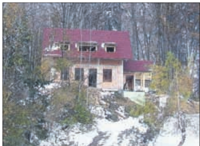
Nov planinski dom raste po načrtih.