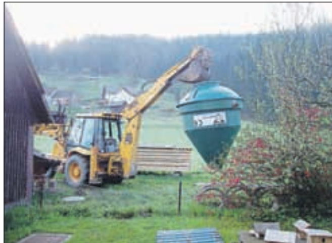
Vgradnja male čistilne naprave na Bukovščici

Slednja bo nadgrajena tako, da bo omogočala čiščenje blata iz malih čistilnih naprav in tudi iz čistilne naprave v Retečah, ki bo v okviru projekta Urejanje porečja Sore zgrajena za 2500 populacijskih enot.« pojasnjuje župan občine Škofja Loka Miha Ješe .