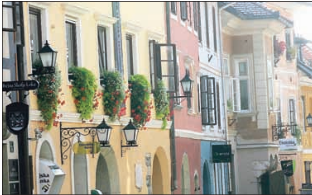
Tudi letos so v starem delu mesta na novo zasijala tri obnovljena pročelja.

Za obnovo fasad pa so ustrezili štirim prosilcem, ki so