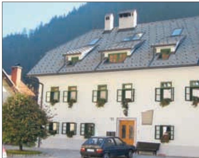
Posebno priznanje si je prislužila tudi obnovljena Dermotova hiša.