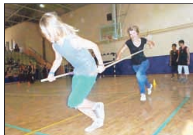
Vsako gostovanje mine v znamenju olimpijskih iger.