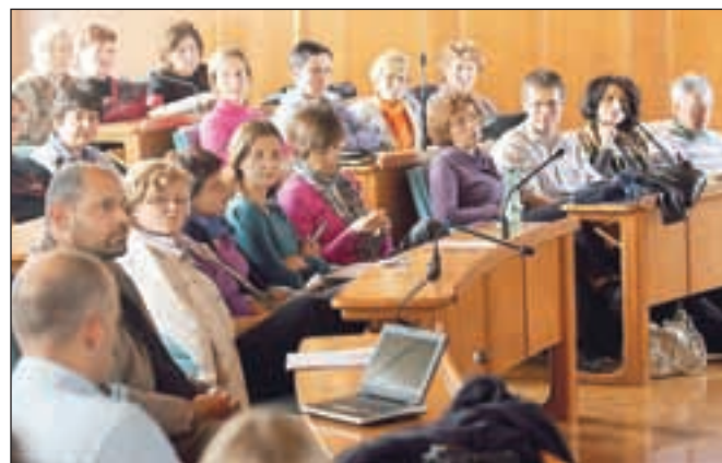
Uslužbenci občinske uprave so ob izobraževanju o trajnostni mobilnosti razmišljali tudi o možnostih, kako bi na delo prihajali brez avtomobila.