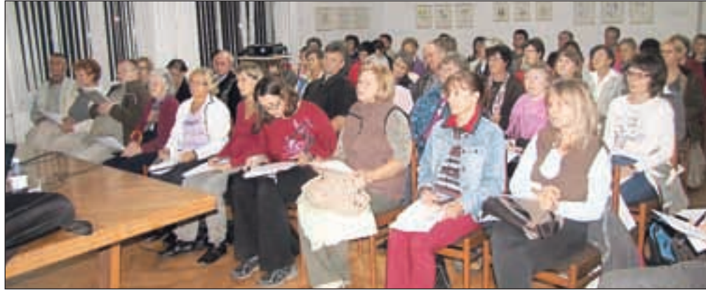
Dosedanja predavanja o ekologiji so bila zelo dobro obiskana.

»S predavanji želimo vrtničarje in kmete spodbuditi k večji pridelavi zelenjave in sadja na čim bolj naraven, ekološki način,« pojasnjuje Bogatajeva. Projekt Moj eko vrt je rezultat sodelovanja LAS loškega pogorja in občin na Škofjeloškem ter Kmetij-