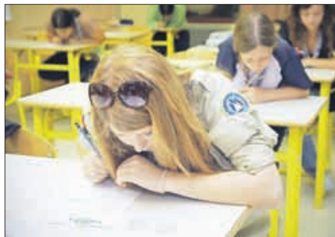
Tekmovanja se je udeležilo 48 ekip z zahtevnim znanjem iz taborniških veščin in orientacije.