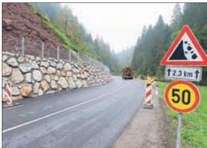
Letos so gradbeniki proti Sovodnju uredili tri odseke, prihodnje leto bo na vrsti še en, daljši odsek.

Gorenja vas – Po več mesecih dela so gradbeniki s treh odsekov ceste Trebija–Sovodnje odšli v začetku meseca. »Izvedli smo sanacijo dotrajanih podpornih zidov ob vodotoku ter sanacijo opornega zidu in splazele brežine nad cesto. Izvajalci so izvedli kamnite zidove in kamnito betonske zložbe, uredili odvodnjavanje in sanacijo cestišča,« pojasnjuje v Direkciji RS za ceste (DRSC), ki jo vodi Gregor Ficko. Vrednost del je znašala skoraj šeststo tisoč evrov. Za prihodnji dve leti je v državnem proračunu na voljo novih tristo tisoč evrov, vključujejo pa rekonstrukcijo ceste in sanacijo opornih zidov. Prihodnje leto se bo, po zagotovilih DRSC, začela