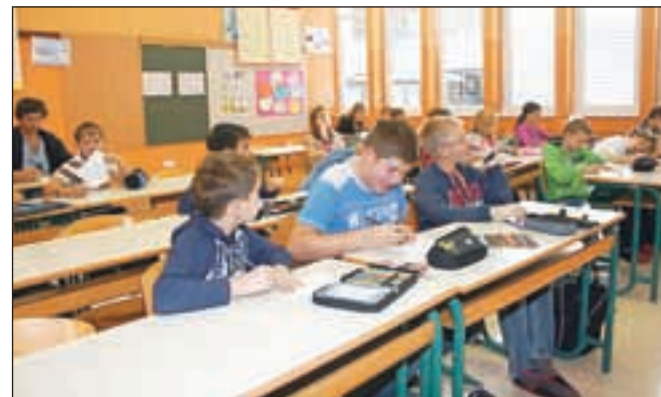
Šestošolci so ustvarjali na temo umetnik v literaturi.