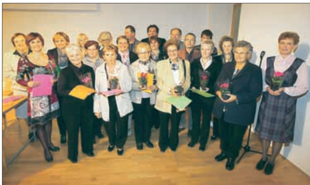
V Škofji Loki so podelili priznanja tistim, ki najlepše skrbijo za svoje stanovanjske hiše, balkone, okolico firm, kulturnih spomenikov, gostinskih in nastanitvenih objektov.