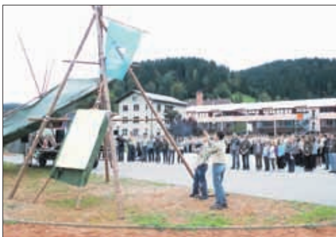
Še dvig zastave ob taborniški himni in ROT 2012 se je lahko začel.

res velikem številu,« je povedal glavni organizator taborniškega tekmovanja Matic Dolenc .