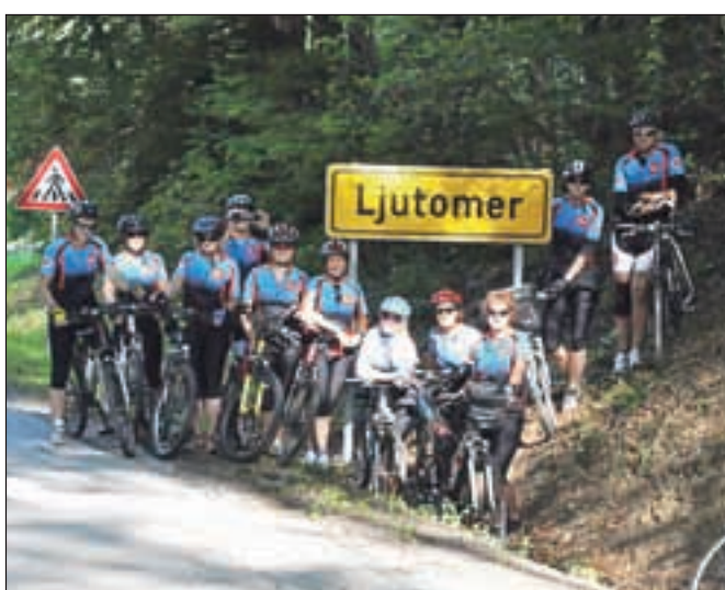
Zaposleni na Osnovni šoli Cvetko Golar so se s kolesi podali na 200 kilometrov dolgo pot iz Gosteč v Ljutomer. Na sliki na cilju v Ljutomeru, kjer je pokopan Cvetko Golar.