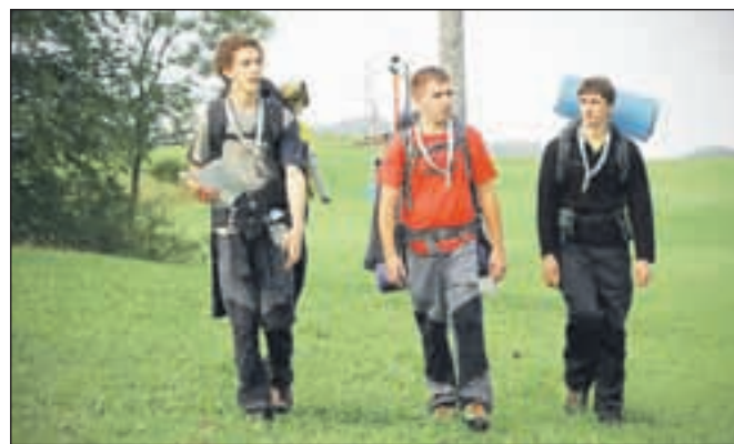
25 km dolg orientacijski pohod je bil za nekatere ekipe manj, za druge bolj zahteven podvig.

»Veseli in zadovoljni smo nad veliko udeležbo in vre-