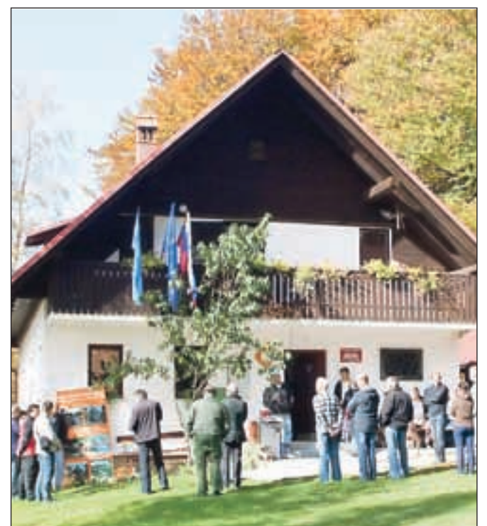
Sovodenjski planinci se lahko pohvalijo z novo čistilno napravo ob domu na Ermanovcu.