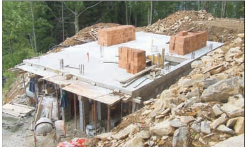
Gradnja novega planinskega zatočišča na Mrzliku poteka v skladu s terminskim planom.

Projektantske ocene so pokazale, da bo gradnja stala okoli 150 tisoč evrov, vendar imajo planinci na voljo približno devetdeset tisoč evrov. »Trdno smo prepričani, da bo to dovolj,« pravi Kosmač in doda, da kapital imajo, denarja zaenkrat še ne. Razložimo. V