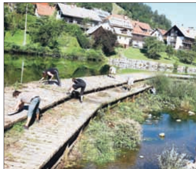
Puštalci in drugi Ločani na delovni akciji prvo septembrsko soboto