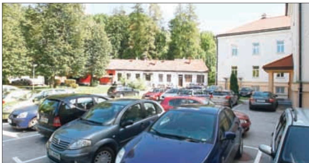
Območje vzhodnega dela nekdanje vojašnice bo namenjeno vrtcu in drugim družbenim dejavnostim.

»Vodilo k odločitvi, da OPPN damo sedaj v razpravo, je dejstvo, da Škofja Loka potrebuje vrtec,« je povedala vodja oddelka za okolje in prostor na občini Škofja Loka Tatjana Bernik . »Območje nekdanje vojašnice je razdeljeno na dva načrta. Za zahodni del je OPPN že sprejet, namenjen pa je gradnji doma za starejše, varovanih stanovanj in stanovanj za prosti trg ter ureditvi osrednjega mestnega parka. Območje vzhodnega dela vojašnice, ki je predmet sedanje javne razgrnitve, pa je namenjeno gradnji objektov za družbene dejavnosti. Lastništvo zemljišč na