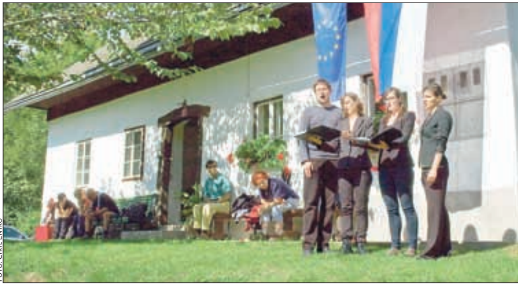
Vokalna skupina Gallina je nastopila s slovensko pesmijo ob zaključku pohoda.