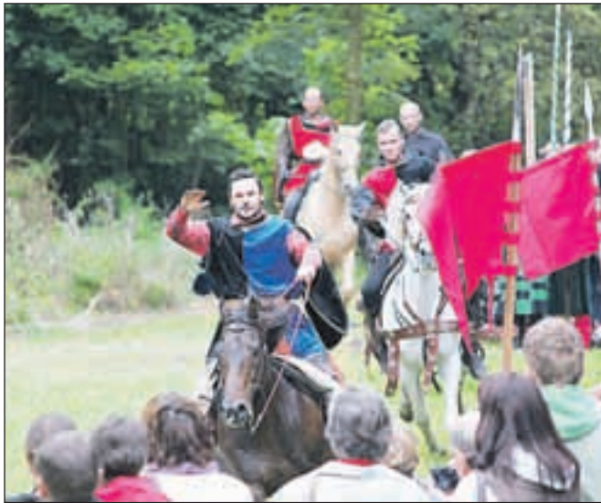
Viteške igre v pobratenem Taboru