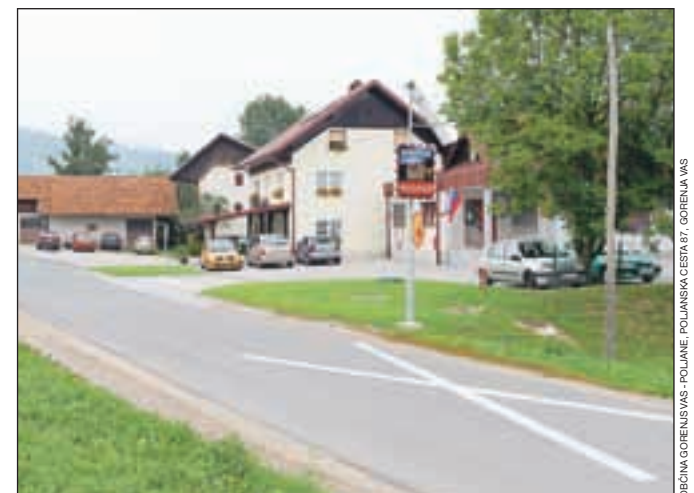
Le malokdo upošteva omejitev hitrosti pri vrtcu na Dobravi.