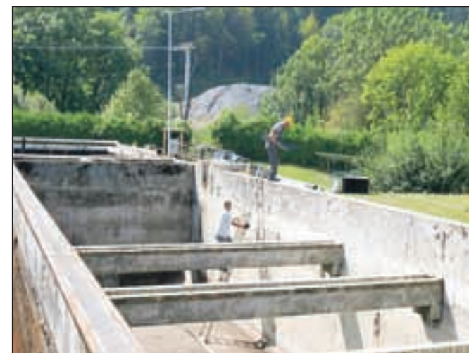
Pripravljala dela na čistilni napravi na Suhi so se začela že poleti.