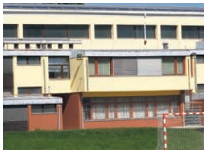
V šoli Ivana Groharja bo odslej poleti hladno, pozimi pa toplo.

Škofja Loka – Na severnem delu (razen telovadnice) so zamenjali okna, del dotrajane pločevinaste strehe in naredili novo izolacijsko fasado. Vrednost celotne investicije je znašala okrog 60 tisoč evrov. Strokovnjaki iz podjetja Knauf Insulation pa so v tem času s sodobno (kontaktno) fasado izvedli tudi izolacijo šolske knjižnice v prvem nadstropju in računalniške učilnice (pritličje) ter spremljajočega hodnika na južni strani šolske stavbe. Obe etapni energetska sanaciji sta bili izvedeni v sklopu širše okoljsko-ekološke akcije Loško je ekološko, s katero želijo v občini poleg ugodnejših bivalnih in učnih pogojev zagotoviti izboljšano energetska učinkovitost javnih