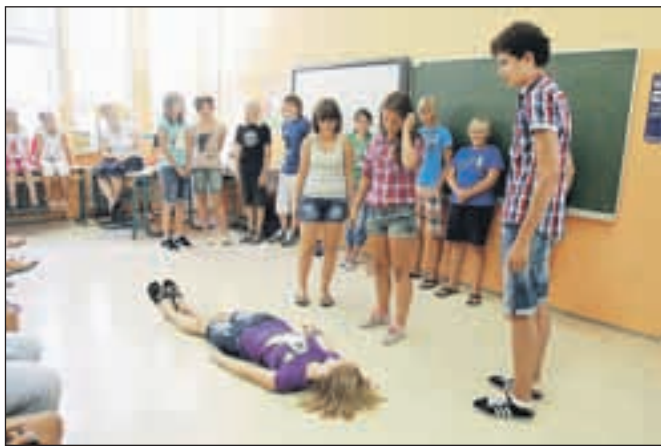
Skeč na končni prireditvi Angleščina v akciji