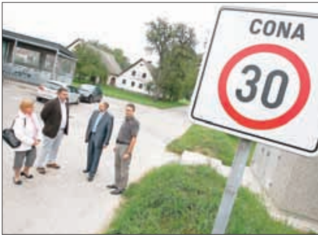
Cona 30 v delu Godešiča med regionalno cesto in železnico

la učinkovitost izvedbe novega ukrepa, rezultati pa bodo podlaga za morebitne nadaljnje aktivnosti pri zagotavljanju umirjanja prometa v strnjem delu naselja. Sicer pa je bilo ob tednu mobilnosti še nekaj akcij, od možnosti brezplačnega prevoza z mestnimi avtobusi v soboto ob svetovnem dnevu brez avtomobila do promocije kolesarjenja, ki vključuje tudi uporabo električnih koles. Aktivni so tudi pri vzpostavljanju kolesarskih poti po občini in povezavi s sosednjimi občinami, poleg tega pa je bilo letos več ukrepov namenjenih urejanju mirujočega prometa in novemu parkirnemu režimu v mestu in okolici.