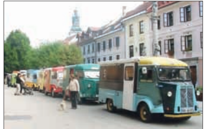
Stari avtomobili med še starejšimi hišami škofjeloškega Placa.