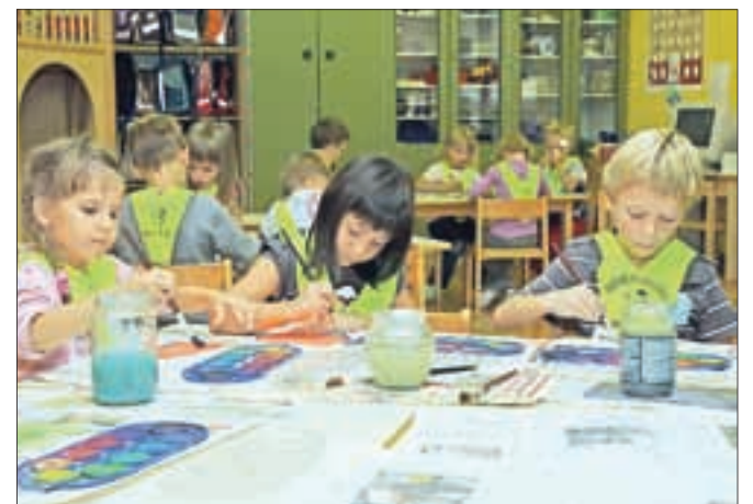
V žirovski osnovni šoli je letos 69 prvošolčkov v treh razredih.

tako malčkom kot njihovim staršem položil na srce, da naj bodo previdni na poti v šolo. Prvošolčkom so podelili rumene rutke za varnejšo pot. Žakelj je najmlajšim v šoli želel tudi, da bi našli nove prijatelje, skupaj naj bodo ustvarjalni in raziskujejo svet z odprtimi očmi: »Izobrazba ni pomembna le za vas, ampak tudi za naše kraje. Pridobite znanje in ga s pridom izkoristite.« V Žireh sta letos polna tudi oba vrtca, zato bodo novembra odprli nov oddelek v vrtcu pri osnovni šoli. »Na ta način