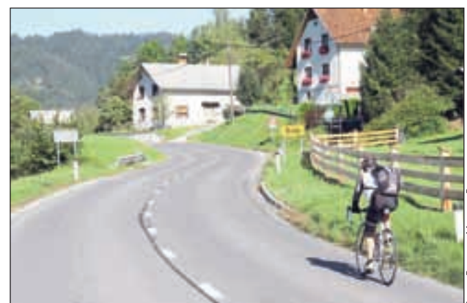
Kolesarji bodo v Žireh varnejši v prometu.