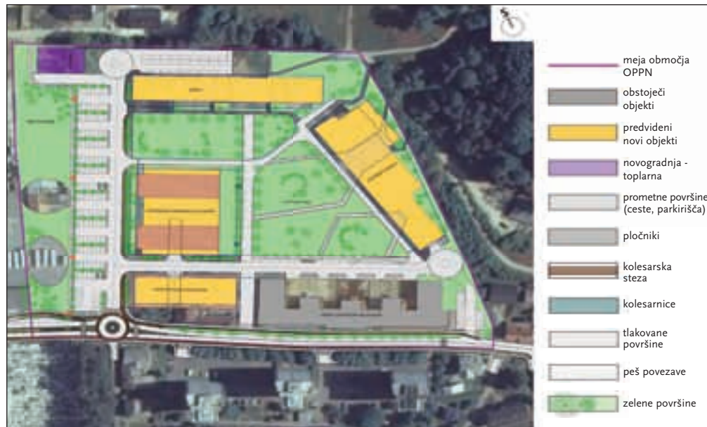
Skica občinskega podrobnega prostorskega načrta za vzhodni del nekdanje vojašnice v Škofji Loki

Kakšen je postopek v nadaljevanju? Ko se bo končala javna razgrnitev, bodo zbrali pripombe in se do njih opredelili in jih, če bodo utemeljene, vnesli v dokument. Nato bo izdelan predlog OPPN. Pridobili bodo mnenja nosilcev urejanja prostora, pripravili usklajen predlog, ga znova obravnavali na občinskem svetu in naposled sprejeti dokument kot odlok objavili v uradnem listu.