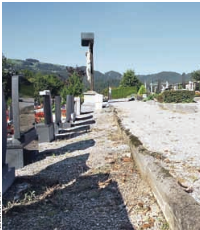
Pogrebne storitve odslej največkrat opravljata za to usposobljeni podjetji, pokopališče pa naj bi postalo bolj urejeno.

Na Občini Žiri so se v želji po boljši urejenosti domačega pokopališča in tudi pogrebne službe odločili za spremembo opravljanja pogrebnih storitev. Sprememba je v veljavi že od 1. julija, kateremu izvajalcu pogrebnih storitev (Hipnos, Akris, ...) bodo zaupali koncesijo za upravljanje pokopališča, pa zaenkrat še ni znano. Zato pa pričakujejo, da bo pokopališče odslej bolj čisto, svojci pokojnika pa lahko že sedaj pokličejo enega od izvajalcev, ki uredi vse. B. B.