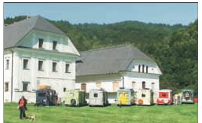
Takole so »pujsi« svoje zadke na ogled postavili pred Tavčarjev dvorec na Visokem.