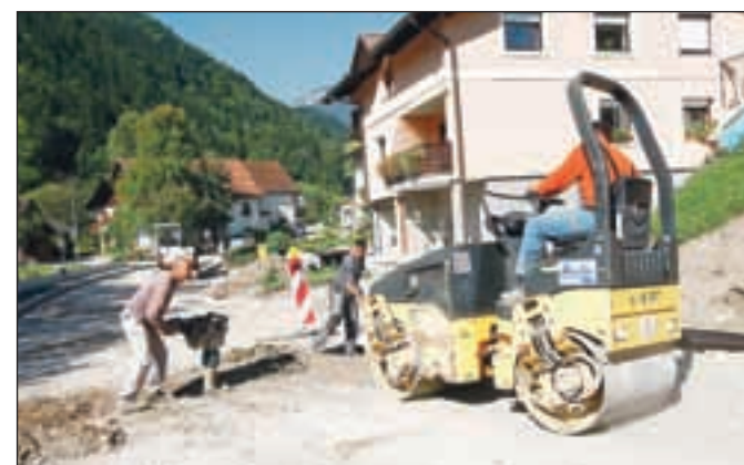
Gradnja pločnika proti Dašnici se je zavlekla v september.

Od naselij Log in Na Kresu je proti Dašnici poleti potekala gradnja pločnika, namenjena varnejši poti v šolo. Kot so povedali na občini, so pričakovali, da bodo dela dokončali do začetka šolskega leta, a so se zavlekla. Tako so otroci septembra za pot v šolo uporabljali drugo pot. Na občini so staršem svetovali, naj otroke usmerijo po poti mimo Mercatorja na pločnik, čez prehod za pešce pri plavalnem bazenu, nato pa čez novo zgrajeni prehod za pešce pri tovarni Niko. D.Ž.