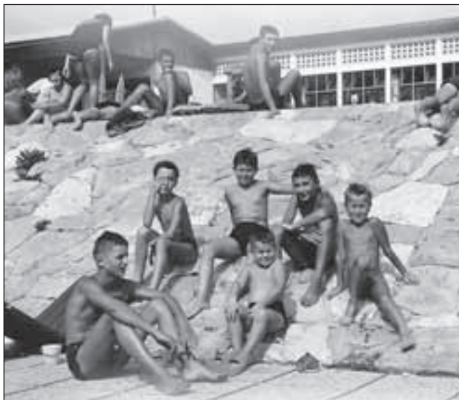
Takole so otroci na puštalskem kopaljšču uživali pred pol stoletja.

daj čakamo na študijo protipoplavnih ukrepov. Nanjo bomo dali pripombe in potem bomo videli, kako lahko uredimo to območje, kjer si želimo, da bi bilo spet osrednje loško kopaljšče, namenjeno tudi drugim vrstam rekreacije, morda tam uredimo tudi parkirišče za avto dome.« Tudi Tatjana Bernik , vodja občinskega oddelka za okolje in prostor, pravi, da se bodo z lastnikom skušali uskladiti, da to območje postane prostor druženja in rekreacije. Pričakuje, da bo lahko zaživelo že prihodnje leto, vsaj s pridobitvijo statusa kopalnih voda. Nad tem prostorom, ki ga je treba najprej urediti tako, da bo poplavno varen, bodo v prihodnje še posebej skrbno belili, napoveduje Bernikova.