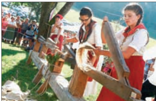
Prikaz predelave lanu je potekal v okolici kmetije Pr'Vrhovc, obiskovalci pa so lahko izvedeli tudi marsikaj o zanimivih običajih, ki so spremljali nekoč pomembno gospodarsko dejavnost.