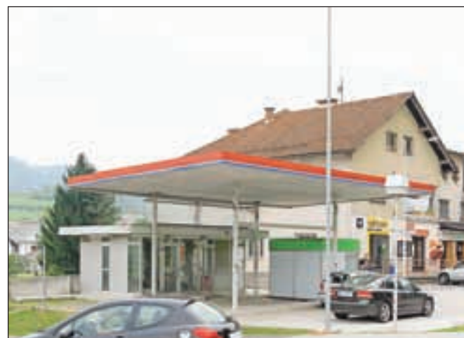
Na spremembe ob nekdanjem bencinskem servisu bo treba počakati še najmanj leto dni.

Na območju nekdanjega bencinskega servisa bo več prostora za parkiranje, druga pa bo razen tega celostno uredila okolico stavbe. Kdaj bo zadruge zagrizla v približno milijon evrov visoko investicijo, Vodnov danes še ne zna odgovoriti: »V časih, ko gospodarska kriza še