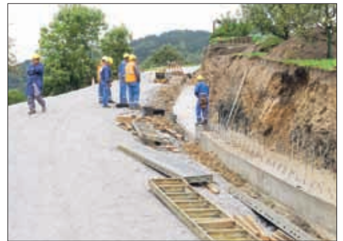
Gradnja vodovoda in kanalizacijskega sistema v vaseh pod Starim vrhom je zaključena, dela na cesti pa bodo potekala vsaj še mesec dni.