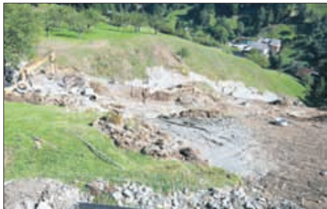
Plaz na Kuclju neukročen že pol stoletja

»Že več kot trideset let mineva, odkar se je plaz nad domačijo pri Bobkovi prvič sprožil in prav sedaj poteka temeljita sanacija,« je novembra leta 1993 poročal Gorenjski glas. Plaz je do takrat grozil že štirikrat, prvič leta 1961, zadnjič pred omenjenim zapisom prav na dan volitev leta 1992. Od takrat je minilo že dvajset let, vmes so Železniki doživeli katastrofalne poplave leta 2007, nato še leta 2009. Sedaj v okviru sanacije treh plazov z decembra 2009 urejajo tudi tega na Kuclju. Država za sanacijo plazov tokrat namenja 300 tisoč evrov, občina pa je za ureditev plazov nad Bobkovo domačijo dodala še 40 tisočakov iz svojega proračuna. D. Ž.