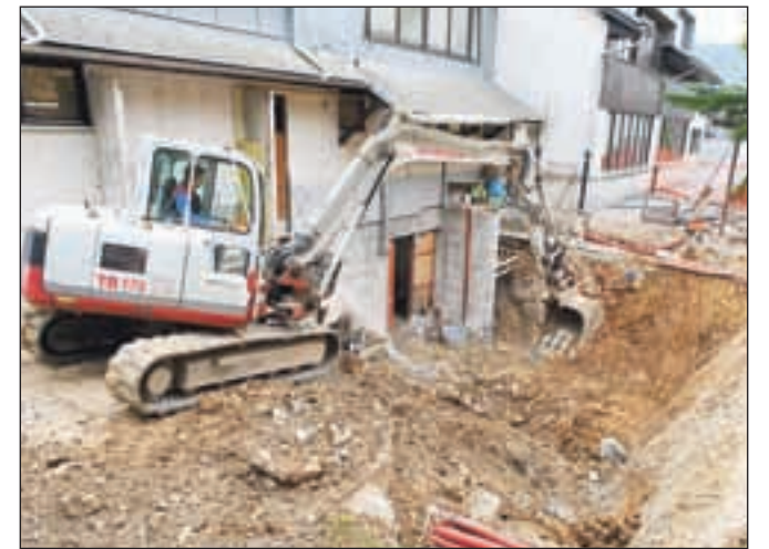
Gradnja zalagovnika za sekance pri Osnovni šoli Poljane je v polnem zamahu.

Izvajalec napoveduje, da bodo dela zaključena do konca leta. Vrednost celotne investicije je sprva ocenjena na skoraj 540 tisoč evrov, na občini pa pričakujejo nekoliko nižjo realizacijo.