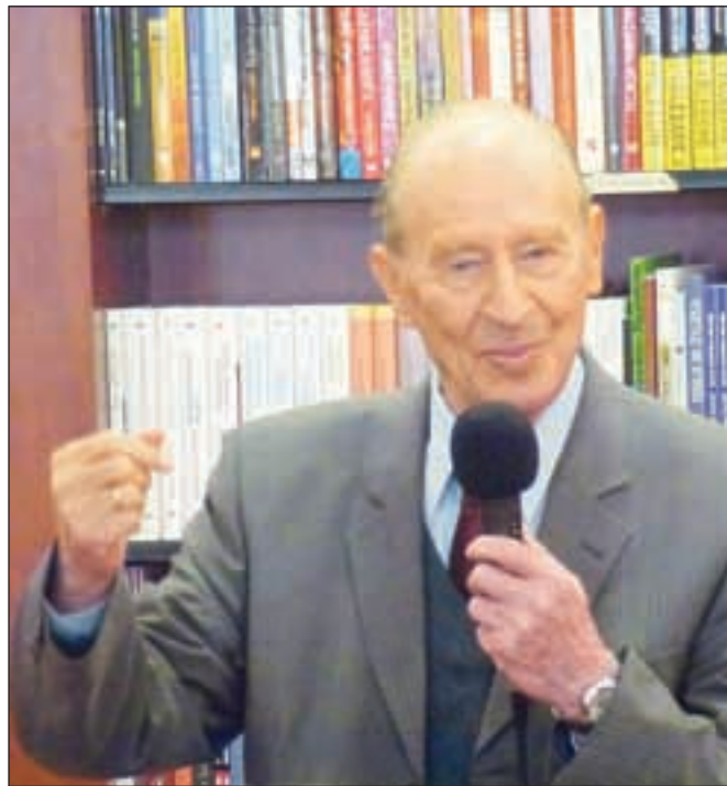
Akademik Zorko Simčič

tudi pot, ki po severnem pobočju vodi na grad. Sicer pa bodo ob tej priložnosti v mlinu na grajskem vrtu prikazali manjkajoče dele mlinске naprave in žita, ki so jih nekdanj mleli v njem.