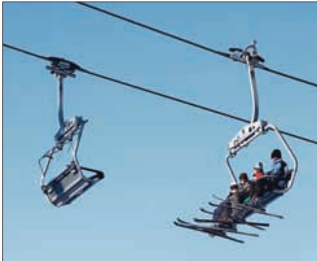
Smučišče Stari vrh je znova na razpotju, a lastniki upajo na pozitiven dogovor z lizingodajalcem. Pozimi je Stari vrh obiskalo 55 tisoč smučarjev.

Prepričana sta, da bi se vlaganja v razširitev ponudbe na podlagi praks iz Avstrije, Italije, Francije in Švice, multiplikativno povrnila v celotno regijo. »Smučišče je tako znova na razpotju, ali ga podpreti in razviti ponudbo ali sprejeti odločitev, da ga ne potrebujemo in podpreti druge, organizacijsko, marketinško in logistično