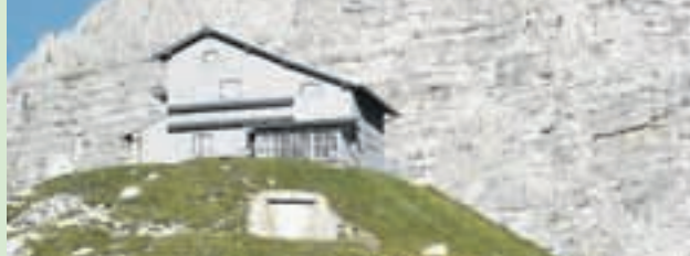
Pogačnikov dom na Kriških podih, 2050 m

Tel.: 051/221 319. Odprt od konca junija do konca septembra. Stoji na vzpetini Griva nad trentarsko dolino Zadnjico. Obdaja ga veriga dvatisočakov. V bližnji soseščini so štiri ledeniška jezera. Vsekakor je Pogačnikov dom cilj, za katerega se spleča vzeti več dni. Potem v kratkem času lahko osvojite več visokih vrhov, med katerimi kraljujeta Razor in nekoliko bolj oddaljena Škrlatica, ali pa si privoščite krajše sprehode do jezer in okoli njih. Mogoče boste srečali svizca ali kozoroga. Mlado osebje v domu vas bo prijazno postreglo s pristno planinsko prehrano. Če želite doživeti pravo visokogorsko vzdušje, potem morate obiskati Pogačnikov dom.