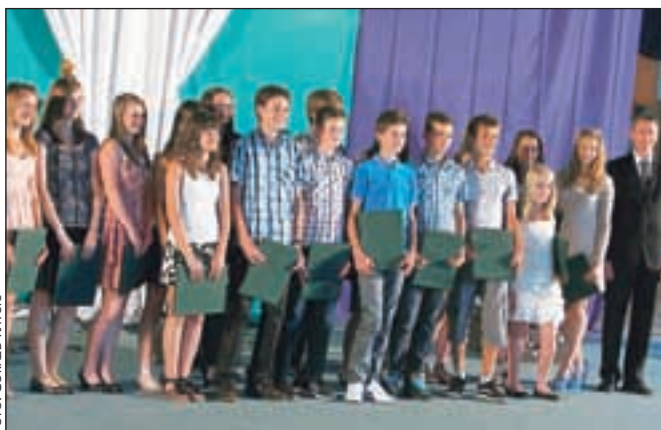
Čestitke najboljšim učencem, učenkam in dijakin