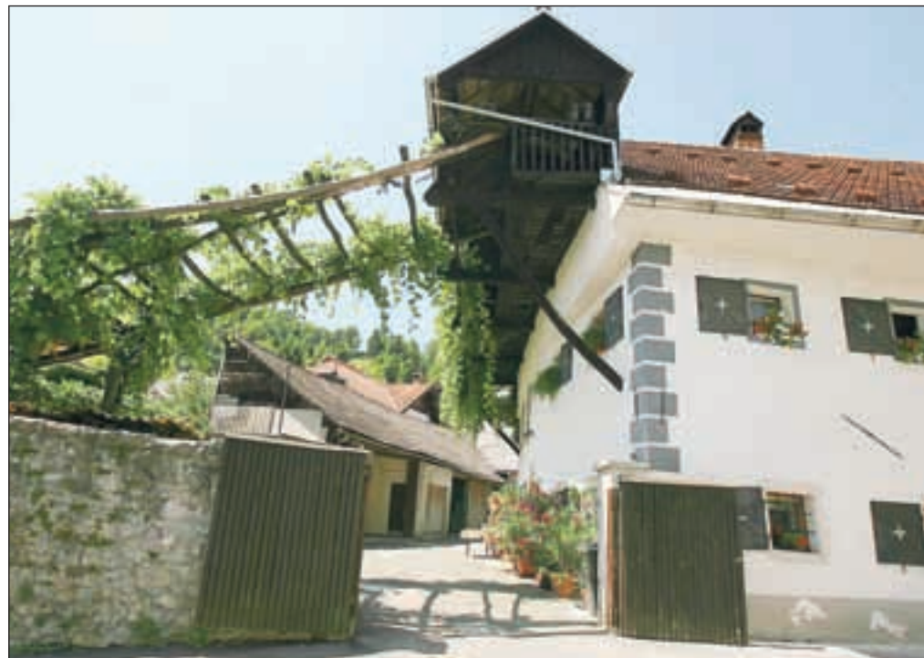
Firbarjeva hiša

Na drugi strani Sore je še nekaj zanimivih hiš: Bernikova in Poličarjeva (slednja ima označbo, do kod je v veliki poplavi leta 1926 segala voda) in značilna Nacetova hiša, ki izvira iz 16. stoletja, baročno podoba pa je dobila leta 1755 in jo obnovljeno radi pokažejo turistom. Pot pelje mimo puštalskega gradu s prav tako zanimivo zgodovino, nato pa se obiskovalci podajo proti Hribcu, kjer stoji cerkva sv. Križa in od koder je lep razgled na prehojeno tematsko pot in na Loko.