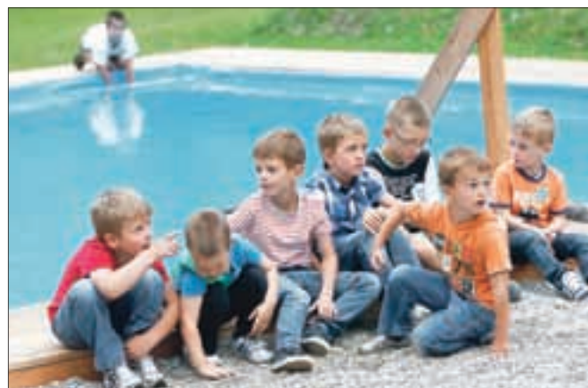
Leta 2005 je Občina Gorenja vas - Poljane plačala prve vrtine, ki so pokazale možnost izkoriščanja zdravilne in tople vode pr' Topličarju. Otroci so navdušeni v in ob bazenu.