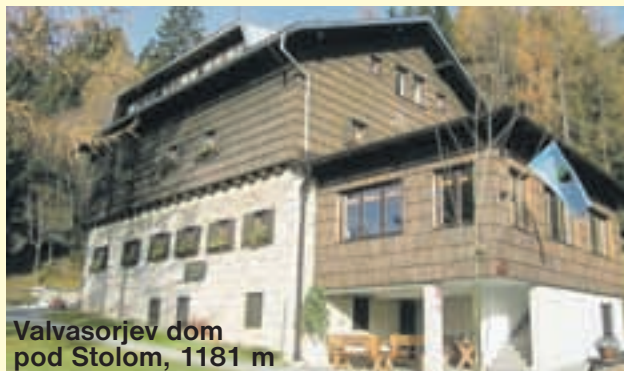
Valvasorjev dom pod Stolom, 1181 m

Tel.: 051/323 402. Odprt od konca junija do konca septembra in vse konce tednov in praznike v letu. Stoji na jasi na zahodnem delu Begunjsčice. Najbližji dostop iz Begunj po dolini Drage do Poljske planine po gozdni cesti z avtom. Od tu je še dobro uro hoje Roblekovega doma. Možnost dostopa tudi iz Završnice, Zelenice ali preko planine Preval. Eden najlepših razgledov v Karavankah od Trbiža do Snežnika. Prijazen oskrbniški par vas vabi in pričakuje. Postreženi boste s pristinimi domačimi jedmi. Do vrha Begunjsčice vas čaka le ura prijetne hoje.