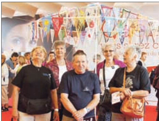
Cvetke na letošnjem mednarodnem klekljarskem kongresu v Caenu

»Žal so organizatorji letošnji kongres postavili za naš okus preveč komercialno in če primerjam s kongresom, ki je bil pred štirimi leti v Grenobleu tudi slabše,« pove Žakljeva. Na mednarodnem kongresu so se sicer predstavljale čipke in materiala ter ostala oprema za klekljanje iz vsega sveta. Žirovce pa so navdušila obla-