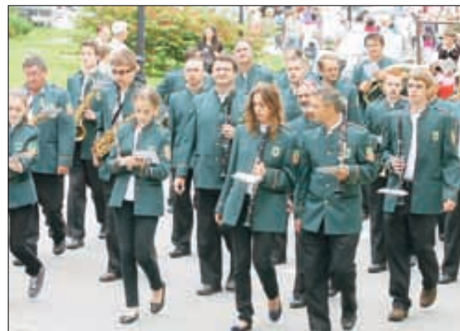
Pihalni orkester iz hrvaške Lepoglave je sedaj pobraten z orkestrom Alpes Železniki.