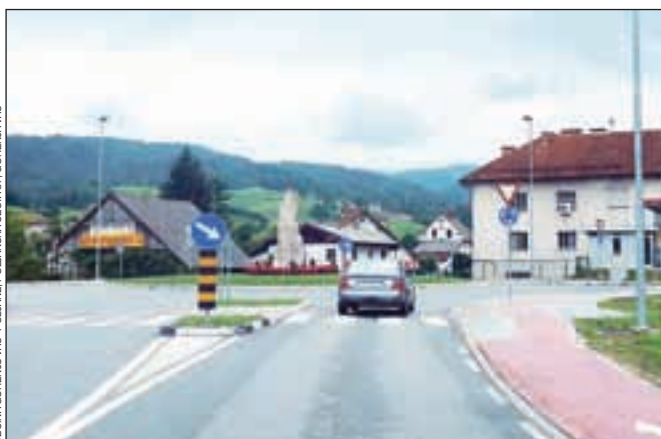
Krožišče v Gorenji vasi bi lahko začeli graditi čez leto dni.