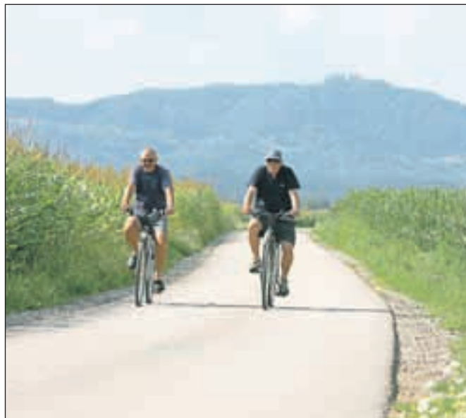
Loški kolesarski krog pelje iz Škofje Loke skozi okoliške vasi, zelene dobrave in čez Sorško polje.

kate regionalno cesto in se na levo podate na Sorško polje. Na cesti z mostičkom zavijete levo na Sorško polje, prečkate železniško progo in se držite leve v smeri Trate. Na križišču zavijete levo, se po makadamski cesti peljete do gozdne jase, zavijete desno k Lovski koči, od tam pa vas pot pelje po gozdni cesti v smeri Godešiča. Ko pripeljete do glavne ceste, jo prečkate in se skozi vas mimo cerkve sv. Miklavža spustite skozi gozd mimo športnega igrišča do mostu čez reko Soro. Prečkate most, nato zavijete desno in se skozi Pungert, Hosto in Puštal pripeljete v Škofjo Loko. Prečkate most čez Soro in se skozi Spodnji trg po klančku pripeljete do Turizma Loka ter tako zašpilito »klobaso« Loškega kolesarskega kroga.