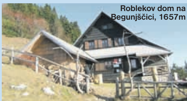
Roblekov dom na Begunjsčici, 1657 m

Gorenjska cesta 26, 4240 RADOVLJICA Tel./fax: 04 531 55 44 E-pošta: info@pdradovljica.si