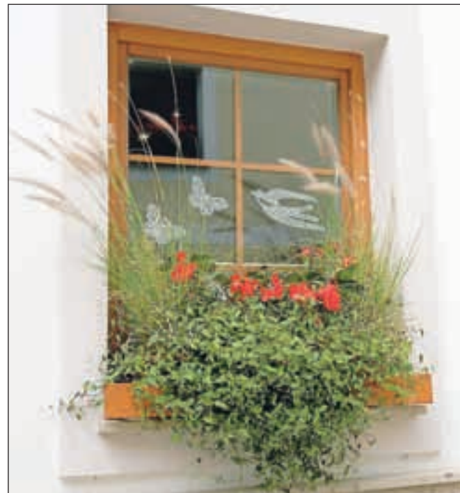
Čipke na oknih hiš v Železnikih