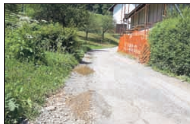
Močno načeta cesta skozi Crngrob

grobu, pozimi pa je oteženo vzdrževanje. Urejeno bo tudi odvodnjavanje in vgrajena nova napeljava za javno razsvetljavo. Manjši del, 4208 evrov (od siceršnje vrednosti 28.414 evrov) pa bo šlo za investicijsko vzdrževalna dela na OŠ Cvetka Golarja. Občina Škofja Loka bo letos iz kvote sredstev za razvoj občin od države pridobila tudi zadnje izplačilo namenskih sredstev za ureditev parkirišča Nunski vrt v višini 112.835 evrov. Lani je za ureditev parkirišča od skupnega sofinancerskega deleža države v višini 417.139 evrov pridobila že 304.304 evrov. Občina Ško-