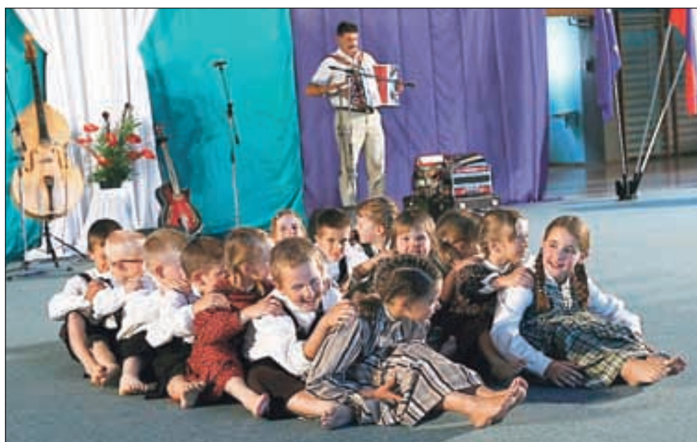
Na občinskem praznovanju je nastopilo več folklornih skupin, najprisrčnejše so bile otroške.