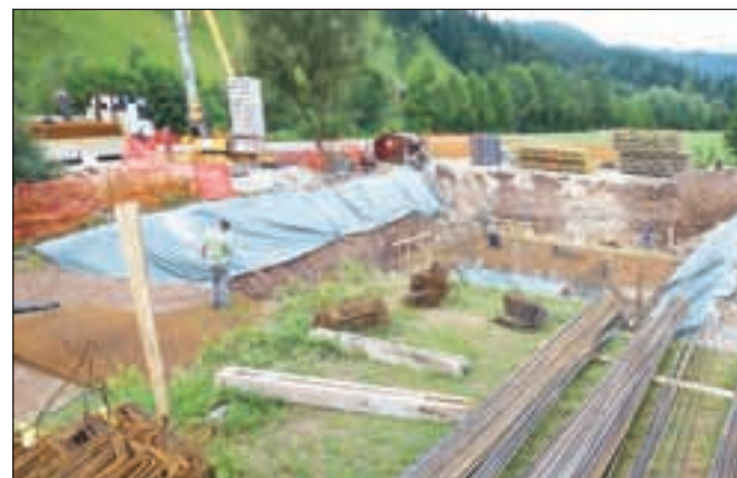
Gradnja čistilne naprave naj bi bila dokončana do konca leta, sledi leto poskusnega obratovanja.

Cilj rekonstrukcije je čista, kopanju primerna Poljanska Sora. »Ob sedanjih merjenjih bioloških parametrov smo vedno na meji, po povečanju zmogljivosti in zamenjavi tehnologije pa bo voda bolj čista,« pove Poljanšek. Sedanja, tride-