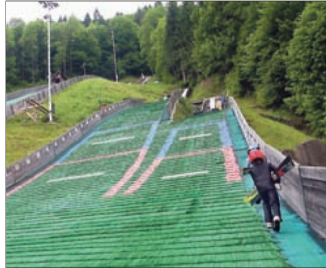
Mladi skakalci SSK Alpina Žiri pridno trenirajo tako na snegu kot na plastični masi, tako podnevi kot zvečer.

Tako so minuli konec tedna organizirali nočno tekmo za pokal Alpine na veliki skakalnici, prišli so tudi najboljši slovenski skakalci in skalkke. Klub ima v načrtu tudi ureditev zasneževalnega sistema z novo strojnico in gradnjo klubskega objekta. Smučarji skakalci upajo, da jim bo ob sodelovanju širše skupnosti in sponzorjev ter klubskih delavcev to tudi uspelo.