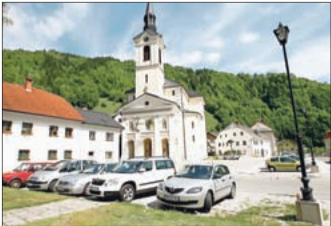
Trg pred cerkvijo sv. Antona naj bi jeseni zasijal v novi podobi.