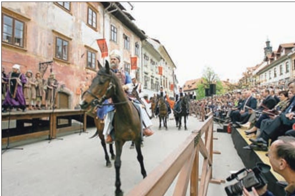
Z uprizoritve Škofjeloškega pasijona v postno-velikonočnem času leta 2009

Odlok je potreben, da bi s pasijonom marca prihodnje leto lahko kandidirali za vpis na Unescov seznam nesnovne kulturne dediščine, saj mora biti pred uvrstitvijo na Unescov reprezentativni seznam najprej ustrezno priznan na državnih ravni. Škofjeloški pasijon, edino ohranjeno dramsko besedilo v slovenskem jeziku avtorja Romualda Marušiča iz začetka 18. stoletja, ki ga v Škofji Loki tudi v živo uprizarjajo (nazadnje leta 2009, prihodnja uprizoritev bo leta 2015), naj se kot živa mojstrovina razglaši z namenom, da se zagotovita njena javna dostopnost in prenašanje iz roda v rod.