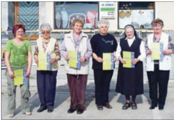
Letošnje zmagovalke klekljarskega tekmovanja