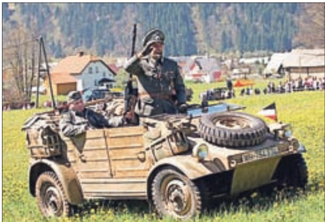
Vojaški spektakel je pritegnil kar okoli pet tisoč obiskovalcev.