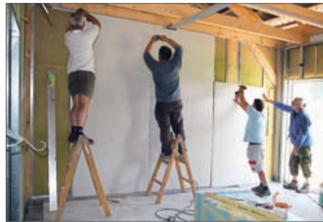
Garderobe ob nogometnem igrišču bodo nared do občinskega praznika, zato ovir za otvoritveno tekmo z dobrodelnim namenom ni več.