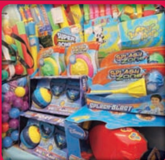
Za otroke smo na sezonskem oddelku pripravili pestro izbiro poletnih igračk, vodne igre, napihljivi program.