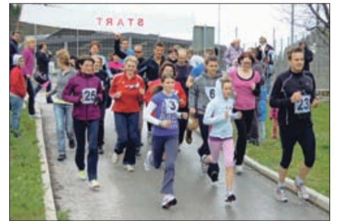
Skupaj se je dobrodelnega teka udeležilo 74 tekačev, kar je glede na slabo vreme, lep rezultat.

»Dan prostovoljstva, ki je po naključju sovpadal z našim tekom, smo povezali z dobrodelnostjo. To za večino malčkov pomeni, da si stvari delijo, si pomagajo in sodelujejo,« je zadovoljna vzgojiteljica in doda, da so pripravili tudi tržnico otroških oblačil. Razen vzgoje dobrodelnosti so udeleženci poskrbeli tudi za dobro počutje. Najmlajši (do treh let) so tekli na 60-metrski progi, tri- in štiriletniki na 150 metrov, pet- in šestletniki pa na tristometrski progi. Osnovnošolci in odrasli so tekli kros okoli vasi Dobje, mlajši enega (1400 metrov), starejši pa dva kroga.