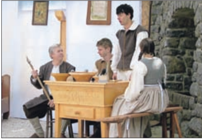
Pot in igra v Zali sta letos privabila okoli dvesto pohodnikov.