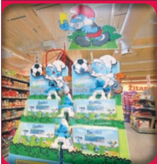
Smrkastično nogometno prvenstvo 2012, samo v Mercatorju, aktivnost poteka od 3. 5. do 27. 6.

Delovni čas od ponedeljka do sobote od 8.00 do 21.00 ure, nedelje od 8.00 do 13.00 ure.