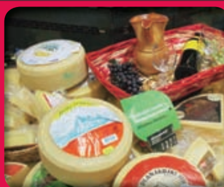
Na delikatesnem oddelku imamo pestro izbiro sirov in mesnin naših lokalnih pridelovalcev in kmetij.