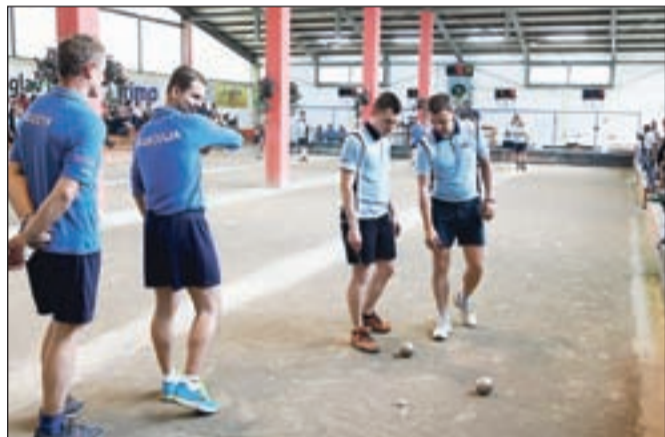
Slovenski državni balinarski prvaki so na svojem igrišču na Trati dokazali, da se lahko merijo z nekdanjimi evropskimi šampioni, žal pa jim je sreča obrnila hrbet v dodatni igri na povratni tekmi v Buzetu.

V polfinale so se poleg balinarjev Buzeta uvrstile še ekipe italijanskih klubov Pontese in BRB Ivrea ter francoski Saint Vulbas.