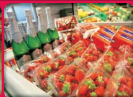
Vabimo vas na oddelke sadja in zelenjave, kjer imamo vedno svežo, bogato ponudbo.