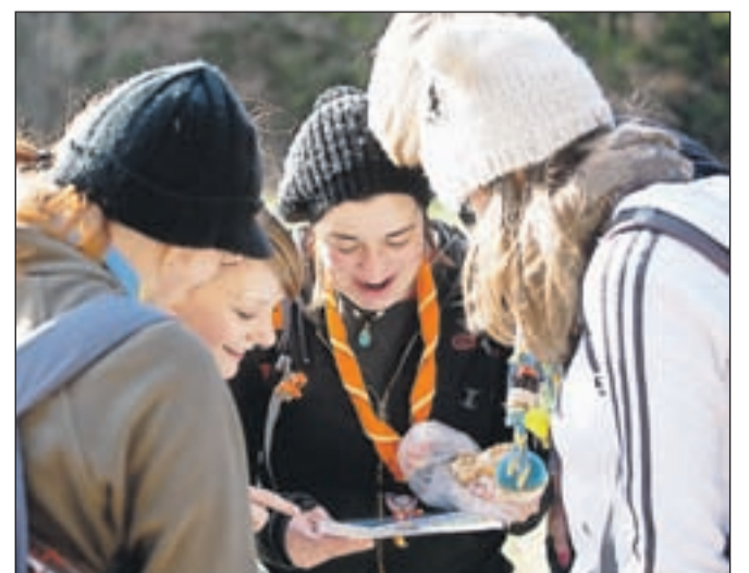
Na letošnjem Glasu svobodne Jelovice so Bouhe & Co, Rod zelene sreče (Železniki) osvojile 2. mesto v kategoriji popotnice.