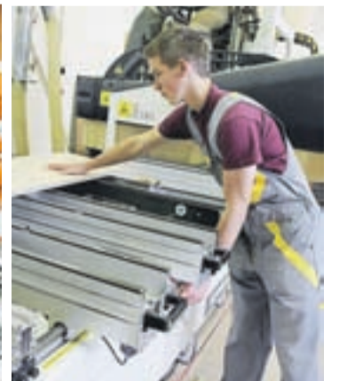
V Srednji šoli za lesarstvo dijaki uporabljajo najsodobnejše CNC stroje.

Šolski center Škofja Loka vabi na informativne dneve, ki bodo v petek, 10., in soboto, 11. februarja: