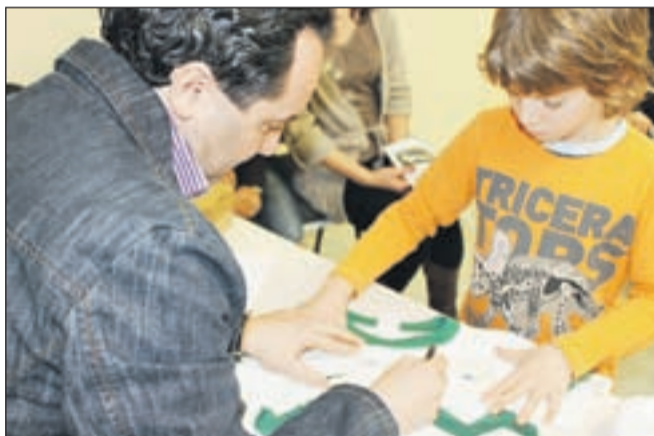
Selektor Slaviša Stojanović je mlademu žirovskemu navdušencu podpisal reprezentacijski dres.

prireditev je bila vse do izpeljave nekoliko skrivnostna, saj organizatorji niso želeli izdati posebnega gosta. Žiri, šolo in goste je obiskal slovenski nogometni selektor Slaviša Stojanović in poskrbel za veliko presenečenje in s svojo sproščenostjo navdušil mlade iz vseh držav. "Celoten teden smo skušali izpeljati z motom projekta, kar pomeni, da smo vedno ponudili zgolj zdrava kosila in vse ogledale ali dejavnosti začinjili s fizično aktivnostjo. Nekaj je bilo športa, veliko smo tudi hodili," pravi koordinatorka projekta. Meni,