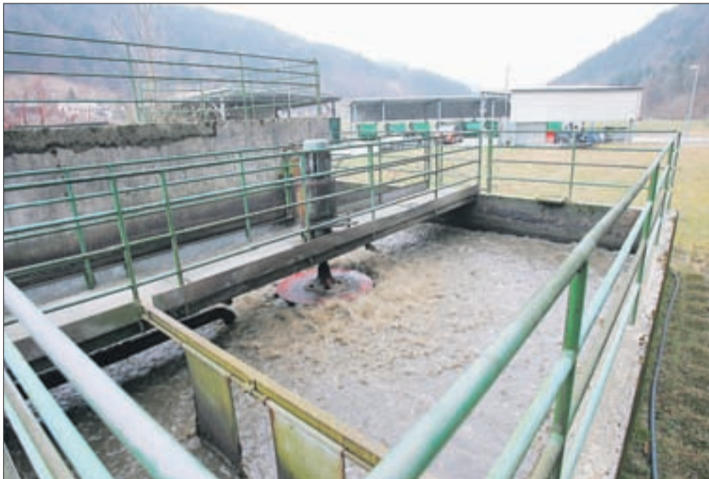
Čistilno napravo v Železnikih bodo začeli posodabljati letošnjo jesen.

Polovico vrednosti celotnega projekta je vredna naložba v največji, škofjeloški občini. "Gre za 13,5 milijona evrov, če pa ji prištejemo še vrednost sekundarnih kanalizacijskih vodov, bo investicija dosegla 22 milijonov evrov," je ob predstavitvi poteka projekta dejal župan občine Škofja Loka Miha Ješe. Naložba obsega 13 kilometrov kanalizacijskih vodov, gradnjo čistilne naprave v Retečah in obnovo obstoječe