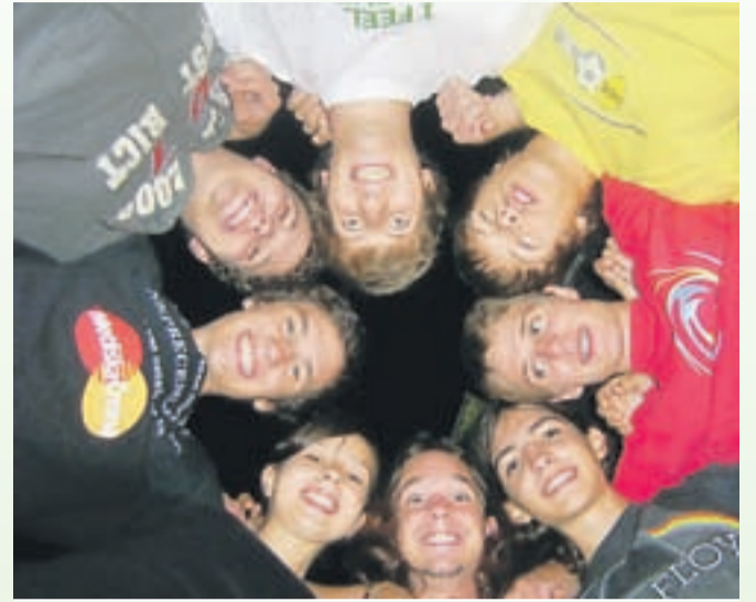
Sproščenost, mednarodne ekskurzije in izmenjave so sinonim Gimnazije Škofja Loka.

Gimnazija ponuja bogat program obveznih in izbirnih vsebin, pa tudi obisk kvalitetnih gledaliških predstav, razstav in koncertov. Vse našete vsebine so združene v programih splošne gimnazije , pri katerih lahko dijaki izbirajo med učenjem francoskega, nemškega in v okviru evropskega oddelka tudi ruskega jezika, in v programu klasične gimnazije , kjer lahko di-