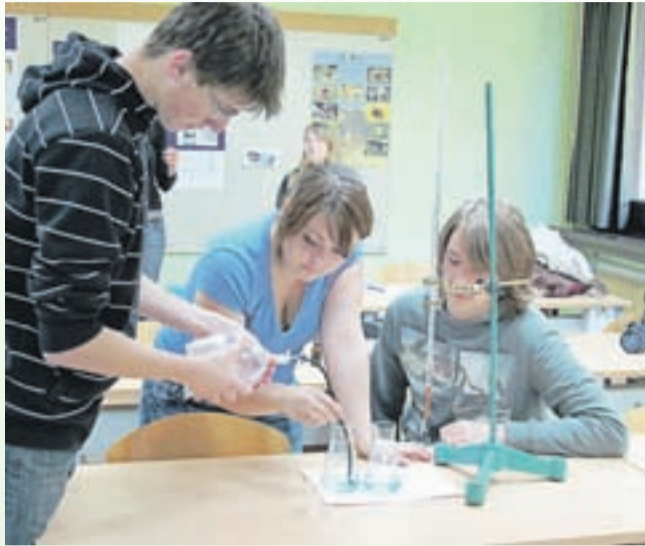
V Gimnaziji Škofja Loka veliko pozornosti, poleg jezikov, namenjajo tudi naravoslovnim vsebinam.