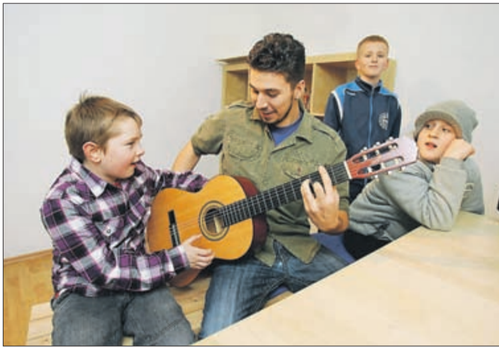
Markova kitara jih je veliko pritegnila v glasbene delavnice.