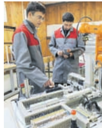
V Srednji šoli za strojništvo se dijaki učijo rokovati tudi z robotom.