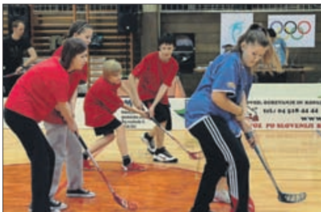
Zimske olimpijske igre so morali izpeljati v dvorani.