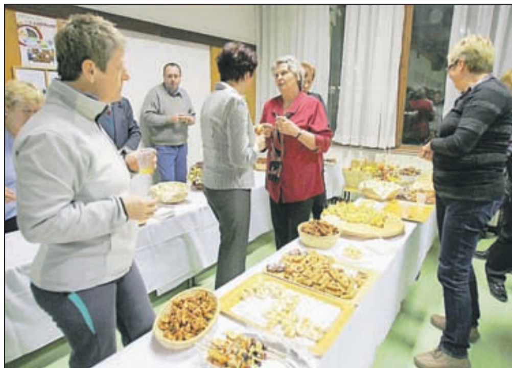
Udeleženci programa Živimo zdravo so postregli z zdravimi prigrizki.