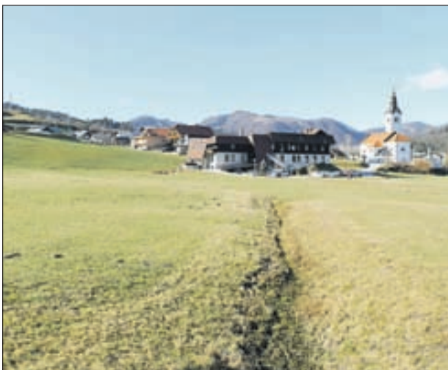
Predvideni dom za starejše v Gorenji vasi bo tudi fizično povezan z zdravstvenim domom.

Najpomembnejša naloga občine v letu 2012 bo pridobitev zemljišč ob zdravstvenem domu (oba domova se bosta stikala), hkrati pa na občini vodijo tudi občinski podrobni prostorski načrt za to območje. Kapaciteta doma v prvi fazi predvideva možnost bivanja 60 oseb, drugo fazo doma pa bi lahko zgradili v Žireh. "Veliki