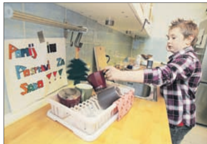
V Bloku veljajo določena pravila, za katera so se dogovorili skupaj z mladimi.