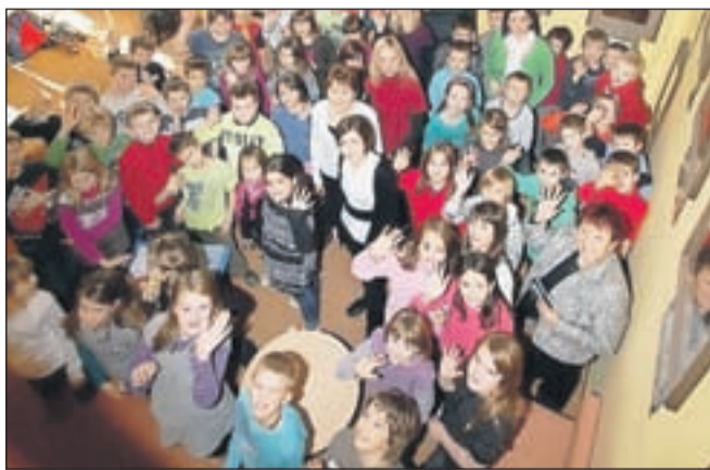
Obisk Alpinine Pepelke v Osnovni šoli Poljane

več kot sto osnovnih šol, v podjetju so prejeli deset tisoč čudovitih risb in likovnih izdelkov v različnih tehnikah, od lepljenk, trganek, koledarja in podobno. Z risbami, donacijami in kratkimi sporočili so zbrali devet tisoč evrov. "Z denarjem bomo pomagali otrokom na oddelku otroške hematologije in onkologije na Pediatrični kliniki v Ljubljani. V kliniki ocenjujejo, da trenutno potrebujejo medicinski aparat sekvenator, ki omogoča hitrejšo in sodobnejše diagnosticiranje raka stih bolezni in je uporaben tudi na drugih področjih," pojasnjujejo v Alpini. Pri-