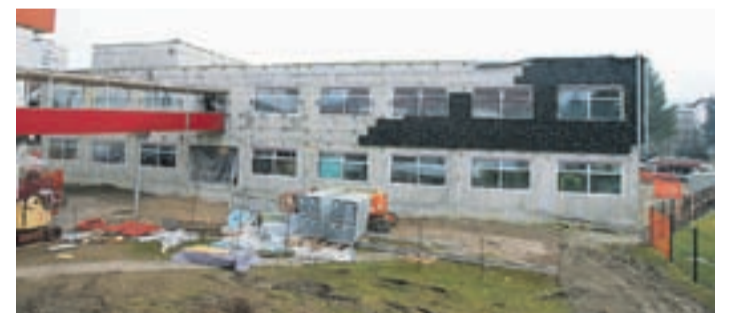
Prihodnji dijaki bodo z novim šolskim letom že lahko uporabljali sodobno opremljene učilnice v novem Medpodjetniško izobraževalnem centru.

S to pomočjo bodo prenovili električno razsvetljava, stavbno pohištvo, ogrevanje in prezračevanje, zunanji ovoj. "Projekt bomo izvedli v tem in prihodnjem letu, kotlovnica na lesno biomaso na Trati bo zgrajena že letos," pravi direktor in nadaljuje o učinkih investicij: "Pričakujemo manjše stroške za energijo in boljši nadzor nad porabo energentov. V MIC-u bomo lahko celo za vsako učilnico spremljali tekočo porabo elektrike, stroške ogrevanja, vode in podobno."