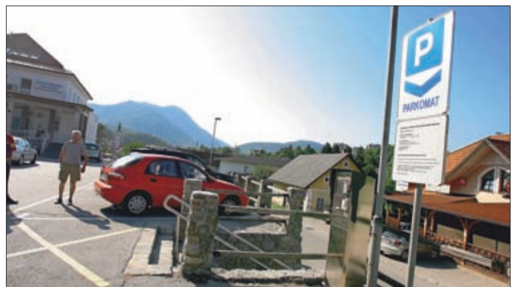
Parkiranje pred zdravstvenim domom bo ob sobotah še naprej brezplačno.

Škofja Loka - Občinski svet v Škofji Loki je že na prejšnji seji določil parkirne površine, na katerih je uvedeno plačilo parkirnine. Od avgusta naprej je parkiranje treba plačati na parkirišču pri zdravstvenem domu, kjer je 51 parkirnih mest. Za prvi dve uri parkiranja enkrat na dan ni treba plačati, za vsake naslednje pol ure pa je parkirnine, ki jo uporabniki plačajo na enem od dveh parkirnih avtomatov, določena na 50 centov. Parkiranje je bilo doslej plačljivo od ponedeljka do petka od 7. do 17. ure, ob sobotah pa do 13. ure. Svetniki v Škofji Loki pa so na septembrski seji sklep spremenili tako, da se bo parkirnine plačevala le od ponedeljka do petka, ob sobotah pa ne, kajti takrat parkirišče ni zasedeno tako kot med tednom. Plačljivo parkiranje v tem časovnem obdobju je bilo prvotno uvedeno zaradi poenotenja časa parkiranja na obeh za sedaj plačljivih parkiriščih v Škofji Loki, se pravi pred uprav-