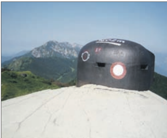
Označeni bunker na Možicu