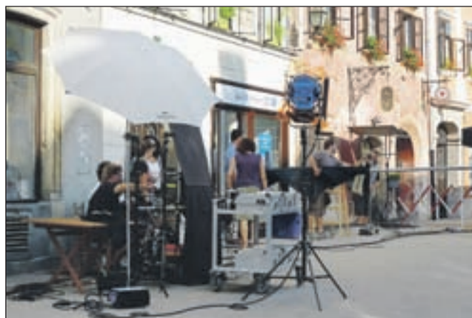
Tisočletno mesto je tudi odlična kulisa, ki je zanimiva za snemalce.

Staro mestno jedro Škofje Loke očitno privlači snemalce. Kot je povedal Jernej Tavčar iz škofjeloške občine v povprečju vsaj dvakrat na leto dobijo prošnjo, ali jim "posodijo" izredno kuliso na Mestnem trgu za snemanje različnih spotov. Tako so tudi konec avgusta mesto zasedli snemalci in igralci, ki so posneli odlomek za reklamo enega od operaterjev za mobilno telefonijo. V. S.