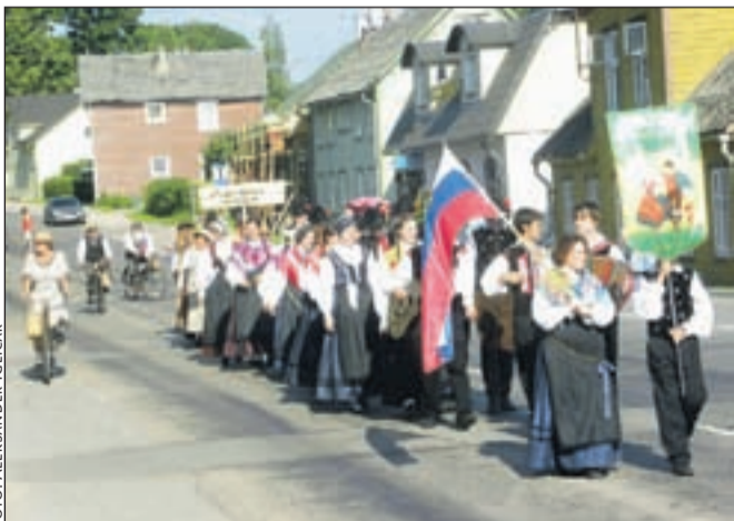
In še en prizor z nasopa na estonskem podeželju