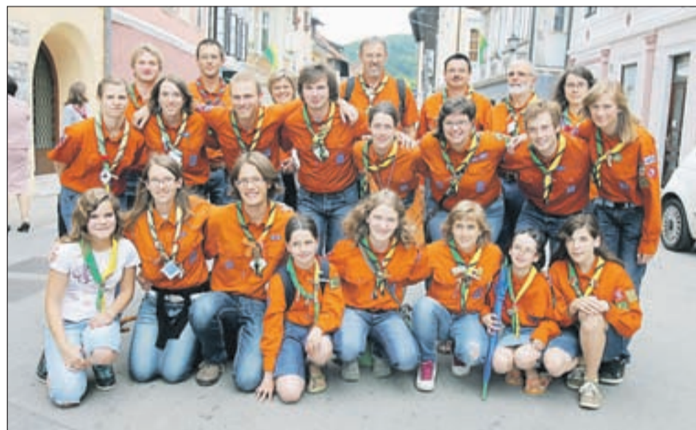
Škofjeloški skavti na dan, ko so prejeli srebrni grb občine Škofja Loka.