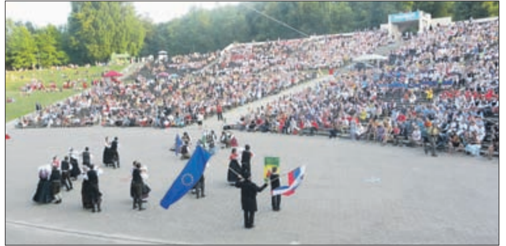
Osrednje prizorišče Europeade v estonskem mestu Tartu