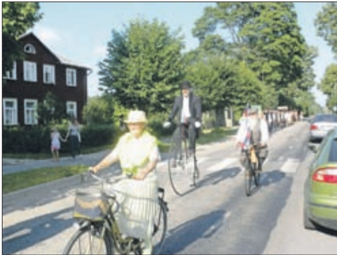
Vseprovod so navduševali starodobni kolesarji iz društva Rovtarji.

Ravno danes popoldne se bodo udeleženci Europeade iz Škofje Loke srečali na pikniku v lovski koči na Sorškem polju, da ob predvajanju posnetkov, plesu in pesmi obudijo spomine na nepozaben poletni dogodek in se zahvalijo sponzorjem.