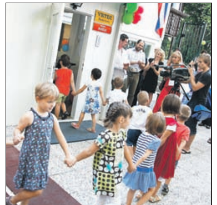
Z odprtja vrta Rožle v Frankovem naselju