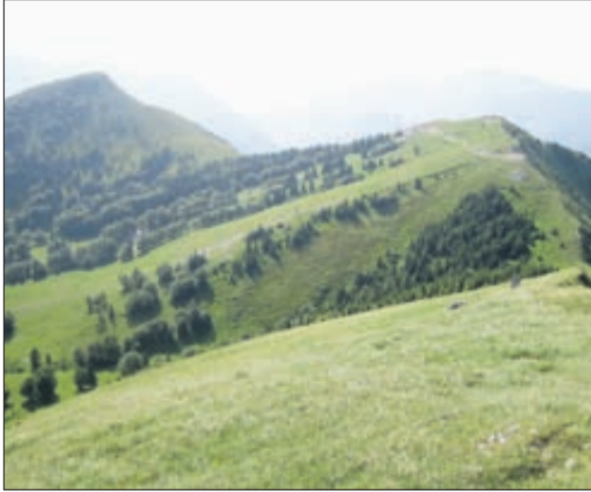
Levo Dravh (1547 m) in desno Lajnar (1549 m)