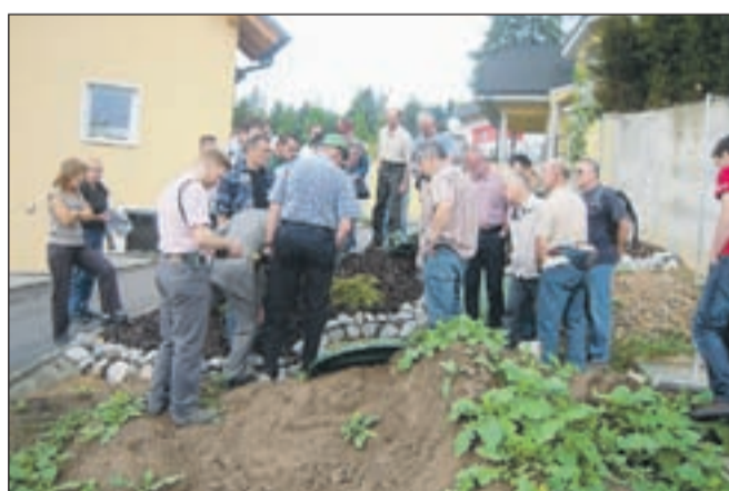
V sklopu projekta so se številni seznanili, zakaj je pomembno uporabljati male komunalne čistilne naprave in tudi, kakšne so primerne - pomembna sta certifikat CE in garancija.