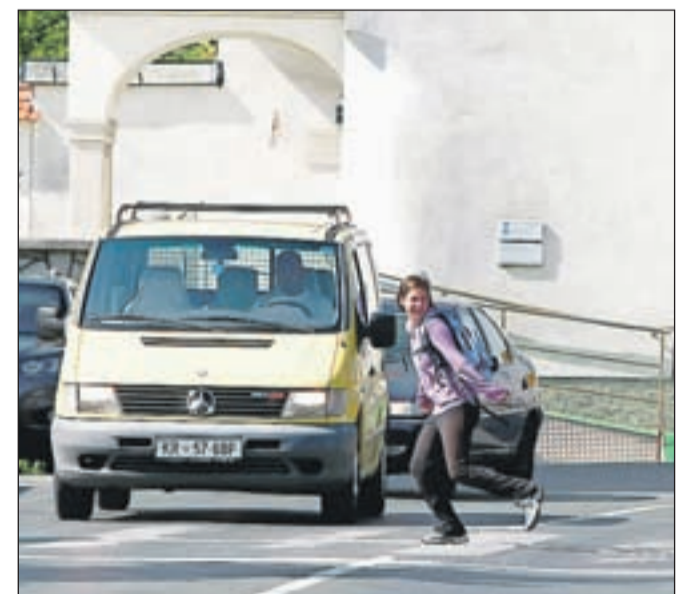
Otroci na poti v šolo: naj bo varna!

V SPV Škofja Loka pa opozarjajo tudi na pomembno vlogo staršev prvo- in drugošolčkov, da pripravijo otroke na samostojno sodelovanje v prometu: "Otroci morajo imeti v prvem razredu spremstvo odraslih celo šolsko leto, zato je pomembno, da starši izkoristijo to leto za pripravo otroka na samostojno sodelovanje v prometu, tako kot bo kasneje sam prihajal v šolo, torej peš in ne z avtom. Spodbujanje hoje je pomembno tudi z vidika varnosti v prometu, saj mora otrok vaditi varno sodelovanje v prometu kot pešec ter pridobiti ustrezne izkušnje, da bo lahko nato varno sodeloval v prometu kot kolesar ali voznik ter bil strpen do šibkejših udeležencev v prometu. Seveda pa je spodbujanje hoje pomembno tudi za stalno telesno dejavnost in fizično zmogljivost ter prispeva k večjemu zdravju otrok in kasneje odraslih."