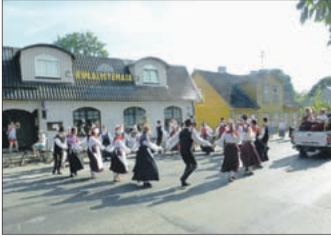
Skupni ples Ločanov in Estoncev