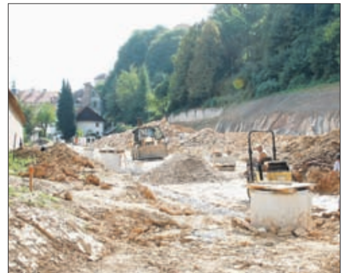
Gradbena dela na prihodnjem parkirišču Nunski vrt so v polnem teku.

čin za sofinanciranje investicij v letih 2011-2013 v skladu z določili Zakona o financiranju občin. Pri pregledu načrta porabe je SVLR ugotovila, da načrt porabe vsebuje vso zahtevano dokumentacijo in da je iz načrta porabe nedvoumno razvidno, da je namen porabe sredstev skladen z določili zakona ter da je načrt porabe popoln in namensko pravilen." Na Nunskem vrtu trenutno intenzivno potekajo gradbena dela: zemeljska dela so že skoraj pri koncu, vodovod je bil obnovljen v celoti, stabilizirana je bila tudi brežina. Sledi ureditev terena z izgradnjo "posteljice", gradnja meteorne kanalizacije in drenaže na spodnjem platoju parkirišča.