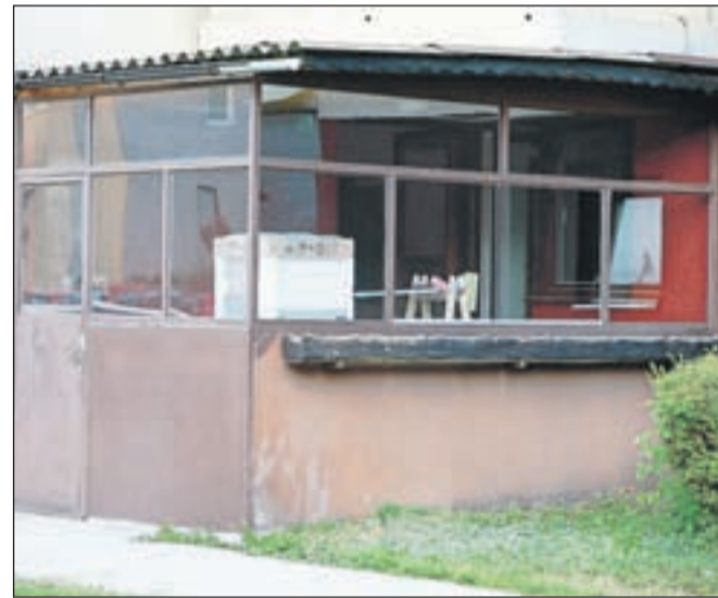
Prihodnji dnevni mladinski center Blok bo v tem stanovanju. Sedaj ga še urejajo, že prihodnji teden pa ga nameravajo odpreti za mlade.