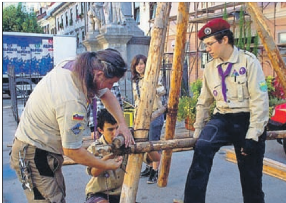
Prikazali so, kaj vse znajo.

nje šotorov, spanje v šotorih, ogenj ter seveda dobra družba, prijatelji," je še dejala Jerebova. Z obiskom na Tednu taborništva so loški taborniki zadovoljni, glede na to, da pri- jave še vedno prejemajo, pa