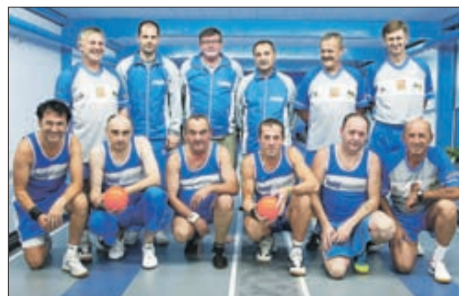
Združeni škofojloški ekipi kegljačev Knauf Insulation