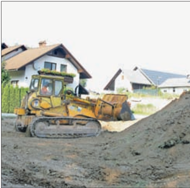
Avgusta se je po začetnih zapletih začela gradnja poljanske obvoznice na Suhi.

bodo omilitveni ukrepi, ki jih predlagajo za območje Suhe? Občinski svet je občinski upravi naložil, da poskrbi za dodatne protipoplavne ukrepe na vplivnem območju Poljanske obvoznice (od Sotočja do Suškega mostu) in v zvezi s tem prednostno pristopi k projektu razširitve okna Suškega mostu, vzporedno z izgradnjo Poljanske obvoznice. Hkrati ji tudi nalaga, da prouči in izvede dodatne prometno-tehnične ukrepe, ki bodo imeli pozitivne učinke na varnost in pretočnost prometa, manjšo obremenitev drugih cest ter posledično manjšo onesnaženost in hrup na vplivnem območju Poljanske obvoznice. Svetniki pa so podprli še dodatni sklep, da se v času gradnje na Suhi zagotovi dodatna lokalna povezava od novega podvoza proti suški cerkvi.