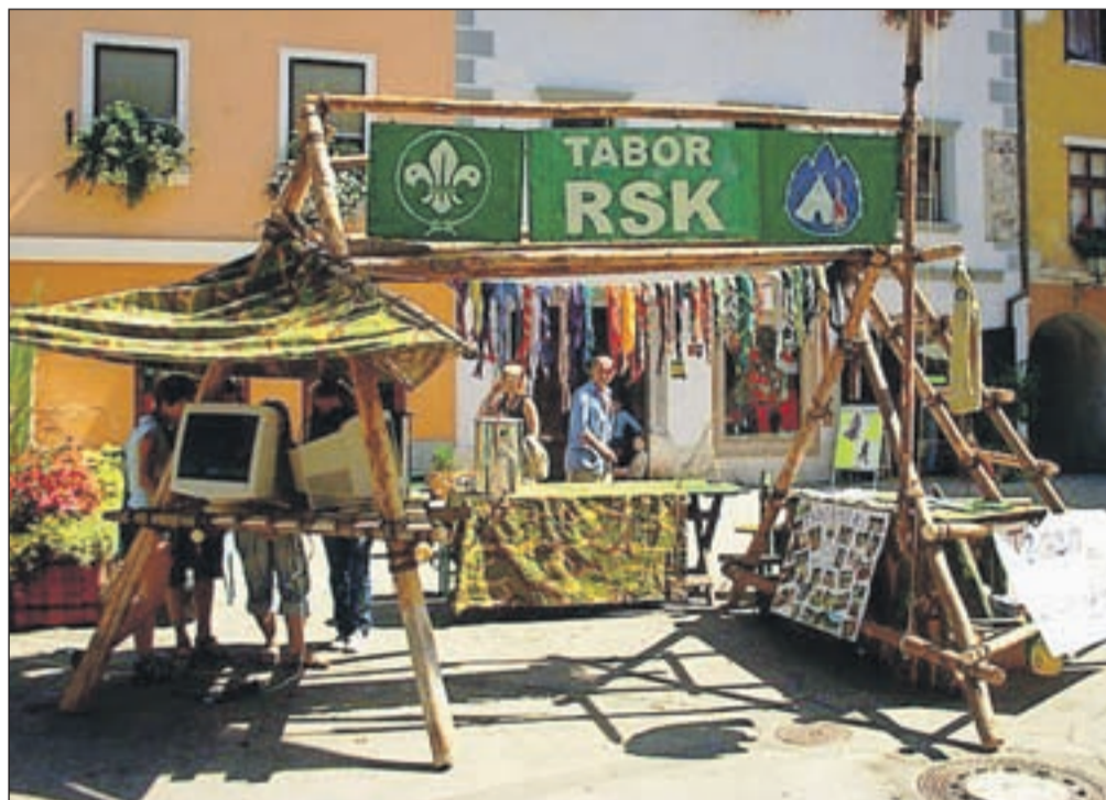
Taborniki Rodu svobodnega Kamnitnika so letos pripravili daljšo promocijsko akcijo, katere namen je bil pridobiti čim več novih članov.

"K tabornikom se ponavadi pišejo ljubitelji narave, otroke pa najbolj privlačijo aktivnosti, kot so postavljaj-