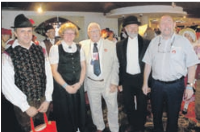
Z uradnega sprejema v mestni hiši

Ravno danes popoldne se bodo udeleženci Europeade iz Škofje Loke srečali na pikniku v lovski koči na Sorškem polju, da ob predvajanju posnetkov, plesu in pesmi obudijo spomine na nepozaben poletni dogodek in se zahvalijo sponzorjem.