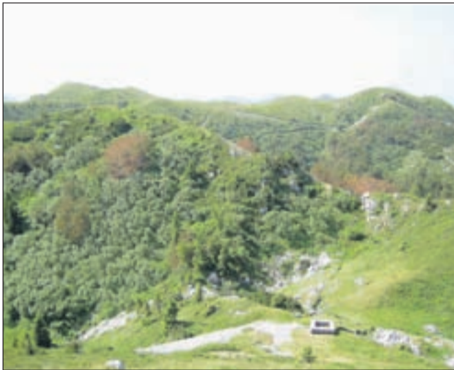
Pogled na del prehojenih poti z vrha Možica