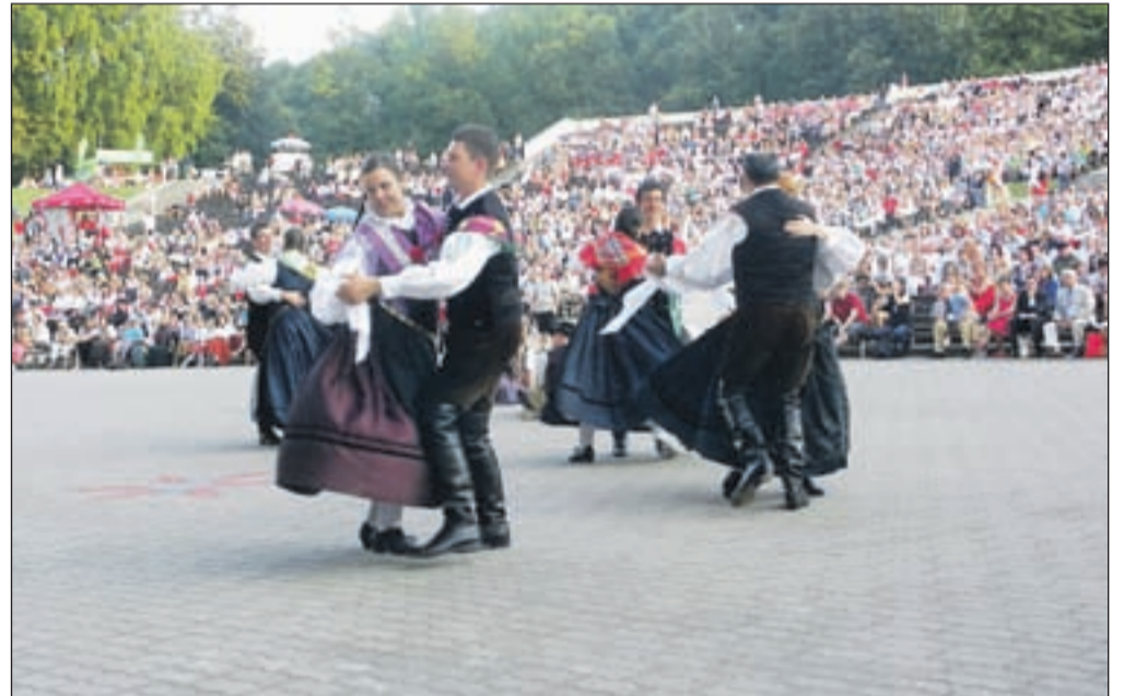
Ko zaplešejo loški folkloristi.