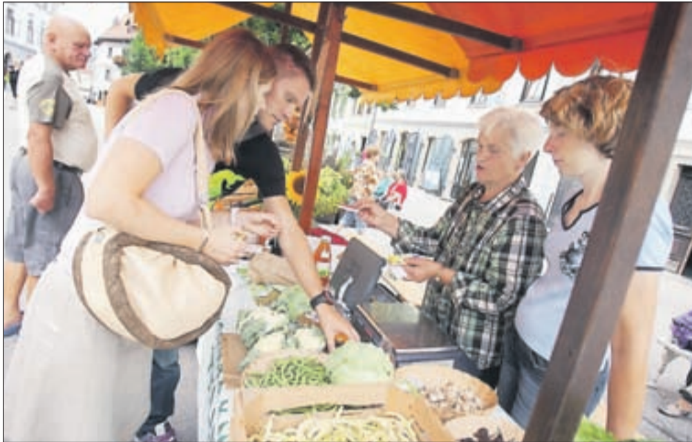
Sredine ekološke tržnice na Mestnem trgu v Škofji Loki so dobro obiskane, kar kaže, da meščani veliko pozornosti namenjajo zdravi prehrani.

"Ekološki pridelavi smo zavezani približno desetletje. Z leti se zavest kupcev o kakovostni, naravni pridelavi krepi, zato težav pri prodaji ni