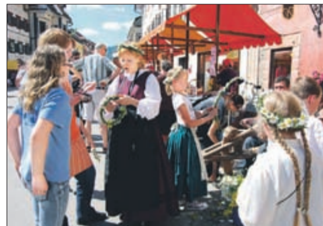
Utrip podeželja na Placu. Potekale so tudi ustvarjalne delavnice.

Od 1. do 6. junija je potekal osmi Teden podeželja na Loškem, v sklopu katerega so organizirali različne dogodke. Osrednja prireditev je bila 5. junija na Mestnem trgu v Škofji Loki, ko so pripravili Tržnico kmetijskih pridelkov in izdelkov. Poleg ponudnikov blagovne znamke Dedek Jaka in Babica Jerca - Naravni izdelki iz škofjeloških hribov so se predstavili tudi ponudniki ekoloških pridelkov in izdelkov, domače in umetnostne obrti, drugi ponudniki in gostje s ponudbo izdelkov višje kakovosti ter društva in institucije, ki delujejo na področju razvoja podeželja na Loškem. Dogajanje je popestril kulturni program, prikazi starih kmečkih opravil, tradicionalnega znanja, starih običajev ter ustvarjalne delavnice. Na Mestni trg se je preselil utrip s podeželja, in sodeč po obisku, bi bilo takšnih prireditev lahko še več. M. B.