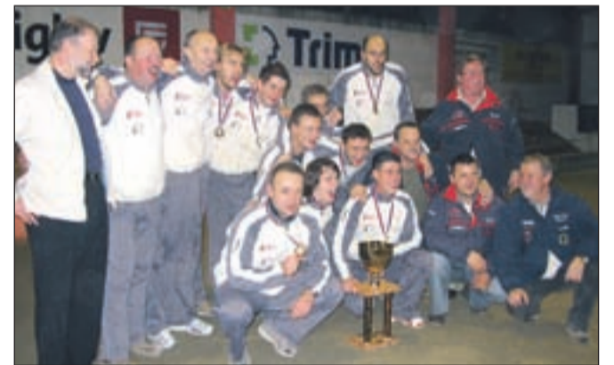
Balinarji Lokateksa Trate so v zadnji sezoni že šestič veselili naslova državnih in pokalnih prvakov.