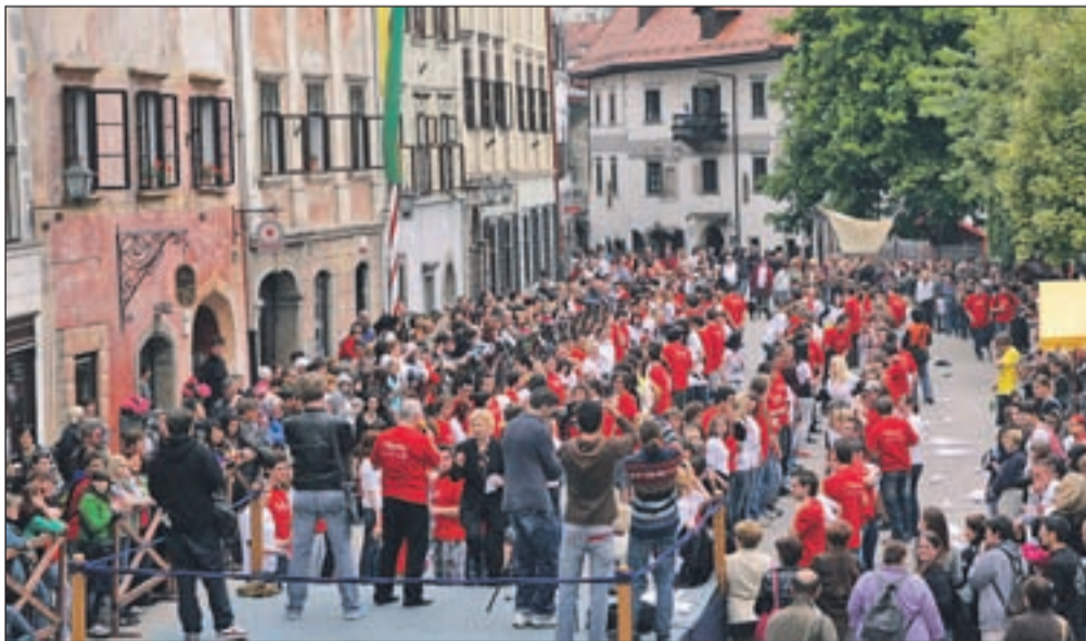
Maturantsko četvorko so zaplesali tudi škofjeloški dijaki.