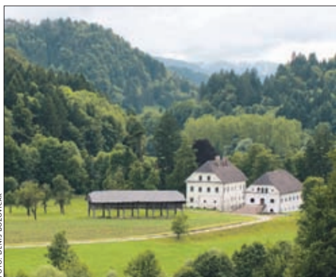
Kdaj se bo začela obnova dvorca Visoko? Letos nikakor ne.

Občini naj bi Tavčarjev dvorec Visoko oživiljali skupaj z razvojnim investitorjem, podjetjem Hosting, ki so ga izbrali na razpisu. Projekt je bil že potrjen, naslednji korak pa je ustanovitev skupne družbe. Občini bosta vložili objekte in pripadajoča zemljišča, razvojni investitor pa dokumente. V naslednji fazi bo Hosting obnovil dvorec, še kasneje zgradil nove namestitvene kapacitete. Za