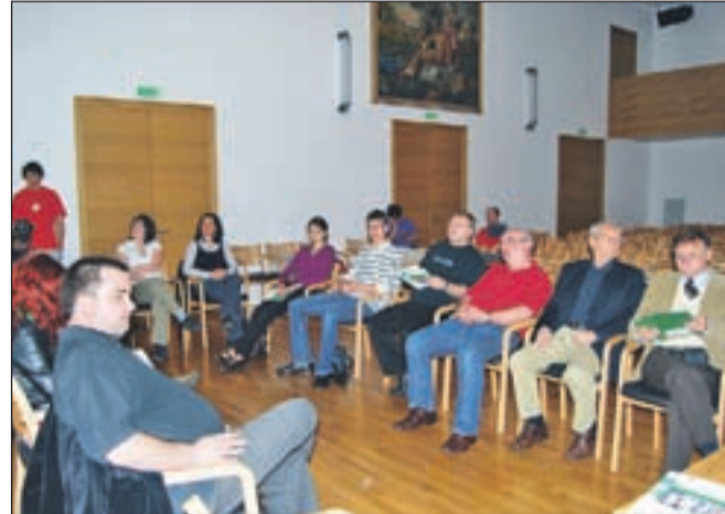
Z ene od razprav na mednarodni konferenci Mesto za mlade - mladi za mesto

Na konferenci, ki je bila maja v Škofji Loki, so sodelovali mladi in odrasli ljudje, ki se ukvarjajo z mladinsko politiko, iz Škofje Loke in partnerskih mest. Ukvarjali so se s pomenom mladinske politike na lokalni ravni in jo povezali s širšo državno in evropsko ravno. So mladi aktivni državljani ali pasivni davkoplačevalci? Kako jih spodbuditi k prevzemanju večje odgovornosti za svojo prihodnost? Razmišljali so o vlogi lokalne in nacionalne skupnosti pri tem, predvsem pa morajo mladi to vlogo sprejeti in jo ovrednotiti. Konferenca je iskala odgovor tudi na velik problem moderne družbe, vedno kasnejše odhajanje mladih od doma, s čimer je bila kot trd oreh izpostavljena integracija mladih v današnjo družbo, ki jo tudi sami sooblikujejo. Škofjeloška mladina se je predstavila s svojim delovanjem v okviru Zavoda O in Kluba škofjeloških študentov, konkretno pa so svojo dejavnost predstavili tudi taborniki iz Rodu svobodnega Kamnitnika in skavtska skupina iz Škofje Loke. Svoje aktivno sodelovanje z mestom je predstavila tudi Gimnazija Škofja Loka, med drugim tudi z raziskavo o tem, kakšno mesto si mladi v resnici želijo. Gostje iz tujine so predstavili primere dobrih praks izvajanja mladinske