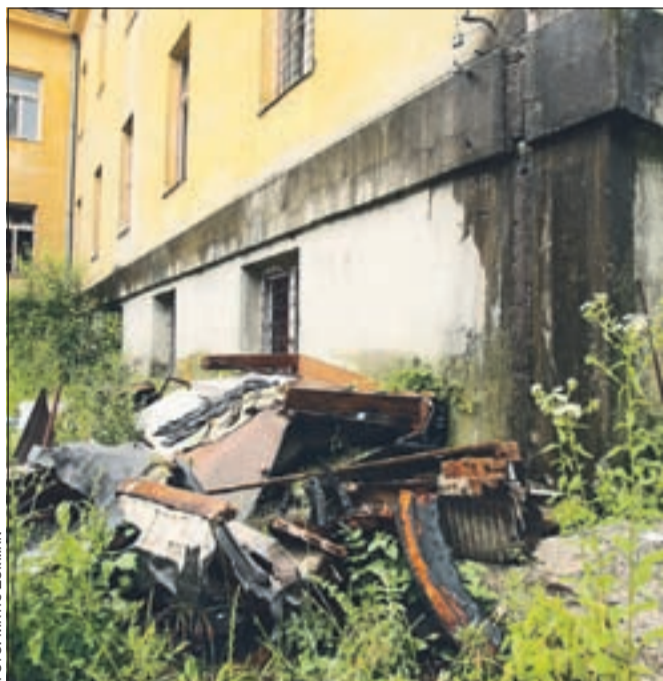
Eden od današnjih prizorov na območju nekdanje vojašnice