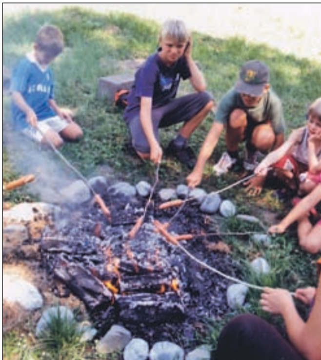
Posebno doživetje je bilo pečenje malice ob ognju.

"Ko smo leta 1995 začeli, je na počitniške dejavnosti, ki še danes poletje potekajo julija, prihajalo 86 otrok, letos jih je bilo 118. Vmes so bila leta, ko so bile te dejavnosti še bolj množično obiskane, vsa leta pa velja, da se jih dnevno udeleži od 30 do 40 otrok. Ne prihajajo na-