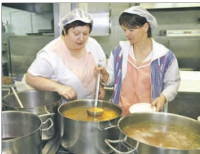
V stolitrskem loncu se kuha juha.