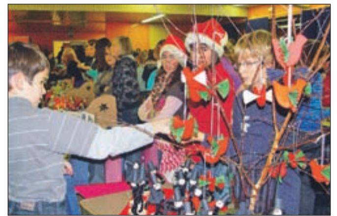
Božično-novoletni bazar v osnovni šoli Škofja Loka - Mesto je naznanil Beli december.

Škofjo Loko je na Miklavžev soboto obiskal že prvi od treh dobrih mož, Mestni trg so tega dne zasedli vinarji in ponudniki domačih dobrot. Do konca decembra bo še vrsta podobnih prireditev, o katerih obveščamo na naslednjih straneh. Od 23. decembra bodo na Mestnem trgu pri Marijinem znamenju postavljene jaslice, tega dne bo božični sejem, otroke bo obiskal Božiček, 30. decembra pa pride tudi dedek Mrz. Leto bodo Ločani spet končali s silvestrovanjem na Placu, ki ga že tradicionalno pripravljajo gasilci.