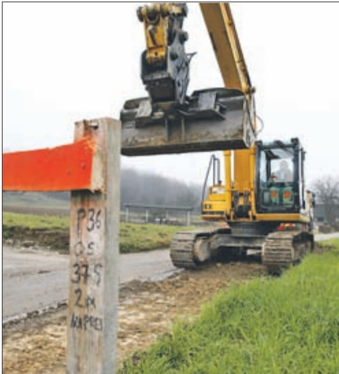
Začela so se gradbena dela na loškem delu panoramske ceste.

Skupna ocenjena vrednost celotne investicije po tekočih cenah za vse sodelujoče občine znaša 3,1 milijona evrov, od tega del projekta v občini Škofja Loka 1,1 milijona evrov, zanj pa je pridobila 480 tisoč evrov evropskih nepovratnih sredstev. Predvidena je razširitev vozišča, posodobitev vseh horizontalnih elementov, modernizacija zgornjega ustroja, ureditev odvodnjavanja, rekonstrukcija obstoječega mostu, ureditev prometne signalizacije in javne razsvetljave. Obnovili bodo vodovod in zgradili kanalizacijo. V času gradnje bo promet deloma oviran, predvidena je polovična zapora ceste, napovedujejo na občini.