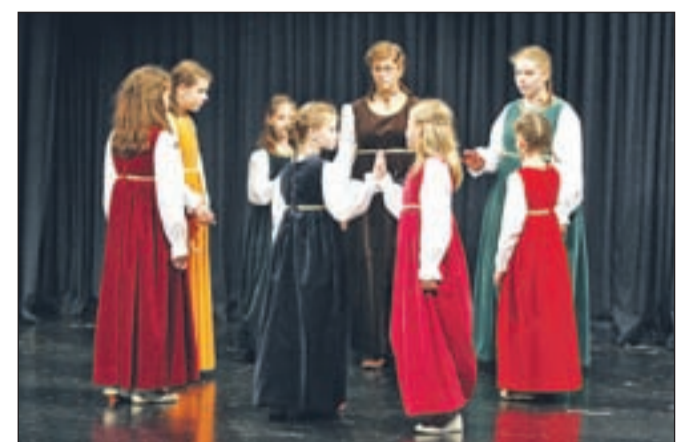
V otroški plesni skupini nastopa deset deklic, starih od osem do šestnajst let.

Ločani so videli nastop renesančnih plesalcev ob slovesnem odprtju dviznega mostu na Škofjeloškem gradu, ob koncu oktobra pa na plesni predstavi Ugriz tarantele, ki so jo pripravili ob peti obletnici svojega delovanja. Umetniška voditeljica sta navdih za to predstavo dobila lani na seminarju v Berlinu, kjer so se naučili ples tarantela. Naučili so se ga tudi v skupini in uprizorili ob obletnici. Seminarji so tudi sicer priložnost, da se naučijo