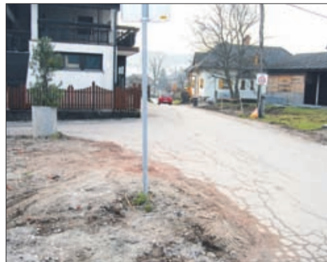
Namesto stavbe, kjer je bil frizerski salon (levo), bodo parkirišča, cesta v vas pa bo širša.