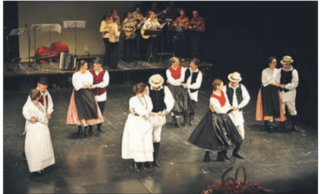
Folklorni nastop, v ozadju Tamburaška skupina Bisernica