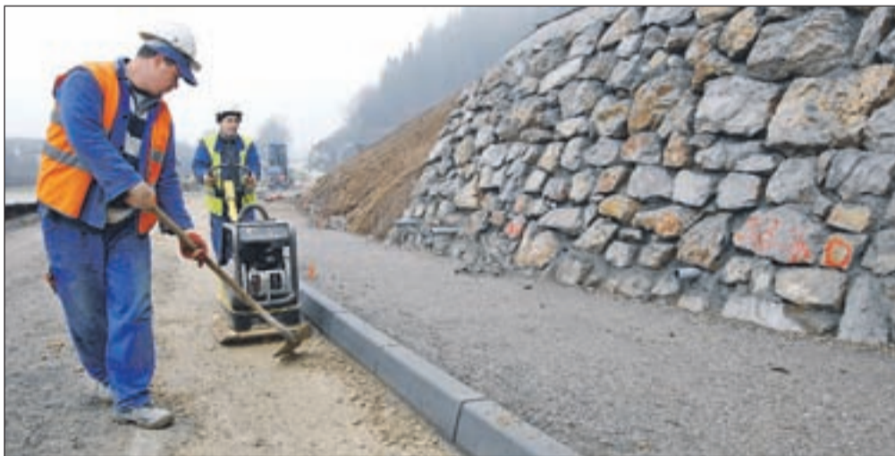
Gradbena dela v Puštalju, kjer naj bi se spomladi začela gradnja predora pod Stenom.

"Imamo pravnomočno gradbeno dovoljenje za predor in za del od predora proti Poljanski dolini, od prejšnjega tedna pa tudi potrdilo o pravnomočnosti za cesto v celoti po Poljanski dolini, do križišča v Zmincu. Veseli smo,