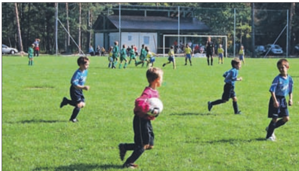
Nove garderobe (v ozadju) so velika pridobitev za godeške nogometaše, tudi za najmlajše.