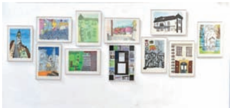
Razstava lanskim nagrajencev

Mladi likovniki so tudi letos vsak v svoji tehniki na papir prenašali zanimive likovne detajle mesta.