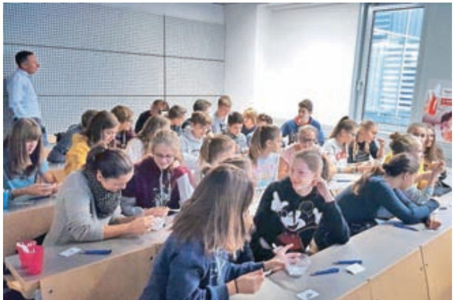
Kemijskih delavnic so se udeležili tudi dijaki Gimnazije Škofja Loka.

Delavnice, s katerimi želijo pri dijakih spodbuditi zanimanje za naravoslovne znanosti ter jim predstaviti povezavo med kemijo in vsakdanjim življenjem, je omogočila družba BASF v okviru projekta Teens' Lab. Na za dijake brezplačnih delavnicah so izvajali eksperiment, ki so ga naslovili Labirint snovi. Delavnice so vodili študenti fakultete za kemijo in kemijsko tehnologijo, pedagoške fakultete in fakultete za farmacijo, ki tako svoje znanje in entuziazem predajajo naprej mlajšim generacijam, so pojasnili organizatorji delavnic.