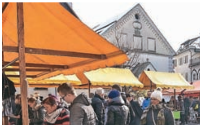
Prvi decembrski LUFT je bili pred Miklavžem, drugi bo božični.