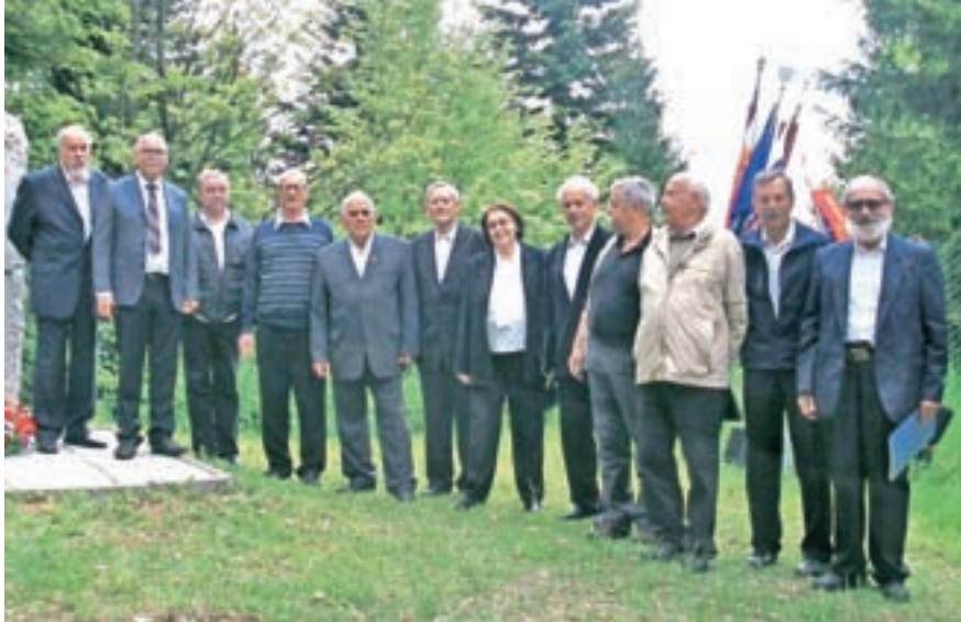
Mešani pevski zbor Vrelec

Z dobrodelnim koncertom so zbirali prispevke za dokup glasbil v glasbeni učilnici v Osnovni šoli Škofja Loka - Mesto, kjer imajo tudi sami dvakrat