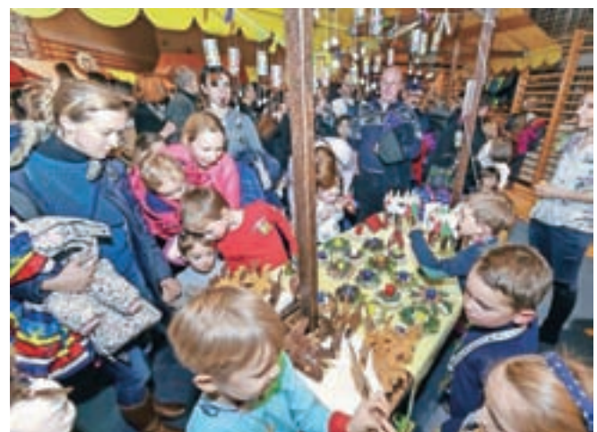
OŠ Ivana Groharja