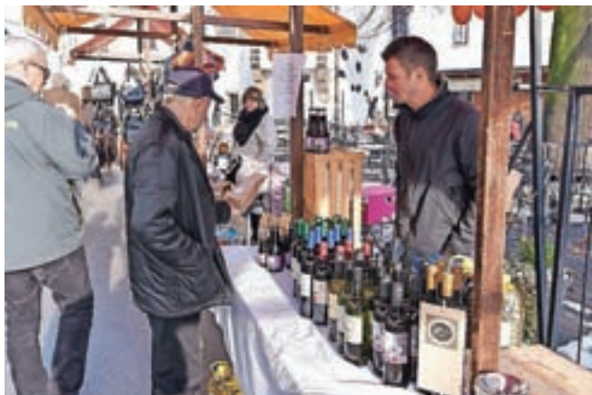
Okušali so vina 15 ponudnikov.