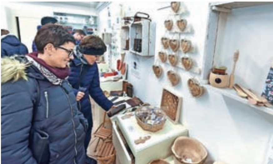
Umetniška dela in izdelki, razstavljeni v Izložbah domišljije, so nadvse primerni za izvirna in unikatna darila.