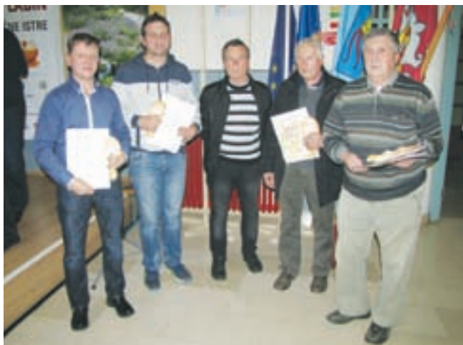
Dobitniki zlatih priznanj na tekmovanju v kakovosti medu v Labinu

Projekt Lokalna hrana v šole spodbuja prehransko samooskrbo, s povečanjem pridelave in predelave lokalno pridelane hrane. Partnerji, Razvojna agencija Sora, podjetje P-ino in Zavod KGZS Kranj, želijo dvigniti ozaveščenost o pomembnosti kvalitete živil in poudariti prednost lokalne pridelave. Skozi projekt se bo preverila možnost vključevanja obroka iz lokalno pridelane hrane v šolske jedilnike, pripravil tehnološki načrt in ocenilo stroške. S tem bi se omogočilo čim več šolam možnost vključitve lokalnega obroka na njihove jedilnike.