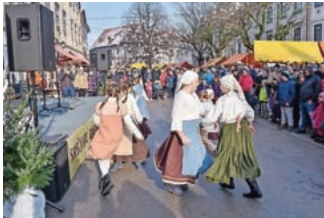
Groharčki so zaplesali na srečanju z vinarji.