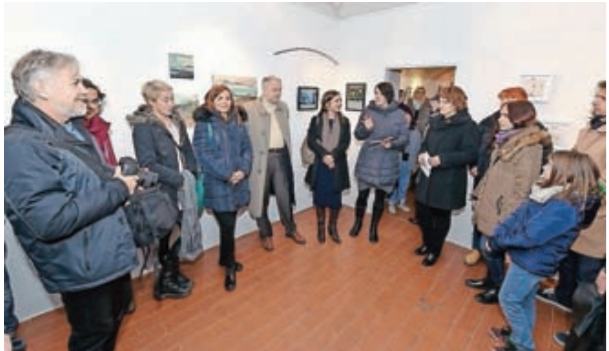
Konec novembra so odprli Izložbe domišljije.

V okviru projekta Izložbe domišljije se tako znova predstavljajo škofjeloški umetniki, rokodelci, fotografi in drugi ustvarjalci, ki so izložbe in druge prostore v starem mestnem jedru spremenili v praznične trgovine. Izdelki in umetniška dela, razstavljeni v Izložbah domišljije, so namreč nadvse primerni za izvirna in unikatna darila, ki jih v tem prazničnem času izbiramo za naše najbližje pa tudi zase. S povezovalno akcijo po besedah