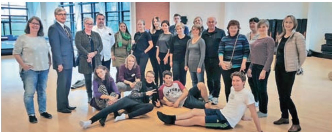
Strokovnega srečanja na Danskem na temo neformalnega izobraževanja se je udeležila tudi delegacija Gimnazije Škofja Loka.