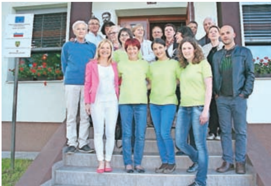
Vsi dosedanji učitelji, ki so poučevali na podružnici, in ravnatelj matične šole, pod katero sodi lenarška podružnica.

Poleg osrednje slovesnosti, s katero so pred časom zaznamovali 120-letnico šole, so ob jubileju za otroke in njihove starše pripravili tudi delavnico izdelovanja dražgoških kruhkov in pohod na Svetega Miklavža.