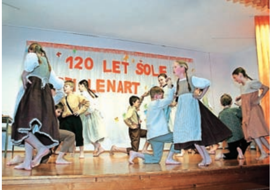
S praznovanja 120-letnice šole na Svetem Lenartu