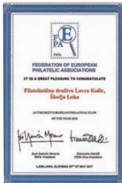
Certifikat Združenja evropskih filatelističnih zvez za škofjeloško društvo