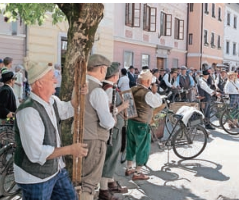
Starodobni kolesarji so se zbrali na Mestnem trgu.