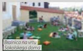
Bralnica na vrtu Sokolskega doma