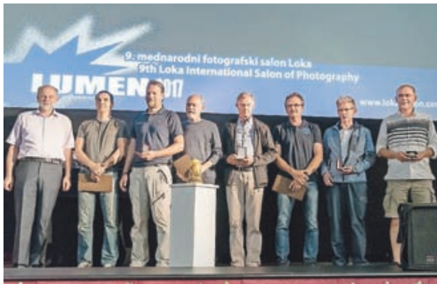
Slovenski nagrajenci v kategoriji Šport