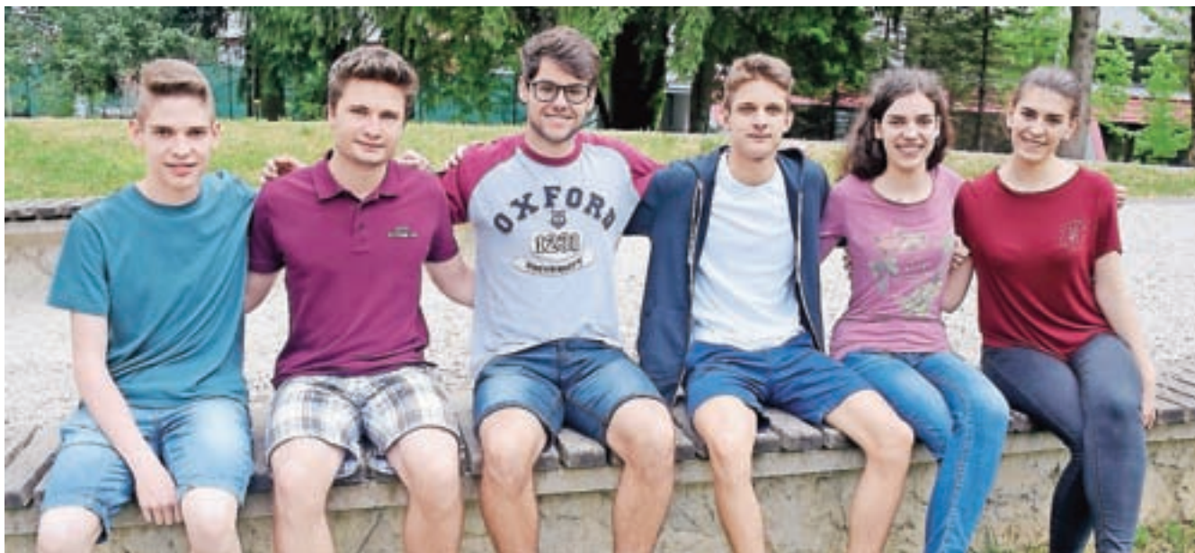
Letošnji olimpijci z Gimnazije Škofja Loka