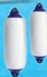
Bokobran 120 x 450 mm 150 x 580 mm