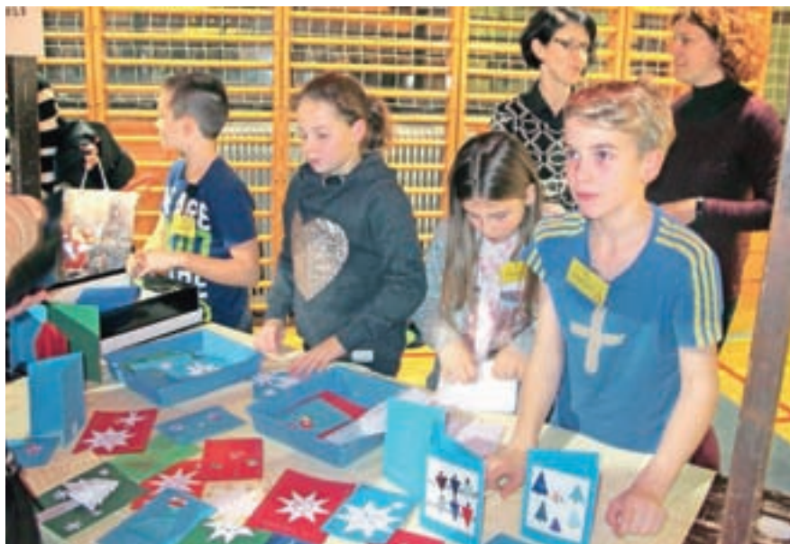
Miklavžev sejem v OŠ Ivana Groharja