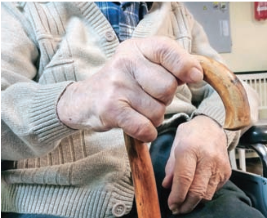
Starejši so še posebej ranljivi, ko gre za nasilje (slika je simbolična)