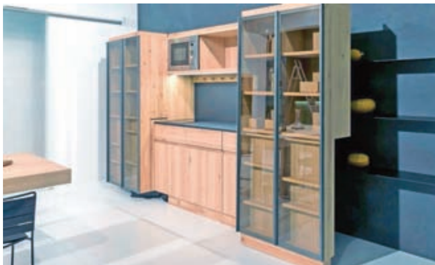
Nagrajena Potočnikova kuhinja oz. "rešitev"

Pohoštvo Potočnik je že vajeno nagrad. Zadnja leta jih kar pridno nabirajo in zato v svoji branži postajajo eden od najvidnejših igralcev.