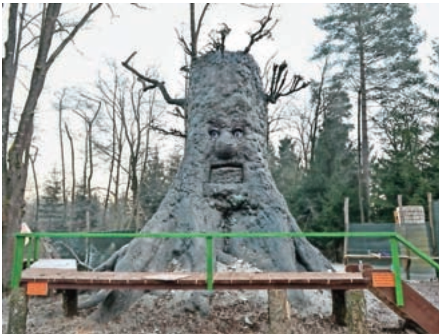
Največja letošnja atrakcija – govoreči hrast

bodo številni prostovoljci trudili najmlajšim pričarati nepozabno pravljичno doživetje. Ker vsako leto dodajo kaj novega, je pravljичna dežela zanimiva tudi za tiste, ki so jo obiskali že v preteklih letih. Letos jo bo mogoče obiskati vsak dan od nedelje, 18. decembra, do srede, 28. decembra, počitek si bodo pravljичni junaki privoščili le 25. decembra. Predstave se bodo odvijale ob 15. in 17. uri. Čeprav je v času druge predstave že trda noč, poskrbijo, da tudi najmlajših ni prav nič strah. Z veliko lučkami, nežno glasbo in prijaznimi pravljичnimi junaki namreč poskrbijo za prijetno in nadvse čarobno vzdušje.