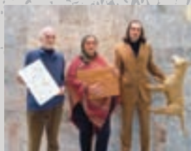
3 x Plestenjak