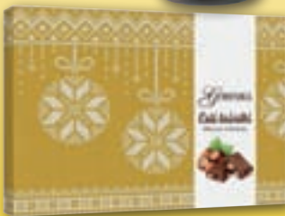
ČOKOLADA GORENJKAS S CELIMI LEŠNIKI, NOVOLETNA, 450 g / 5,58 EUR