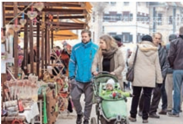
Miklavžev luft je postregel s pestro izbiro prazničnih daril.

Z raznoliko ponudbo prazničnih dobrot in drobnih pozornosti na Miklavževem luftu, v okviru katerega so pripravili tudi 19. srečanje z vinarji, je v začetku decembra na Mestnem trgu že zadišalo po praznikih.