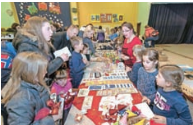
Predpraznični sejem v OŠ Cvetka Golarja