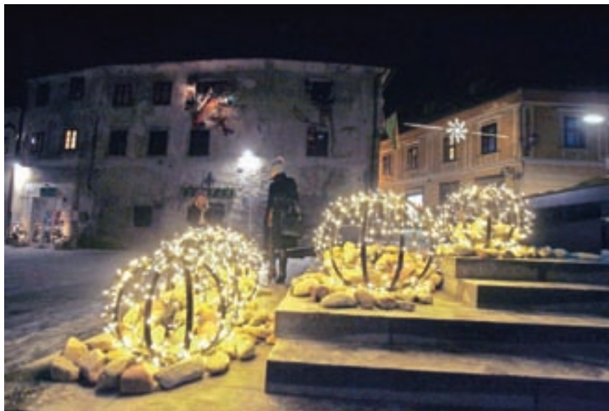
Svetlobne krogle, ki ponazarjajo rečne prodnike.

gle, ki simbolno spominjajo na kamne, je voda letos naplavila le na Cankarjev trg, v prihodnjih letih pa na podoben način načrtujemo označitev še drugih ključnih ambientov," sta še dodali avtorici nove praznične okrasitve.