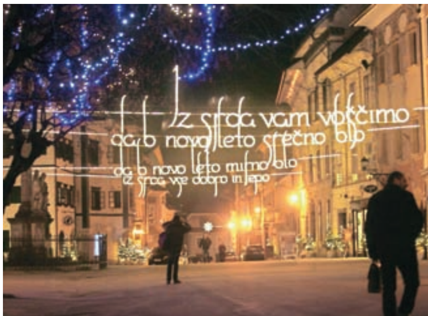
Osvetljena voščila nad mestom so izbrana iz koledniških pesmi.

Praznično okrasitev avtorici obenem vidita kot priložnost za nadgradnjo kakovostnih ambientov pa tudi za izpostavitve manj opaznih in skritih kotičkov mesta. Poleg okrasitve osrednjih prostorov druženja, torej Mestnega, Spodnjega in Cankarjevega trga, sta