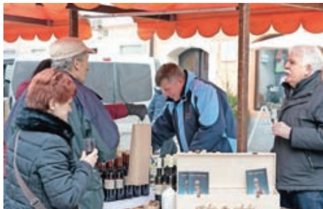
Letošnje srečanje z vinarji je bilo že 19. po vrsti.