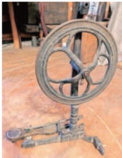
Zobni sveder je nekoč deloval na zobozdravnikov nožni pogon.