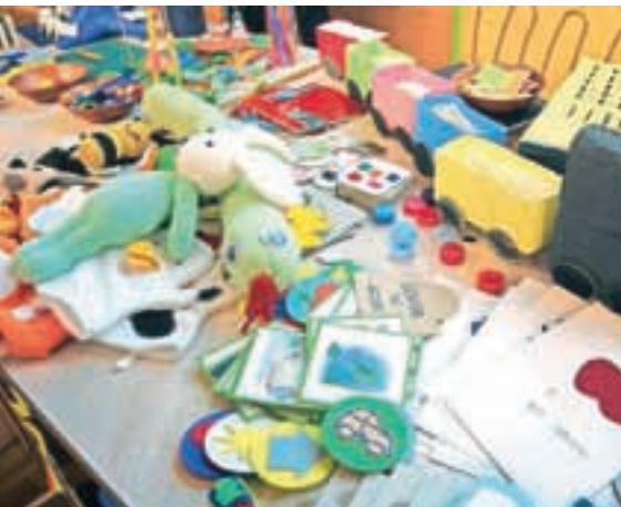
Pripomočki za učenje jezika in govora