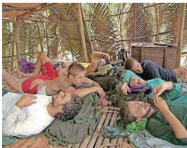
Mehkih ležišč v Survivorju ni.

Še enkrat poudari: „Survivor je igra. To je šov. In vsi, ki se bodo prijavljali, naj se še enkrat vprašajo, kako močne osebnosti so, saj to res niso počitnice. Predvsem si moraš pa tovrstne izkušnje resnično želeli.“ Če komu ponovno uspe, pa mu seveda želi veliko sreče.