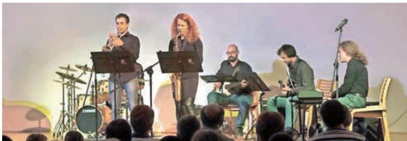
Od Bacha in Rahmaninova do sodobnih žanrov: profesorji Glasbene šole Škofja Loka na odru Sokolskega doma