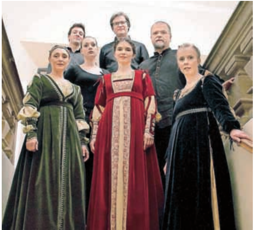
Poezija, glasba in ples: Capella Carniola

Poezija, glasba in ples so bili v srednjem veku v izvedbenem smislu vedno tesno povezani. Za razliko od danes, ko poezijo konzumiramo najpogosteje preko tiskanih izdaj, sta bila zapisana poezija in glasba v času trubadurjev in truverjev dostopni izključno ozkemu, privilegiriranemu sloju in sta služila predvsem preprečevanju njune pozabe. Prenos poezije od avtorja do občinstva je potekal izključno preko žive izvedbe, ki jo je dosledno spremljala glasba in velikokrat tudi ples. Tovrstno izvedbo so največkrat označevali z nazivom carol in je v praksi potekala v obliki krožnega plesa, kjer je vodja plesa pel kitice, drugi pa so se mu s petjem in plesom pridružili pri refrenu. Tudi sam zapis glasbe je bil tesno povezan z besedilom. Ritmično urejenost posameznih tonov je mogoče