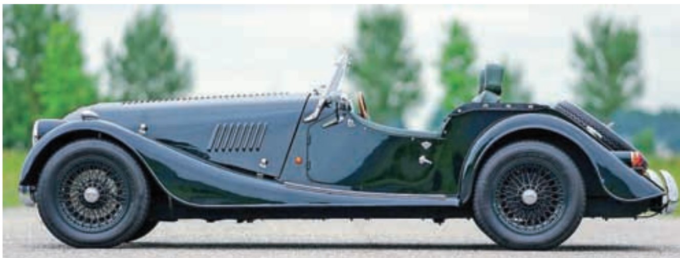
Model 4/4 je Morganov najcenejši model.

Od leta 2019 bodo ljubitelji retro avtomobilov lahko kupili nove hibridne različice ali popolnoma električne avtomobile. Z ekološko različico pogona bodo pripomogli k zmanjšanju emisij CO2. Njihov e-dizajn je dodatek predhodnemu EV3, ki je že debitiral v obliki prototipa. Na podlagi retro motorja bo EV3 kmalu na voljo, namesto sprednjega motorja V-Twin pa bo vseboval zadnji elektromotor in baterije.