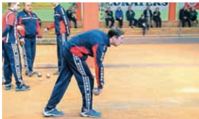
Balinarji Lokateksa Trate na tekmi, na kateri so visoko premagali Krim.

Balinarji Lokateksa Trate so edini gorenjski predstavniki v super ligi. Uspešno nastopajo tudi v letošnji sezoni. Po tem, ko so prezimili na drugem mestu, odlično igrajo v nadaljevanju. Enomesečni premor so očitno dobro izkoristili, pripravljali so se lahko na prenovljenem domačem igrišču. So na dobri poti, da prvi del tekmovanja končajo na prvem mestu. Zadnji, 14. krog, bo odigran 27. februarja. Škofjeloški balinarji bodo doma igrali s Košano.