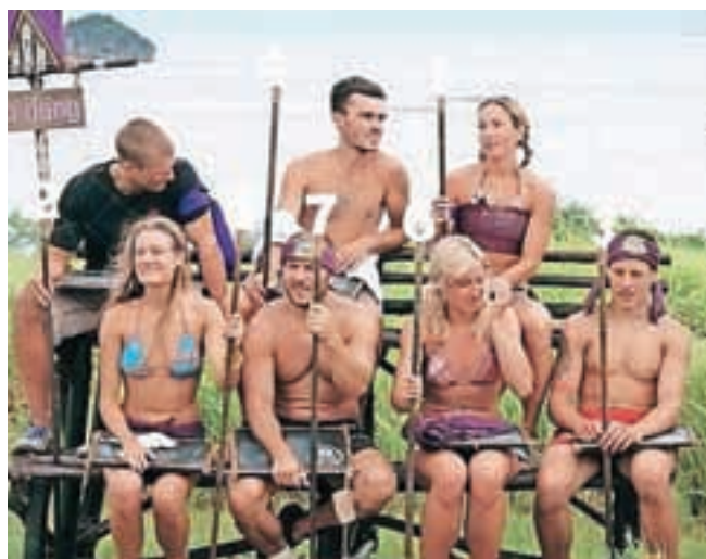
O tvoji usodi v šovu odločajo igre in sotekmovalci.