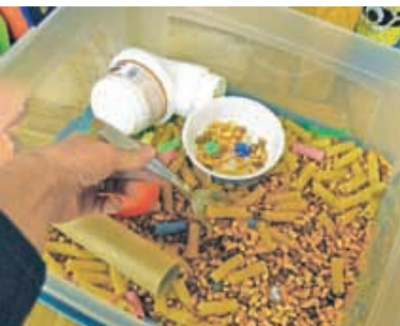
Zelo zanimiva je otrokom senzorična škatla: tipajo, presipajo, prenašajo ...

nila, kako lahko z določenimi pripomočki razvijajo različne veščine otrok in pridobijo nove ideje za igro. Tema, ki je aktualna za vse, ne le za starše otrok s posebnimi potrebami.