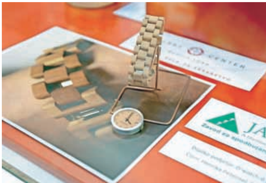
Dijaki so predstavili inovativne izdelke iz lesa.