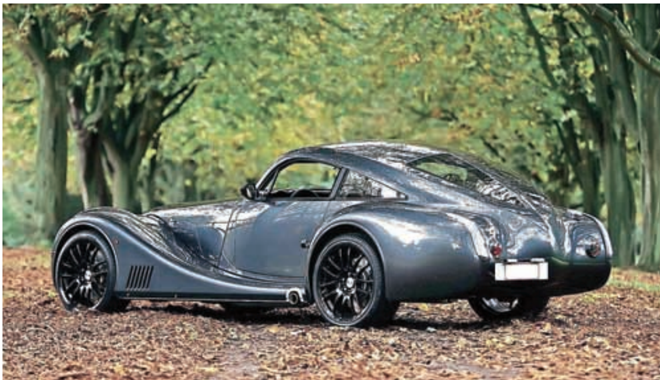
Morgan kot športnik

za pasatta. Zakaj? Zato, ker je na celem svetu samo peščica posebnih, ljubiteljev drugačnih avtomobilov.