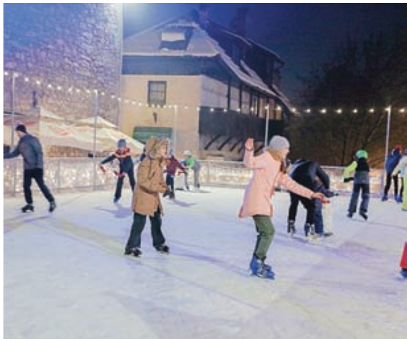
Na Trgu pod gradom je sredi decembra zaživelo mestno drsališče. Na Občini Škofja Loka so tako tudi najmlajšim omogočili aktivno, zabavno in pestro preživljanje zimskih dni.