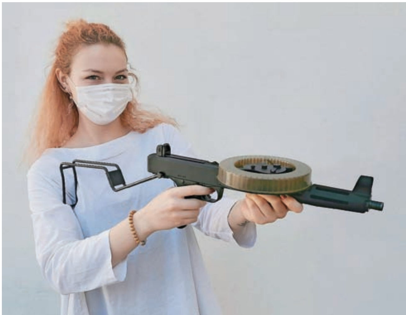
Brzostrelka MGV 176 z iztegnjenim preklopnim kopitom »v akciji«

V prejšnji številki Ločanke smo predstavili najmanjšo brzostrelko na svetu. Tokrat pa iz zbirke Loškega muzeja predstavljamo brzostrelko domače izdelave – MGV 176.