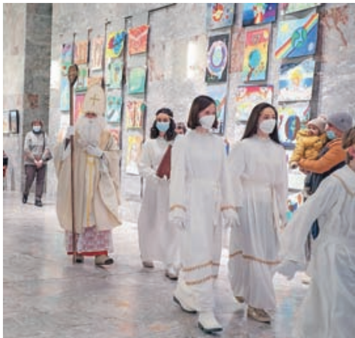
Prosvetno društvo Sotočje Škofja Loka je v Sokolskem domu pripravilo tradicionalno miklavževanje. Otroke je obiskal Miklavž in vse pridne tudi obdaroval.