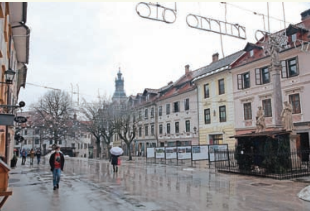
Ureditev starega mestnega jedra Škofje Loke je eden od ključnih projektov strategije.

Škofjeloško bo svojo novo strategijo trajnostne zelene butične turistične destinacije uresničevalo prek ukrepov in projektov, opredeljenih na štirih fokusnih področjih delovanja.