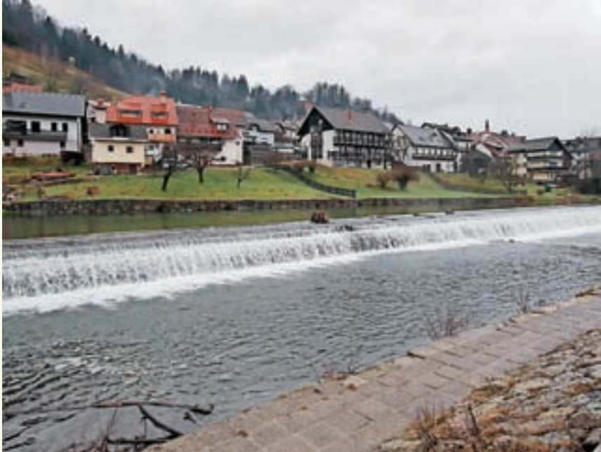
Sora kot kopalna reka se je izkazala za močno povezovalno točko obeh dolin in Škofje Loke.

Med slednje sodijo: Okusi Škofjeloškega, Loška kolesarska pot, Loška planinska pot kot krovni pohodniški povezovalni produkt, Impresije Škofjeloškega kot krovni