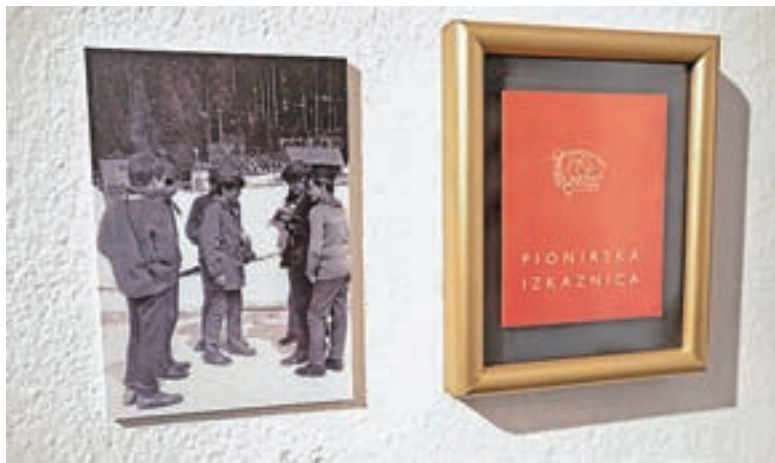
Kdo se še spomni pionirske organizacije?

način opremljajo stanovanja, kupujejo električne aparate, si privoščijo več zabave.