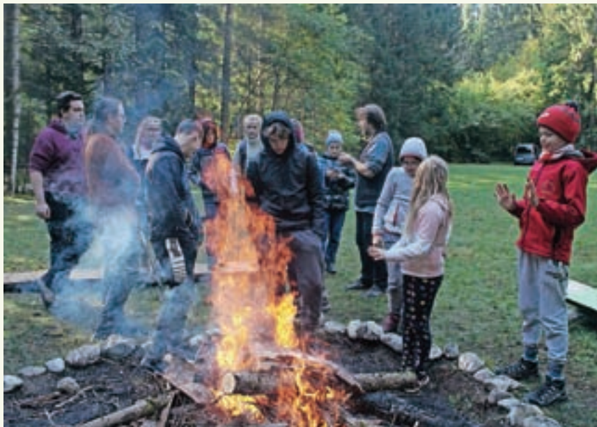
Preživetje v naravi: dvodnevni pohod Jamnik–Talež

»V Zavodu KRES smo ob neposrednem delu z otroki zaznali skrb vzbujajočo raven digitalne zasvojenosti, ki je posegla že med najmlajše. Mladim že v vrtcu slabijo empatija, sodelovanje, pozornost, koncentracija, vztrajnost, ustvarjalnost ter pešajo življenjske veščine. Ob jasni zaznavi problematike smo se aktivni pedagogi odločili za takojšnje ukrepanje v iskanju rešitve – pre-vencije pred digitalno zasvojenostjo otrok in mladine, ki nas je vodila k uresničitvi projekta CLLD Živi živo – življenjske veščine odrasčanja. Odločili smo se za predlog takojšnje spremembe življenjskih poti, zdravega življenjskega razvoja, vpeljave življenjskih veščin odrasčanja in profesionalno pot mentorstva otrok in mladine kot preventivo pred njihovo digitalno zasvojenostjo. Na pohodu je sočasna, nič manj skrb