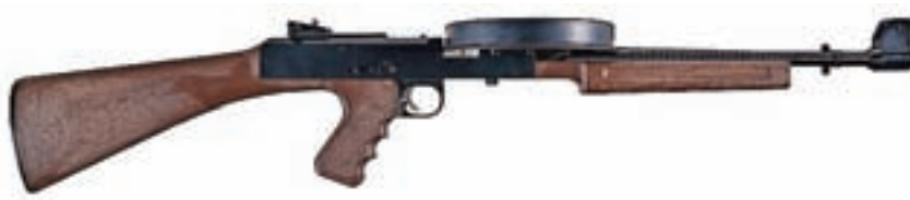
Ameriška brzostrelka American 180