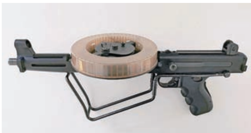
Brzostrelka MGV 176 z zloženim preklopnim kopitom

nameščena ročna varovalka v obliki vzvoda, ki jo premaknemo s palcem naprej v strelno ali nazaj v varovano pozicijo. Na hrbtnem delu ročaja je še avtomatska varovalka, ki jo moramo držati stisnjeno, če želimo streljati. Izbira med polavtomatskim in avtomatskim načinom delovanja se vrši s sprožilcem. Če ga rahlo stisnemo, orožje strelja posamično, če pa do konca, pa rafalno. Značilnost brzostrelke je tudi uporaba malokalibrskega streliva 5,6 × 15 mm z robnim vžigom (.22 LR) in namestitve nabojev v vodoravno ležečem bobnu velike kapacitete na zgornjem delu orožja, na način kot npr. pri Lewisovem puškomitraljezu. Zgornji del nabojnika je izdelan iz prozorne rjavkaste plastike, kar omogoča dober nadzor nad porabo streliva. Strelivo .22 LR je šibko, kar pa nadomestita visoka kadenca 1200–1600 nabojev/min in obvladljivost orožja pri rafalnem streljanju. Brzostrelka je opremljena s kovinskim preklopnim kopitom, serijsko pa ji je pridan še dušilec poka M88. Prvič je bila javno predstavljena 5. oktobra 1989 v prostorih Kadetske šole za miličnike v Tacnu. Uporabljala se je v vrstah milice in slovenske Teritorialne obrambe. Leta 1991 je odigrala pomembno vlogo pri osamosvajanju Slovenije in danes velja za simbolno orožje osamosvojitvene vojne. Zaradi manjše zanesljivosti se kasneje ni obdržala v oborožitvi. Brzostrelko si lahko ogledate v Loškem muzeju na občasni razstavi Od osvoboditve do osamosvojitve.