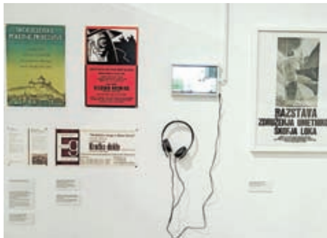
Kulturno delovanje je bilo vedno bogato.

Socialistična Jugoslavija v osemdesetih počasi odhaja v zgodovino. V zadnjem delu se razstava približuje osamosvojitvi Slovenije, saj je ta posvečen zgodovini vojašnice v Škofji Loki, Jugoslovanski ljudski armadi in kasneje Teritorialni obrambi. Na ogled je tudi bogat nabor različnega orožja, ki so ga uporabljali v prej omenjenih vojskah. Osrednji del razstave se konča s predstavitvi-