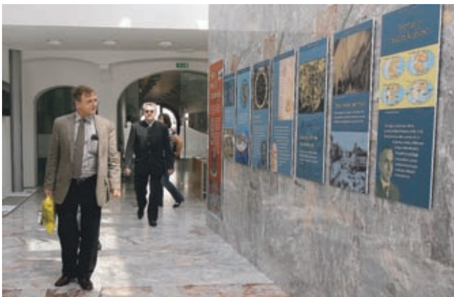
Na mednarodnem posvetu ob 500-letnici najhujšega potresa na Slovenskem so priznani strokovnjaki predstavili zanimivosti o njem, o takratni Škofji Loki in povezavi tisočletnega mesta s Freisingom.