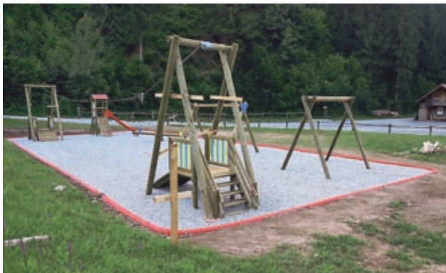
S pomočjo evropskega denarja je občina v Pustotniku uredila novo otroško igrišče.

”Najbolj realna varianta je gradnja manjšega doma za starejše z istočasno uporabo storitev pomoči starejšim na domu. Takšen način je prijaznejši in cenejši za starejše, ki tako ostajajo doma tudi v jeseni življenja, vsak trenutek pa imajo na voljo tudi pomoč. Po dopustih se bom sestal s predstavniki Inštituta Antona Trstenjaka in drugimi pristojnimi na tem področju, seveda ne bom pozabil na predstavnike žirovskega društva upokojencev, skupaj bomo proučili optimalne možnosti. Žiri bi lahko pristopile tudi k projektu Starostnikom prijazno mesto, prek ka-