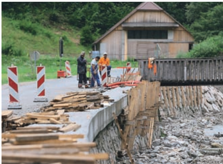
Celovita rekonstrukcija ceste Železniki-Jesenovec je v delu.

”Ti se že gradijo. Tudi operaterji so precej aktivni pri pridobivanju novih naročnikov.