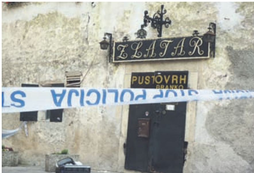
Roparje škofjeloške zlatarne Pustovrh so policisti prijeli v nekaj urah.

Loške in kranjski policisti so se hitro podali tudi v iskanje pobeglih sosterilcev, pri tem pa jim je pomagal tudi policijski helikopter. Približno uro kasneje so enega roparja prijeli na poti proti Jesenicam. Druga dva sta se odpeljala v smeri proti Ljubljani, kjer sta odvrгла roparska oblačila in orožje, a sta se kasneje sama predala policiji. Policisti so na koncu