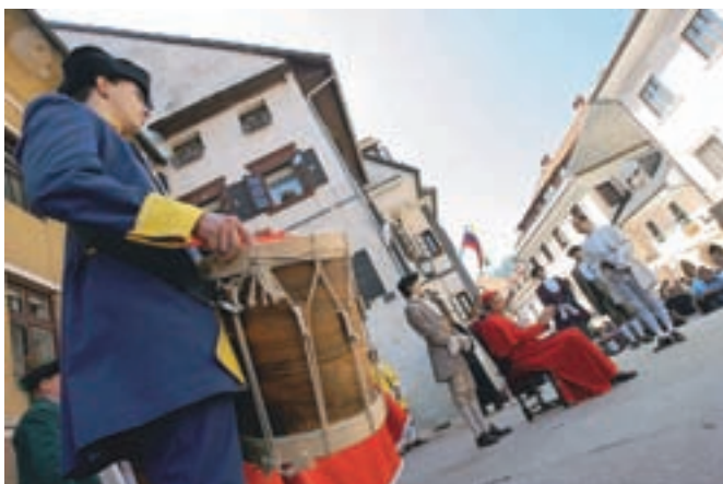
Freisinškemu škofu, svojemu zemljiškemu gospodu in duhovnemu vladarju, so se poklonili loški veljaki z mestnim glavarjem na čelu, pa seveda tudi preprosto in neuko ljudstvo.