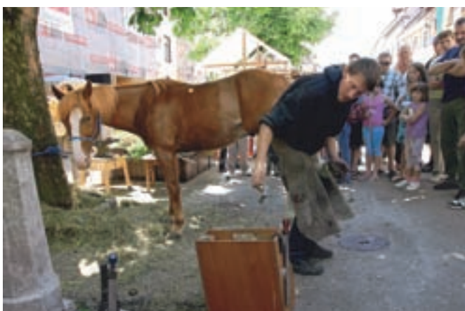
Velikega zanimanja obiskovalcev so bili na loškem Historialu deležni konji, plemenite jezdne živali, pa tudi delovna pomoč takratnega kmeta.