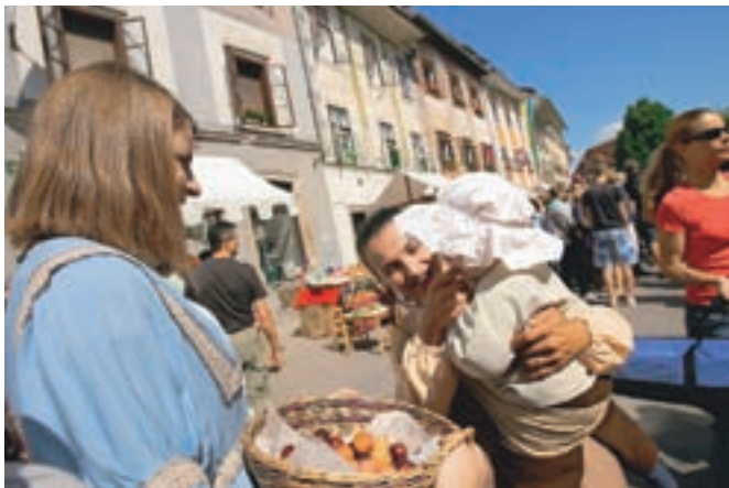
Meščani in kmetstvo, stari in mladi, so se odeli v srednjeveška oblačila in odšli na Mestni trg, kjer je oživel rokodelski semenj.

Lani so v Škofji Loki prvič priredili Historial, sklop prireditev, s katerimi so obudili dogajanje iz loške zgodovine. Letos je srednjeveško dogajanje privabilo še posebej veliko obiskovalcev.