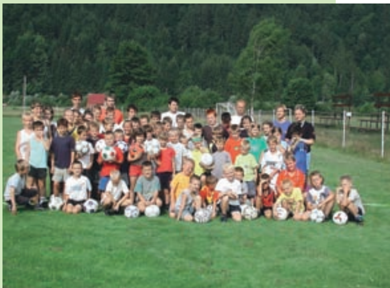
Mladi nogometaši, ki so obiskovali prvo poletno nogometno šolo v letu 2003.