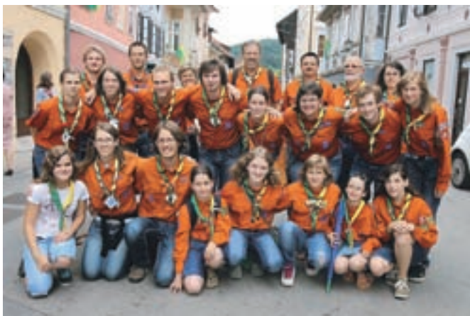
Skavti iz stega Škofja Loka 1