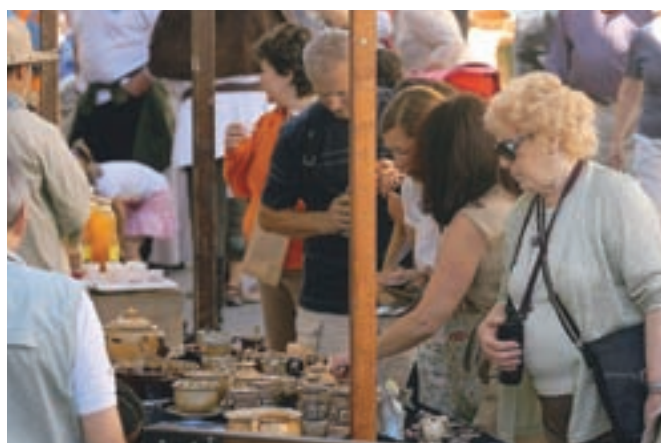
Sejem je združil ponudbo starih domačih obrti, kulinarčnih dobrot iz preteklosti pa tudi historične glasbe in plesa ter raznovrstnih otroških igrarij. D. Ž., foto: T. D.