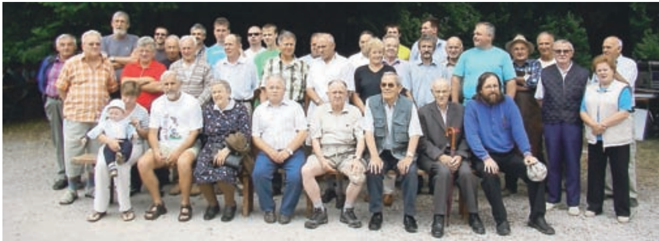
Letos se je srečanja Janezov udeležilo 63 Janezov in štiri Ivanke.

Letošnjega srečanja Janezov se je udeležilo skoraj 70 moških in žensk s tem imenom, na Pokošnjici pa se je pomerilo šest parov koscev in grabljic.