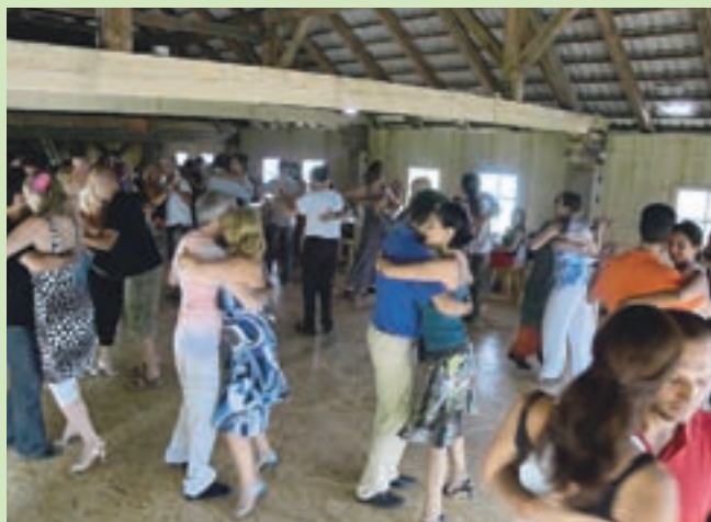
Prejšnji konec tedna so Stari vrh zasedli plesalci argentinskega tanga. Zaplesali so v novi dvorani pod Žgajnarjevim kozolcem.