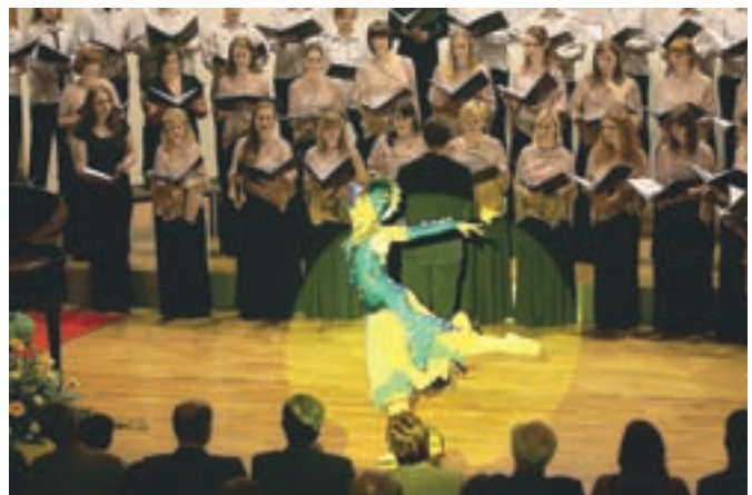
Ob občinskem prazniku prvič uprizorjena glasbena noviteta Riba Faronika