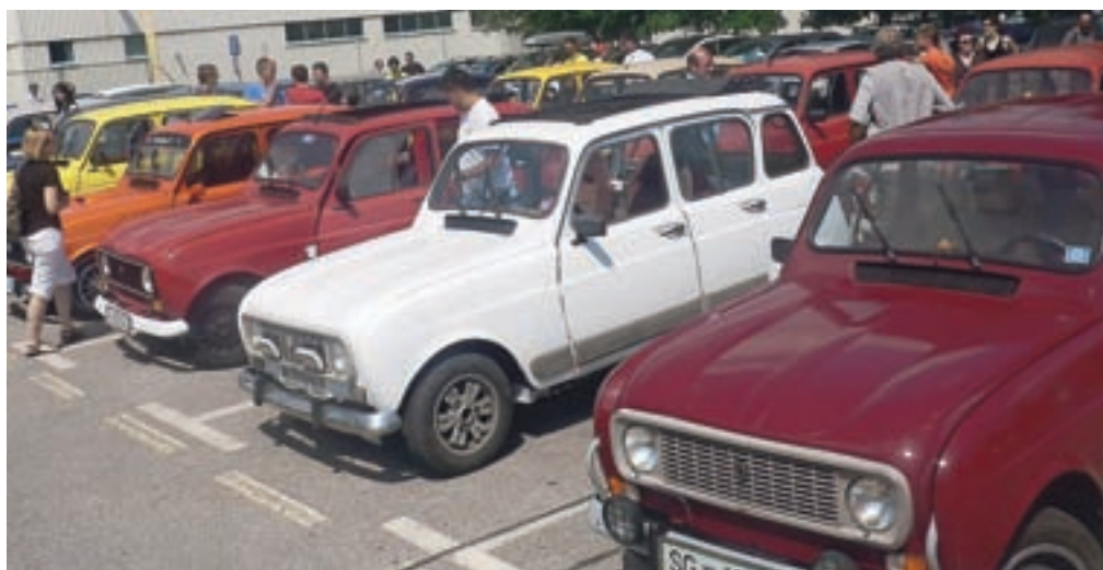
Pred dolgo potjo se je karavana, v kateri so bili tudi Hrvatje, Makedonci in Srbi, ustavila še v novomeškem Revozu.

til obnovi in restavriranju Renaultov 4, ki sta jih z bratom "nalovila" vsepovsod. "Včasih sva do kakšne katrce prišla tudi tako, da sva se enostavno peljala za njo in ko se je lastnik zaustavil, sva