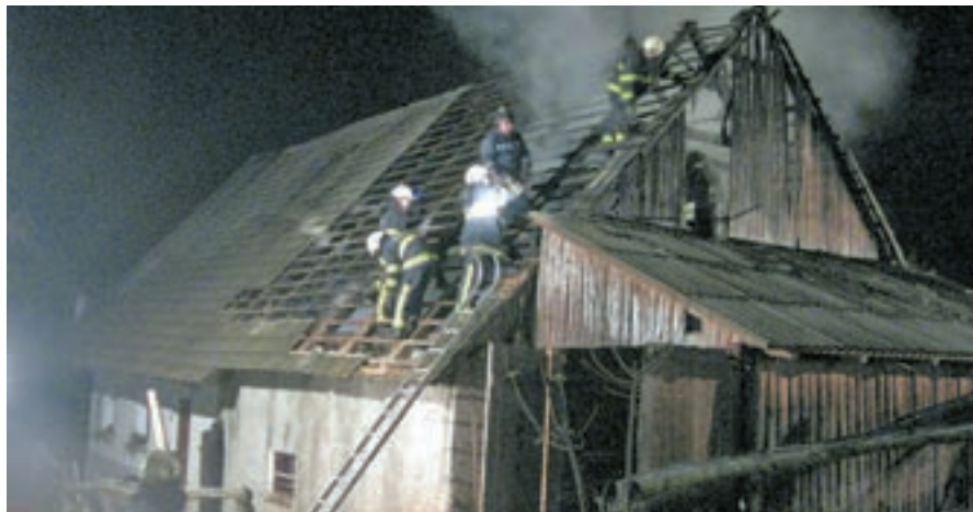
Oktobrski požar je na kmetiji Pri Šnitovcu v Žirovskem Vrhu uničil hlev in ostrešje stanovanjske hiše.