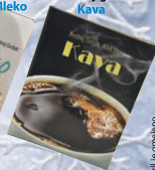
● Knjiga Kava