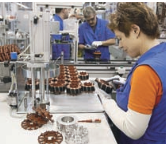
Med največje projekte razvojnih centrov gospodarskih središč spada tudi projekt Nela, ki bo organiziran v Domelovih prostorih (Tehtnica) v Železnikih.

Železniki - Namen razpisa je spodbuditi vzpostavitev in delovanje razvojnih gospodarskih centrov za dolgoročno razvoj prijavljenih vsebin, ki bodo omogočili tehnološki preboj na področjih, kjer Slovenija že ima kritično maso znanja. "Želeli smo, da bi ta dragocena razvojna sredstva dobili najboljše projekti v Sloveniji. Ne gre toliko za nova delovna mesta, kot za razvoj proizvodov z višjo dodano vrednostjo," je ob predstavitvi projektov povedala ministrica Darja Radič.