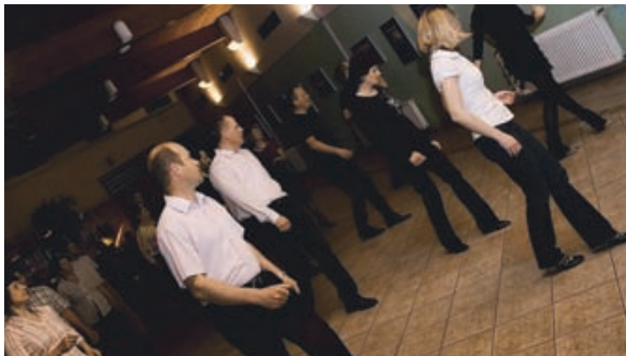
Plesni večeri so namenjeni druženju in sprostitvi ter seveda plesu.