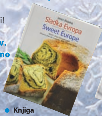
● Knjiga Sladka Evropa