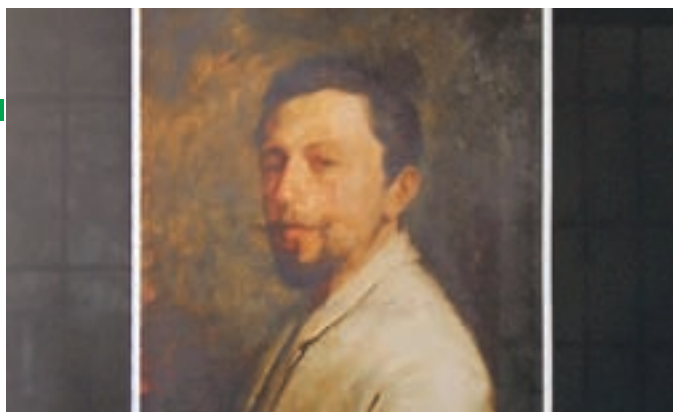
Razstava prikazuje tudi fotografijo Groharjevega avtoportreta.