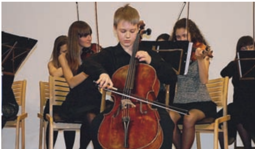
Godalni orkester GŠ Elly Bašić iz Zagreba je v Škofji Loki gostoval prvič.

Sredi februarja sta v Sokolskem domu nastopila godalna orkestra iz Škofje Loke in Zagreba. Do aprila v III. mednarodnem ciklu koncertov sledi pester glasbeni program.