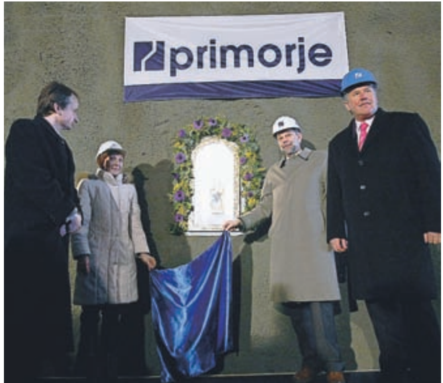
Ob južnem vhodu v predor pod Stenom so odkrili kip svete Barbare.

Poljanska obvoznica je sicer projekt, ki si ga prebivalci Škofje Loke želijo že več desetletij. Zgrajen je že del prve faze od križišča na Ljubljanski cesti, zgrajeno je tudi križišče na poljanski strani v Zmincu, sedaj gradijo predor, nadaljevali bodo tudi z gradnjo odseka od severnega portala proti Poljanski dolini, še vedno pa je nerešen del trase skozi vas