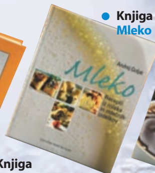
● Knjiga Mleko