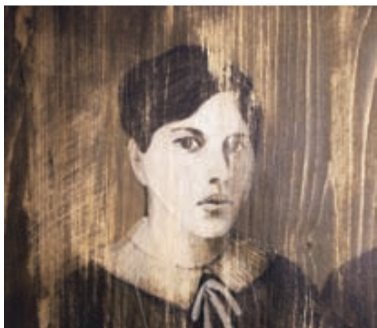
Portret I, detajl.