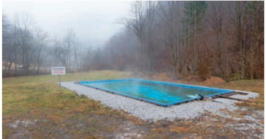
Že letos bo možno kopenje v bajerju v Kopačnici.

”Naš občinski svet je leta 2007 soglasno izglasoval, da je treba raziskati več variant, med njimi tudi povezavo Poljanske doline z dolino Idrijce, ki je bila večkrat obravnavana zadnjih dvesto let. Hkrati smo takrat soglasno nasprotovali posegom v vas Hotavljice in dolino Kopačnice. Nato so začele potekati aktivnosti okoljskega ministrstva, junija v letu 2009 pa smo na predlog prometnega ministrstva dali soglasje tudi preko Sovodnja. Lani nas je presenetila odločitev, kjer je bila predstavljena najustreznejša varianta, ki poteka po dolini Kopačnice. Kaže, da so tudi upoštevali sklep iz leta 2007, zato ta varianta ne posega v vas Hotavljice in v dolino Kopačnice, ampak je trasa speljana mimo Hotavelj in skozi predor pod Slajko, dolino Kopačnice pa obide z vzporednim tunelom pod Makovcami.”