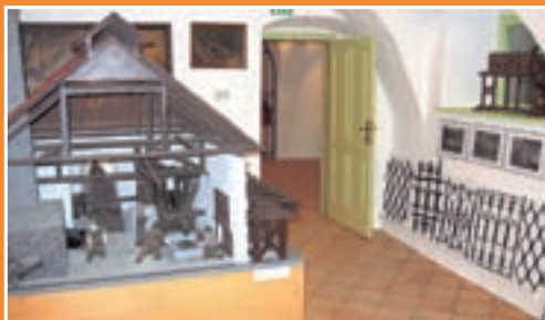
V Železnikih obiščite tudi muzej.

Vodnih radosti v plavalnem bazenu v Železnikih bodo še posebej veseli otroci. Voda je prijetno topla in kristalno čista, v bazenu, velikem 10x25 metrov, pa se boste zagotovo sprostiti in razgibali tudi odrasli. Po želji lahko kopanje dopolnite z razvajanjem v finski savni, ki ima vrsto pozitivnih učinkov in se bo v teh hladnih dnevih še kako prilegla, ali pa z obiskom fitnesa, za kar marsikomu ob vse bolj natrpanih delavnikih zmanjka časa. Po vsem tem se boste lahko osvežili še v prijetnem bifeju ob bazenu. Bazen, savna in fitnes so med tednom odprti od 16. do 22. ure, ob sobotah od 11. do 22. ure, ob nedeljah in praznikih pa od 10. do 21. ure. Za dodatne informacije pokličite na telefonsko številko 04/514 63 81.