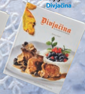
● Knjiga Divjačina

Pohitite, število posameznih daril je omejeno.