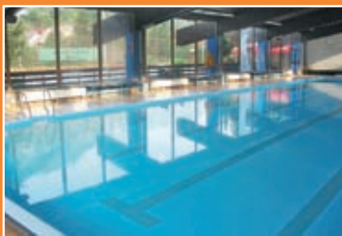
Bazen v Železnikih vas znova pričakuje.

Proste zimske dni lahko izkoristite za obisk bazena in muzeja v Železnikih.