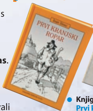
● Knjiga Prvi kranjski ropar