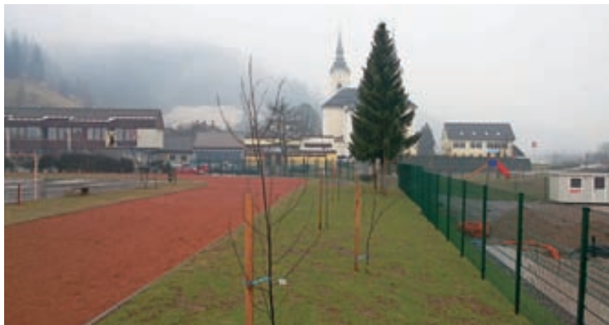
Nova športna dvorana bo stala med šolo, atletskim stadionom, nogometnim igriščem in cerkvijo.

”Nadzidava šole je del rešitve težav. Zanj smo že dobili gradbeno dovoljenje, pripravljamo se na razpis. Rešili bomo trenutne težave, vendar so te štiri učilnice že vračunane v kvoto prenove šole in dograditve. Razen teh