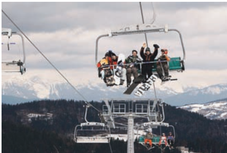
Na smučiščih je v času zimskih počitnic še bolj živahno kot sicer.

Smučarski center Cerčno je med 10. decembrom in 15. februarjem obiskalo 62.500 smučarjev. "Letošnja sezona je v primerjavi z lansko nekoliko boljša, ni pa toliko obiskovalcev kot pred dvema sezonama," so pojas-