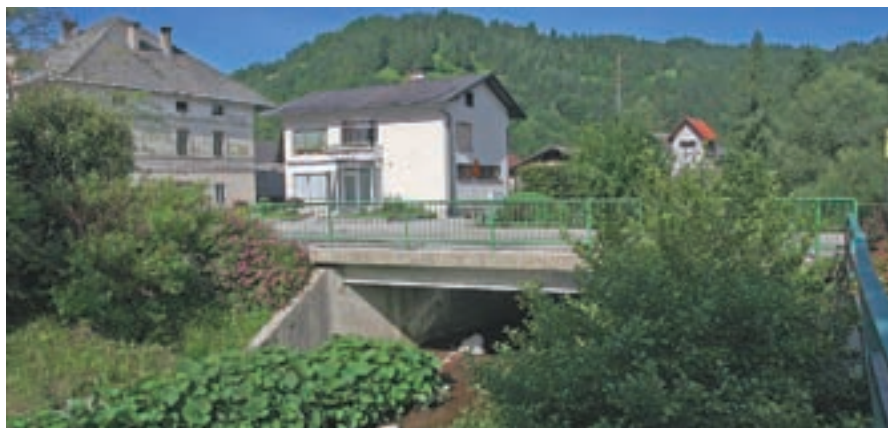
Ali je kaj trden most? Direkcija RS za ceste pravi, da ni in bi ga porušila in zgradila novega.

Kako kaže s sprejemom občinskega prostorskega načrta, ki je pomemben tako za