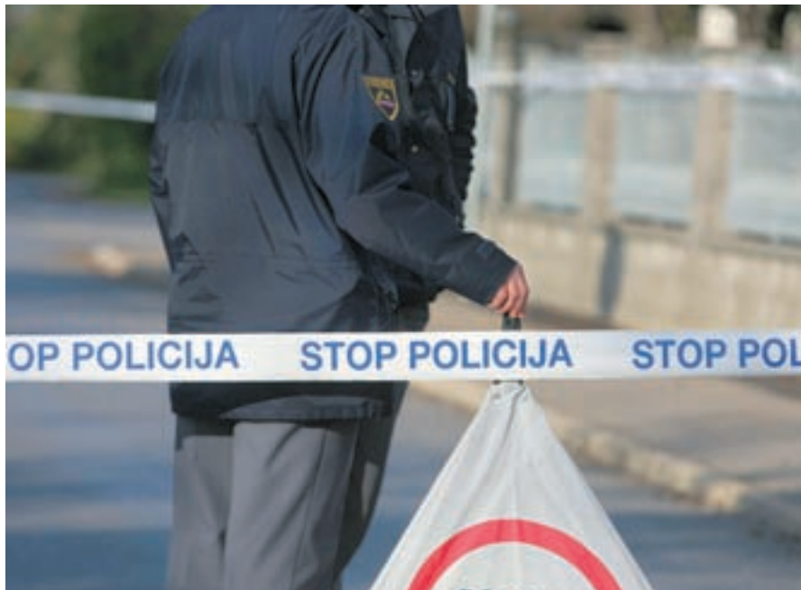
Škofjeloški policisti so junija obravnavali prvo letošnjo smrtno nesrečo.

Med obračanjem sena s traktorjem in obračalnikom se je 8. junija v Prelesju ponesrečil 67-letni domačin. Sredi dela se je prevrnil traktor, med prevračanjem po strmem pobočju pa se je kmet poškodoval, zato so ga odpeljali v Klinični center v Ljubljani, kjer pa so