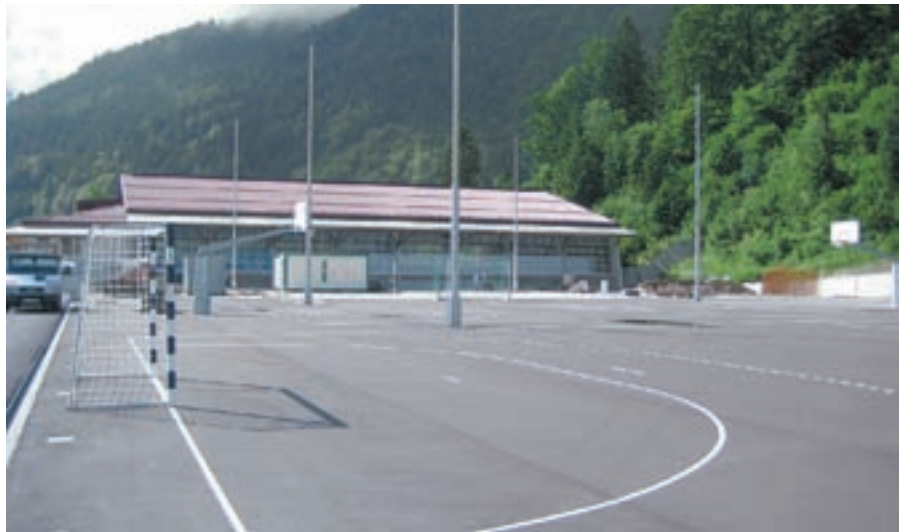
Športni park Dašnica dobiva končno podobo. Gradnja bo končana do konca avgusta.

Kaj pa problem odlaganja gradbenih odpadkov? Posebne deponije zanje nimate, zato se pojavljajo na nedovoljenih lokacijah.