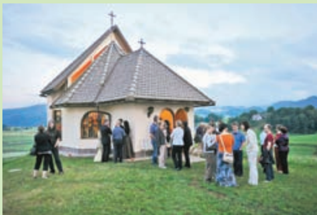
Pred zadnjim koncertom letošnjega koncertnega cikla v čudovitem ambientu kapele v Papirnici, ki je letos oživila tudi v glasbenem pomenu.