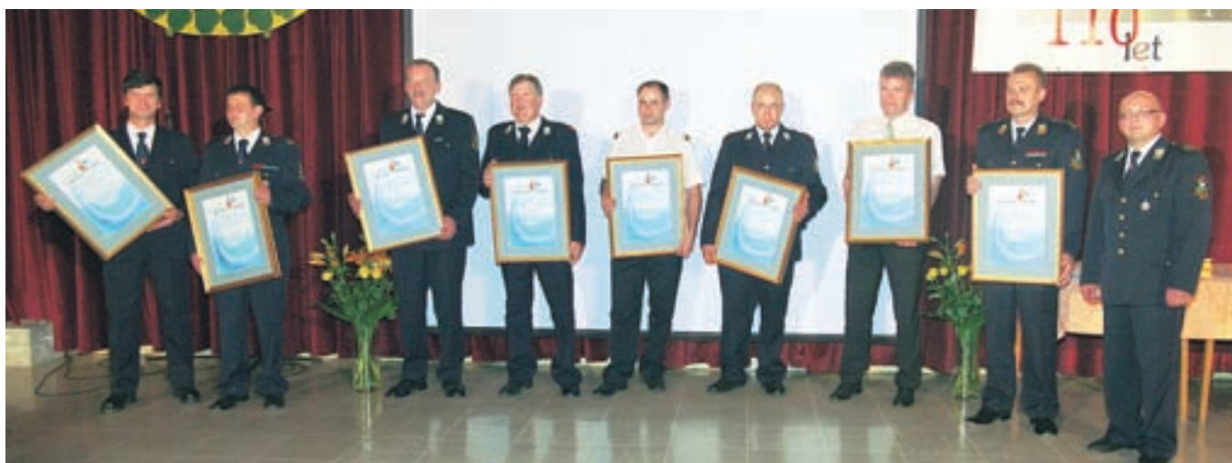
Ob 110-letnici PGD Gorenja vas so se s priznanji številnim zahvalili za sodelovanje.