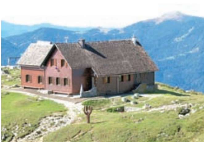
Krekova koča na Ratitovcu

Krekova koča na Ratitovcu je bila odprta vse vikende in praznike, od juna dalje pa vsak dan. "Obisk je kljub obilici slabega vremena ostal na lanskavi ravni, ki je bila nadpovprečna," je zadovoljen Lotrič. Gospodarski odsek se je zadnje leto posvečal pripravi dokumentacije za gradnjo čistilne naprave