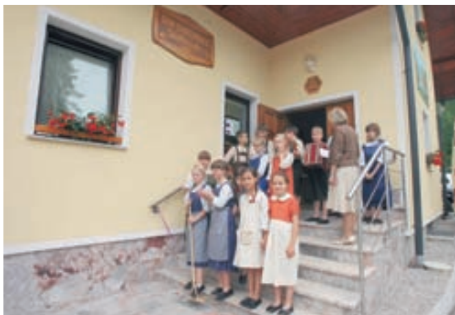
Na slovesnosti ob odprtju čebelarškega doma v Brodeh so nastopili tudi otroci iz osnovne šole Cvetka Golarja.