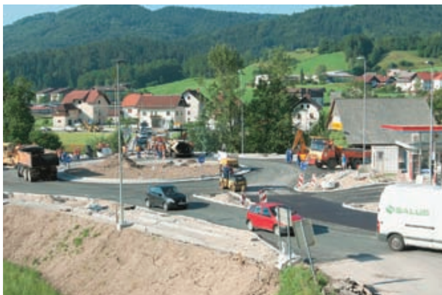
Prejšnji teden so v Gorenji vasi že asfaltirali krožišče.

”V preteklosti smo morali prenašati slabo voljo občanov, ki so zelo težko pričakovali spremembe prostorskih načrtov v občini. Pa vendar gre za zahteven dokument in predvsem zelo dolgotrajen, zapleten in nepredvidljiv postopek, zato smo toliko bolj zadovoljni in prav je, da se ve, da smo ga izpeljali med prvimi v državi. Večino predlaganih