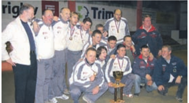
Odličnim balinarjem s Trate gre letos zlati občinski grb.

Danica Zavrl Žlebit, foto: Gorazd Kavčič, Tina Dokl