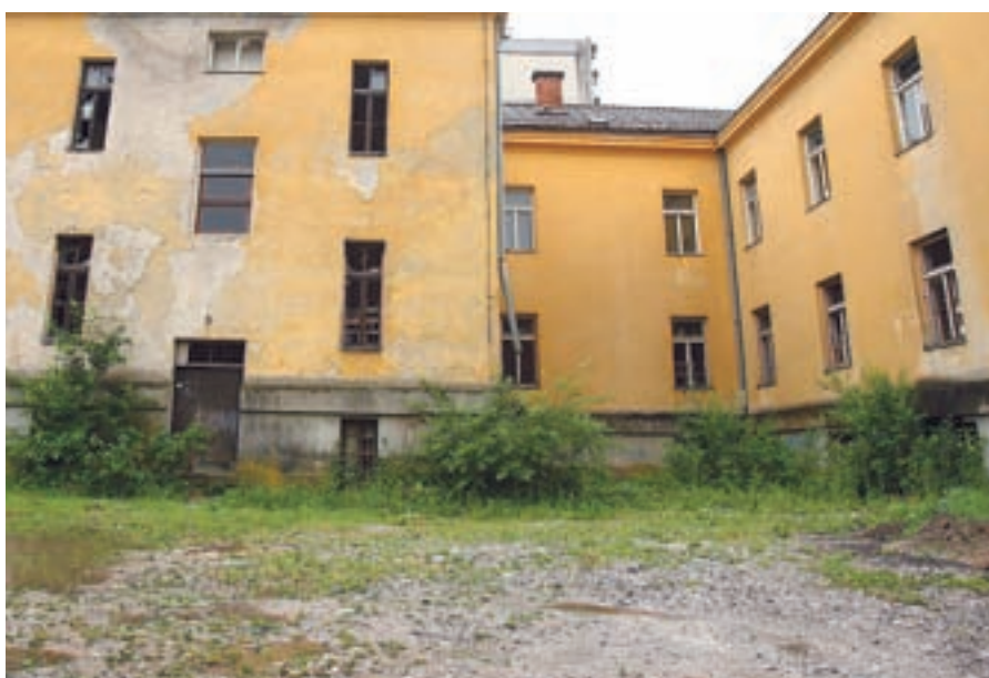
V Škofji Loki pripravljajo lokacijski načrt za vzhodni del nekdanje vojašnice.

ko še niso vključena), rešili bomo torej stanovanjski problem 25 družinam, kar je veliko število ob dejstvu, da je na listi 66 prosilcev. Občina je v sedanjem mandatu in od prejšnjega razpisa neprofitno stanovanje podelila vsem dotedanjim prosilcem z liste čakajočih, tako da smo jo povsem izpraznili. Ocenjujem, da stanovanjsko politiko vodimo dobro in brez kakršnega koli pompa.”