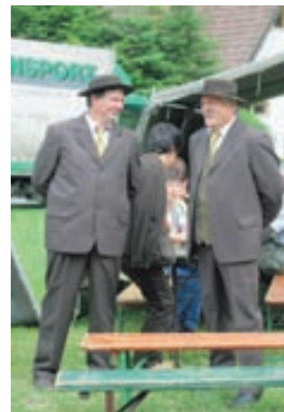
Čebelarja v svoji značilni noši s pokrivalom