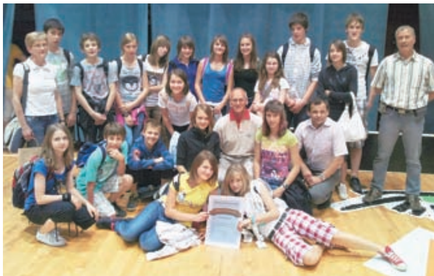
Na OŠ Železniki so ponosni, da so že drugo leto zapored najbolj športna slovenska šola.

Železniki - Osnovna šola Železniki je že drugo leto zapored osvojila prvo mesto na nagradnem natečaju Ministrstva za šolstvo in šport za najbolj športno osnovno šolo. Namen natečaja je promocija in popularizacija interesnih programov športa, zato je bistvena čim večja vključenost otrok vanje. "Vsi otroci so vključeni v programe Zlati sonček, Krpan in Naučimo se plavati, točke za najbolj športno šolo pa prinaša tudi sodelovanje v programih Interesna športna vzgoja po puku, Šolska športna tekmovanja, Hura prosti čas in drugi športni programi lokalne skupnosti. Naša šola ponuja pestro izbiro interes-