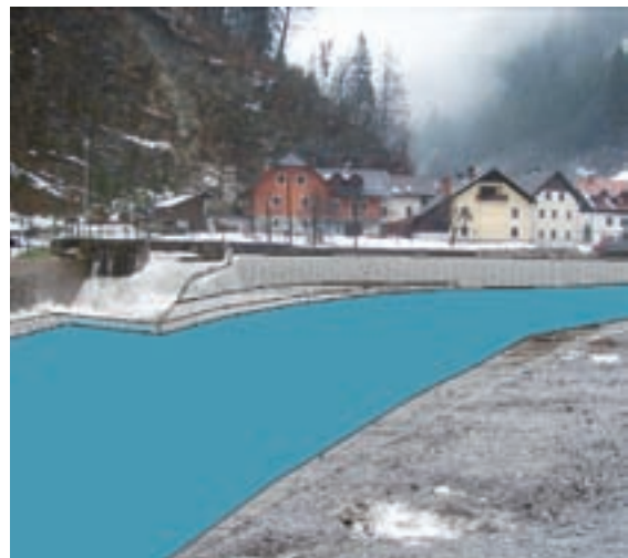
Dermotov jez bodo odstranili. Prestaviti ga nameravajo 400 metrov višje, visok bo le en meter.

"Katastrofalnih visokih vod pa ne moremo spraviti skozi Železnike, zato jih bo treba zadržati s suhim zadrževalnikom pod Sušo. Uspešno zadrževanje viška vode je možno le na območju med Jesenovcem in izlivom