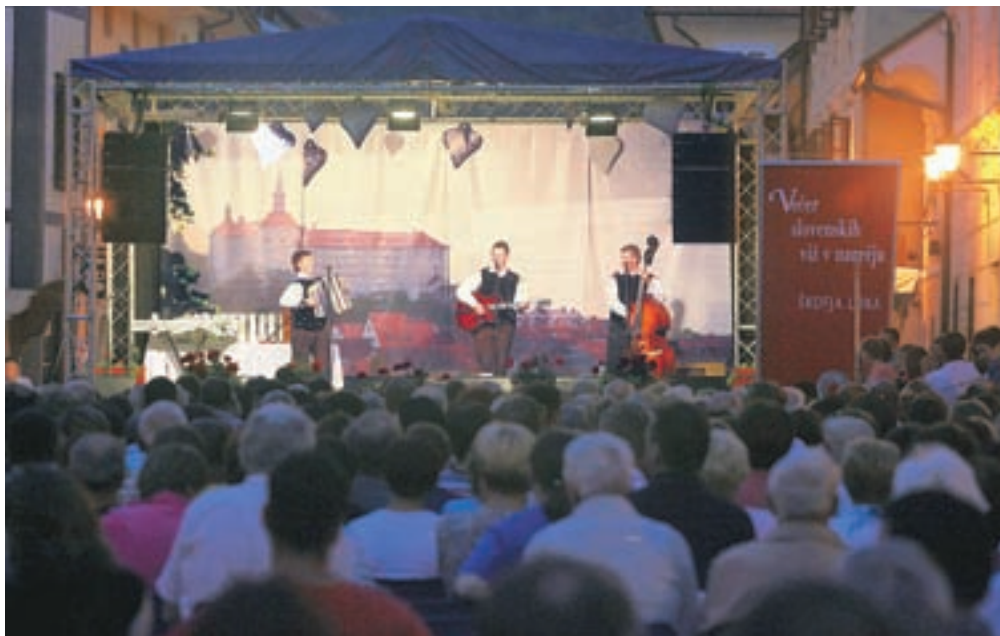
Občinstvo v Škofji Loki je najbolj navdušil Trio Šubic.