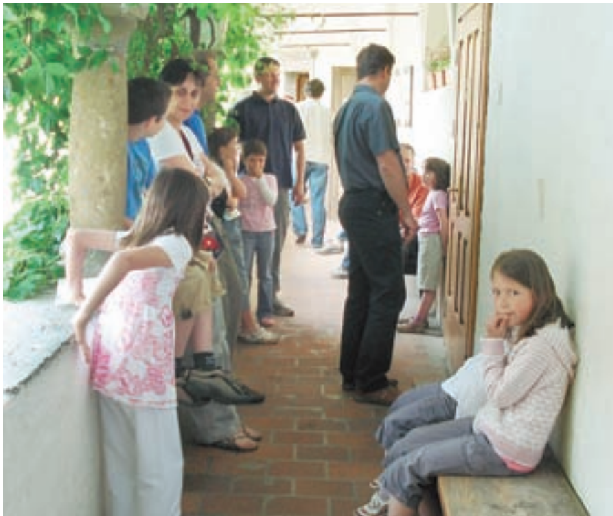
Na dan sprejemnih preizkusov je bilo pred učilnicami Glasbene šole Škofja Loka vseskozi zelo živahno.

Letos je v glasbeni šoli zaključilo šolanje petinšestdeset otrok, torej je bilo na voljo prav toliko mest za nove učence. Pri tem so otroci, ki so bili na sprejemnem preizkusu uspešnejši, seveda imeli prednost. Vse tiste, ki so pokazali dovolj glasbene nadarjenosti, a jim ni uspelo priti v razred zelenega instrumenta, so poskušali preusmeriti na druge instrumente, oziroma v šolski otroški zborček, ki ga bodo ustanovili v prihajajočem letu. Prav v zboru se otroci lahko zblížajo z glasbo in bodo zato lahko lažje poizkusili prihodnje leto. "Pogrešamo več zanimanja za