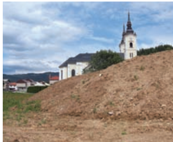
Na Polju je zaenkrat le navožena zemlja iz Lesc.

Na sedanjem igrišču so Alpinini nogometaši lahko do konca leta. Na njem se nogometnih veččin uči okoli 110 aktivnih igralcev, od starosti sedmih let pa do članov. S sedmimi mlajšimi selekcijami in članskim moštvom nastopajo v gorenjskih ligah, v klubu pa po-