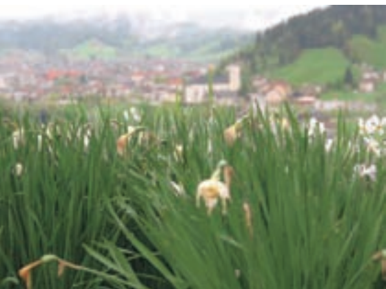
Poskusna fotografija za novo žirovsko razglednico naše fotografije Polone Mlakar Baldasin.

Turistično društvo Žiri in Občina Žiri sta pred tedni objavila fotografski natečaj na temo Žirovska razglednica. Teme natečaja so tri: Žiri z okolico v spreminjajočih letnih časih, običaji, obrt in dejavnosti na Žirovskem ter Arhitekturne znamenitosti in naravne posebnosti. Strokovna komisija bo ocenjevala predvsem kakovost in tematsko primernost za razglednice, torej fotografije, ki bodo Žiri turistom, pohodnikom in naključnim obiskovalcem predstavile v čim bolj učinkoviti in primerni luči. Avtorji lahko oddajo največ štiri fotografije na vsako temo. Natečaj je anonimen, avtorji jih morajo oddati do 24. januarja prihodnje leto, podeljene bodo tudi nagrade najboljšim. Podrobnejše informacije so na voljo na spletnih straneh žirovske občine. B. B., foto: P. M. B.