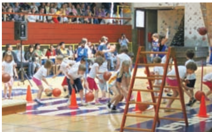
Na zaključni prireditvi projekta Leto športa so učenci pokazali tudi košarkarske veščine. Prav košarko trenira največ otrok na šoli, kar 82.