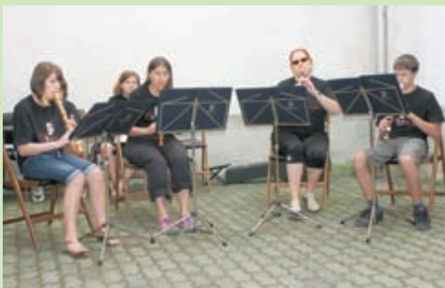
V atriju Rotovža smo poslušali tudi muziko, ki so jo iz kljunastih flavt izvabljali učenci iz razreda Mojce Zaplotnik.