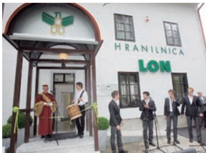
Prihod Hranilnice LON v Škofjo Loko je pospremil Mestni klicar, za lep prehod v poletje pa so poskrbeli fantje iz Tria Quartet.

V Škofjo Loko je priletel nov orel, Lonov orel, ki predstavlja bančništvo na Ljubezniv Oseben Način. Hranilnica LON je namreč prejšnji ponedeljek slovesno odprla novo poslovno enoto na Kapucinskem trgu v Škofji Loki in s tem mrežo poslovnih enot hranilnice povečala na enajst poslovalnic. Ob odprtju nove poslovalnice Hranilnice LON je že mestni klicar v uvodu povedal, da ni potrebno posebej poudarjati, da smo bili Gorenjci vedno poznani po umnem upravljanju z denarjem: "Rad smo ga skp spraulal, šparal, in če se je pokazala prilika tud kermu posodil. K tega posla nismo bli vajni, smo se odločil za hranilnce. Tud u Lok. S taka tradicija nadalujemo z odprtjem Hranilnice LON."