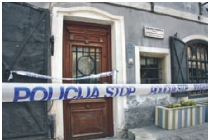
Rop lekarne na škofjeloškem Spodnjem trgu je še eden v seriji podobnih dogodkov v zadnjih mesecih.