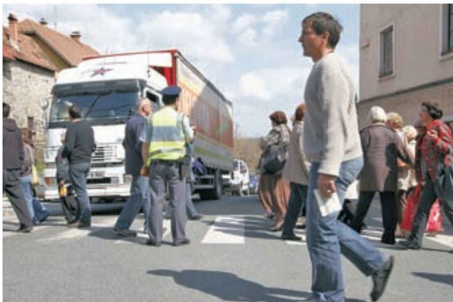
S protesta meščanov na Poljanski cesti

Jasno se je pokazalo, da meščani - tako kot praktično vsi Škofjeločani in okoličani - obvoznico želijo čim prej in da so njihovi domovi sedaj ogroženi. Čudi me tudi, da še ni bilo nobene odškodninske tožbe na državo zaradi slabih bivalnih razmer ob glavni cesti. Potrpežljivost nas Škofjeločanov je res brez primere. Sedaj, ko se izvedba projekta počasi, a nezadržno bliža, pa protest ocenjujem kot pozan, a dodaten in dobrodošel pritisk na pristojne državne službe. Čeprav mislim, da to ne bo ne pospešilo ne upočasnilo postopkov pri gradnji obvoznice. Ti namreč potekajo po svoji zapleteni kabinetni (u)pravni logiki, ki pogosto ne vidi resničnega stanja na