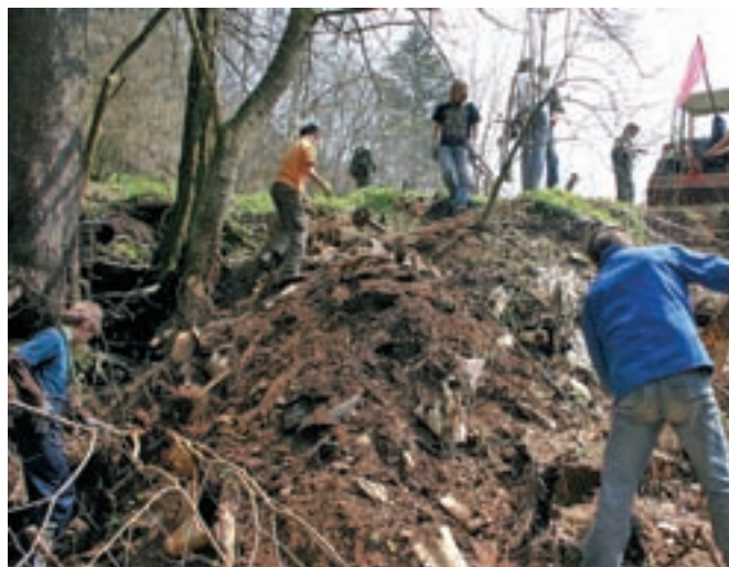
V Žireh so Slovenijo čistili številni občani, med njimi je bilo tudi veliko žirovskih tabornikov. Na sliki: taborniki pod vasjo Opale.