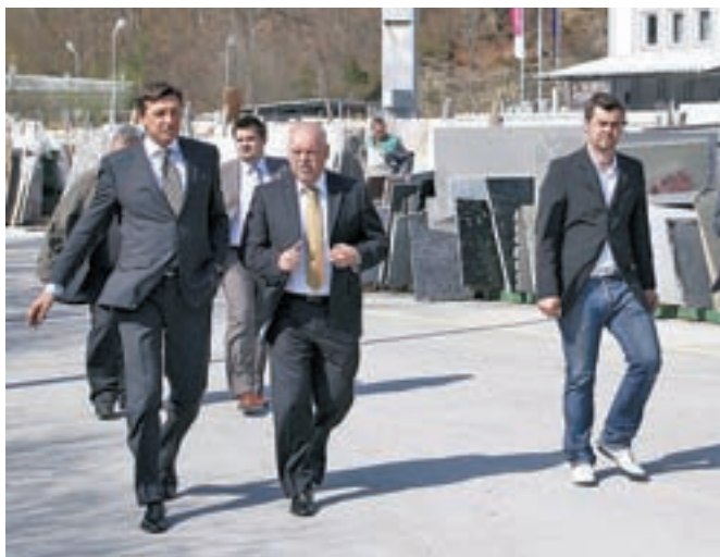
Premier Borut Pahor v enem od uspešnih gorenjskih podjetij, Marmorju na Hotavljah