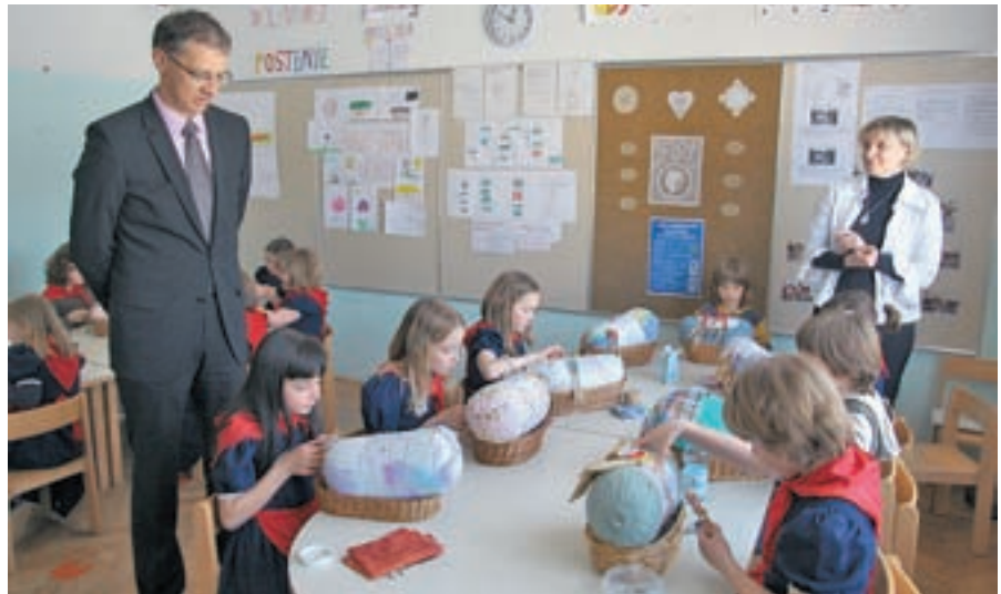
Minister Igor Lukšič je med vladnim obiskom na Gorenjskem obiskal tudi žirovsko osnovno šolo. Ogledal si je tudi mlade pri klekljanju.

”Občina je pripravljena poskrbeti za zemljišče v neposredni bližini sedanje lokacije, le ne-