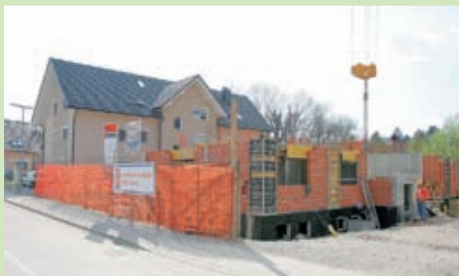
Gradnja stanovanjskih stolpičev v Virmašah se je že začela.