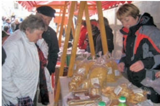
Na Salamiadi so se prvič predstavile tudi okoliške kmetije s kakovostnimi izdelki. Med njimi tudi kmetija Lužar s pekovskimi in kmetija Lojz z izdelki iz zelja in repe.

Javorč - Iz leta v leto Salamiada v Žirovskem Vrhu, ki jo organizira Turistično društvo Žirovski Vrh, privabi več obiskovalcev, organizatorji pa so tokrat pripravili še Tržni dan, kjer so se na stojnicah predstavili eko kmetije ali kmetije z dopolnilnimi dejavnostmi s kakovostnimi domačimi proizvodi (siri,