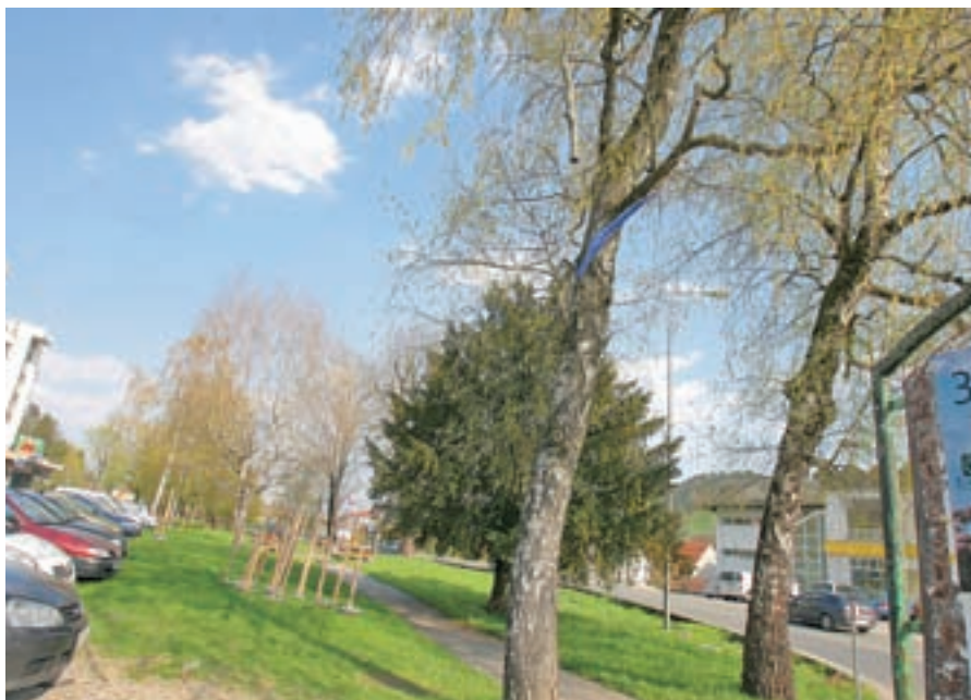
Nič še ne kaže, da bi izbrani izvajalec začel z deli na Kidričevi cesti.

občinskem zemljišču radi zgradili urejeno parkirišče za zaposlene v zdravstvenem domu, nato pa vzpostavili drugačen parkirni režim za obiskovalce zdravstvenega doma, kjer bi bil omejen čas parkiranja brez plačila in nadaljnji čas parkiranja za plačilo. S tem bi omogočili tudi bolj enakopravno dostopnost do zdravstvenega doma.