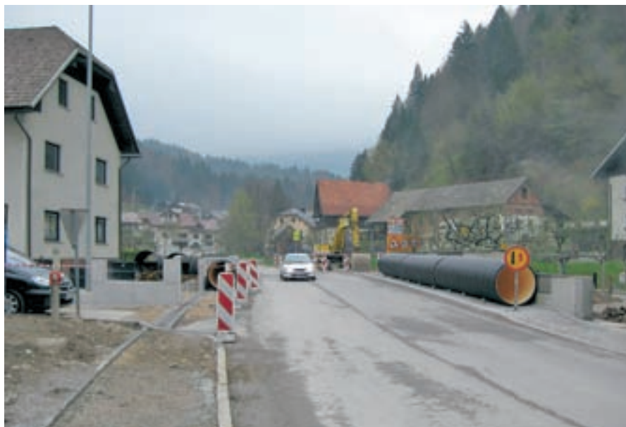
Gradnja regionalne ceste in pločnikov na Logu bo zaključena do konca junija.

”Država za letos načrtuje le ureditev ceste v dolžini 400 metrov, s čimer bo zaključena prva faza rekonstrukcije. So nam pa sporočili še, da je bila cesta v celoti projektno obdelana, k nadaljnji obnovi pa bodo pristopili v prihodnjih letih. Bojim pa se, da bo država zelo težko izpolnila obljubo, da bo nova cesta zgrajena do leta 2012. Naj ob tem dodam, da smo veseli, da vsaj rekonstrukcija regionalne ceste in gradnja pločnika skozi Log poteka