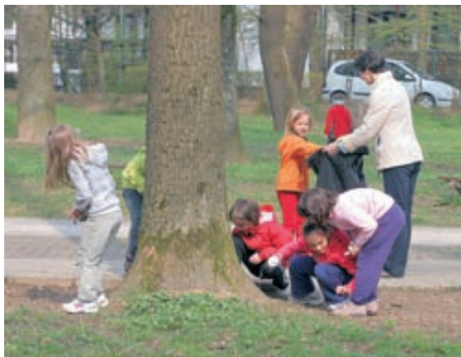
Otroci iz vrtcev so na vseslovenski čistilni akciji okolico vrtcev čistili v družbi svojih staršev in vzgojiteljev.