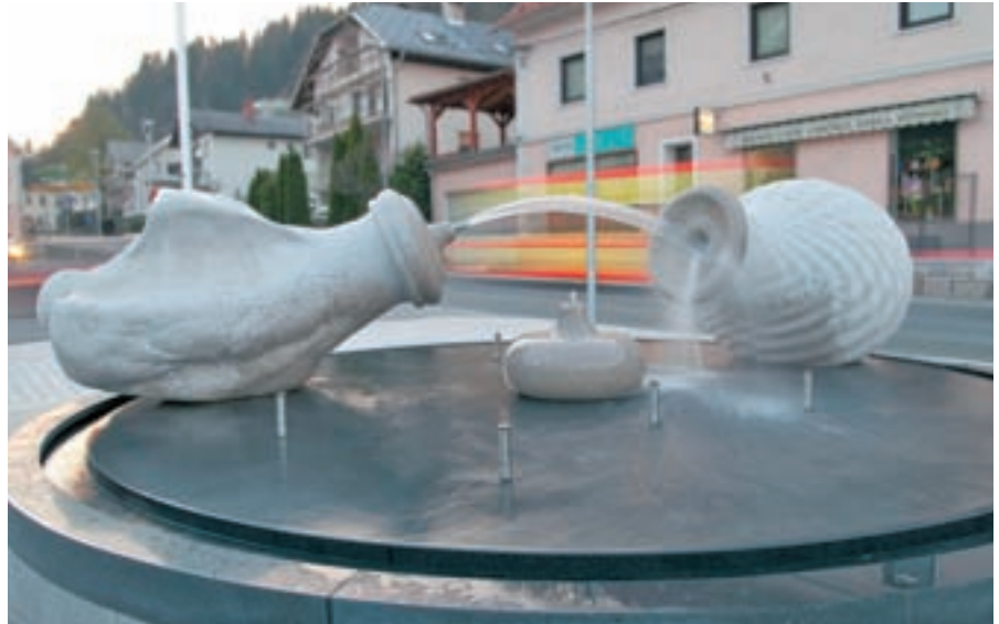
Fontana Metoda Frlica je že dobila ime - Vodnjak življenja - za vse najmlajše v občini.

”Pozdravljam tovrstne akcije, čeprav smo mi le prilagodili datume naših običajnih spomladanskih čistilnih akcij. Črnih odlagališč