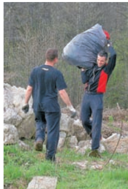
Nekateri svinjajo brez slabe vesti, drugi čistijo za njimi.

zaradi napačno odloženih odpadkov in da obstoječa zakonodaja nikakor ni več ustrezna! Podobno, kot kaže pri oskrbi z vodo tudi črna odlagališča obremenjujejo le lokalne skupnosti, ne pa tudi lastnikov oziroma tistih, ki odpadke odlagajo na črno. Vsekakor pa je hvalvredno je, da so se ljudje odzvali v tolikšnem številu, njihovo zavzetost in prostovoljstvo je treba pohvaliti. Bo pa potreben drugačen pristop do problematike smeti, da bodo takšne akcije resnično učinkovale oz. da te sploh ne bodo več potrebne. Sicer pa je tako, da tisti bolj ozaveščeni čistijo za tistimi, ki brez slabe vesti svinjajo. Zavest, da odpadki niso za v naravo, je še vedno prenizka, ravno zato, ker ni prave avtoritete, ki bi nekoga lahko kaznovala na mestu samem.”