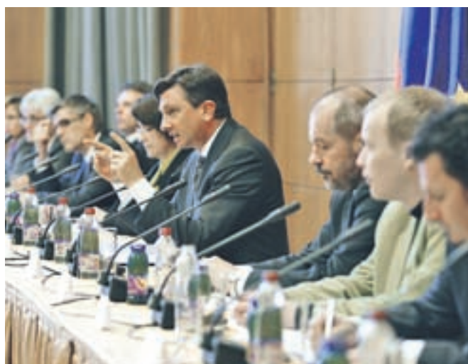
Vlada je po treh letih znova obiskala Gorenjsko, premierjevega in ministrskih obiskov je bilo deležno tudi škofjeloško območje.