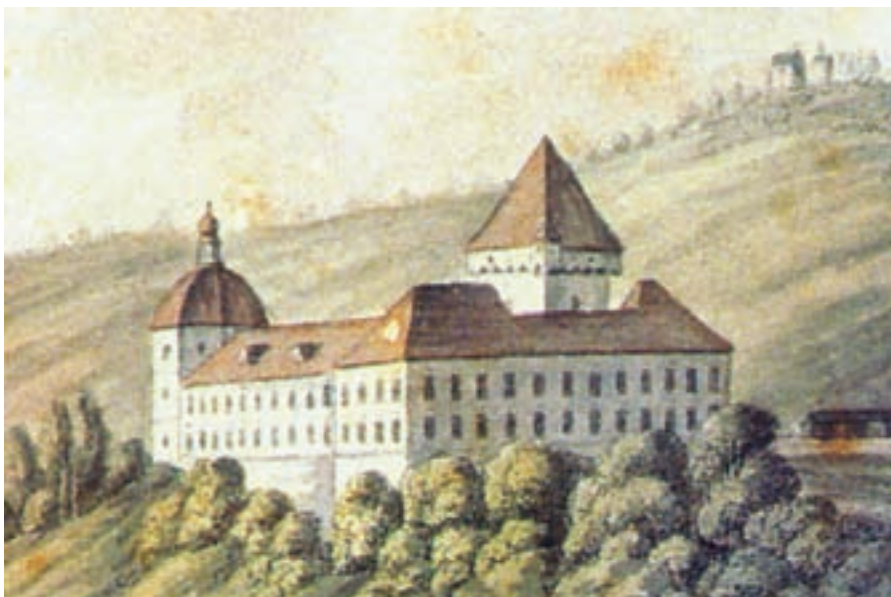
Tako je Loški grad izgledal kakih sto let kasneje, konec 18. stoletja.

"Rekonstrukcija zgodovinskega dogodka je vsekakor bolj okvirna: osebe, poskus približka kostumske in druge opreme, domnevna pot povorke itn. Vse drugo pa je nujno plod domišljije, ki pa vendarle temelji na zgodovinskih