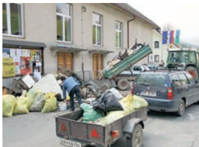
Čeprav na Hotavljah za urejenost vasi vsako leto skupaj stopijo vsi vaščani, so tudi v tokratni akciji nabrali veliko odpadkov. Med njimi je bil tudi manjši avto.