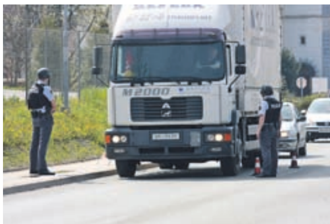
Policisti kljub cestnim blokadam in preletu helikopterja storilcev, ki sta pobegnila peš, še niso našli.