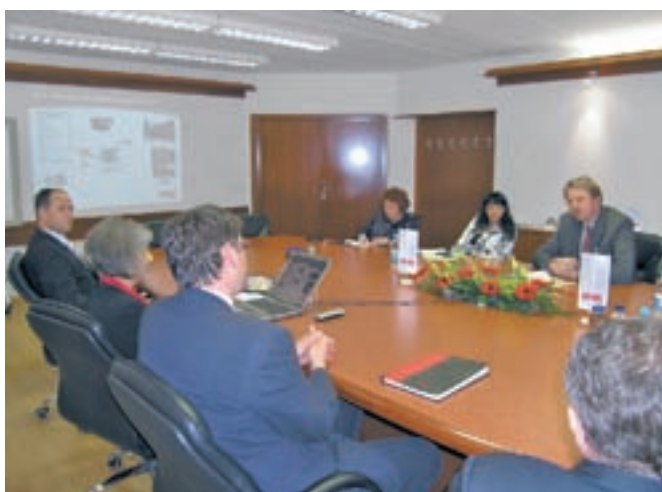
Z razvojnimi usmeritvami Domela se je seznanil Gregor Golobič, minister za visoko šolstvo. Dotaknil se je tudi vprašanja davčnih spodbud za večje vključevanje gospodarstva v razvojnih projektih.