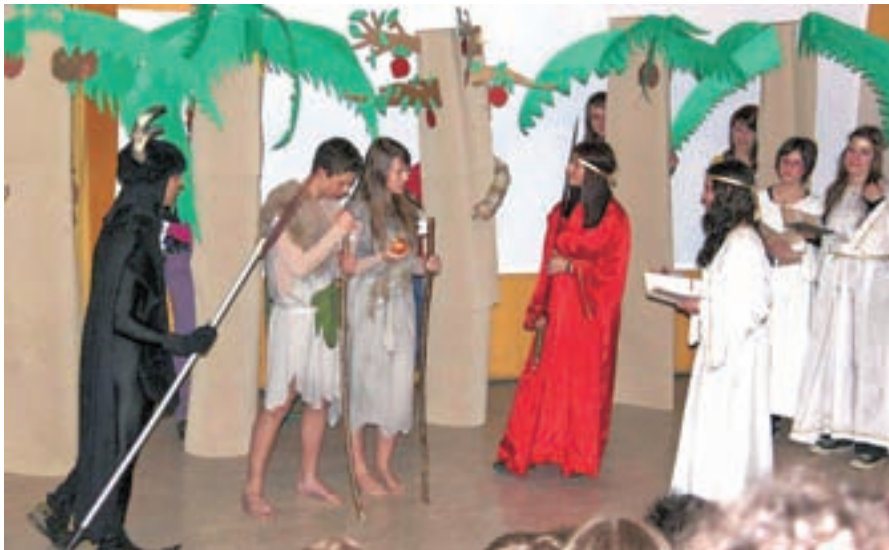
Škofjeloški Pasijon na Gimnaziji Škofja Loka - Adam in Eva v Raju

Glavna tema izmenjave pa je bil Škofjeloški pasijon. Z njim so se dijaki spoprijeli v