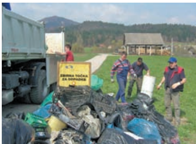
Občino Železniki je čistilo 650 prostovoljcev, kar je štirikrat več kot leto poprej. Akcijo sta koordinirala Mladinski svet in Krajevna skupnost Železniki. A. H.