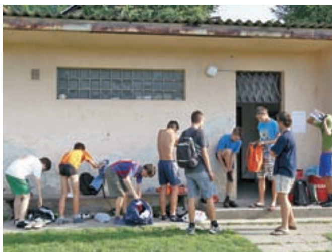
Dve dotrajani garderobi sta že nekaj časa premajhni za igranje višje kot v gorenjski ligi.