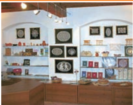
... in turistično poslovalnico, v kateri prodajajo ročno klekljane čipke in darilne izdelke, ki so primerni za različne priložnosti, kot so rojstni dnevi, poroke.

Poletje se sicer počasi bliža koncu, a če ste si zaželeli vodnih užžitkov, je pravi odgovor za vas bazen v Železnikih, ki ga bodo po opravljenih vzdrževalnih delih znova odprli prvega septembra. Uživanja v vodi, ki je kristalno čista in primerno ogreta, bodo še posebej veselili otroci. V bazenu, velikem 10x25 metrov, se boste lahko osvežili in razgibali tudi odrasli. Poleg plavanja boste imeli možnost vaš čas izkoristiti tudi za obisk savne, fitnesa, balinanje in igranje tenisa na bližnjem igrišču.