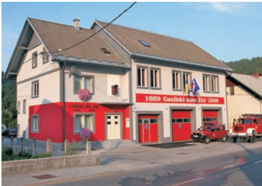
Obnovljeni dom PGD Žiri z njihovima voziloma. Tovornjak cisterne naj bi prihodnje leto zamenjali.

Gasilski dom v Žireh je danes kot iz škatlice, obnovljena so okna, garažna vrata, električna inštalacija, stene so pobeljene, najbolj opazna je obnova fasade. Kljub trdemu delu so vsa letošnja usposabljanja opravili po načrtih, manjkale so le organizacije meddruštvenih vaj. Med gasilci je tudi 40 mladih, ki