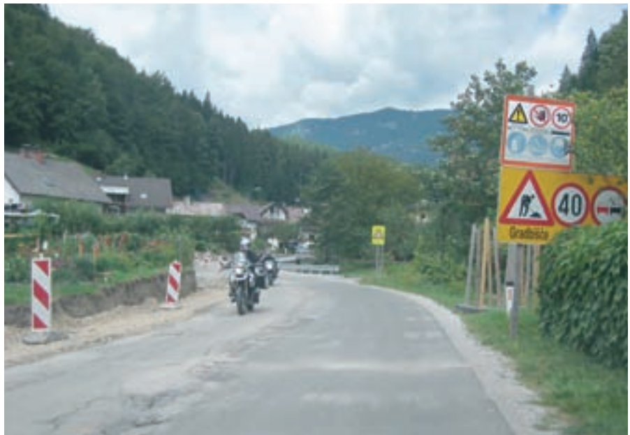
V Logu se nadaljuje rekonstrukcija ceste z gradnjo pločnika.

”Občinske ceste že asfaltiramo. Asfalterji so se pred dnevi mudili v Dolenji vasi, ki se resnično lahko pohvali z urejeno komunalno infrastrukturo, saj smo letos zaključili še z gradnjo sekundarne fekalne kanalizacije. Ker vodi v glavnem potekajo po javnih poteh in lokalnih cestah, so bile potrebne nove asfaltne prevleke. Še pred asfaltiranjem je Tritel, izvajalec projekta širokopasovnega omrežja elektronskih komunikacij, v celotnem naselju Dolenje vasi položil optični kabel. Podobno se dogaja v Selcih na Klincu, kjer smo letos zgradili sekundarno fekalno kanalizacijo. Prav tako smo v preteklem tednu z asfaltiranjem parkirišča na Prtovču izboljšali pereč problem parkiranja planincev, ki je povzročalo velike težave domačinom. Ta projekt je financiralo tudi Planinsko društvo za Selško dolino, ki skrbi za kočjo na Ratitovcu in urejanje planinskih