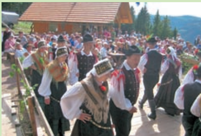
Srečanje z razgledom vsako leto privabi več obiskovalcev.