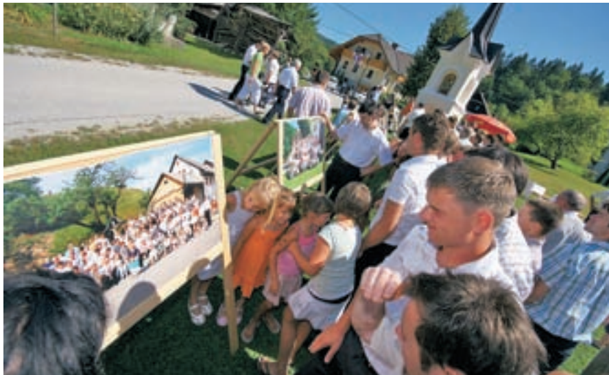
Pred časom se je kar 420 (skupaj jih je le nekoliko več) Hotaveljcev nastavilo fotografskemu objektivu. Na Semanji dan so fotografije pokazali javnosti.

Tako ali tako ni pametno zobati češenj z vaščani, ki so tako povezani, da spomladi povsem očistijo Hotavlje, potem pa se dogovorijo za skupno slikanje in jim to tudi uspe! Na štirih fotografijah, ki so jih prikazali drugi dan, se je slikalo več kot štiristo Hotaveljcev, morda le deseterica pa na slikah iz takšnih ali drugačnih razlogov manjka. Fotografije so prvič prikazali na Semanji dan po deseti maši, ko so jih 'nastopajoči' lahko tudi naročili.