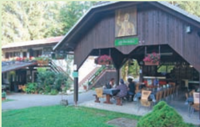
Gostilna in penzion Rezka sprejme tudi večje skupine in zaključene družbe, imajo pa tudi prostor za piknik.

Gostilna in penzion Rezka je blizu mesta, a odmaknjena od vrveža. Mimo vodijo kolesarske in pohodniške poti, tudi tematska pot Po sledah Rupnikove linije, tako da lahko izlet v naravo združite z obiskom Gostilne in penziona Rezka, kjer vas s svojo ponudbo zagotovo ne bodo razočarali.