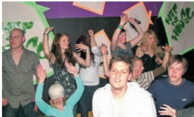
Ne le delo, mladi se morajo tudi zabavati.