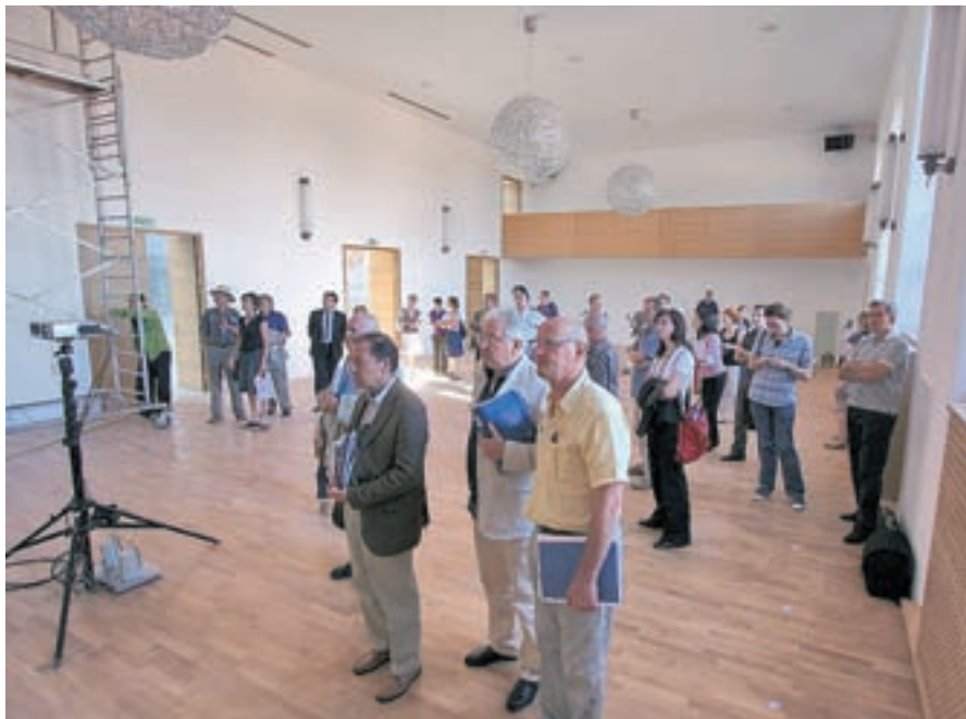
Udeleženci prve mednarodne konference ob ogledu Sokolskega doma.