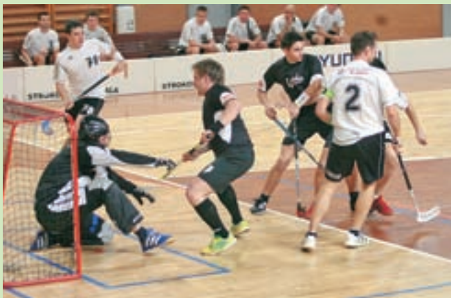
V Škofji Loki ni ledenih dvoran, zato pa je popularen dvoranski hokej, v katerem so člani InSporta tudi državni prvaki.