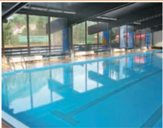
Bazen v Železnikih vas znova pričakuje po prvem septembru.

Dnevi so še vedno prijetno topli, izkoristite pa jih lahko tudi za obisk bazena v Železnikih, ki s septembrom znova odpira svoja vrata.