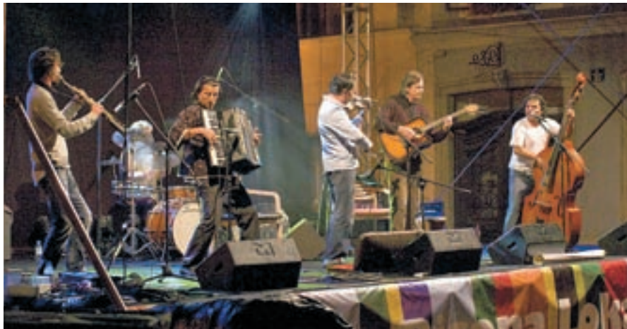
Na prvem koncertu je nastopila skupina Langa.