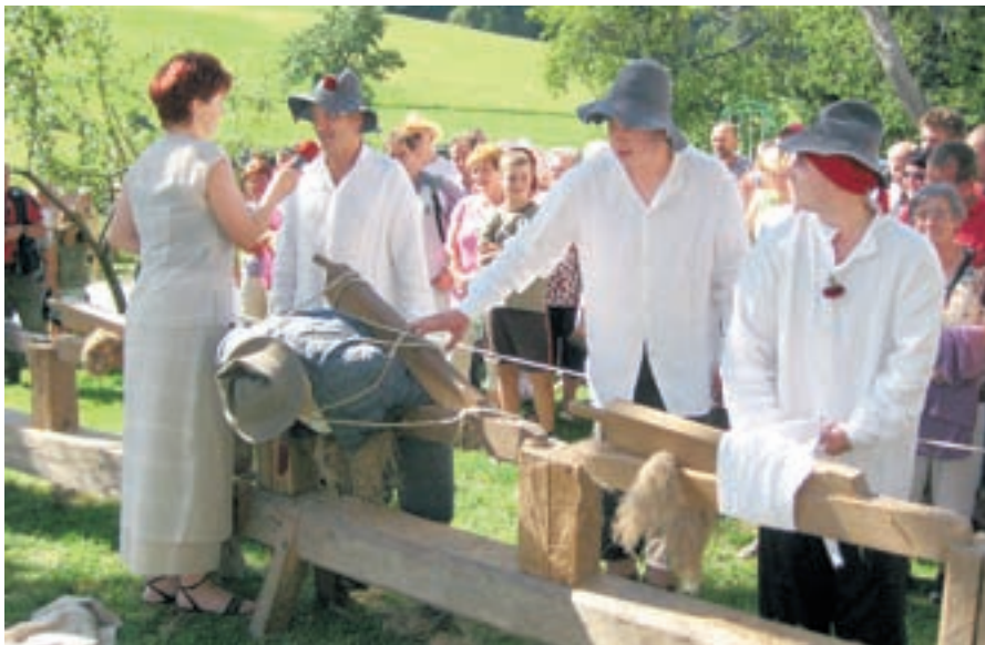
Davški fantje so tudi letos tericam pripravili slamnatega moškega.

Predelava lanu je sicer v Davči zamrla v 60-tih letih prejšnjega stoletja, pri Vrhovcu pa ga zdaj posejajo le še za potrebe Dneva teric. Tako so tudi letos v sklopu etnografskega dela prireditve na njivi prikazali puljenje lanu in vezanje v snopke, ki so jih nato osušili v laneni jami. Trenje lanu je tericam tudi tokrat šlo dobro od rok, čeprav so jim vaški fantje kot ponavadi ponagajali in terici, ki se ni kaj dosti zmenila za fante, pripravili slamnatega moškega. Obiskovalci so z zanimanjem spremljali tudi druge postopke, ki so potrebni, da iz lanene bilke dobimo platno: mikanje, s katerim dobro predivo ločimo od slabe-