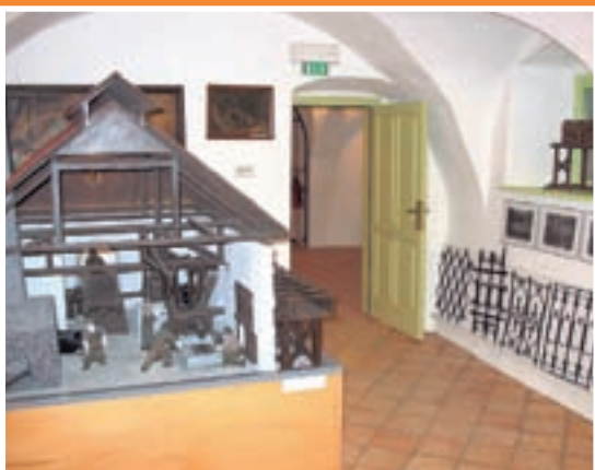
V Železnikih obiščete tudi muzej ...