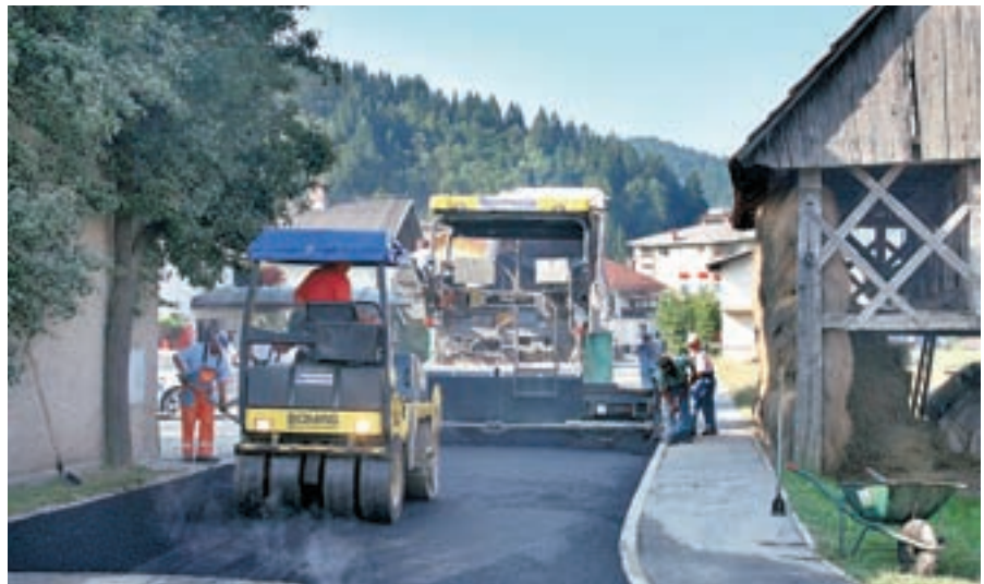
Prejšnji teden so asfaltirali in uredili nov del Jezerske ceste v Žireh. Kdaj bo urejena celota?

”Z veliko zamudo smo julija s strani države prejeli obljubljen denar, ki bi moral biti sicer