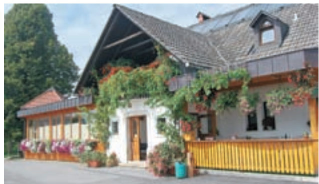
Gostilna Pri Boštjanu je poznana po domači slovenski kuhinji.

V Gostilno Pri Boštjanu se gostje radi vračajo, v prvi vrsti seveda zaradi dobre hrane in pijače, je pa gostilna tudi zanimiva izletniška točka, saj mimo nje vodijo sprehajalne in kolesarske poti. Združite prijetno s koristnim. Odpravite se na izlet na Križno Goro in se pustite razvajati ob dobrotah, ki vam jih postrežejo v Gostilni Pri Boštjanu. V poletnih mesecih imajo odprto tudi teraso s prekrasnim razgledom na celotno verigo Kamniških Alp, na Kranj, Škofjo Loko in Ljubljano.