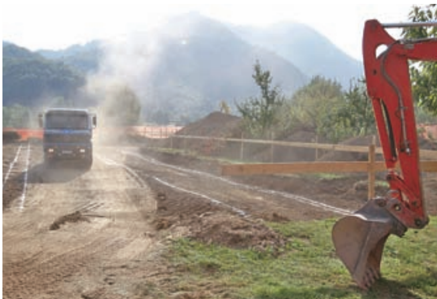
Ob vrtnicu Najdihojca pripravljajo teren za postavitev mobilnega vrtnice.

"Veliko je že narejenega, tako da bi jo lahko do letošnjega 1. novembra že predali svojemu namenu. Hkrati pa na pokopališču urejamo nova grobna polja in obenem urejamo tudi centralno pokopališče, kamor se bo, ko bo urejeno, dalo prekopati tudi posmrtno ostanke udeležencev NOB. Kostnico urejamo v sodelovanju z državo (gre za objekt regijskega pomena), ostalo pa bomo prispevali iz občinskega proračuna."