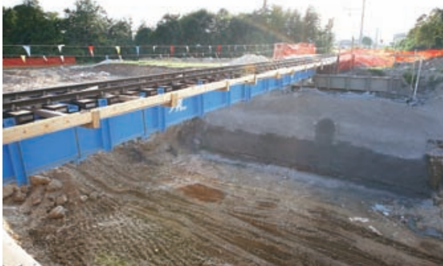
Začeli so kopati za podvoz pod železniškimi tiri na Trati.

cestni odsek od spodnje postaje žičnice za Stari vrh proti zadnji kmetiji v loški občini. Zelo odmevno pa je gradbišče na državni cesti skozi Reteče, kjer nekatere ljudi motijo zgrajeni otoki na cestišču in jih imenujejo kar "arhipelag". Tiste, ki jim gre takšno umirjanje prometa najbolj v nos, bi vprašal, ali bi bili enako sarkastični, če bi morali njihovi otroci vsak dan čez tako nevarno cesto. Naj spomnim, ravno na tem odseku je že prihajalo do hudih nesreč. Vse rešitve, ki jih država predlaga na tej cesti, tudi nam niso najbolj všeč - denimo rešitev kolesarske poti."