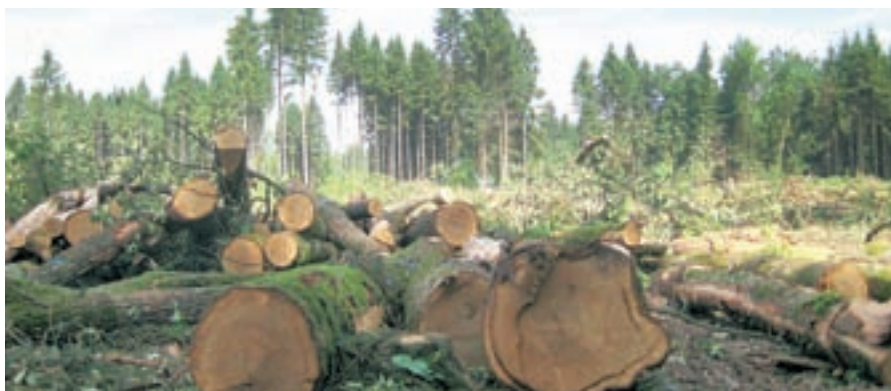
Avgusta sta pri spravilu lesa na območju občine Železniki umrla dva moška (slika je simbolična).

Lahko se dolgočasite. Lahko razmišljate. Lahko pa berete Gorenjski glas.