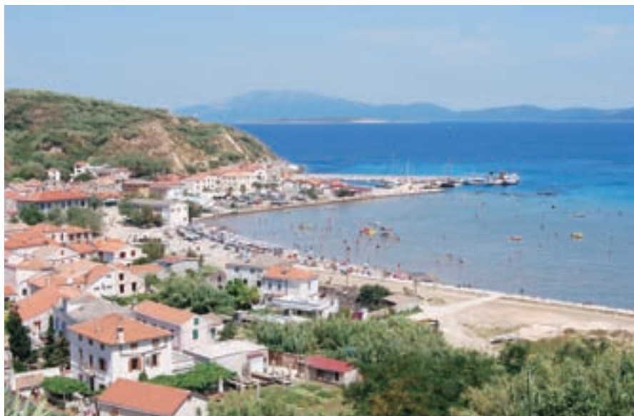
Otoška skupina Lošinj zajema tudi manjše otoke. Zelo znan je Susak, otok iz mivke.

”Seveda. Zanimivi za ogled so tudi manjši okoliški otoki. Susak je edini otok iz mivke na tem delu arhipelaga. Pravijo, da je mivko sem nanese tok iz Italije. Znan je tudi po posebni narodni noši, po prvem mini krilu v zgodovini, ki ima sedem podkril. Zelo dobro imajo vino. Sicer pa se je veliko prebivalcev otoka preselilo v Ameriko, a so kljub temu z njim ostali močno povezani. Pomagajo tudi finančno in s humanitarno akcijo so v bolnišnici v Malem Lošinju opremili rentgenski oddelek in prispevali denar za nakup ultrazvoka za pregled kolkov pri novorojenčkih. Drugi otok je Ilovik, ki mu pravimo otok cvetja. Unije so otok oliv. Srakane pa so skoraj že zapuščene in tam živi le še nekaj ljudi.