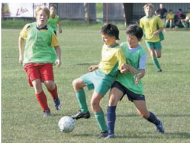
Zanimanja mladih za nogomet je v Škofji Loki dovolj, žal pa so pogoji vsako leto slabši.