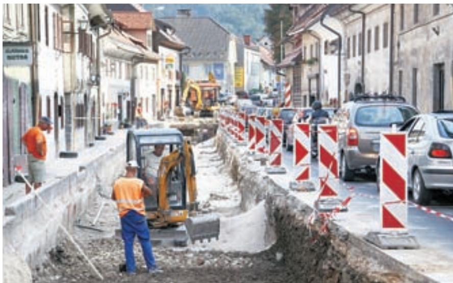
Na Spodnjem trgu obnavljajo vodovod.

”Odlagališča odpadkov v Škofji Loki skladno z odločitvijo državnega programa o ravnanju z odpadki ne bo več. Vse štiri občine lastnice so deponijo dolžne ustrezno sanirati. Izvedli smo že tudi javni razpis in pridobili izvajalca sanacijskih del, kar smo storili zelo hitro. Najdlje je pravzaprav trajalo, da je ministrstvo za okolje in prostor dokončno potrdilo program sanacije, tudi zaradi tega, ker niso vedeli, kako se bomo na Gorenjskem odločili