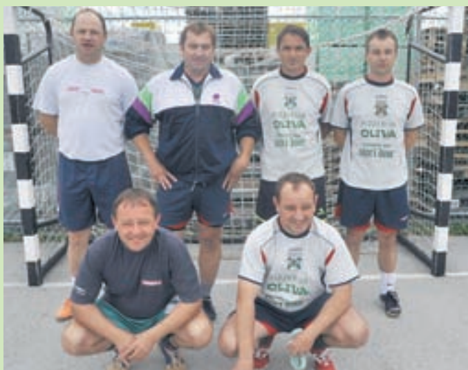
Domača ekipa veteranov Stripyja od Svetega Duha je na turnirju osvojila tretje mesto.