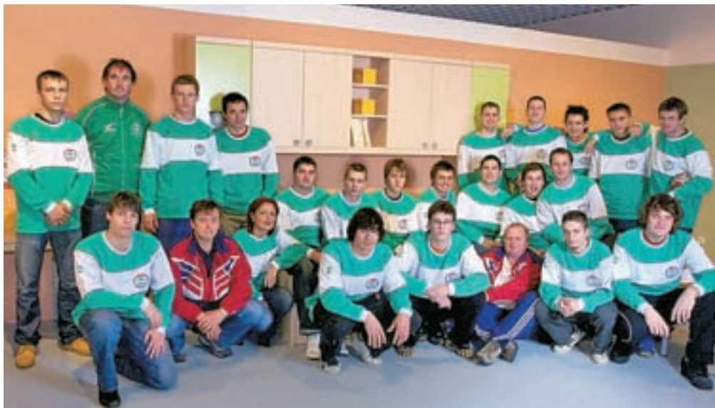
Vodstvo društva in članska ekipa, ki je v sezoni 2008/2009 dosegla največji uspeh moškega rokometista v Železnikih.

Železniki - Rokometiši članske ekipe Alplesa so minulo sezono prvič igrali v 1. B ligi in v družini dvanajstih ekip na koncu osvojili odlično 6. mesto. Tak je bil tudi njihov cilj, čeprav bi z zmago na zadnji tekmi, ki so jo igrali doma z ekipo iz Grosupljeva, osvojili celo četrto mesto. "A tak je šport - klub veliki želji, borbenosti in prizadevanju, vedno ne moreš biti uspešen, kajti enake želje ima vedno tudi tvoj nasprotnik," pravijo v Železnikih, kjer si v upravi društva prizadevajo, da bi vsi skupaj čim bolj opravili svoje delo. Strategija Rokometnega društva Alples izpred