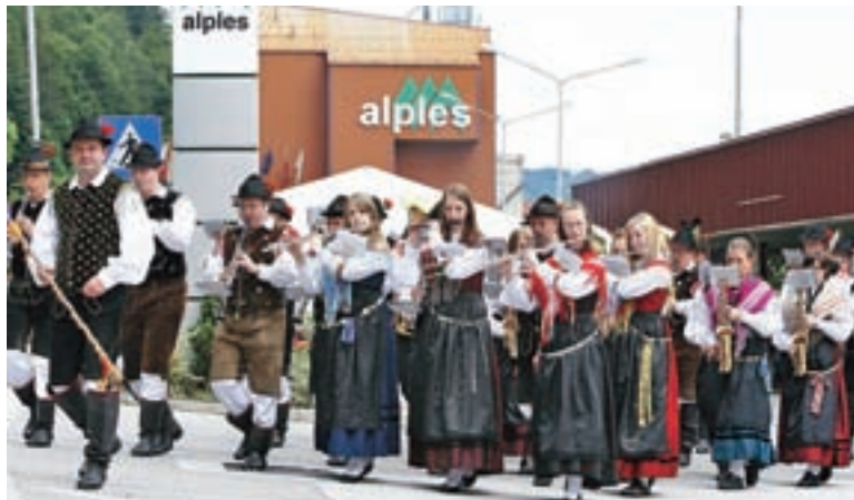
Pihalni orkester Alples Železniki letos praznuje 30-letnico delovanja.