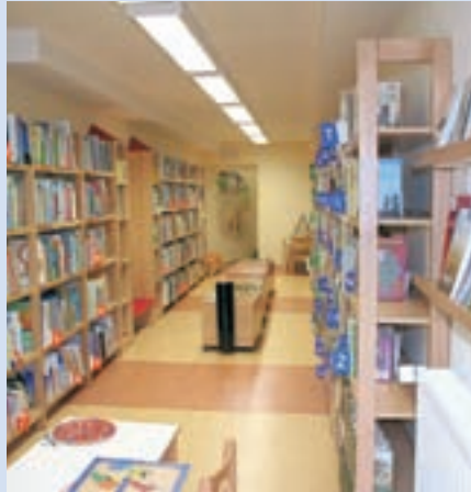
V prenovljenih prostorih knjižnice v Železnikih je danes med 10. in 19. uro dan odprtih vrat.

V začetku junija je tudi krajevna knjižnica v Sovodnju zaživela v novih prostorih v mansardi podružnične šole. Investicijo, vključno z opremo, je pokrila Občina Gorenja vas-Poljane. "Prostor na dobrih tridesetih kvadratnih metrih je prijeten in na novo opremljen, tako da si zares zasluži ime knjižnica. Formira se tudi stalna zbirka knjig, nekaj pa jih imamo iz t. i. potujoče zbirke. Poleg tega bo knjižničarka na tri mesece hodila v knjižnico v Gorenjo vas po knjige, za katere predvidevamo, da bodo brane. Na voljo je sicer veliko otroške literature ter slovenskega in tujega leposlovja za odrasle," je