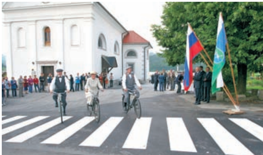
S cesto Gidor-Osnovna šola Ivana Tavčarja Gorenja vas so v občini poskrbeli za varnost osnovnošolcev in občanov, ki prihajajo v zdravstveni dom in cerkev.

Približno 560 tisoč evrov pa je stala naložba v zagotavljanje varnosti gorenjevaških