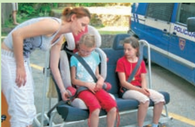
Pravilno pripenjanje varnostnega pasu v pravilnem sedežu je zelo pomembno za varnost v prometu.