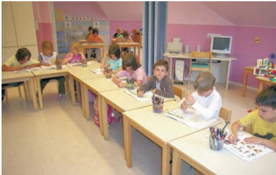
Novih učilnic so se najbolj razveselili šolarji.