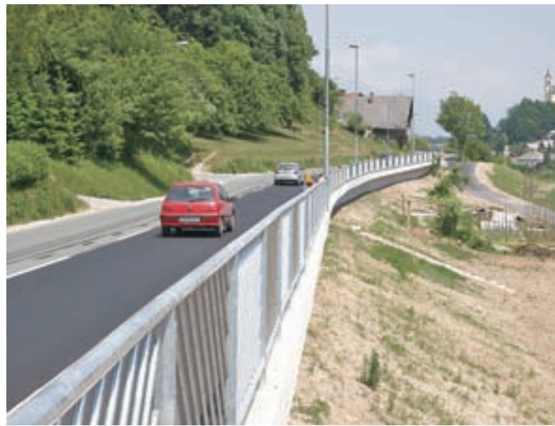
S poljske strani urejena cesta s pločnikom