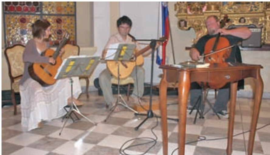
Skupina Tantadruj je z uglasbitvami Prešernovih pesmi zadela v polno.