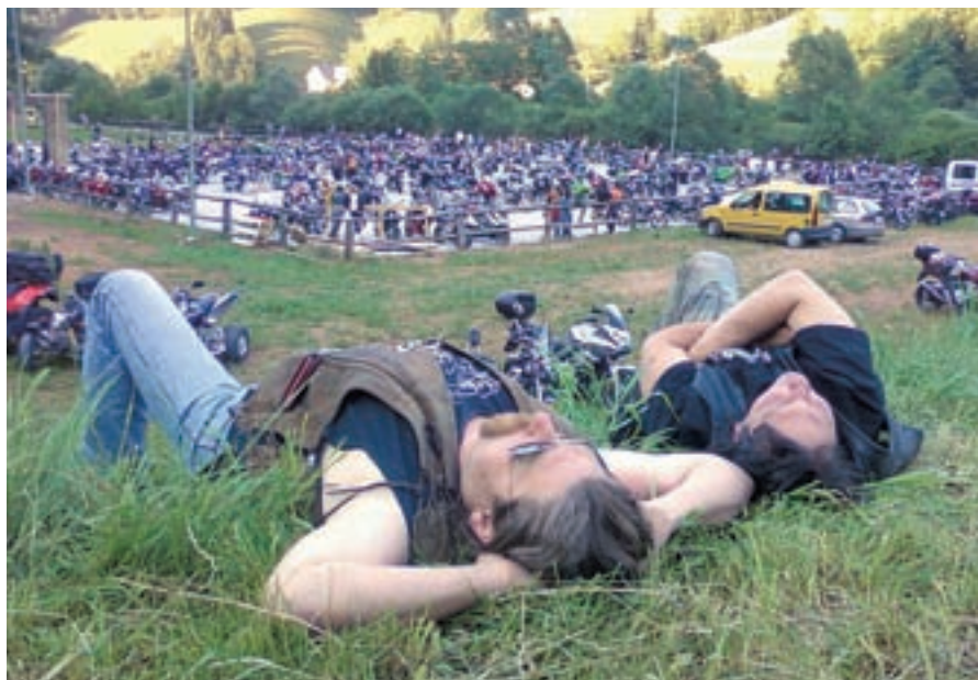
Letošnje srečanje motoristov v Žireh je bilo v lepem sončnem vremenu.

kolesih iz vseh koncev Evrope, tudi iz Anglije, Belgije, Nemčije, Poljske ter seveda domači motoristi. Pripravili smo jim tradicionalne igre, piknik in seveda zabavo z glasbo," je povedal predsednik Roli, ki je skupaj s še 45 člani kluba ter prijatelji in sorodniki motoristov, pripravil prijetno druženje. V. S., foto: Polona Mlakar Baldasin