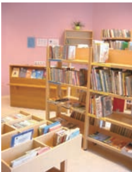
Prijetne in lepe prostore je pridobila tudi podružnična knjižnica na Sovodnju.