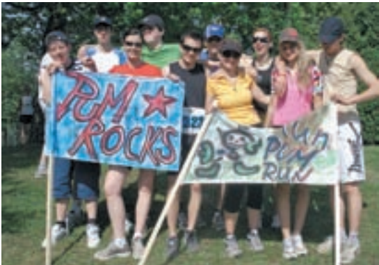
Zadovoljna ekipa proslavlja uspešno pretečenih deset kilometrov v Radencih.

Mladi, ki so se pridružili programu, so resnično presegli sami sebe na Maratonu treh src v Radencih, kjer so skupaj z mentorji pretekli desetkilometrsko razdaljo. A sam