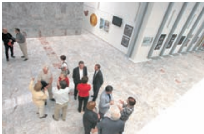
Razstavišče v vhodni avli.