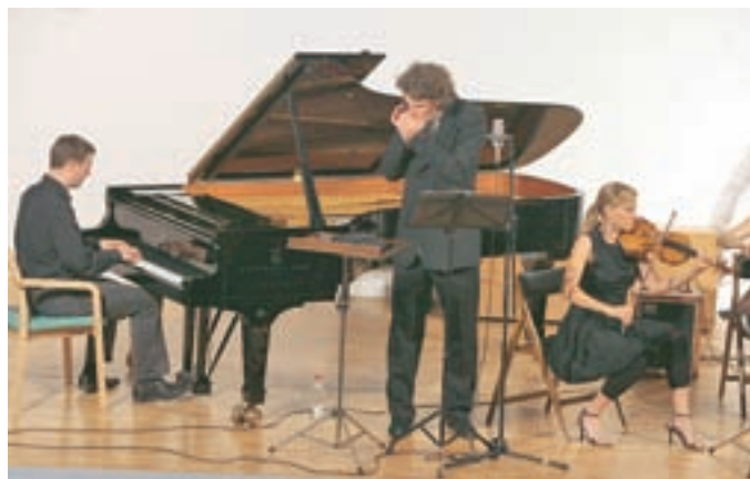
S koncerta Porgy and Bass