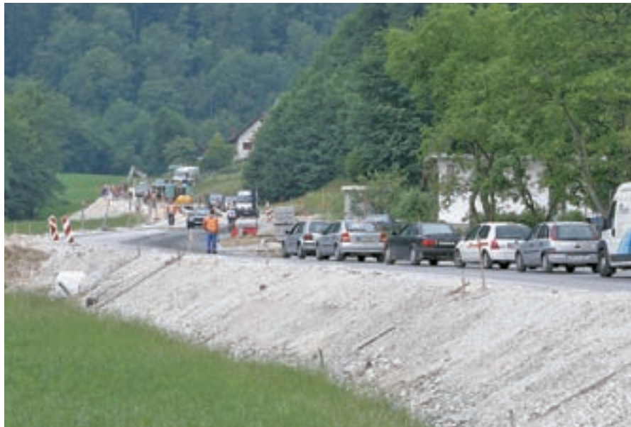
Po prazniku na selški vpadnici ne bo več gneče.

”Starši so v stiski, ker je bilo za jesen odklonjenih 167 otrok v loških vrtcih, in ker ni možnosti za hitrejšo rešitev prostorskega problema, smo se na občini odločili probleme