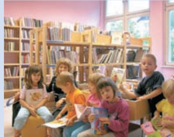
Mladi bralci so navdušeni nad novimi prostori Krajevne knjižnice Sovodenj v mansardi podružnične šole.