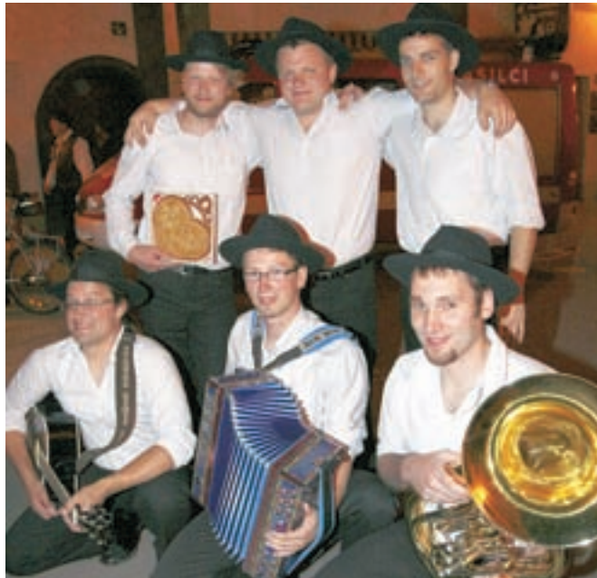
Večer narečnih viž je bil Štedientom pisan na kožo, saj ustvarjajo v narečju.