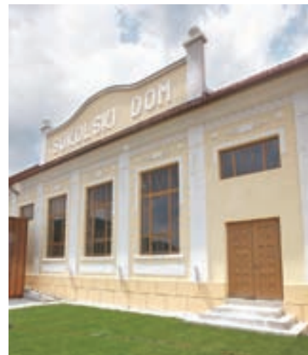
Znova odprt Sokolski dom