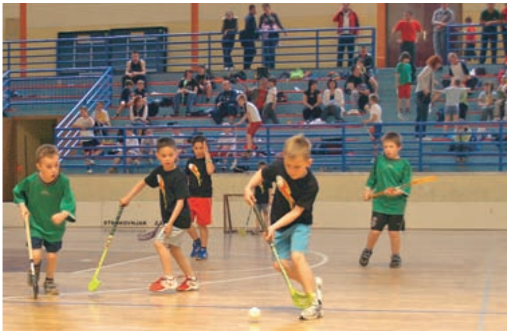
Mladi v Škofji Loki in obeh dolinah radi igrajo dvoranski hokej, zato se za bodočnost tega športa ni bati.