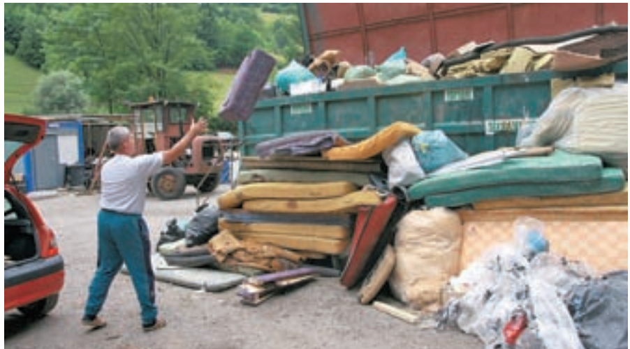
Odlaganje kosovnih odpadkov v sortirnico Osojnica je dovoljeno le v času uradnih ur, gradbeni odpadki pa na Pustotnik ne sodijo več.

”Projekt ureditve centra Žirov sovpada z rekonstrukcijo križišča in gradnjo novega mostu preko Račeve. Bencinsko črpalno naj bi prihodnji mesec porušili, z Direkcijo RS za ceste pa skupaj pripravljamo projekt ureditve križišča z obnovo mostu, v sklopu tega pa bomo selili tudi obstoječo avtobusno postajališče pred občino na ustrežnejšo lokacijo. V teh dneh naj bi bil objavljen tudi javni razpis za izbiro izvajalca del, vendar smo nalteli na probleme pridobivanja soglasij lastnikov zemljišč, kar na žalost v Žireh postaja običaj. Zaradi tega ne morem napovedati začetka gradnje, v vsakem primeru pa so pred-