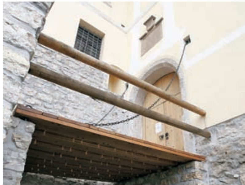
Za praznik tudi nov dvizni most na grajskem stolpu

Doslej smo namreč vedno zagotavljali, da noben otrok ni ostal zunaj vrtca, kar pa nam ne prinaša nobenih točk na prednostni lestvici države.”