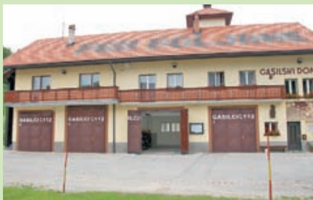
Ker je bila cisterna v nesreči povsem uničena, je ena od garaž v gasilskem domu na Poljanah odslej prazna.

Kot poroča policija, je 45-letni gasilec na odseku, kjer vozišče poteka po blagem klancu navzdol v levi pregledni ovinek, zapeljal desno na utrjeno bankino, tam sunkovito zavil levo čez vozišče, nato pa zapeljal na strmo travnato pobočje, kjer se je cisterna začela prevračati in se po približno 180 metrih ustavila na boku. Med prevračanjem so trije gasilci, med njimi tudi šofer, padli iz vozila, četrti gasilec pa je ostal v vozilu. Voznik je bil huje ranjen, sopotniki, dva osemnajstletnika in 27-letnik, pa lažje. Voznika in osemnajstletnega sopotnika so reševalci odpeljali v Klinični center v Ljubljano. Na vozilu je po nestrokovni oceni nastalo za 125 tisoč evrov gmotne škode. Simon Šubic