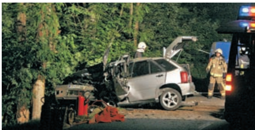
Silovito trčenje v drevo je bilo usodno za mladega voznika z območja Žirov.