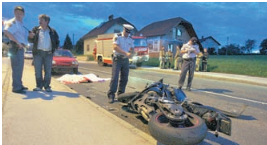
Tridesetletni motorist iz okolice Škofje Loke je zdrsil pod avto zaradi naglega speljevanja.