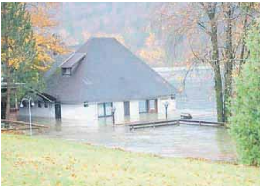
Naraslo Bohinjsko jezero

November so zaznamovale poplave , kakršnih Slovenija ne pomni. Vremenslovci so jih z rdečim alarmom sicer napovedovali predvsem v zahodnem, severnem in južnem delu Slovenije, vendar je voda predvsem zaradi narasle Drave uničevala na Koroškem in Štajerskem. Doslej največji pretok Drave 2600 kubičnih metrov na sekundo iz