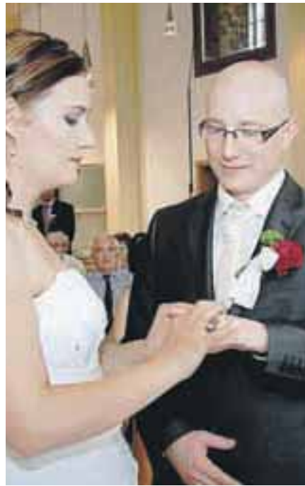
Sanjska poroka na Stari Savi