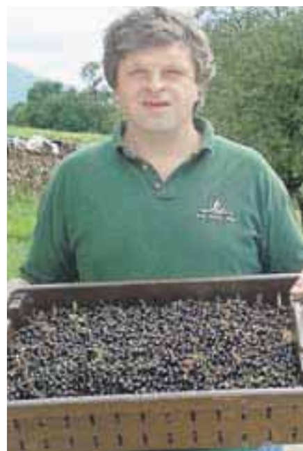
Pri Poklukarjevih v Gorjah so spet obirali ribez.