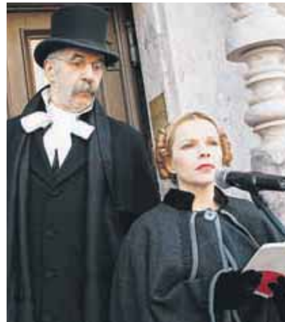
Spomin na smrt pesnika Franceta Prešerna