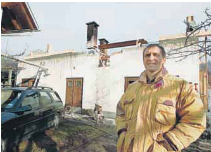
Poškodovana kmetija Porta na Ovsišah