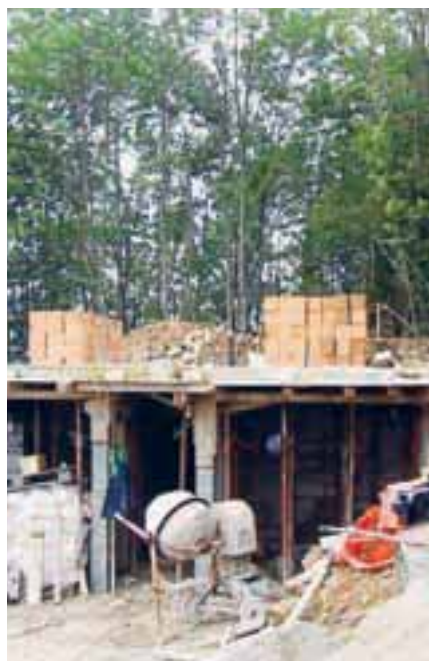
Gradnja planinskega doma na Mrzlem vrhu