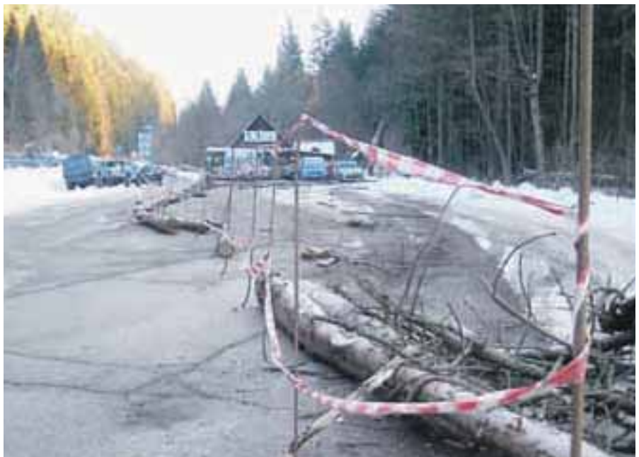
Zaprto parkirišče pred naravnim rezervatom Zelenci