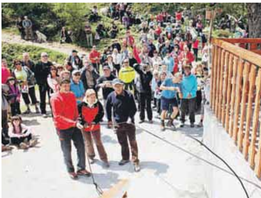
Odprtje novega planiskega doma na Zelenici

Holland . Vladavina Nicolasa Sarkozyja je bila s tem končana. Prav tako vladavina Borisa Tadića v Srbiji, kjer ga je na volitvah porazil predsednik Srbske napredne stranke Tomislav Nikolič . Vatikan je posegel v razmere v slovenski katoliški Cerkvi. Domnevno zaradi fi-