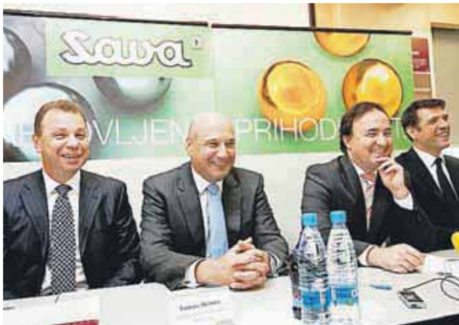
Predstavniki Save in češkega gumarskega holdinga ČGS