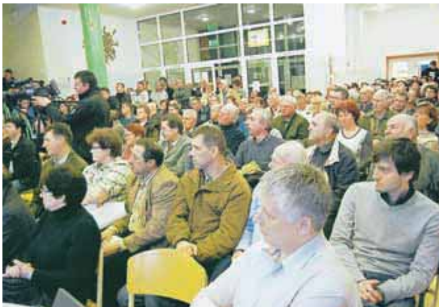
Zbor krajanov Smednika zaradi načrtovane gradnje tehnično turističnega parka v Hrašah

Robert Kranjec , ki je bil na poletih v Oberstdorfu četrti, skupaj s sotekmovalci pa na ekipni tekmi prvi, zablestel pa je na svetovnem prvenstvu v poletih v Vikersundu, kjer je zmagal in bil z moštvom tretji! Po prerekanjih, kdo je sprejel organizacijo Univerziade leta 2013 v Mariboru in kdo naj zagotovi denar, je vlada sklenila, da za to tekmovanje ne bo