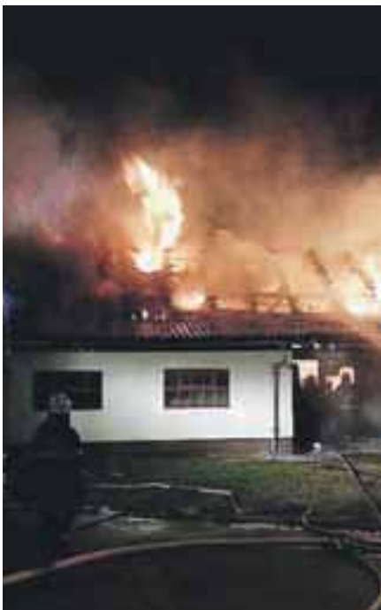
Požar v skladišču Trgosa v Lescah

Prihod poklicnega hokejista Anžeta Kopitarja-Kopija v Slovenijo, ki je z moštvo Los Angeles Kings kot prvi Slovenec osvojili Stanleyjev pokal, je bil ne