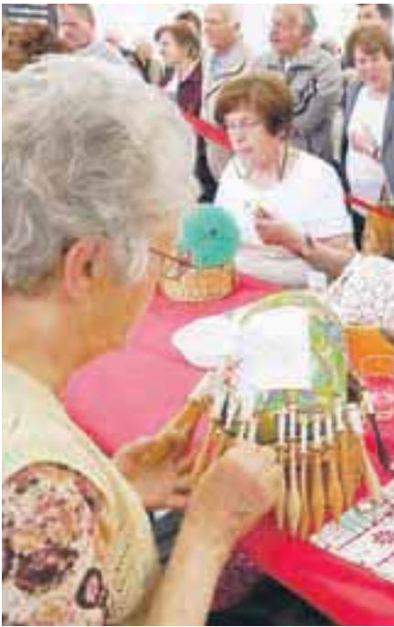
Klekljarice v Žireh