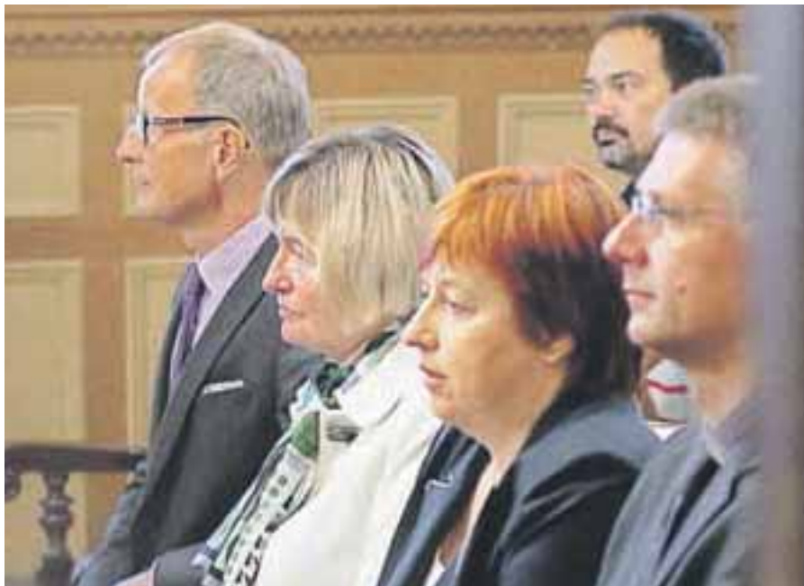
Nekdanji vodilni Merkurja na ljubljanskem sodišču.

Slovenska turistična središča so bila zadovoljna z obiskom med prazniki. V letu 2011 so bili najboljše plačani menedžerji Krke in Save , slednje kljub izgubi. V Franciji je v drugem krogu predsedniških volitev z 52 odstotki glasov zmagal sedeminpetdesetletni socialist Francois