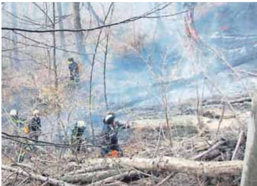
Gasilci so gasili gozdni požar nad Slovenskim Javornikom.