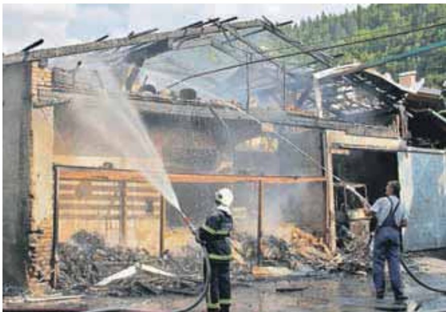
V Bohinjski Češnjici je zgorela žaga.

lu dvojnega dvojca sta bila tretja in tako skupaj osvojila komplet olimpijskih kolajn, Iztok pa s tekmo v enojcu še eno več. Za Čopa, ki je sam in skupaj z Lukom osvojil na olimpijskih igrah in svetovnih prvenstvih 16 kolajn, je bila to zadnja tekma v tekmovalni karieri. S kolajno se uspe posloviti le najboljšim. Pred Lukom so novi izzivi, skupaj pa sta