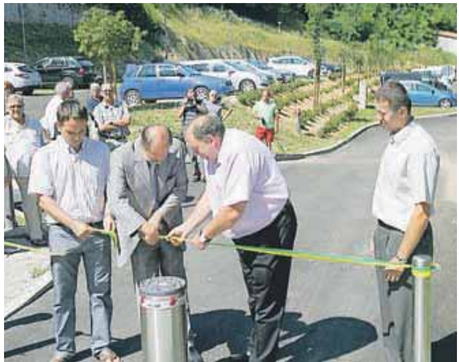
Novo parkirišče Nunski vrt v Škofji Loki