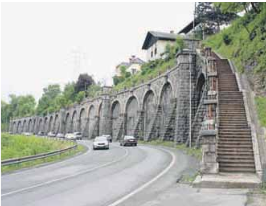
Gaštejski klanec v Kranju naj bi postal spomenik lokalnega pomena.