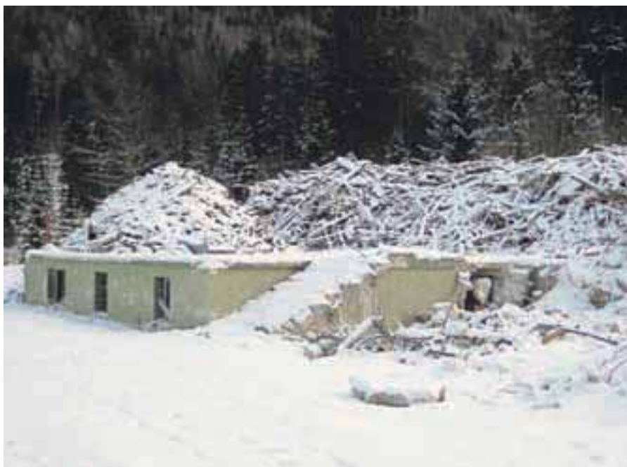
Porušen hotel Erika. Čez dve leti bodo zgradili novega.

tretja zmagata v svetovnem pokalu. Ob italijanski obali se je prevrnila luksuzna ladja Costa Concordia z okrog 4000 potniki. Plula je preblizu obale. Umrlo je trideset potnikov. Milan Zver je s podporo SDS in Nove Slovenije napovedal kandidaturo za novembrske volitve predsednika republike. Hrvati so se na refe-