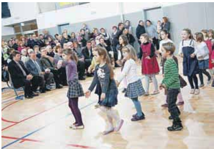
Nova telovadnica v Besnici