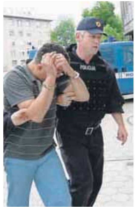
Osumljenci prihajajo na kranjsko sodišče.