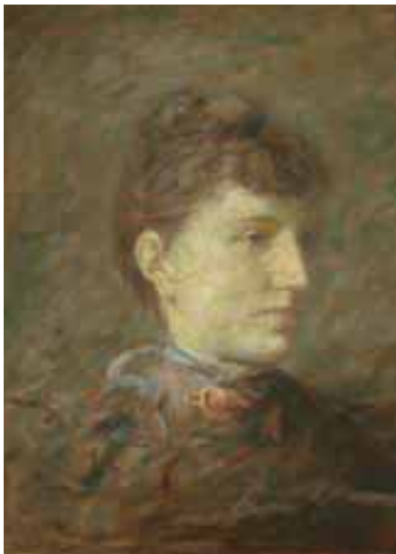
Ena od ukardenih Groharjevih slik v Loškem muzeju