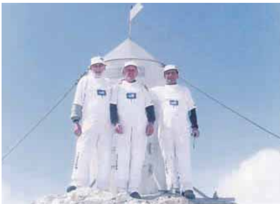
Prijatelji Triglava so obnovili Aljažev stolp na vrhu Triglava.