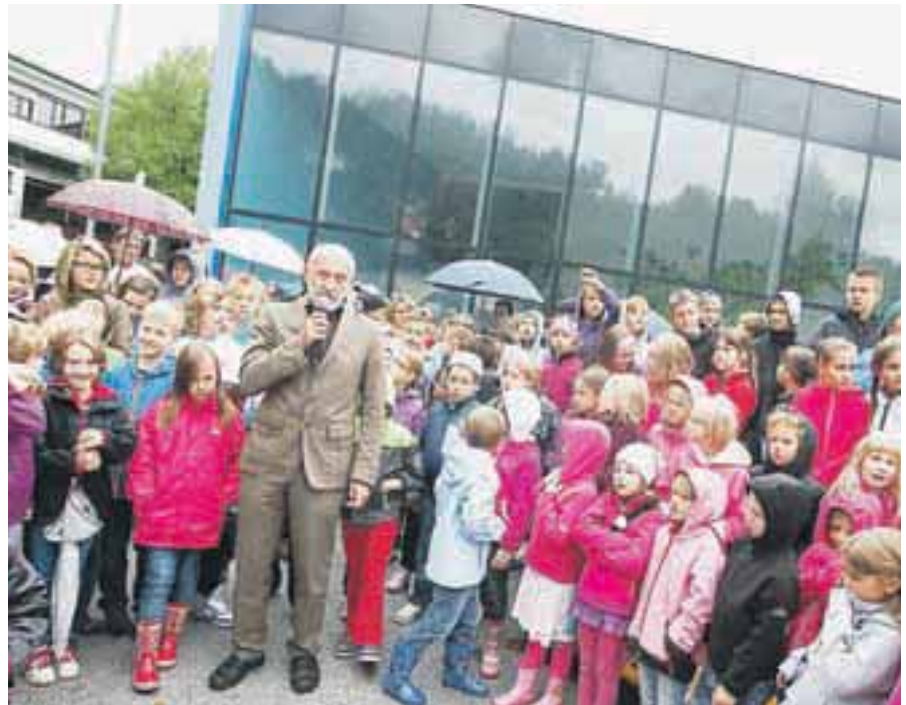
Na strehi osnovne šole v Bistrici pri Trziču so zgradili sončno elektrarno.