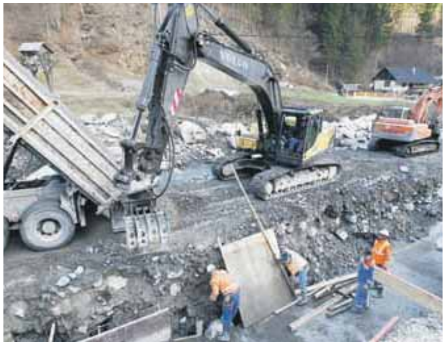
Začetek gradnje nove ceste v Davčo