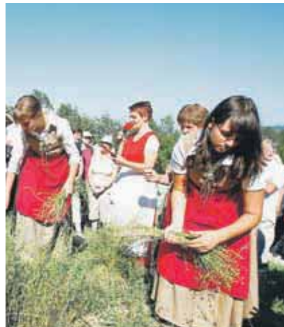
Dan teric v Davči