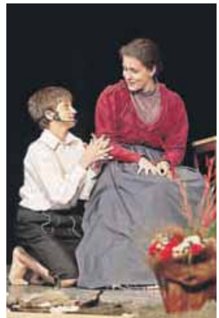
Na Breznici so se spomnili pedesetletnice Finžgarjeve smrti.