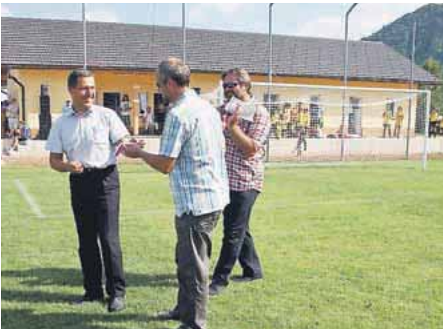
Nov nogometni stadion v Žireh

za novega predsednika Kmetijsko-gozdarske zbornice Slovenije. Unesco je Idrijo z rudnikom živega srebra uvrstil na seznam svetovne kulturne dediščine. Slovenijo je zajela huda vročina.