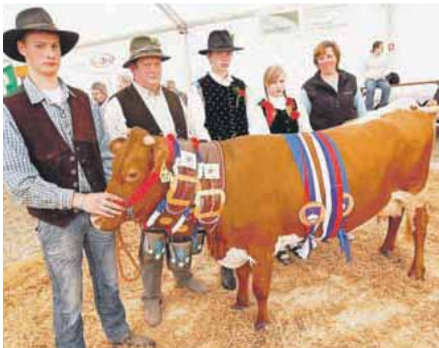
Krava Šmarnica z Jezerskega je zmagala na razstavi v Komendi.