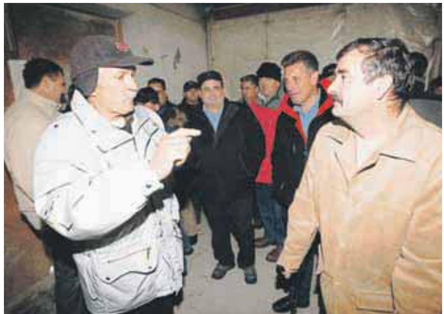
Stavka delavcev kranjskega Gradbinca