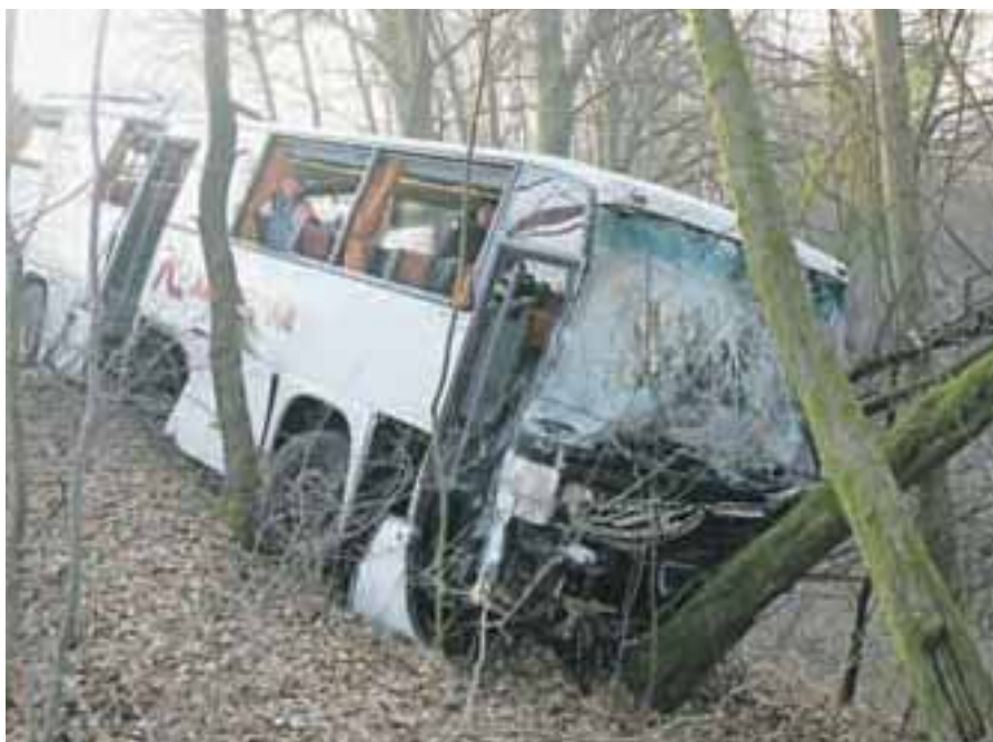
V nesreči v križišču Stari dvor pred Škofjo Loko je avtobus vrglo s ceste.

Mesec mnogoterih dogodkov bi lahko zapisali za marec. Dobra polovica volivk in volivcev, ki so se udeležili referenduma, so glasovali proti novemu družinskemu zakoniku . Na Gorenjskem je bilo proti zakoniku 56 odstotkov volivcev. Udeležba je bila 30-odstotna, saj je večina državljanek in državljanov