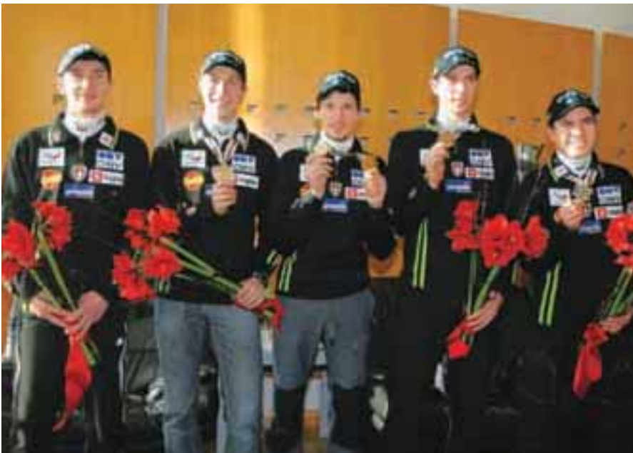
Moštvo slovenskih smučarskih skakalcev

šča na Rudnem polju na Pokljuki prevelik. V Splošni bolnišnici na Jesenicah so bili začudeni, da bodo zdravniško pomoč na tekmi v Planici zagotavljali v Ljubljani in ne na Jesenicah. V Škofji Loki so protestirali zaradi naraščajočega prometa tovornih vozil na cesti Jepca–Škofja Loka–Kranj. Na Bledu so tekli za dober namen, v Retečah pa so obnovili kulturni dom. V Pirničah se je znova širil smrad iz bioplinarne Petač. Na Gorenjskem se je število brezposelnih zmanjšalo. V Kamniku so odprli izobraževalni center za kuharje in slaščičarje.