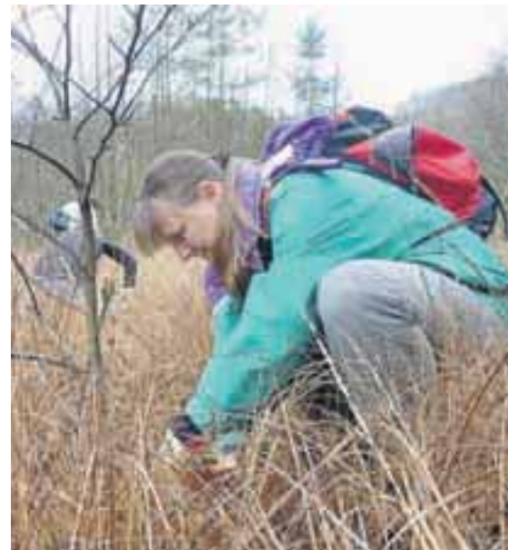
Čiščenje mokrišča pri Mengšu