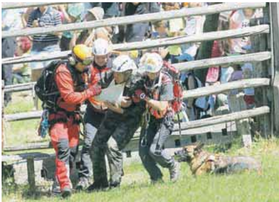
Slovenski gorski reševalci so v Kranjski Gori praznovali stoletnico ustanovitve reševalne službe.