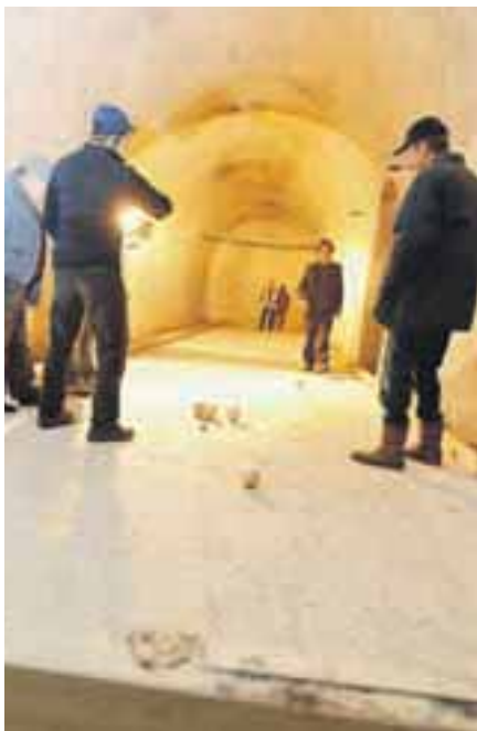
Balinanje v bunkerju Rupnikove linije

po nekaj dneh zglajen. Na Jesenicah se je začel potop članskega hokeja v okviru HK Acroni. Kriza v enem od najbolj znanih gorenjskih športov in klubov se je nato še zaostrovala. Vodstvo Merkurja je vložilo prve tožbe zoper predsednika bivše uprave Bineta Kordeža in njegove sodelavce. Statistiki so sporočili, da je bilo leta 2011 manj gorenjskih podjetij v težavah, vendar so bile te večje. V hudi prometni nesreči na gorenjski avtomobilski cesti je zaradi padca iz avtomobila umrla deklica. Na območju Škofje Loke so bili optimistični glede gradnje kanali-