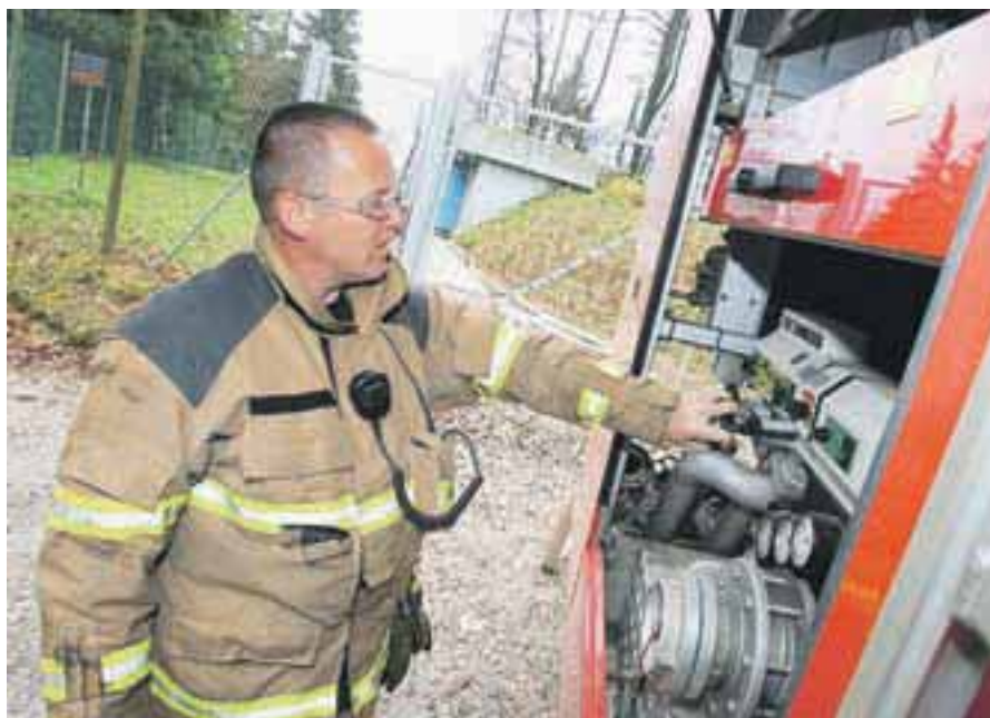
Gasilci so vozili vodo na Javornik.

Aprila so se najbolj zanimivi dogodki začeli z odločitvijo višjega sodišča, ki je potrdilo sodbo kranjskega okrožnega sodišča, da princ Aleksander Karadžor-džević , sin kneza Pavla, ni upravičen do vrnitve posestva Brdo. Hokejisti Olimpije so premagali Jeseničane in tako postali državni prvaki. Po vladnih napovedih varčevanja v javnem sektorju so se začela