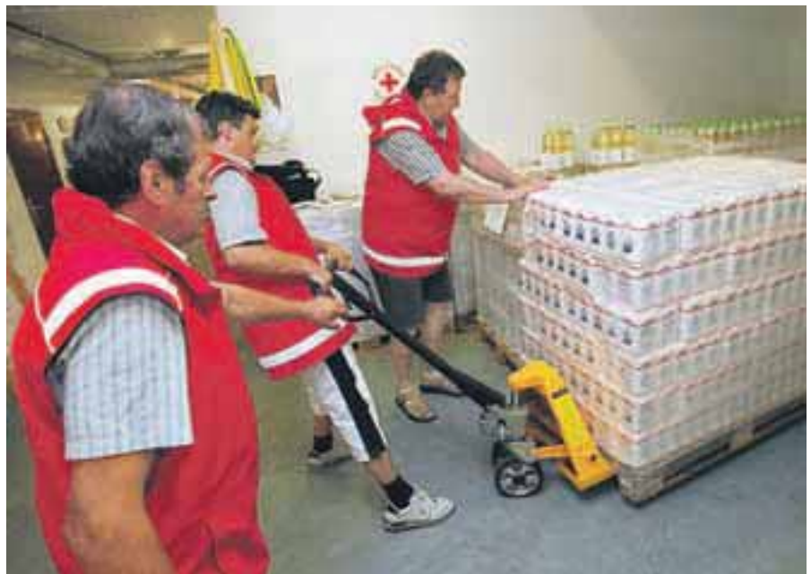
Evropska humanitarna pomoč v skladišču Rdečega križa Kranj

V začetku meseca so se kriški gasilci razveselili novega vozila. Prav tako v Stražišču , kjer so praznovali 110. obletnico društva. Gasilsko društvo Kranjska Gora pa je bilo staro 120 let. V Gorjah so po dolgem času spet obirali ribez. Na Sv. Joštu nad Kranjem so neznanec kradli baker. Vse vasi pod Dobrčo so dobile vodo, tudi Srednja in Zadnja vas ter Mlaka. Dovolj velik razlog za praznovanje. Na novem parkirišču na Nunskem vrtu v Škofji Loki , ki so ga odprli konec meseca, so začeli parkirati. Humanitarne organizacije so ugotavlja-