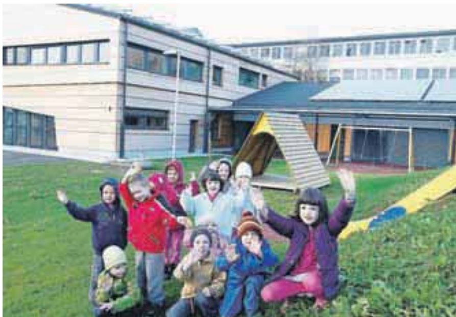
Nov vrtec Storžek v Preddvoru

leta 1965 je narasel na 2900 kubičnih metrov. Ljudje so bežali pred vodo, ki je uničevala in sejala strah. Tudi na Gorenjskem, še posebej v Bohinju. Škode je za več kot 200 milijonov evrov. Država bo prosila za evropsko solidarnostno pomoč. Naravna nesreča je zasenčila druge dogodke, tudi predsedniške volitve , ki so v prvem krogu prinesle pre-