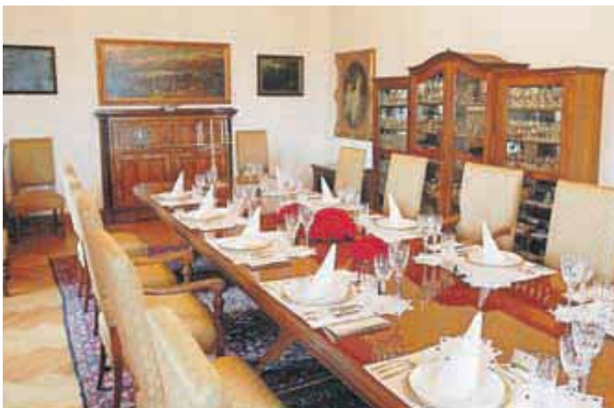
Jedilnica v obnovljenem gradu Strmol

Planica je končno dočakala prve korake k obnovi skakalnic. Naša skakalna legenda Primož Peterka in mladi Aleš Hlebanja sta imela čast prva skočiti po novih Bloudkovih skakalnicah, prekritih