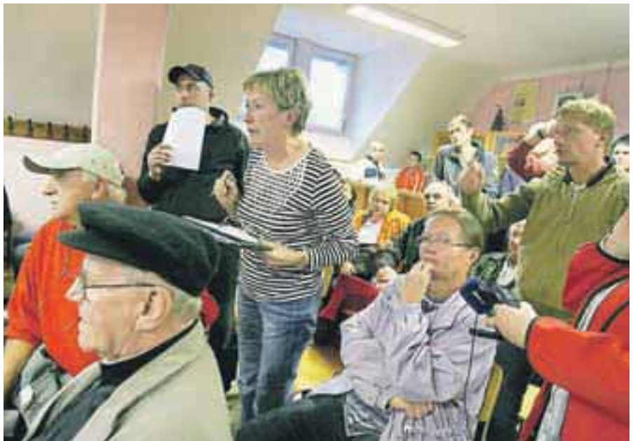
Visok komunalni prispevek je razburil krajanje Zvirč.

dokapitalizirali in s tem zagotovili nadaljnje poslovanje. Na Štularjevi kmetiji v Strahinju so zgradili novo sortirnico in pakirnico. Ulica Andreja Vavkna je bila izbrana za najlepšo v Cerkljah. Po dveh letih so za 3,6 milijona evrov obnovili grad Strmol . Na brniškem letališču so pri državljanih iz Tanzanije odkrili 11 kilogramov heroina. Na Koroški Beli so obnovili šolo, v Crngrobu pa so zgradili novo cesto. Pri Petraču na Jamniku so začeli obnavljati kozolec, zgrajen leta 1813. V Goričah so zgradili novo telovadnico, novo, ven-