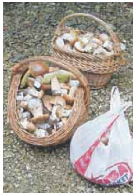
Odlična gobarska sezona