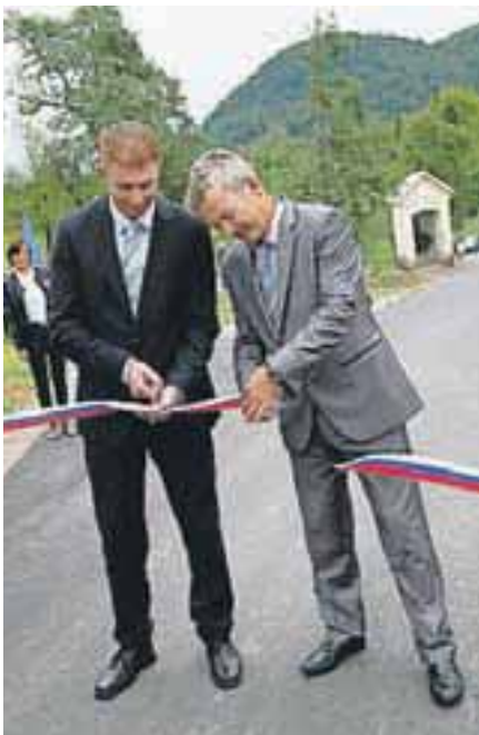
Nova cesta v Njivicah