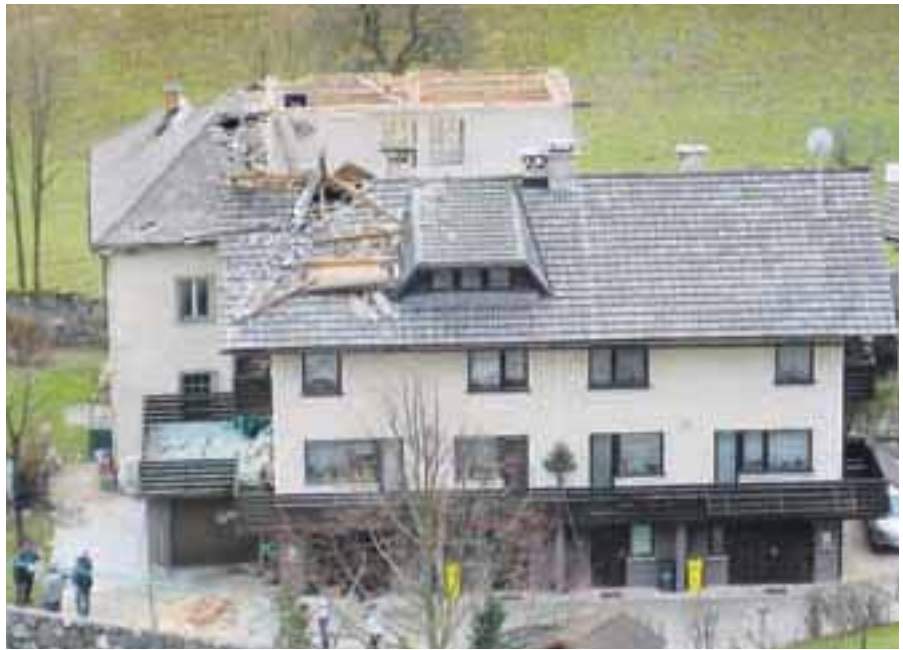
Močan veter je prevrnil ostrešje v Železnikih.