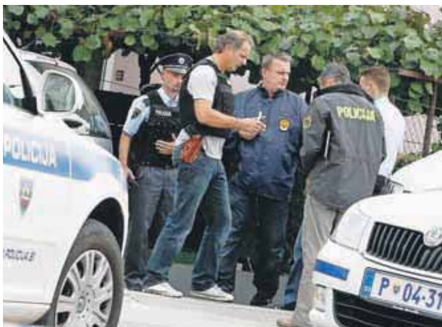
V Stražišču sta pod streli umrla dva človeka.

vića in njegov županski urad. Slovenska vlada je razdrla pogodbo s Patrio o nakupu 135 oklepnikov. Kupili jih bomo le 30, ki so že prevzeti. Trgovci so napovedali podražitev hrane in poslušali očitke, da si zaračunavajo previsoke marže. Pregledi poslovanja so pokazali, da sta največ slabih posojil odobrili Nova Ljubljanska in Nova mariborska banka. Zdravniki ljubljanskega Kliničnega centra so se izkazali z izjemnim znanjem in skrbjo za ponesrečene v balonarski nesreči, ki je terjala šest življenj. Jav-