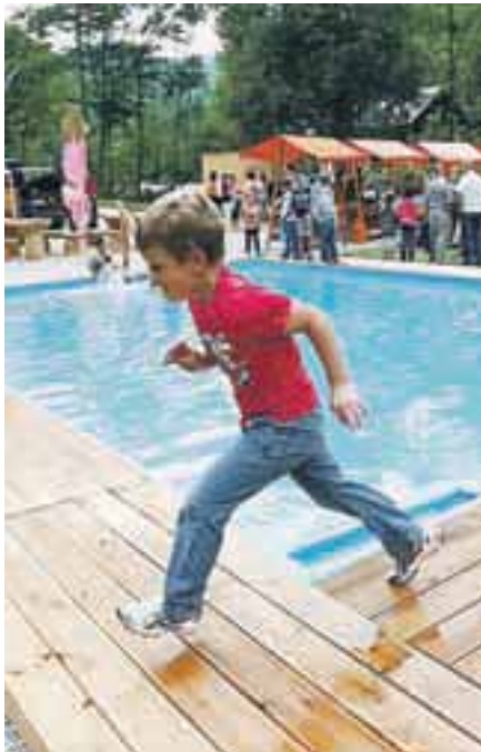
Kopališče v Kopačnici z zdravilno vodo