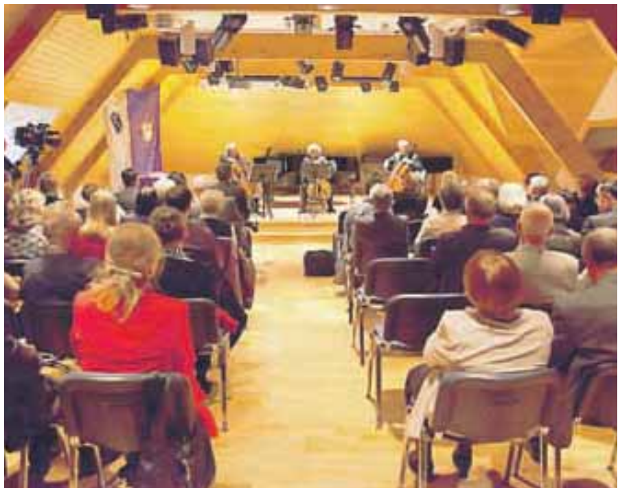
Koncertna dvorana Primoža Lorenza na Jesenicah