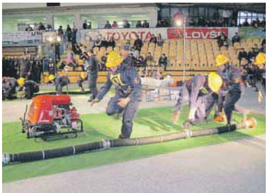
Gasilci so tekmovali v Cerkljah.

Železnikih je izbruhnil požar. V Kranju se je začel Teden slovenske drame, ki bo obsegal šestnajst predstav. V Kranjski Gori so zgradili nov, moderen dom starostnikov Viharnik za 130 stanovalcev. Švicarski finančni mehanizem bo še naprej pomagal pri projektih v Sloveniji. V Davči so začeli graditi novo cesto. Suša je bila vedno hujša. V zgornjem toku je presahnila celo Sava. Na Trebežu nad Slovenskim Javornikom so pogasili velik gozdni požar.