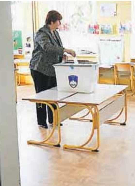
Glasovanje na referendumu o družinskem zakoniku