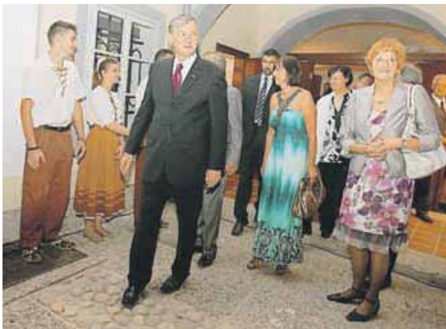
Odprtje obnovljenega gradu Khislstein v Kranju