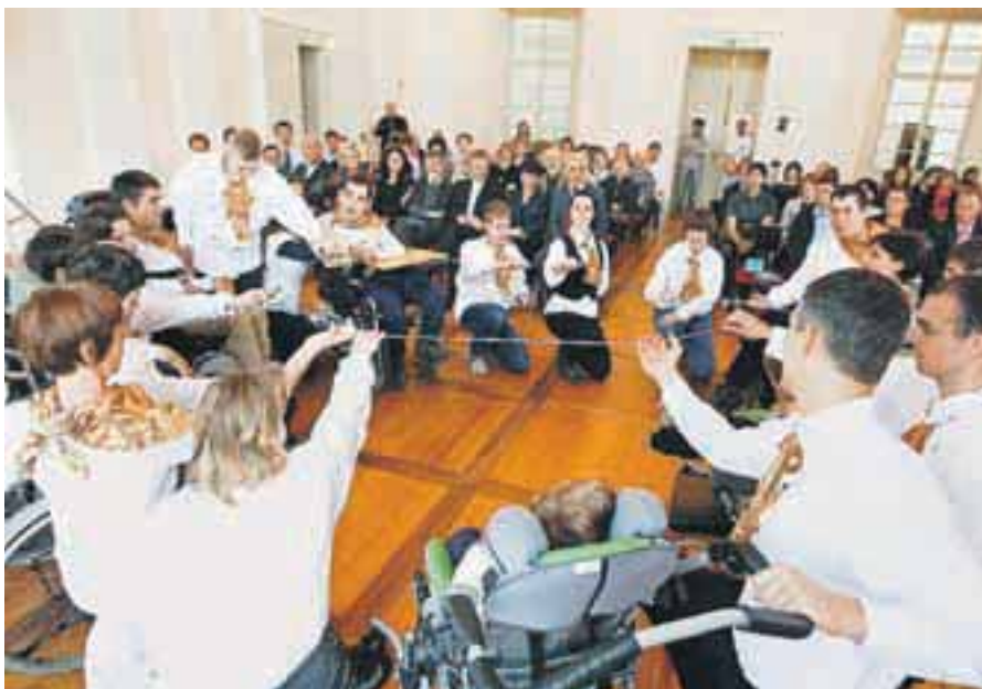
Center Matevža Langusa v Radovljici deluje že šestdeset let.