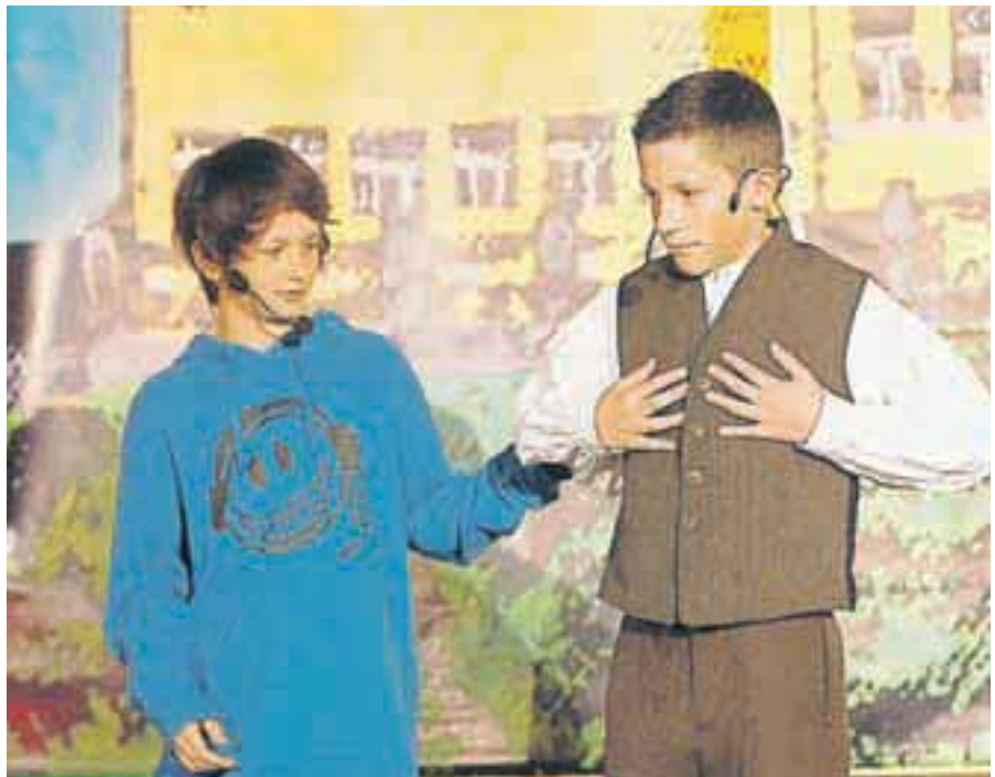
Osnovna šola v Preski je bila stara osemdeset let.

tudi nad Mount Everest. Bil je na nebu 60 držav. V Gorenji vasi so se odločili povečati čistilno napravo. Zaradi protestov so na cesti Jepra–Škofja Loka–Kranj omejili promet tovornjakov. Jeseniška Stara Sava postaja muzej na prostem, sončna elektrarna na strehi osnovne šole Šenčur pa bo največja sončna elektrarna na javnem objektu na Gorenjskem.