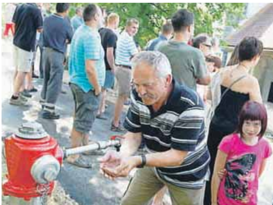
Tudi zadnje vasi pod Dobrčo so dobile pitno vodo.

Osrednji svetovni dogodek, ki se je začel julija, so bile olimpijske igre v Londonu, ki mu je bila organizacija dodeljena leta 2005. Na igrah je sodelovalo 65 športnikov iz Slovenije, med katerimi je bilo štirinajst Gorenjk in Gorenjcev. Naša pričakovanja kolajn so bila velika. Prvo in to kar zlato kolajno je osvojila