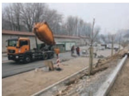
Gradbena dela na parkirišču Nunski vrt

Letos so s podpisom pogodbe z izvajalcem in nadzornikom začeli najpomembnejšo naložbo v občini: odvajanje in čiščenje odpadnih voda v okviru evropsko podprtega projekta Urejanja porečja Sore.