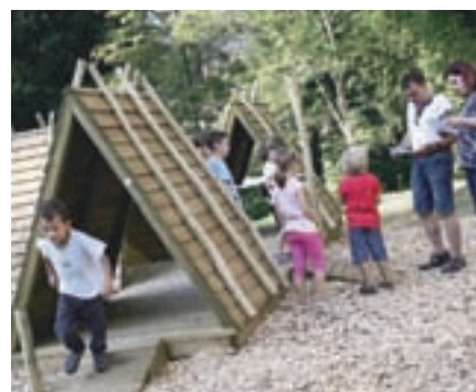
Novo tematsko otroško igrišče na Pristavi

Med pomembnejšimi pridobitvami na zdravstvenem področju je treba omeniti, da so Jesenice v Splošni bolnišnici Jesenice dobile pomembno aparaturu, in sicer aparaturu za magnetno resonanco; celotna investicija je vredna okoli dva milijona evrov, sama naprava, ki je edina na Gorenjskem, pa kar 1,6