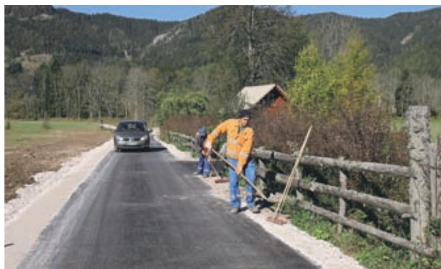
Ker so se letos odpovedali največji naložbi, so del proračunskega denarja lahko namenili posodobitvi nekaterih lokalnih cest.

Na Jezerskem so se letos že v začetku leta veliko ukvarjali z občinskimi prostorskimi načrti, za katere želijo, da bi predstavljali osnovo za razvoj. Občani sicer ugotavljajo, da so predlagani prostorski načrti bolj naravnani k varstvu narave kot k potrebam domačinov. Letos so občinski praznik na Jezerskem proslavili skupaj s stoletnico tamkajšnjega prostovoljnega gasilskega društva. Slednje je ob prazniku dobilo novo terensko vozilo. Slovesno pa je bilo tudi na Jezerskem vrhu ob dvajseti obletnici samostojne Slovenije.