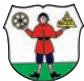
Občina Radovljica Gorenjska cesta 19 Radovljica

Leto 2011 je tudi v Radovljici v marsičem zaznamovala splošna gospodarska kriza, kar je pomenilo, da v občini ni bilo velikih novih investicij. Bile pa so številne manjše, speljane gospodarno in premišljeno, predvsem v smeri izboljšanja komunalne infrastrukture, energetske učinkovitosti ter spodbujanja turizma kot ene najpomembnejših gospodarskih panog v občini. Leto so zaznamovali tudi obiski na najvišji ravni: od predsednika države do norveškega kraljevskega para.