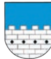
Občina Tržič Trg svobode 18 Tržič