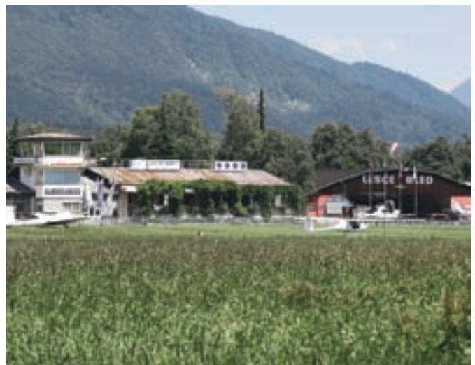
Za ALC Lesce se začena novo obdobje.