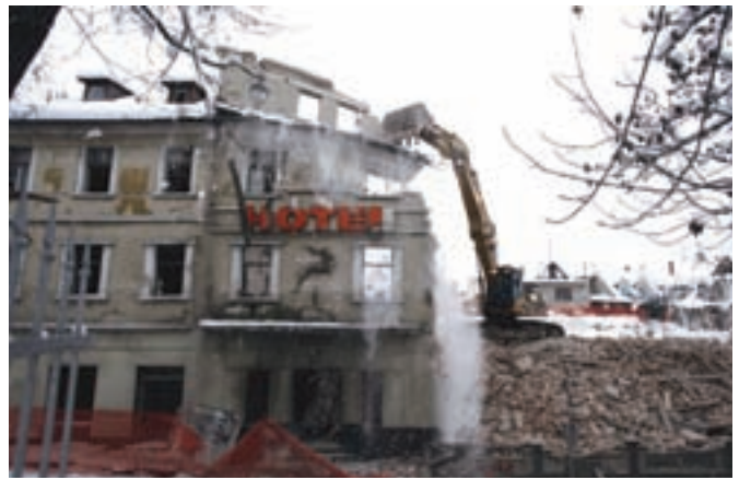
Stari hotel Jelen je padel konec lanskega leta, v tem letu pa se je začela intenzivna gradnja dvorca Jelen, ki naj bi bila zaključena že v letu 2012.

načrtih, naj bi bil dvorec Jelen zgrajen sredi prihodnjega leta.