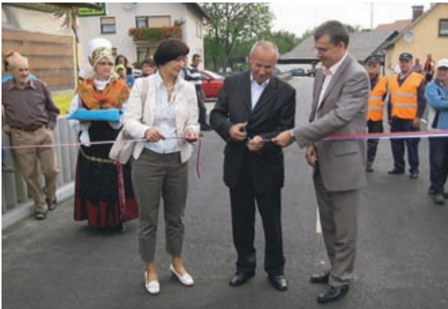
Odprtje obnovljene ceste Voklo-Prebačevo, ob kateri po novem poteka kolesarska steza.

V občini Šenčur so ob koncu leta najverjetneje najbolj ponosni na sprejetje občinskega prostorskega načrta, saj je postopek priprave in sprejemanja tega obsežnega dokumenta potekal skoraj šest let.