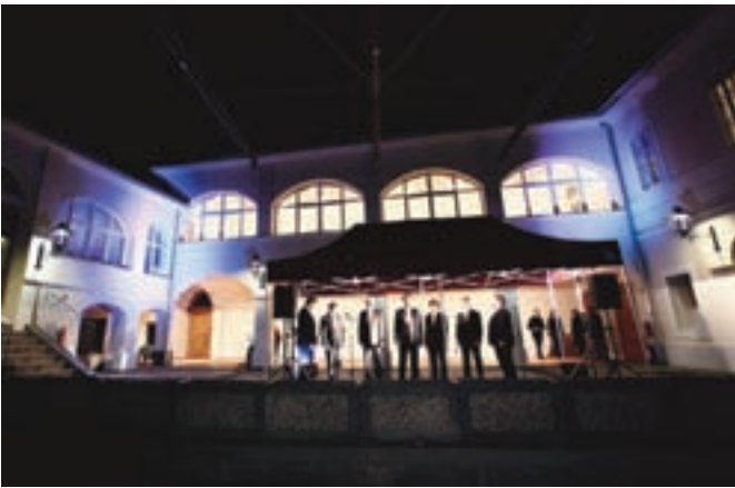
Ob občinskem prazniku 3. decembru so odprli prenovljen kompleks gradu Kieselstein na Tomšičevi ulici, prav tako pa se je končala prenova v okviru projekta treh stolpov.