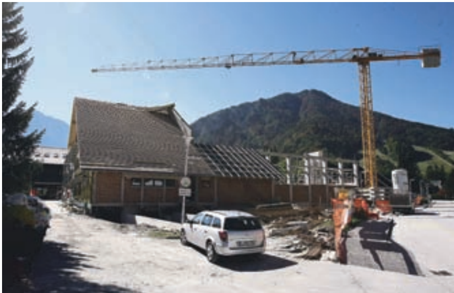
Največja občinska investicija zadnjih dveh let je obnova osnovne šole Josipa Vandota Kranjska Gora.