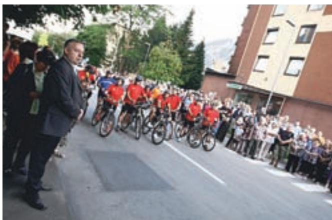
Utrinek z odprtja prenovljene Tavčarjeve ulice na jeseniškem Plavžu