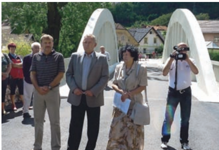
Hermanov most je v celoti obnovljen.