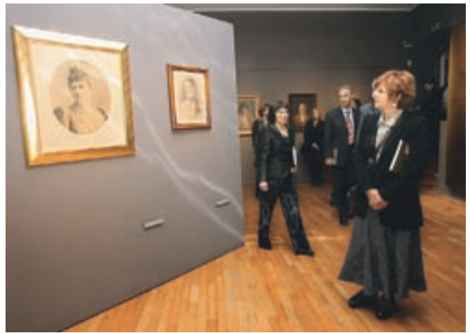
Najodmevnejši dogodek Groharjevega leta v Škofji Loki: Grohrajovo portretno slikarstvo

energijo in večji uporabi obnovljivih virov, čistejši vodi in gradnji malih čistilnih naprav na območjih, ki jih ne bo zajel javni kanalizacijski sistem. K varčevanju z energijo in varovanju okolja pa je pripomogla tudi akcija za cenejši in pogostejši avtobusni prevoz, ki je v jesenskem obdobju kar dobro zaživel.