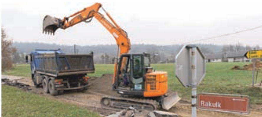
Gradnja kanalizacije na Dobračevi in v Rakulku se je že začela.