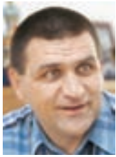
Župan Jure Žerjav