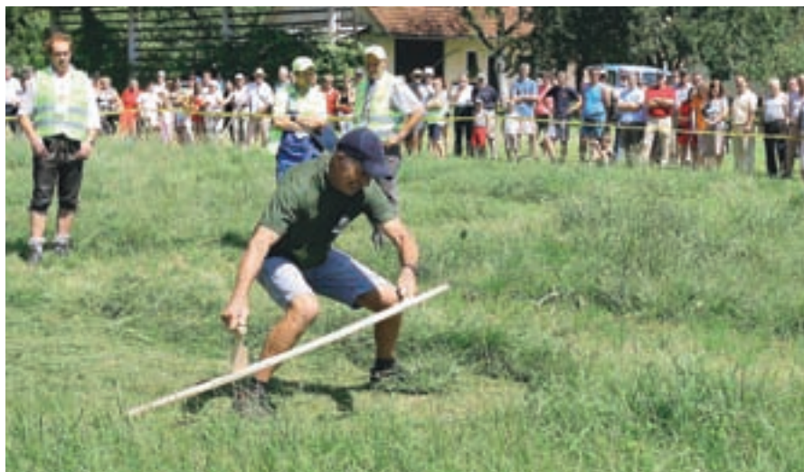
Evropsko prvenstvo v ročni košnji

2012. Celotna investicija je sicer ocenjena na 18 milijonov evrov, obsega pa izgradnjo novega vodovodnega omrežja v skupni dolžini dobrih 31 kilometrov, ki bo oskrboval približno 28 tisoč prebivalcev. Letos se je nadaljevala tudi gradnja primarnega kanalizacijskega sistema. Zgradili so odsek Pšata-Poženek-Šmartno-Glinje-Zalog v dolžini dobrih 3800 metrov ter začeli graditi na odsekih Sp. Brnik-Vopovlje-Lahovče in Lahovče-Komenda ter v osrednjem delu Dvorij. Priklučitev na Centralno čistilno napravo Domžale-Kamnik je tako vse bližje, zato je župan v začetku poletja podpisal pogodbo, s katero je občina Cerklje z 8,85-odstotnim deležem vstopila v sam lastniški delež podjetja, kar bo občino stalo dobre pol milijona evrov. Polovico populacijskih enot in zato tudi polovico sredstev bo moralo prispevati tudi Letališče Brnik. V pripravi so še projekti za izgradnjo kanalizacije na odseku Zalog-Klanec-Komenda in v Gradu ter rekonstrukcija državne ceste od nekdanje občine do žičnice Krvavec ter ceste v Vasici. Z gradnjo kanalizacije so številne ceste dobile nov asfalt, prenovili pa so tudi