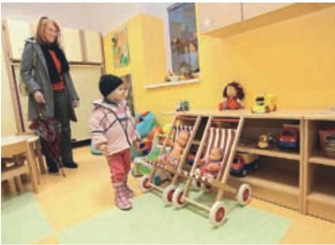
Občina je letos veliko pozornost namenila povečanju vrtčevskih zmogljivosti. Na sliki je vrtec na Bukovici.