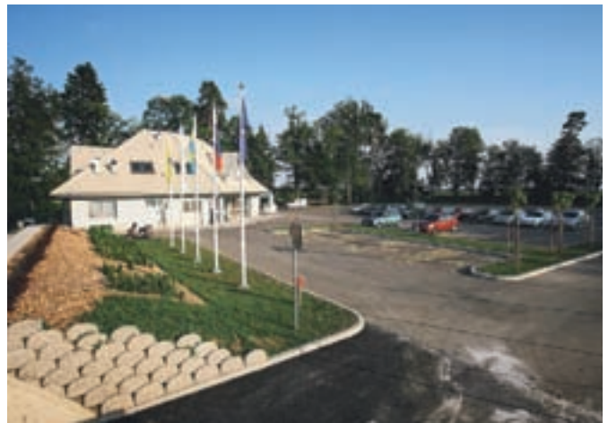
Nogometni center Velesovo je dobil končno podobo.

cesto Stiška vas-Ambrož, ki je bila že pošteno dotrajana. Na odsekih ceste na Štefanjo Goro so izvedli razširitev cestišča in popravili vtočne jaške ter odstranili veliko tamkajšnjega kamnitega materiala, na cesti Grad-Ravne pa so namestili zaščitne ograje ter nekaj odbojnih ograj. Letos jim je končno uspelo s prečrpavanjem iz drenažnega zajetja pod Krvavcem zagotoviti tudi normalno oskrbo z vodo za krajane Stiške vasi in Ambroža, s čimer so tudi ti občani dobili možnost za priklop na javni vodovod. Investicija je bila vredna več kot pol milijona evrov.