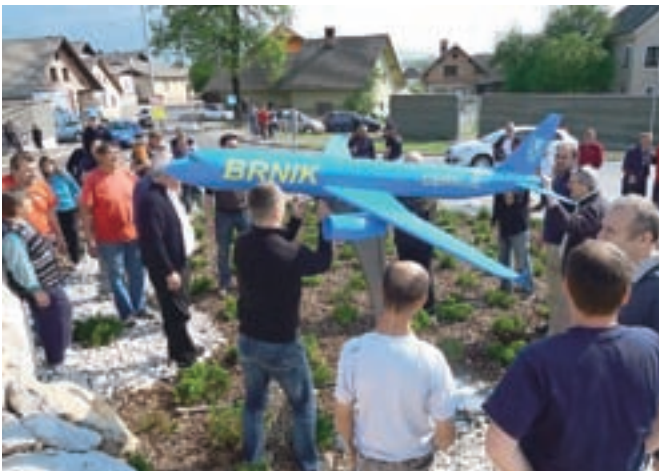
Postavitev makete letala na Spodnjem Brniku