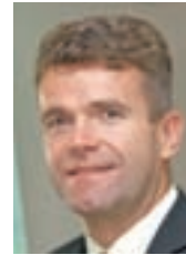
Župan Milan Čadež