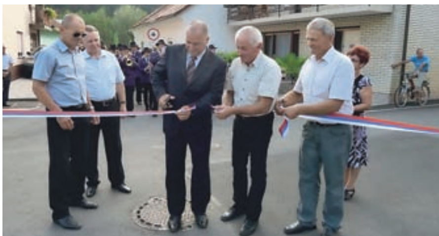
Slavnostno odprtje prenovljene komunalne infrastrukture v Topolah