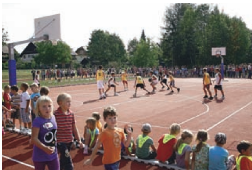
Med največjimi investicijami leta 2011 je igrišče pri OŠ Lesce, za katero je občina namenila nekaj manj kot pol milijona evrov.

Leto 2011 je tudi v Radovljici v marsičem zaznamovala splošna gospodarska kriza, kar je pomenilo, da v občini ni bilo velikih novih investicij. Bile pa so številne manjše, speljane gospodarno in premišljeno, predvsem v smeri izboljšanja komunalne infrastrukture, energetske učinkovitosti ter spodbujanja turizma kot ene najpomembnejših gospodarskih panog v občini. Leto so zaznamovali tudi obiski na najvišji ravni: od predsednika države do norveškega kraljevskega para.