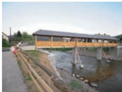
V Gorenji vasi je nova Neškova brv.

Tudi letos so prizadevna turistična in druga društva pripravila vrsto odmevnih prireditev, med drugim so gostili mednarodno tekmo v gorskih tekih za mlade. Letos je bolje zaživela tudi Štefanova hiša v Poljanah, ki je namenjena občinski kulturi. V občini z najvišjo nataliteto v državi vzorno skrbijo za varstvo najmlajših. Pred vrati vrtcev običajno ne ostane nihče, tudi zato so letos na Dobravi odprli nov vrtec. Obrtna cona Todraž je že popolnoma, na gradnjo pa je pripravljena tudi Obrtna cona Dobje. Po napovedih bo Polycom največjo investicijo v coni začel prihodnje leto, čez dve leti bi se del njihove proizvodnje že lahko preselil.