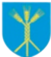
Občina Domžale Ljubljanska cesta 69 Domžale