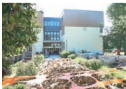
Zahtevna gradbena dela pri obnovi šole so potekala celo poletje in vse do novembra.

Največja investicija letošnjega leta je bila zagotovo nadgradnja in protipotresna sanacija Osnovne šole Vodice, ki pa se je zaradi dotrajanosti stavbe zavlekla bolj, kot je bilo pričakovano.