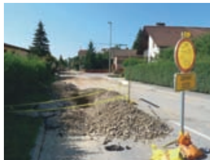
Obnova Rojske ceste v Domžalah

Nič manj pomembni niso bili projekti na področju družbenih dejavnosti. Novo