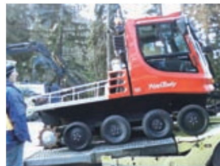
Novi teptalec snega