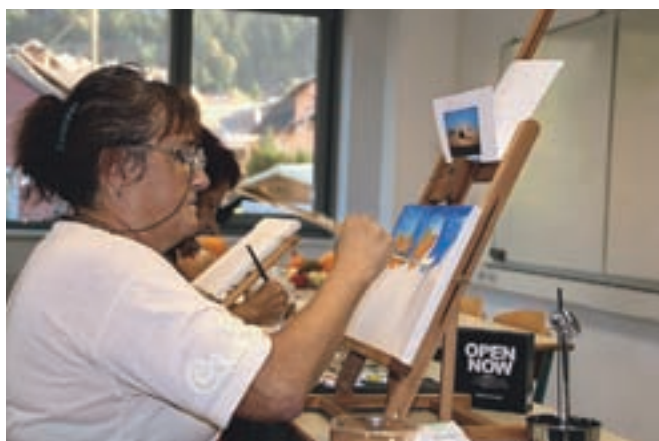
Zaživela je Univerza za tretje življenjsko obdobje.

uredili prostore za Krajevno skupnost Hrušica in kulturna ter športna društva. Na področju družbenih dejavnosti so pomembna pridobitev nova neprofitna stanovanja na Prešernovi cesti, ki jih je Občina Jesenice v sodelovanju s Stanovanjskim skladom RS oddala v neprofitni najem osemnajstim družinam.