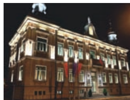
Kulturni dom Franca Bernika je zasijal z novo osvetlitvijo fasade.

kotlovnico je dobila OŠ Domžale, nov prizidek in novo kuhinjo so zgradili v OŠ Dob, nekaj novih prostorov so uredili v POŠ Krtina, že lani pozimi pa je z novimi lučmi zasijal Kulturni dom Franca Bernika. V slednjem so ob kulturnem prazniku slovesno odprli novo dvorano Acija Bertoncija, kulturni dom pa je s 1. januarjem v upravljanje prevzel zaščiteno Menačnikovo domačijo. Domžalski