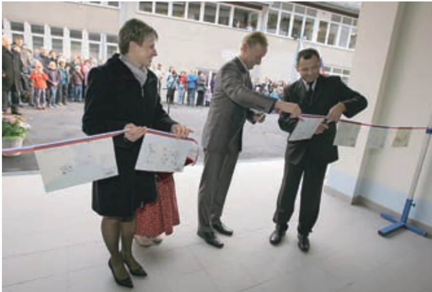
Novembra so odprli prizidek k vrtcu pri osnovni šoli Železniki.

V Železnikih uspešno poteka tudi sanacija po poplavih v letih 2007 in 2009, med drugimi tudi obnova ceste Železniki-Zali Log. Obnova ceste v Davčo pa se bo začela spomladi prihodnje leto, za kar je bil zagotovljen denar iz evropskih virov, medtem ko je obnova ceste v Sorico na osrednjem najzahtevnejšem delu obtičala. To se je zgodilo ravno v letu, ko je Sorica (in z njo vsa občina) slavila stoto obletnico smrti velikega impresionista Ivana Groharja. Junija je bila v Sorici osrednja prireditev ob Groharjevem letu, 1. julija pa je občina tam proslavila tudi letošnji občinski praznik. Praznovali pa so tudi vaščani Smoleve, kjer je bil po poplavih leta 2007 saniran najzahtevnejši plaz v občini. Zanj je država namenila 850 tisoč, občina pa za dokumente 50 tisoč evrov. Z njim vred je saniranih že 49 plazov v občini, na sanacijo jih čaka še 38. Vmes pa so se morali lotiti še enega plazu v Martinj Vrhu, ki se je na novo pojavil letos spomladi.