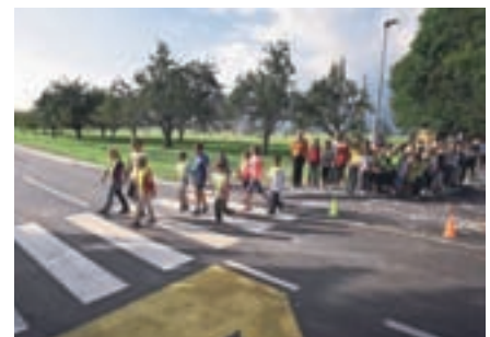
Zaradi obnove ceste Hotemaže-Olševek so tamkajšnji šolarji precej bolj varni na poti v šolo.