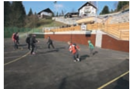
Na Sovodnju so se šolarji in krajanje razveselili novega športnega igrišča.