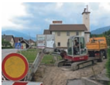
Gradnja kanalizacije in obnova vodovoda v Dupljah