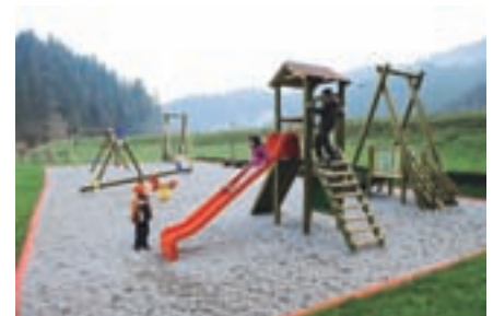
Otroško igrišče v Pustotniku je med žirovskimi družinami zelo priljubljeno.