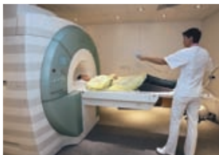
Nova naprava za magnetno resonanco v Splošni bolnišnici Jesenice