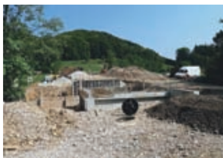
Gradnja ceste in mostu na območju bodočega doma starostnikov