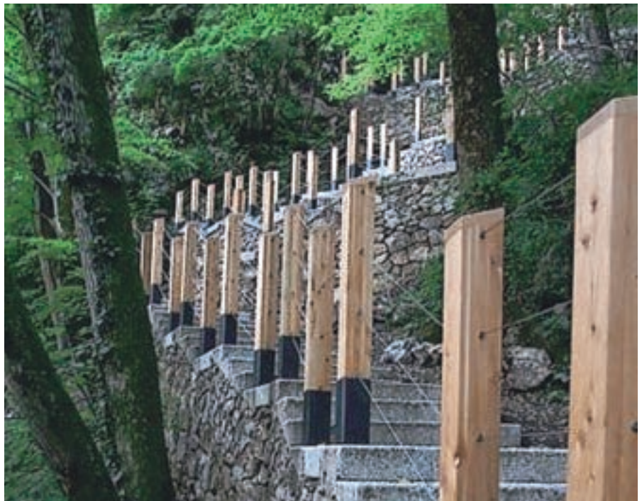
Pot na Blejski grad je danes popolnoma prenovljena in tudi osvetljena, tako da jo lahko obiskovalci uporabljajo tudi ponoči.

”Slavljenci”: Grand Hotel Toplice, Blejski grad, TNP, IEDC, VSŠTG so poskrbeli za dodano vrednost in dogajanja. Po usklajenih dogovorih so župani gorenjskih občin Turizmu Bled v letošnjem letu podelili pooblastilo za izvajanje nalog regionalne destinacijske organizacije - RDO Gorenjska, v imenu katerega je uspešno kandidiral na javnem razpisu za pridobitev sredstev Evropskega sklada za regionalni razvoj, in tako za skupne