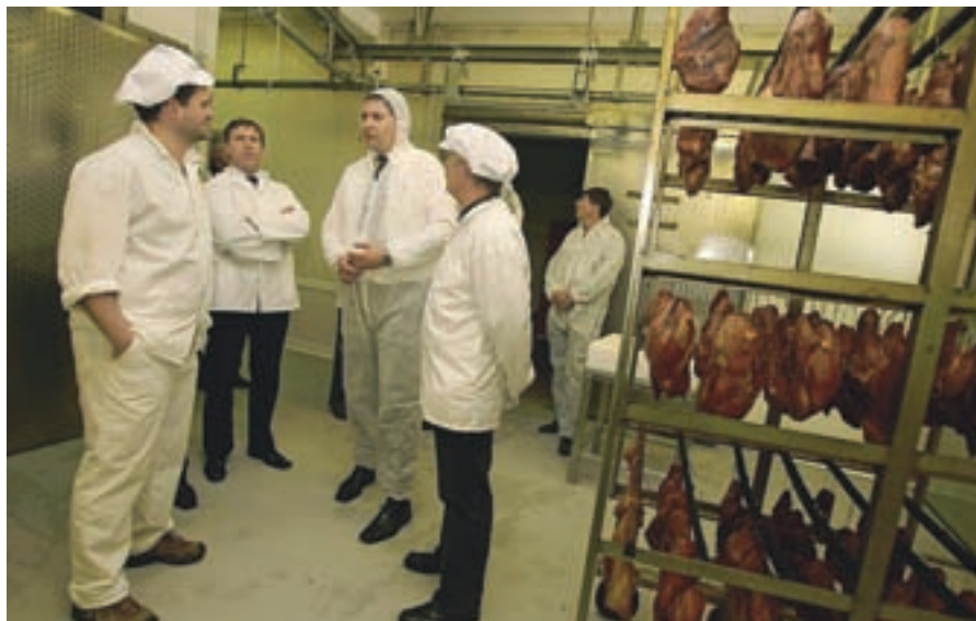
Občina je januarja dokapitalizirala Mesnine Bohinja, d. o. o. in postala 26,4-odstotna lastnica podjetja.