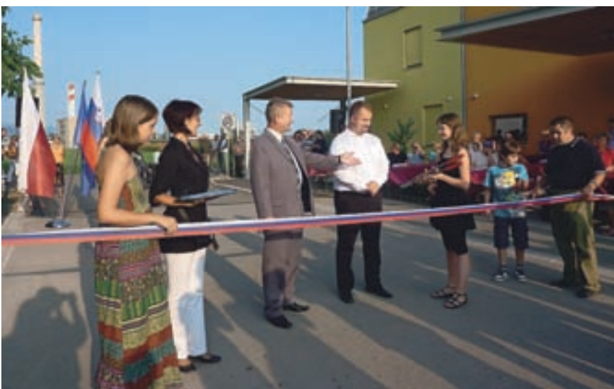
V Stražišču so septembra slovesno odprli novo kanalizacijo, obnovljen vodovod in obnovljene ceste na Hafnerjevi in Križnarjevi poti.

Tudi ob prehodu iz letošnjega v prihodnje leto v kranjski občini poteka kar nekaj investicij (med drugimi predstavitev ceste Njivica-občinska meja), jasno pa je, da bo med investicijami v prihodnjih letih imel prednost projekt Gorki s kanalizacijo in čistilno napravo.