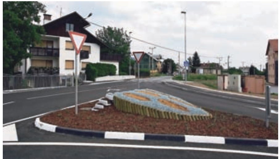
Novo križišče v Žirovnici

prvo električno polnilnico, ta stoji na Breznici, s čimer so se pridružili občinam, ki namenjajo posebno pozornost rabi okolju prijaznejših prevoznih sredstev in s tem želijo prispevati k zmanjšanju onesnaževanja okolja.