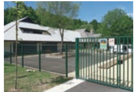
V prizidku k Vrtcu Gobica je občina vložila milijon evrov.