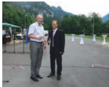
Utrinek z odprtja novih parkirišč v Završnici

prvo električno polnilnico, ta stoji na Breznici, s čimer so se pridružili občinam, ki namenjajo posebno pozornost rabi okolju prijaznejših prevoznih sredstev in s tem želijo prispevati k zmanjšanju onesnaževanja okolja.