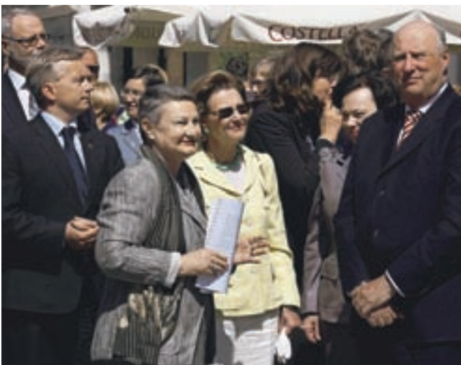
Radovljico so obiskali številni visoki gostje. Najbolj smo si zapomnili obisk norveškega kralja Haraldja in kraljice Sonje.