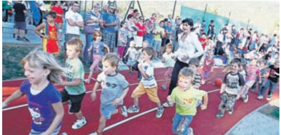
Odprte prenovljenega športnega parka v Križah

gotovili iz občinskega proračuna. Zaključuje se tudi dolgoletna zgodba z gradnjo novega planinskega doma na Zelenici, ki je eden največjih potencialov v občini na področju turizma. Občina je za potrebe izgradnje doma namenila 220 tisoč evrov in še dodatnih 10 tisoč evrov za vzpostavitve optičnega omrežja.