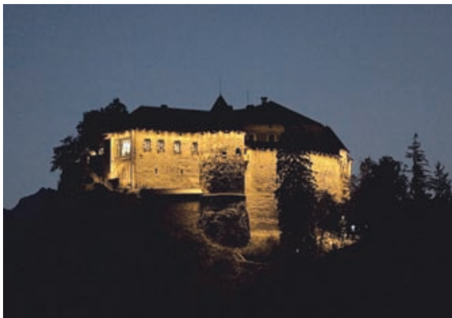
Prenova sistema osvetlitve Blejskega gradu in grajske skale je narejena v najsodobnejši tehniki.