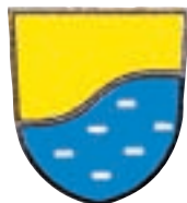
Občina Vodice Kopitarjev trg 1 Vodice