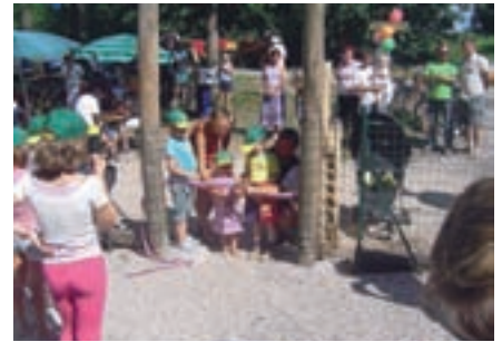
Veseli otroci ob odprtju novega otroškega igrišča in srečališča, ki so ga naredili prostovoljci.

Da so Gorjanci srčni ljudje, so pokazali že na začetku leta, z dobrodelnim koncertom, ki je presegel pričakovanja. Petsto simpatizerjev mladih športnikov je povsem napolnilo telovadnico osnovne šole Gorje in jih skupaj z donatorji podprlo. Izjemna predstavitev mladih športnikov je udeležene prepričala, da so sanje o olimpijski kolajni gorjanskih tekačev in biatloncev, članov Športnega društva Gorje, leta 2026 upravičene.