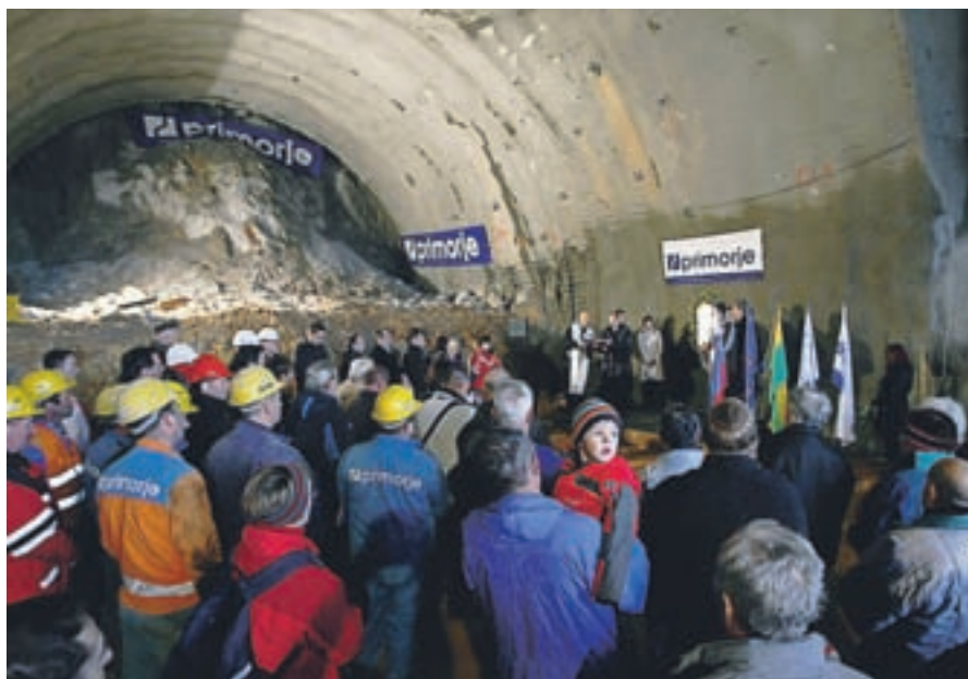
Spodbuden začetek vrtanja predora pod Stenom