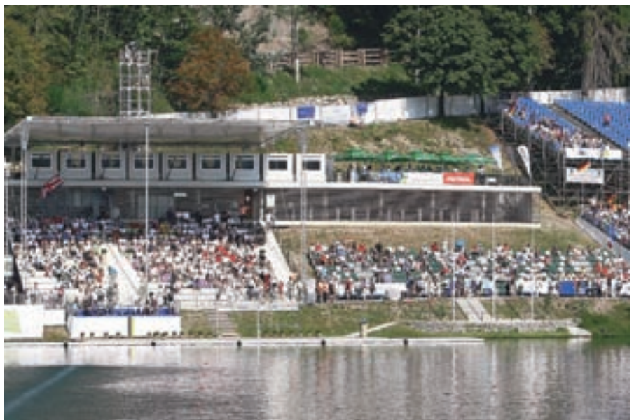
Novo ciljne tribune so se okitile z zlatim odličjem v mednarodni družbi gradbenih dosežkov v Kölnu.

se zelo pozitivno omenjal na nekaterih najbolj obiskanih spletnih turističnih portalih - portal www.travel.yahoo.com je med deset najlepših jezer na svetu uvrstil tudi Blejsko jezero. ”Narejenega je bilo veliko, a rezultati se bodo pokazali šele v prihodnosti. Nekaj pa je jasno: le z dobrim sodelovanjem in dobrim delom bomo vsi skupaj uspešni pri razvoju trajnostnega turizma na Bledu,” je prepričana direktorica Turizma Bled.