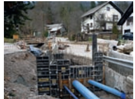
Gradnja kanalizacije in vodovoda v Bašlju