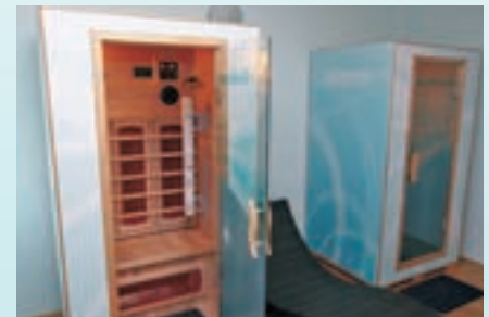
Biosinchron Magnoterm komora