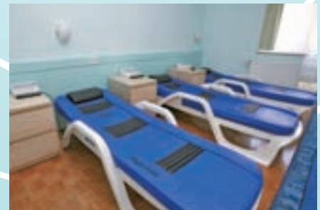
Zdravljenje z magnetno resonanco