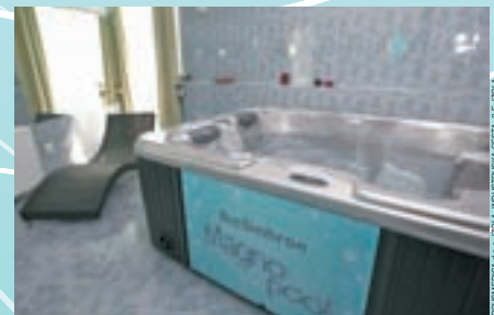
Biosinchron Magno Pool