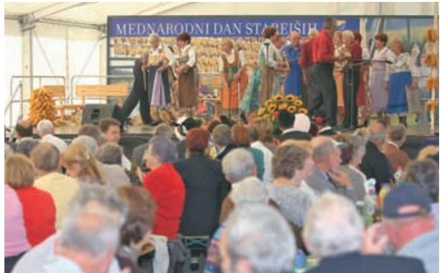
Na prireditvi ob mednarodnem dnevu starejših se je zbralo skoraj 500 vodiških upokojencev.