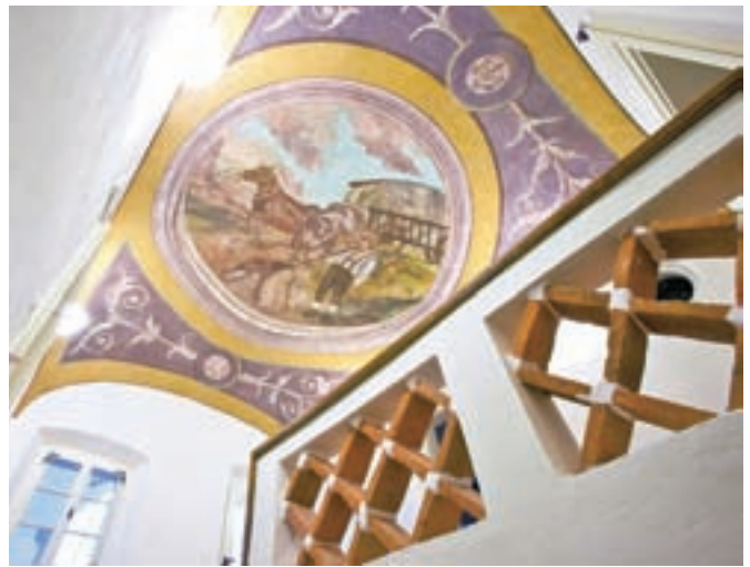
Z Lajerjevo hišo se v Kranju začenja uresničevati zamisel o kulturni četrti.

igrišča po vsej Sloveniji, obnovila še dve košarkarski igrišči.