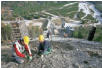
V Planici raste Nordijski center.