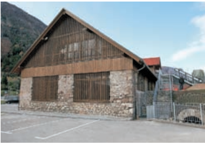
Kolperna na Stari Savi je bila nekdanj skladišče oglja. Z obnovo so ohranili njeno avtentičnost, hkrati pa ji vdahnili novo življenje.