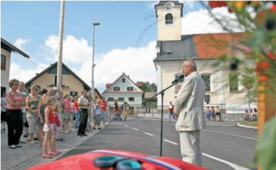
Novo komunalno in cestno infrastrukturo v Vogljah so v uporabo uradno predali avgusta.

Novo kanalizacijsko in vodovodno omrežje v Vogljah, Športno-kulturni dom v Voklem in prizidek k vrtcu v Šenčurju so največji letošnji projekti v občini Šenčur.