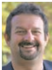
Župan Damijan Perne