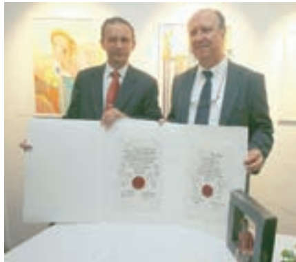
Ob desetletnici sodelovanja Škofje Loke in belgijskega Maasmecheln sta župana vnovič podpisala pogodbo o sodelovanju.

Spomladi je probleme, povezane z spletjo pri gradnji poljanske obvoznice, zasenčila problematika otrok, ki ob spomladanskem vpisu niso bili sprejeti v vrtec. Šlo je za 99 otrok, nastala situacija pa je terjala hitro odločitev o postavitvi mobilne enote vrtca v Podlubniku. Gradbena dela so se začela septembra, sredi novembra pa so nove modularne enote že stale. V vrtcu Biba je prostora za okoli sto otrok. Trajnejša rešitev pa bo gradnja na območju nekdanje vojašnice, kjer se občina z ministrstvom za obrambo dogovarja o brezplačnem prenosu zemljišča. Za zahodni del vojašnice pa se je začela javna razprava o gradnji doma starostnikov, varovanih in tržnih stanovanj.