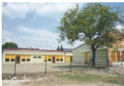
Novi vrtec Češmin je sprejel 147 otrok.