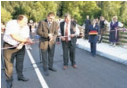
Ob krajevnem prazniku so za promet odprli prenovljeni Petacov most v Kranjski Gori.