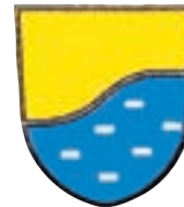
Občina Vodice Kopitarjev trg 1 Vodice