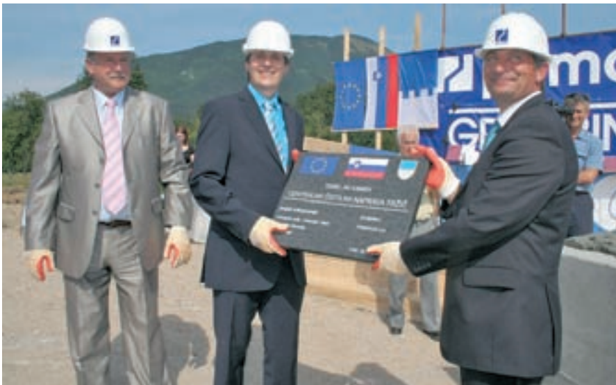
Avgusta so položili temeljni kamen za centralno čistilno napravo na Brezovem.

Občina Tržič uresničuje projekte, ki so pomembni za bodoči razvoj. Po obnovi šestih ulic v starem jedru Tržiča so začeli posodabljati komunalne napeljave na Trgu svobode in Balosu. Gradijo centralno čistilno napravo.