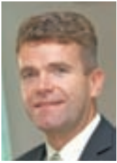
Župan Milan Čadež