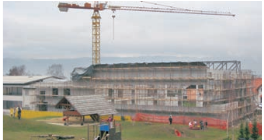
Gradnja večnamenske dvorane pri OŠ Žirovnica

in kulture. Slednje je tudi ena od prioritarnih nalog zavoda za turizem in kulturo, ki želi prevzeti upravljanje s Finžgarjevo in Prešernovo hišo. Spomladi je sicer minilo 70 let, odkar so v spominski muzej razglasili Prešernovo hišo, ki naj bi v kratkem postala spomenik državnega pomena.