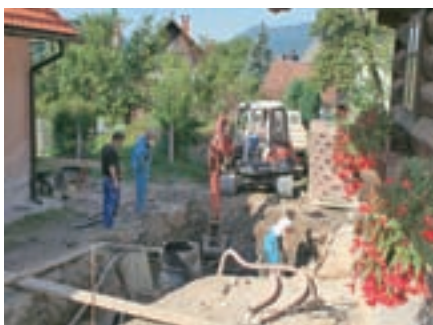
Letos so nadaljevali in končali gradnjo kanalizacije v Spodnjih Dupljah.