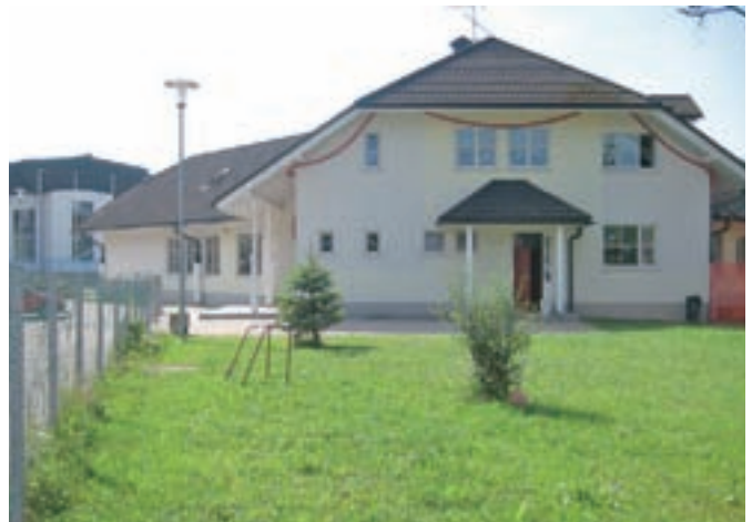
Vrtec Murenčki v Cerkljah bodo povečali.

cestišče. Pogodbena vrednost gradbenih del znaša skoraj 830 tisoč evrov, skupaj s projekti, geodetskimi posnetki, obnovo sekundarnih vodov, javne razsvetljave, obnove opornih zidov in mostov na reki Pšati pa bo naložba stala preko milijona evrov, v kar pa še niso všteti stroški arheoloških izkopavanj, nadzora in raziskav. Občina bo na odseku Poženik-Šmartno vgrajevala tudi glavni kolektor za medobčinski vodovod Krvavec, kar bo predvidoma stalo okoli pol milijona evrov.