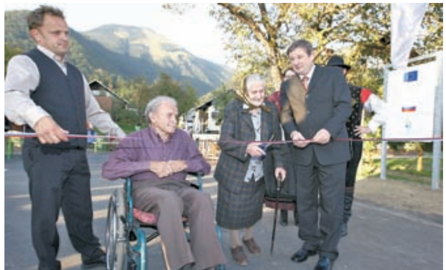
Ob odprtju največje občinske naložbe, ureditvi infrastrukture v Novi vasi in Preddvoru

tudi Layerjevo kapelico. V občini kot pomembno ocenjujejo tudi gradnjo zavetišča na Zaplati, kamor so vložili blizu 10 tisoč evrov in veliko prostovoljnega dela domače planinske sekcije, odprli pa ga bodo najverjetneje leta 2011. Uresničitvi se bližajo tudi načrti v zvezi z zdravstvenim domom, ki je pred koncem leta pridobil gradbeno dovoljenje, začela pa se je tudi še gradnja.