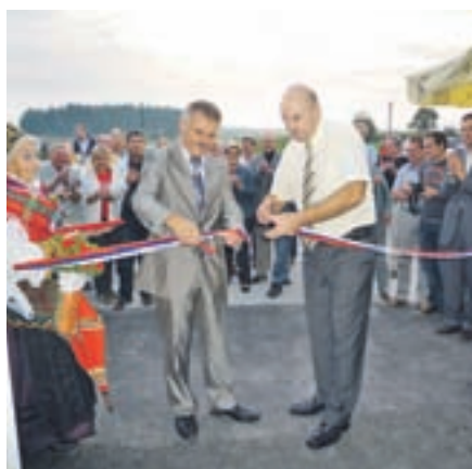
Slavnostno odprtje prizidka k športni dvorani

Ena največjih letošnjih pridobitev je prizidek k športni dvorani. Najmlajši so dobili novo igrišče pri šoli v Mostah, začela pa so se gradbena dela v okviru ureditve središča Komende.