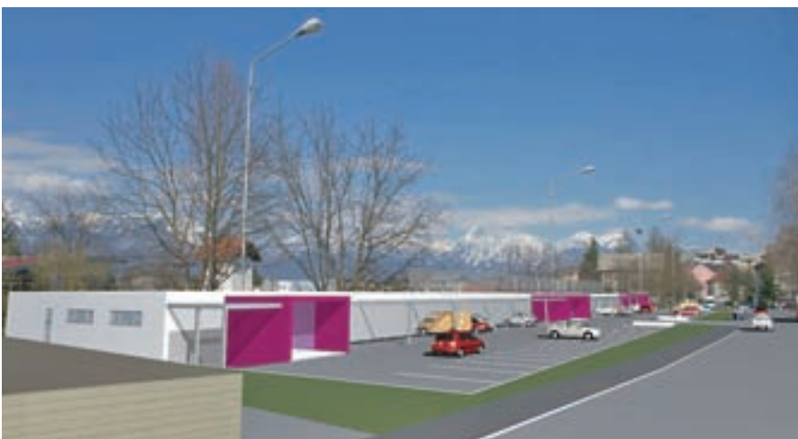
Na Hujah naj bi do pomladi 2011 zrasla nova parkirna hiša s 400 parkirišči.

Še vedno so problem tudi parkirišča, problematiko parkiranja v mestu pa naj bi rešili v teku naslednjih dveh let, saj je podjetje Kranjska parkirišča že predstavilo gradnjo dveh parkirnih hiš. Eno, z okoli štiristo parkirnimi mesti, naj bi do pomladi leta 2011 zgradili na Hujah, drugo, z okoli tristo parkirnimi mesti, pa do poletja 2011 pod Slovenskim trgom.