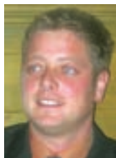
Župan Peter Torkar

Občina Gorje Zgornje Gorje 43 4247 Zgornje Gorje