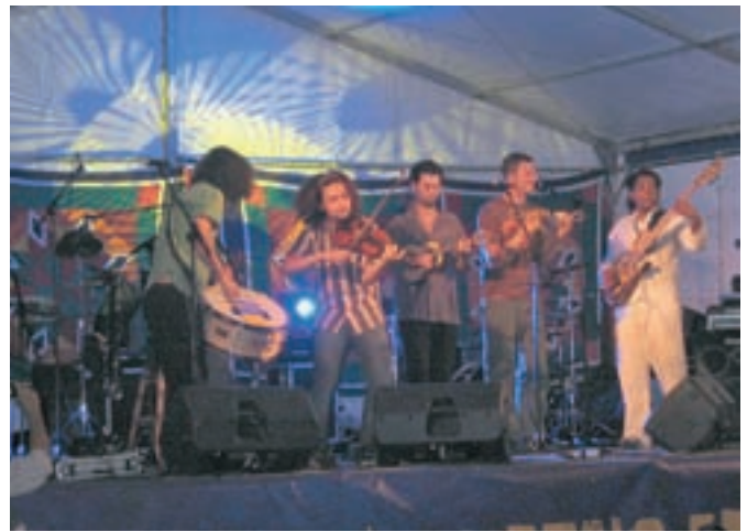
Na Okarina etno festivalu je navdušila tudi brazilska skupina Orquestra do fuba.