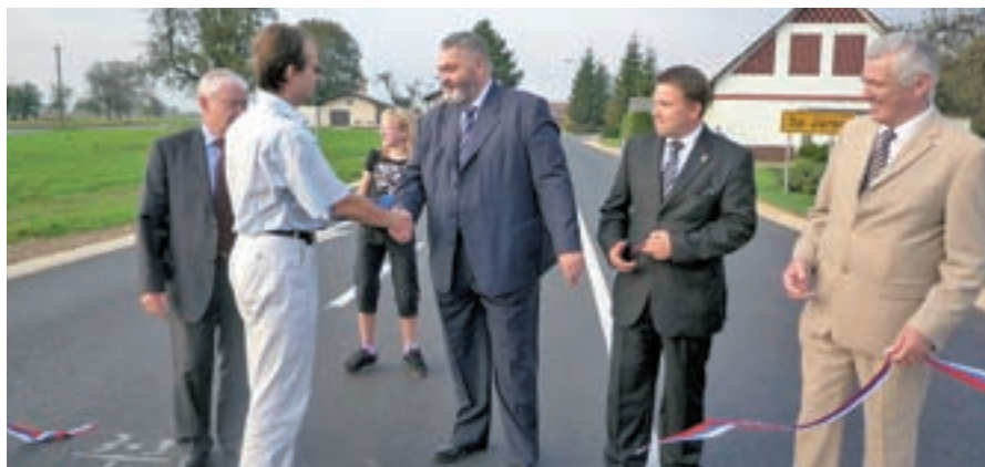
Prenovljeni odsek ceste Domžale-Duplica je bolj varen za promet.

Občino je v začetku leta obiskal predsednik republike Danilo Türk, ki si je med drugim ogledal knjižnico, zdravstveni dom in Območno obrtno zbornico Domžale. Pohvalil je razvoj podjetništva in opozoril na nekatere okoljske probleme. Domžalska tržnica je bogatejša za mlekomat, kjer je mogoče kupiti dnevno sveže mleko iz kmetije Černivec iz Zgornjih Jarš. Na Studencu je potekal 9. Poletni kulturni festival, člani domačega Kulturnega društva Miran Jarc Škocjan pa so praznovali 60-letnico. 125 let delovanja je letos praznovala Godba Domžale, 80 let pa godbeni dom.