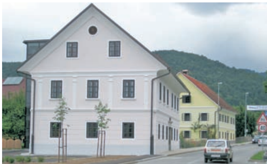
Letos so končali triletno obnovo Petrovčeve domačije v središču Cerklj.