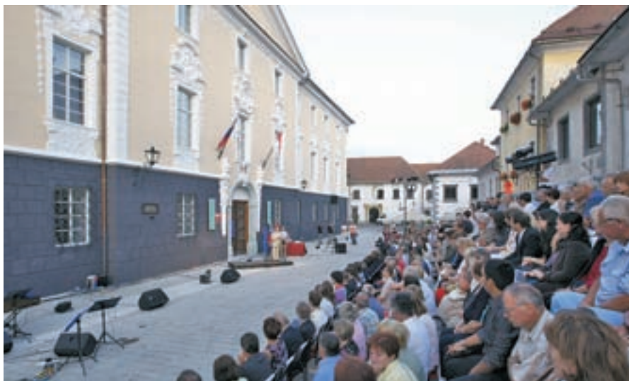
Prireditev ob občinskem prazniku je bila tokrat na Linhartovem trgu.

Leto 2009 so v Radovljici začeli z investicijo, ki se je že v nekaj mesecih izkazala za še bolj njuno, kot je kazalo sprva: na Posavcu so namreč po le štirih mesecih gradnje v uporabo predali novi vrtec, v katerega se je skupaj z vzgojiteljicami preselilo 91 malčkov s Posavca in okolice.