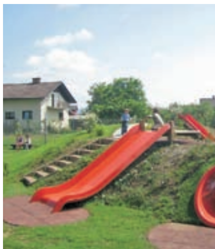
Pred šolo v Mostah so uredili veliko otroško igrišče.