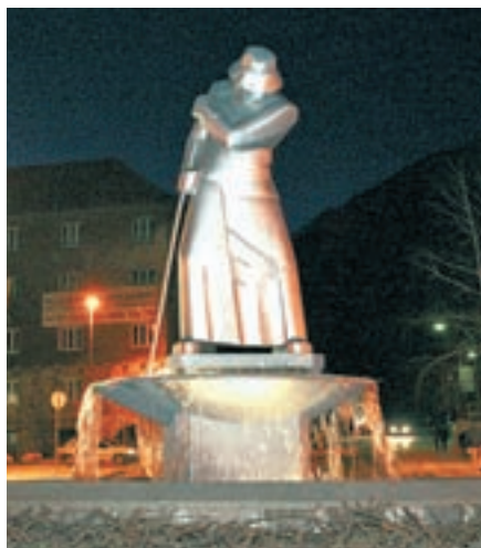
Kip železarja s podstavkom in vodnjakom v krožišču v bližini stavbe Občine Jesenice je delo Romana Savinška.