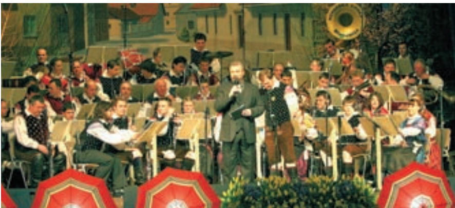
Godba Mengeš je visok jubilej praznovala tudi s prireditvijo 25. Mengeška marena.