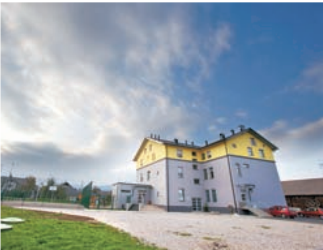
Šola v Žabnici je od začetka letošnjega šolskega leta temeljito prenovljena.