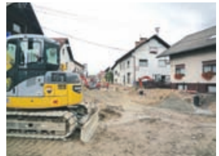
Prenova Prešernove ceste