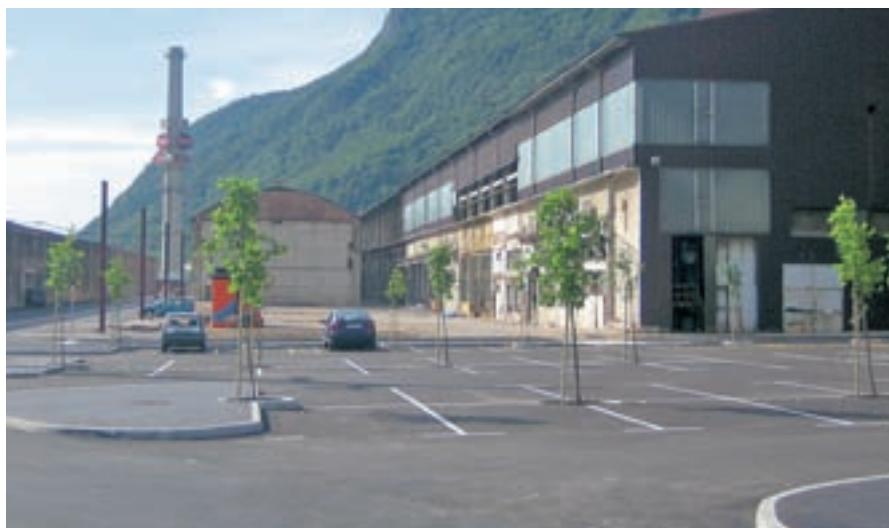
Poleg povsem obnovljene komunalne infrastrukture so na območju nekdanjega Fiproma pridobili tudi 220 novih parkirnih mest.

Kar nekaj naložb so speljali tudi v jeseniških vrtcih in osnovnih šolah. V