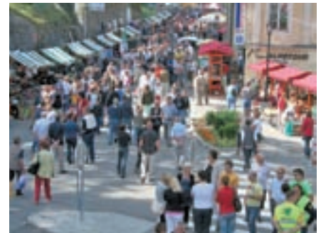
Tudi 42. Šušarska nedelja je privabila v Tržič številne obiskovalce.