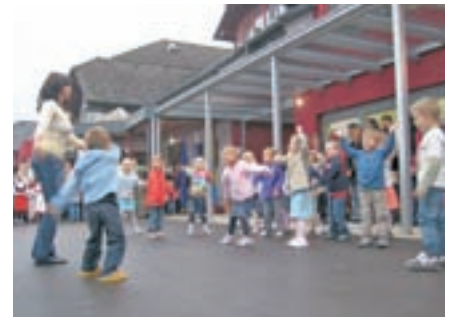
Malčki so se razveselili večjega vrtca v Šenčurju.