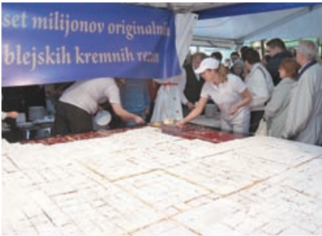
Ob jubileju blejske kremne rezine so razrezali kremno rezino velikanko.