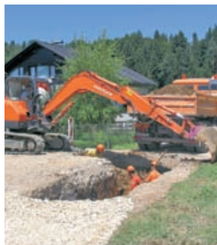
Temeljito je bila prenovljena tudi Lebarška pot v Vodících.