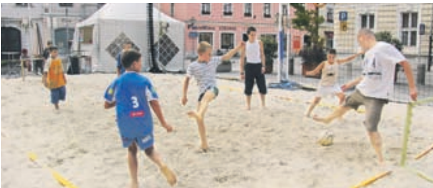
Predvsem mlajši so letošnje poletje uživali tudi na mestni plaži na Glavnem trgu.