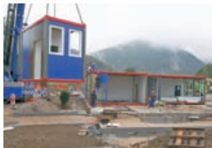
Zaradi prostorske stiske škofjeloških vrtcev so letos postavili modularno enoto - Biba.

Letošnje dogajanje v občini Škofja Loka je v postno-velikonočnem času zaznamovala uprizoritev Škofjeloškega pasijona, junija odprtje obnovljenega Sokolskega doma, v drugi polovici leta gradnja modularne enote vrtca Biba, ves čas pa so aktualni zapleti pri gradnji Poljanske obvoznice.