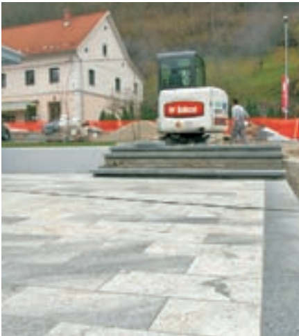
Središče Gorenje vasi bo urejeno do pomladi 2010.