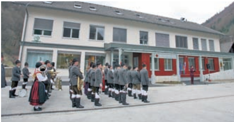
Po predlanskih poplavah so v Železnikih konec marca odprli prenovljen zdravstveni dom.

Poplavalna sanacija Železnikov se je letos zaradi krepko okrnjenih državnih sanacijskih sredstev zelo upočasnila. Zaključili so gradnjo kanalizacije Selca-Dolenja vas, začela pa se je gradnja optičnega omrežja.