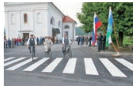
Utrinek s slovesnega odprtja v celoti obnovljene gorenjevaške šolske poti.