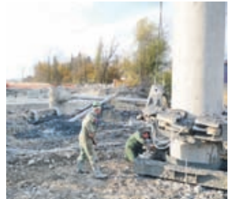
Začela se je gradnja Povezovalne lokalne ceste B31.