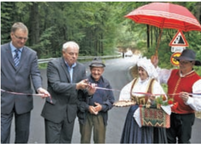
Odprtje obnovljene in razširjene ceste Grad-Ravne