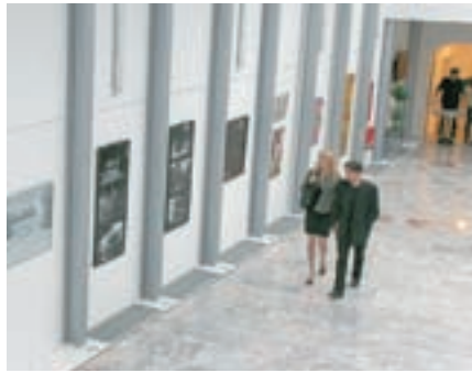
Občinski praznik je bil v Škofji Loki še posebej prazničen zaradi odprtja Sokolskega doma.

Leto 2009 je v Škofji Loki zaznamovalo tudi rušenje propadajoče stavbe kopališča v Puštalu, kjer je lastnica Zavarovalnica Triglav. To je samo eden od objektov v njeni lasti, ki predstavljajo sramoto v občini, nerešena ostajata še hotel Transturist in gostišče Krona. Letos so v občini zaprli odlagališče odpadkov v Dragi. Odprto je bilo le še toliko časa, da so z odpadki zapolnili odlagalni prostor, nato pa se ga je dokončno zaprlo. Loške smeti sedaj vozijo na gorenjsko deponijo na Malo Mežaklo v občini Jesenice.