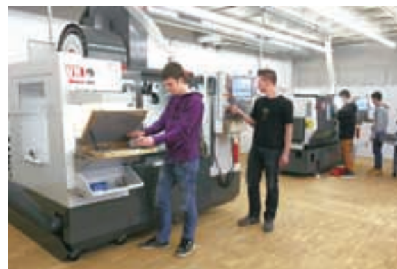
Dijaki in študenti pri usposabljanju uporabljajo nove industrijske CNC stroje.