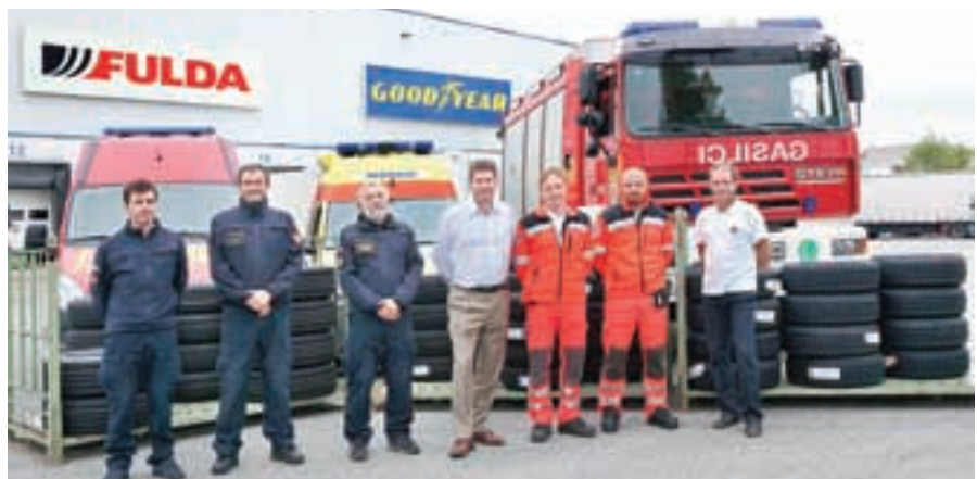
Goodyear Dunlop Sava Tires vsako leto opremi gasilce in reševalce.