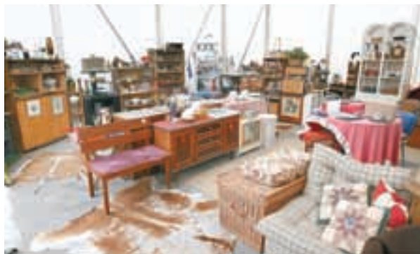
V prostorih »PONOVNE RABE« lahko oddate uporabne izdelke in po ugodnih cenah izberete nekaj zase.