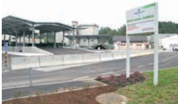
Uporabnikom in okolju prijazen zbirni center za odpadke