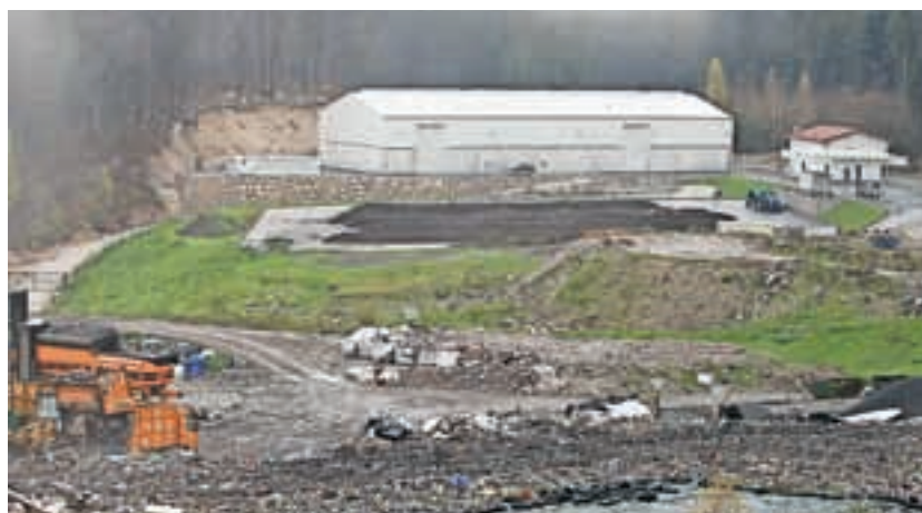
Objekt za obdelavo odpadkov ob odlagališču Mala Mežakla je postavljen.

V objektu se bodo obdelovali mešani komunalni odpadki, to je preostanek komunalnih odpadkov, ki jih gospodinjstva prepuščajo lokalnim komunalam, običajno v črnih zabojnikih, in sicer z območij tistih (gorenjskih) občin, iz katerih so se odpadki že v preteklosti dovažali in odlagali na odlagališču komunalnih odpadkov Mala Mežakla na Jesenicah, danes pa je te odpadke, v skladu s predpisi s področja ravnanja z odpadki, potrebno predhodno obdelati. Ker je v zadnjih letih zaznati precejšen padec nastalih količin tovrstnih odpadkov, nekatere občine iz Gorenjske pa so vmes našle rešitev za svoje odpadke tudi drugod, bo možno sprejemati odpadke v obdelavo tudi od drugod.