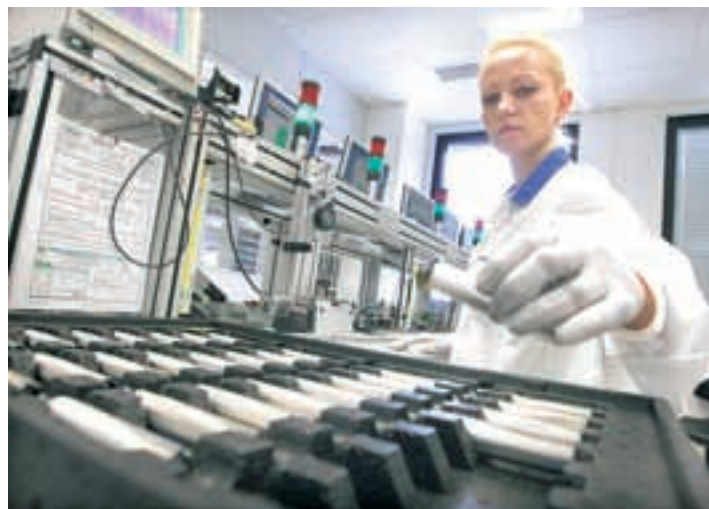
Iskra Mehanizmi v Lipnici zaganja novo, povsem avtomatizirano proizvodnjo radarskih tempomatov. Investicija je največja v zgodovini podjetja.

Ključni pa so zaposleni. Brez doprinosov vsakega zaposlenega ne bi bilo razvoja in tudi v prihodnosti bodo zaposleni, njihovo znanje, sposobnosti in energija ključni za razvoj podjetja.