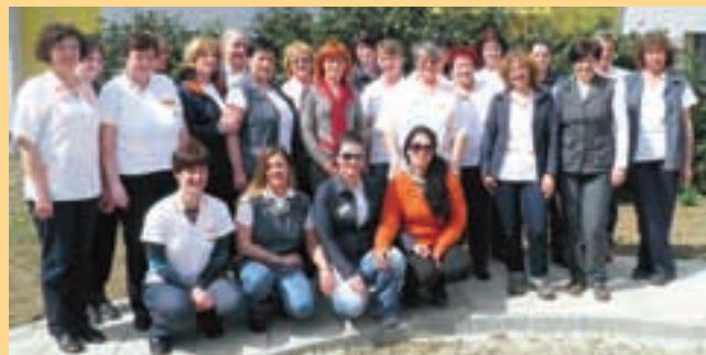
Zaposleni v enoti pomoči na domu

Upravičenec je do storitev pomoči na domu upravičen, če potrebuje najmanj dve opravili iz dveh različnih sklopov. Upravi-