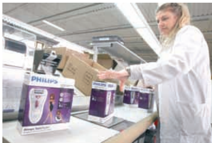
Proizvodnja aparatov za osebno nego v Kamniku je za Iskro Mehanizme zelo pomembna, saj so tudi na tem področju postali razvojni dobavitelj.