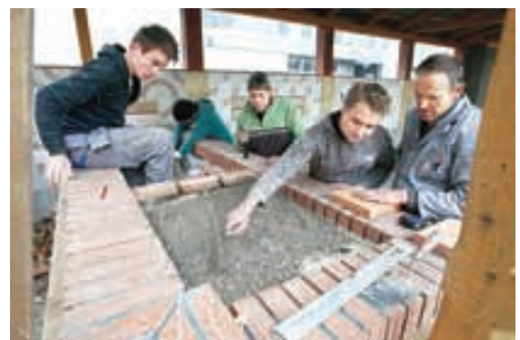
Bodoči pečarji v šoli pridobijo veliko praktičnih izkušenj.