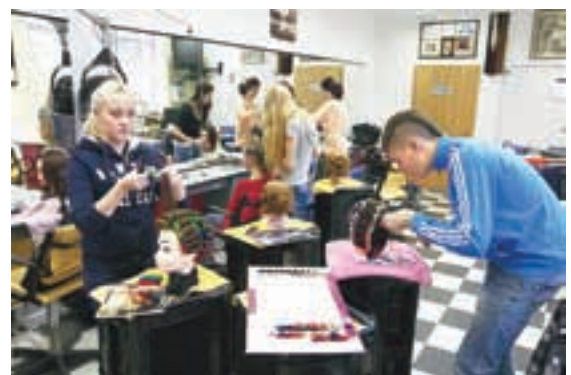
Frizerke in frizerji praktično znanje pridobivajo v sodobnem šolskem frizerskem salonu.