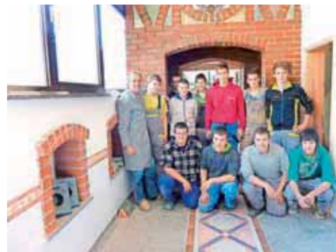
Dijaki ob vhodu v učne delavnice, ki so jih generacije dijakov ob pomoči donatorjev uredile v štirih letih.