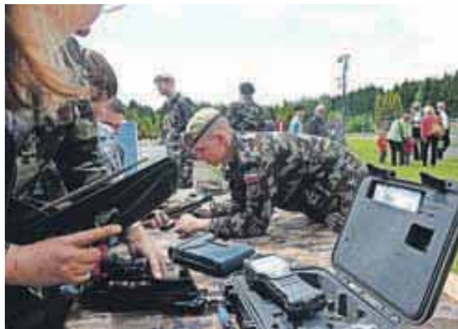
Vojaki so obiskovalcem radi predstavili tudi novosti v vojaški tehniki.