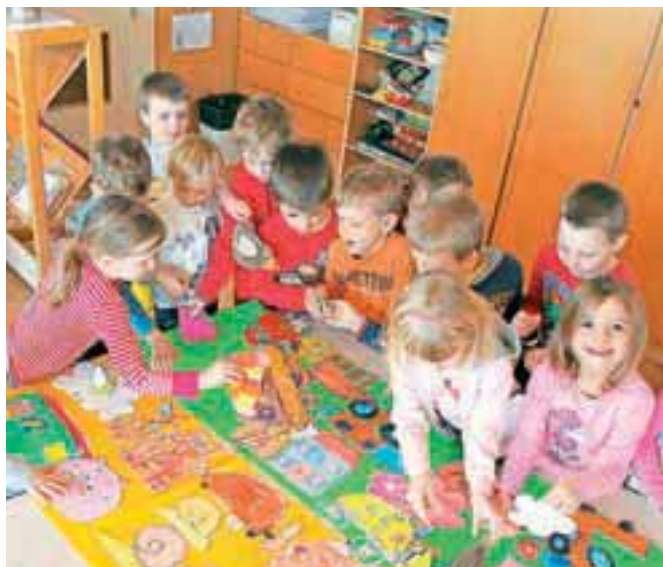
V kranjskih vrtcih tudi v novem šolskem letu ne bo prostora za vse otroke.

»Za novo šolsko leto načrtujemo odprtje štirih novih oddelkov. Dva bosta v enoti Mojca, saj naj bi GTV izpraznila prostore do poletja, dva pa v enoti Čebelica, od