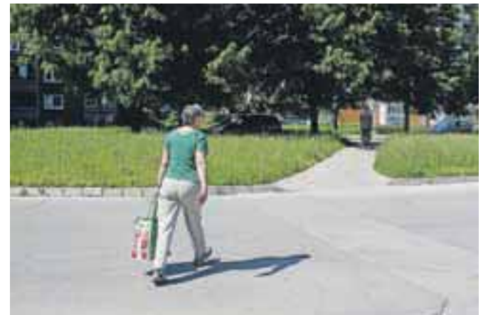
Domačini na Planini opozarjajo, da je bolj kot parkiranje po pločniku nevarna nova tlakovana pot čez »otok«, saj ne na eni in ne na drugi strani ni prehoda za pešce.

»Pločnik na Ulici Tončka Dežmana povezuje Cesto talcev in varno pot do Osnovne šole Jakoba Aljaža in vrtcev Mojca in Najdihojca na Ulici Nikola Tesla. To je edini pločnik, ki omogoča varno hojo pešcev na tem območju. V zvezi z nedovoljenimi ravnarji udeležencev v prometu na tem območju medobčinska redarska služba prejema tudi prijave komunalne službe, ki ne more zapeljati na Ulico Niko-