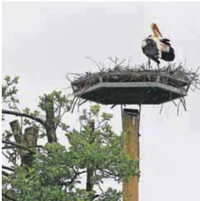
Kljub slabemu vremenu in prestavljenemu gnezdu sta se štorklji vrnili na Mlako pri Kranju.

Očitno pa štorkelj hladna pomlad, skoraj zimsko vreme in gnezdo na novem gnezdilnem drogu niso zmedli, tako da sta se ta mesec vrnili na Mlako pri Kranju in se udomačili v svo-