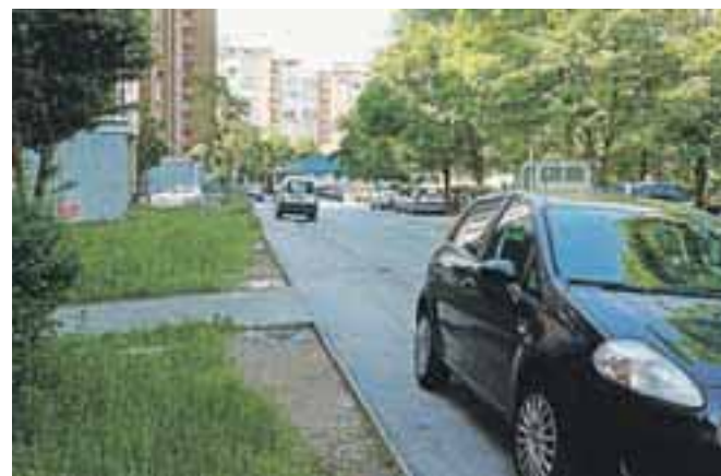
Na Ulici Tončka Dežmana na pločniku sedaj ni več veliko vozil, saj kršitelji redno dobivajo plačilne naloge medobčinskega redarstva.

»Na Planini nas živi veliko Kranjčanov, ki plačujemo davke, zato pričakujemo, da bodo za naše bivanje in tudi varnost pristojni tudi kdaj poskrbeli. Nekaj možnosti za izgradnjo parkirišč zagotovo še je, predlagali smo tudi že rešitve,« dodajajo stanovalci Ulice Tončka Dežmana.