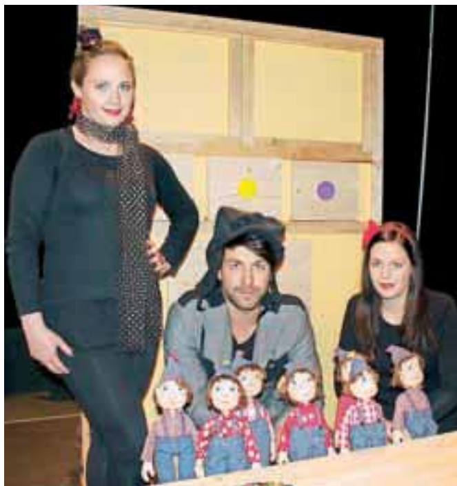
Sneguljčica s Tepinovimi tremi: Ajdo, Aljažem in Ajšo, bo očarala otroke, pa tudi staršem ne bo dolgčas.

Ponikvarjeva je pravljico skupaj z mlado igralsko ekipo zasnovala današnjemu času primernim otrokom. Tem obliki multimedijskega in elektronskega razvedrila ni več dovolj zgolj golo pripovedovanje neke zgodbe. Otroci se morajo v pravljici počutiti domače, skorajda resnični. Igralci so v vlogah, v katerih se spretno izmenjujejo, duhoviti,