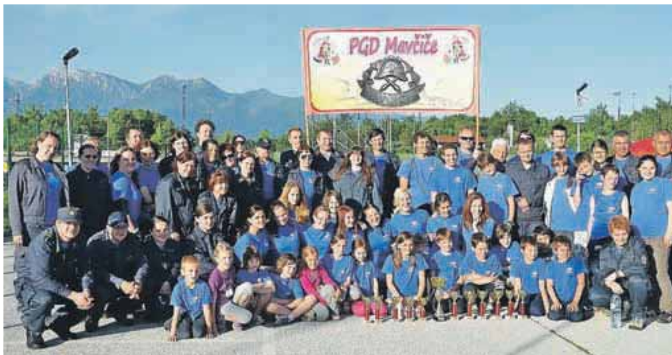
Gasilke in gasilci iz Mavčič odlično nastopajo tudi na različnih tekmovanjih.

znuje 105-letnico delovanja. Veselica z bogatim srečelovom bo potekala kar dva dneva. V petek, 14. junija, ob 19.30 bo najprej srečanje veteranov Gasilske zveze Mestne občine Kranj, za zabavo in dobro glasbo bodo poskrbeli člani skupine Mambo kings. V soboto, 15. junija, ko bo ob 19.30 še tradicionalno srečanje članic Gasilske zveze Mestne občine Kranj, pa se bodo prepustili ritmom ansambla Donačka.