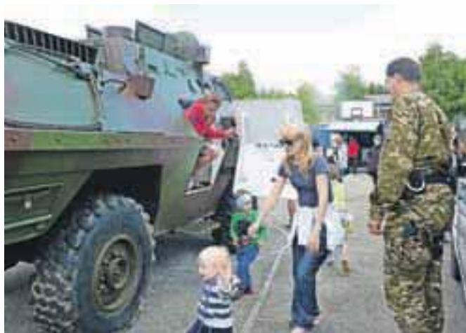
Obiskovalci so si z zanimanjem ogledovali vojaška vozila.