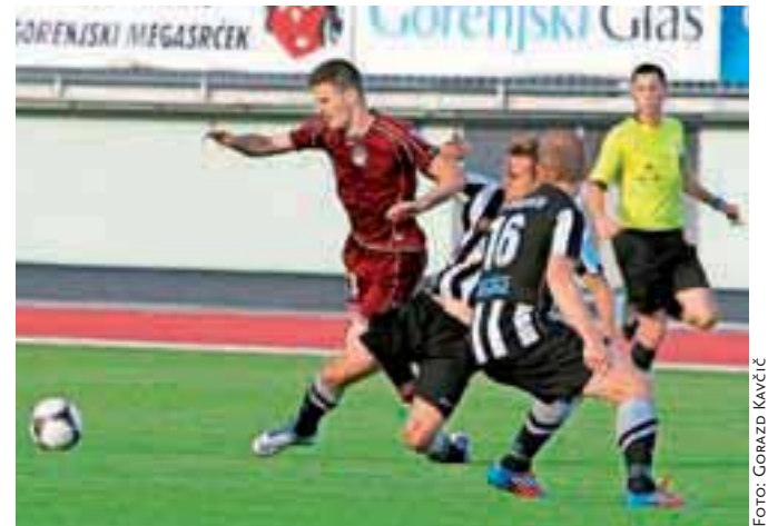
Nogometaši Triglava so se od sezone poslovili s porazom, z ekipo Mure pa so izgubili tudi pred domačimi navijači.