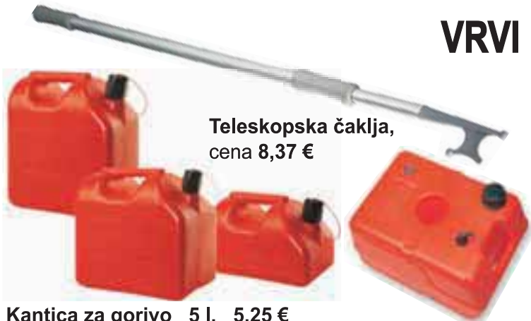
Teleskopska čaklja, cena 8,37 €

Kantica za gorivo 5 l, 5,25 € Kantica za gorivo 10 l, 7,53 € Kantica za gorivo 20 l, 12,05 € Rezervoar za gorivo 22 l, 18,90 €