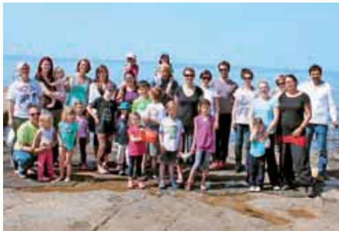
Letošnjega prvega tabora za otroke se je udeležilo sedem družin.

Na taboru so tako zasnovali program za vso družino, pri čemer so dopoldneve preživljali skupaj, popoldne pa so pripravili ločene dejavnosti za starše in otroke. Starši so lah-