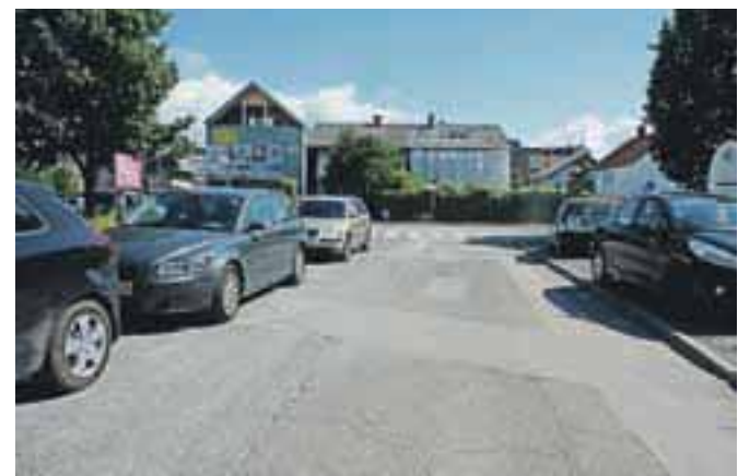
Na sosednji Gogalovi ulici so vozila parkirana tako po cestišču kot po pločnikih, vendar redarji očitno sklepajo, da tam nepravilno parkiranje nikogar ne ogroža.