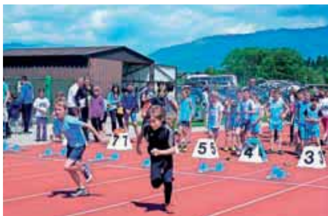
Na kranjskem mitingu se je zbralo skoraj osemsto atletov in atletinj.

Sicer pa so tudi letos organizatorji poskrbeli, da so udeleženci in njihovi spremlje-