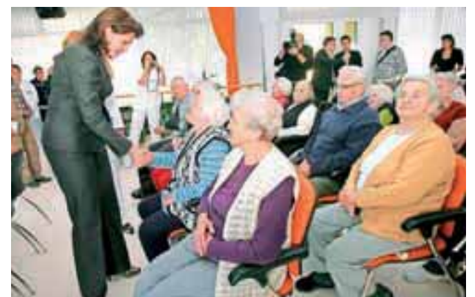
Obiska predsednice vlade so bili veseli tudi v domu upokojencev Kranj.