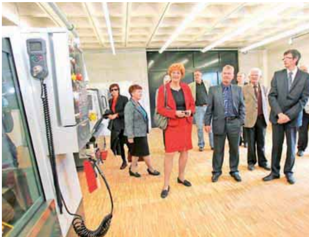
Novi prostori medpodjetniškega izobraževalnega centra

Evropske unije oblikuje center odličnosti kot gibalno inovativnosti in tehnološkega razvoja za področja mehatronike, elektrotehnike in računalništva.« Z izgradnjo MIC so pridobili nove prostore za CNC opremo ter štiri laboratorije in kabinete v pritličju zgradbe, v prvem nadstropju pa so uredili dve učilnici in laboratorija ter tri predavalnice in štiri kabinete.