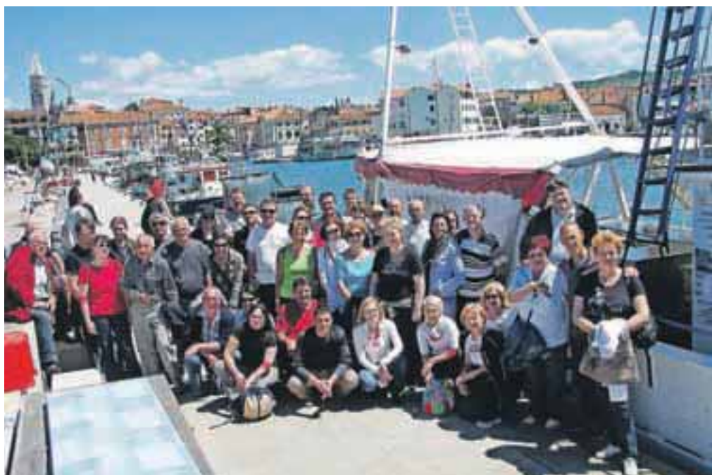
Krvodajalci so v organizaciji RK Orehek–Drulovka tokrat darovali kri v Izoli.