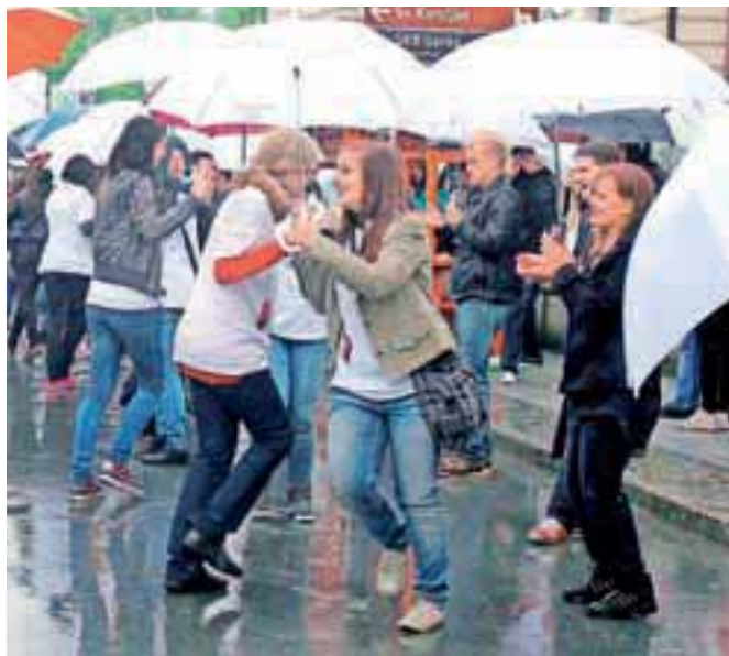
Maturantsko četvorko so plesali tudi v Kranju.

sreče, da postanete del uspešne zgodbe te dežele, ki jo boste vi najbolj sooblikovali,« je maturantom zaželel Pahor in jih obenem spomnil, da do uspeha ne vodi kraljevska pot, a verjame, da bodo tudi probleme sposobni premagati. Da jim ne manjka vztrajnosti, so dokazali že s tem, da so z nasmehi na obrazih v mrazu in dežju zaplesali četvorko, pa čeprav tokrat rekord ni bil v ospredju. V dvajsetih slovenskih mestih je sicer letos četvorko po podatkih Plesne zveze Slovenije plesalo okrog sedem tisoč maturantov, ki so se jim pridružili še maturanti v Srbiji, na Slovaškem, Češkem, Madžarskem, Hrvaškem, v Bosni in Hercegovini, Črni gori in letos prvič tudi v Estoniji.