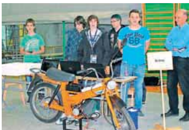
Trije dijaki Šolskega centra Kranj so bencinski motor predelali v električnega.