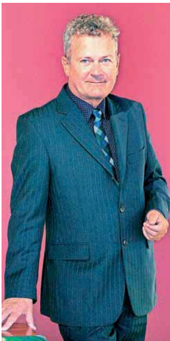
Župan Mestne občine Kranj Mohor Bogataj

Naj še enkrat poudarim, da je projekt Gorki dobro pripravljen projekt in da je bilo opravljenega veliko zahtevnega dela. Samo za primer, za izvedbo kanalizacijskega omrežja na območju Mestne občine Kranj je bilo potrebno skleniti več kot 700 služnostnih pogodb, kar pomeni prav toliko dogovarjanj z lastniki zemljišč. Za nameravano investicijo smo pridobili tudi vso potrebno