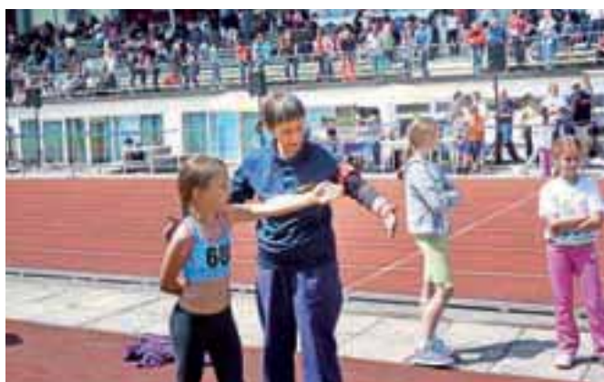
Ob mladih so bili z dragocenimi nasveti na stadionu tudi trenerji.

valci v eni redkih sončnih majskih sobot uživali v prijetnem druženju, mnogi