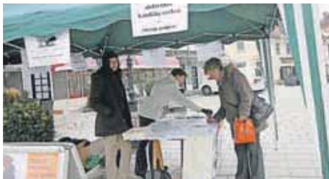
Tudi Kranjčani so se pridružili več kot 17 tisoč podpisnikom, ki so za popolno obdavčitev katoliške cerkve.

Sredi meseca so člani tako imenovane Koalicije za ločitev države in cerkve tudi v Kranju zbirali podpise za petico za popolno obdavčitev katoliške cerkve. Na stojnici, ki so jo postavili nasproti Mlečne restavracije, so pripravili različne materiale, med njimi tudi časopis Razmisli in sodeluj, ki so ga pomenovali časopis za ljudi, ki iščejo resnico. "Odziv v Kranju je bil dober. V dveh dneh smo na stojnici dobili preko petsto podpisov, povečalo pa se je tudi podpisovanje petici-