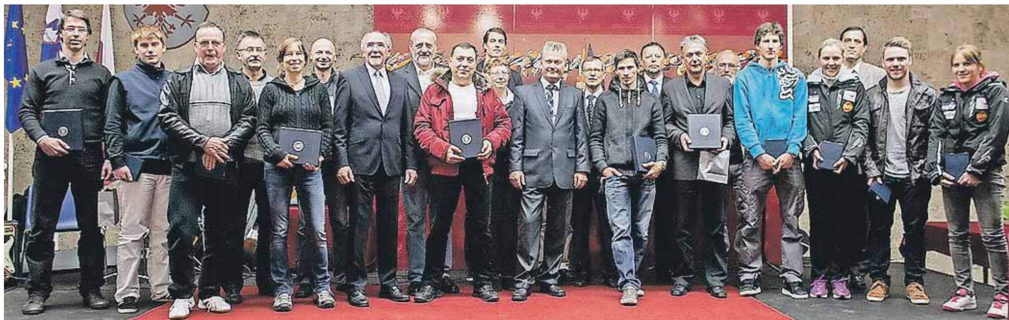
Letos je športna priznanja prejelo kar 85 kranjskih športnikov in športnih delavcev ter tri ekipe.