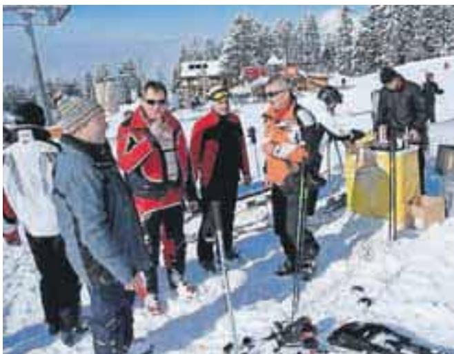
Srečanje je bilo namenjeno tudi krepitvi medobčinskega sodelovanja in druženju, ki se je nadaljevalo še dolgo po tekmovanju.