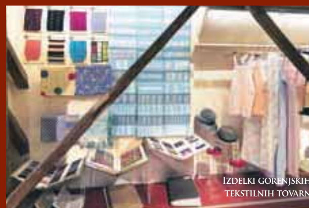
IZDELKI GORENJSKIH TEKSTILNIH TOVARN

NOVA STALNA RAZSTAVA V GRADU KHISLSTEIN V KRANJU