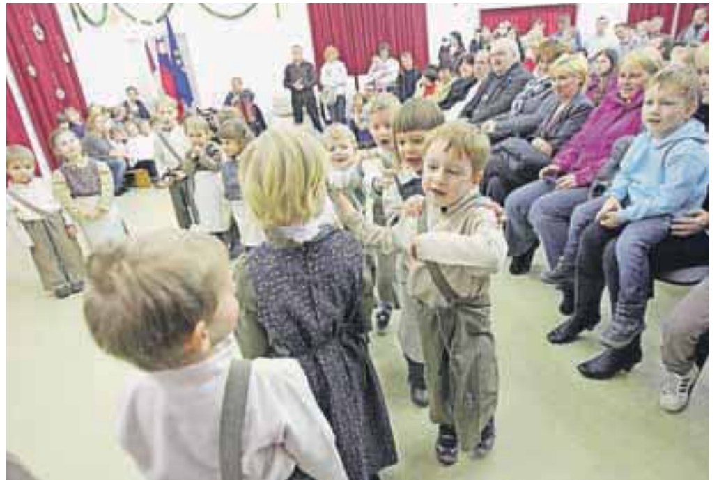
Otroci so se z nastopom pod mentorstvom strokovnih delavk več kot izkazali, predvsem pa dobili veliko bogatega znanja iz zakladnice ljudskega izročila.