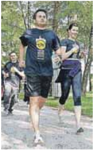
Tekačem se aprila lahko pridružite na prvih treningih.