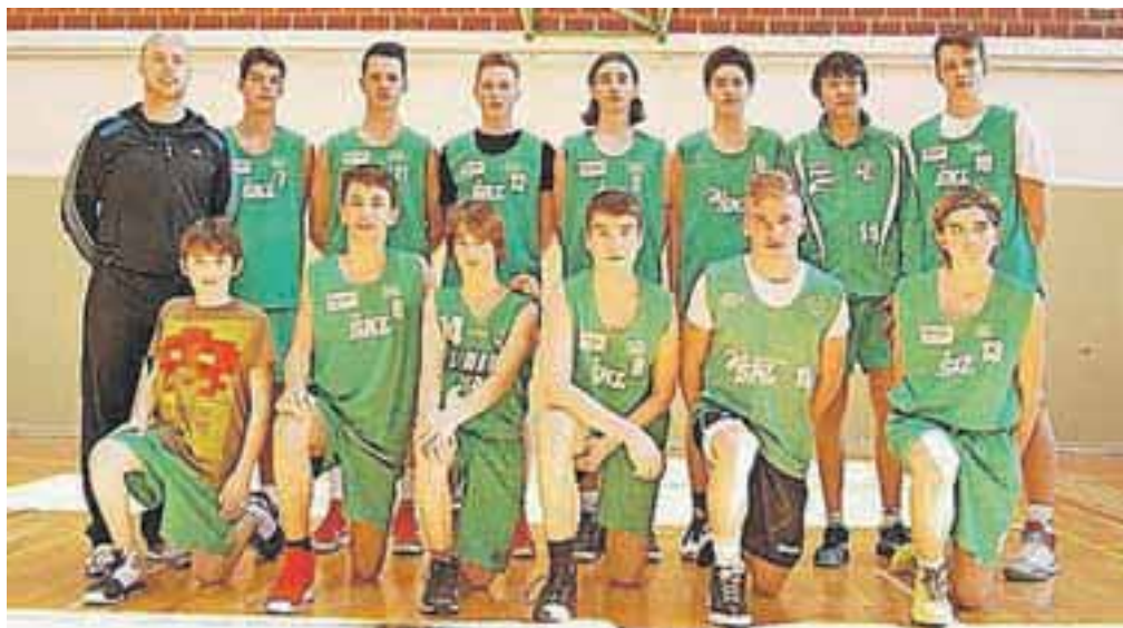
Ekipa starejših dečkov Osnovne šole Simona Jenka

»Z dosedanjimi rezultati sem vsekakor zadovoljen. Letos še ne poznamo pora-