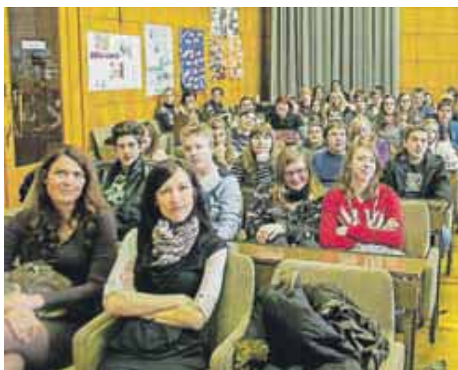
Na letošnjem medobčinskem otroškem parlamentu je sodelovalo 112 učencev iz Kranja in okoliških občin.