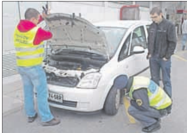
Med pregledom so preverili ustrezne profile in brezhibnost pnevmatik.