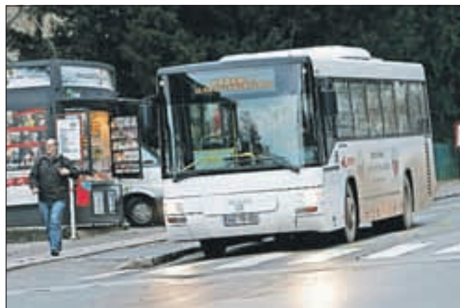
Z več in pogostejšimi linijami naj bi mestni promet bolj zaživel.

nimi skupnostmi v občini, saj je bilo v preteklosti precej pripomb, da mestni promet ni dovolj blizu vsem občanom. Če bi namreč hoteli mestni promet bolj približati uporabnikom, bi morale biti nekatere linije pogostejše, uvesti pa bi morali nekaj novih postajališč ter kar nekaj prog. To bi pomenilo dodatno število kilometrov, kar pa bi morali plačati ali uporabniki ali občina z večjo subvencijo ali pa bi vsak prispeval del denarja. Kot so povedali predstavniki Omega consulta, so bili anketiranci večina naklonjeni boljši pokritosti z mestnim potniškim prometom in bi bili za to pripravljeni tudi več plačati.