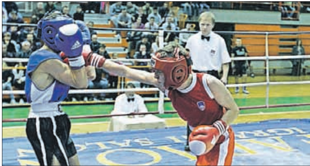
Gledalci so si v dvorani na Planini lahko ogledali zanimive boje.