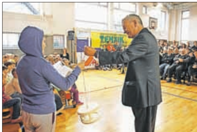
Župan Mohor Bogataj je ob novi pridobitvi učencem na podružnični šoli podaril ptičjo krmilnico.