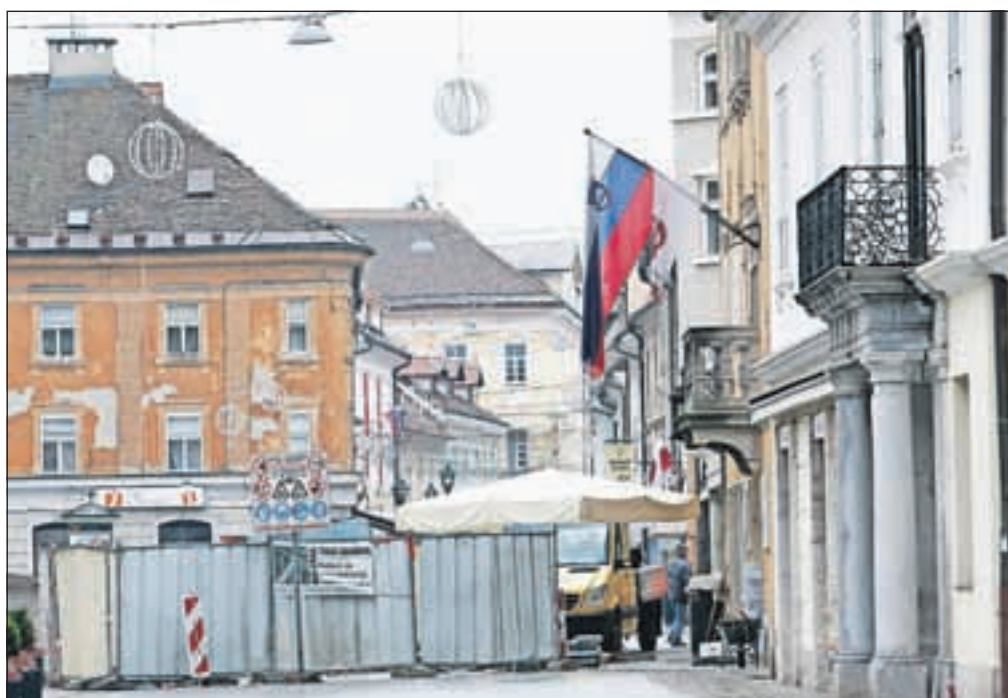
Prenova ulic in trgov je moteča tako za obiskovalce kot prebivalce, vendar pa Kranj z njo že dobiva lepšo podobo.

»S predstavniki vaše krajevne skupnosti se srečujemo skoraj vsak mesec in skupaj skušamo najti najboljše rešitve, kako urediti življenje v mestu. Glede parkiranja lahko rečem, da se na občini zavedamo, da parkirna mesta v starem mestnem jedru morajo biti, ni pa nujno, da so v vseh delih. Parkiranja naj ne bi bilo med cerkvijo in gledališčem, na Maistrovem trgu, v Prešernovi ulici in Glavnem trgu. Glede parkiranja na Poštni ulici nima nihče nič proti in tam naj se zagotovi maksimalno število