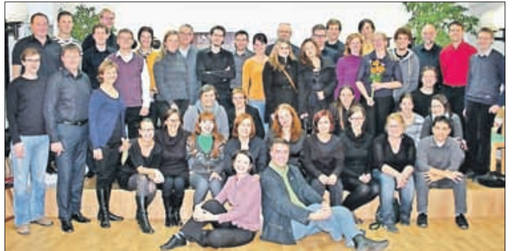
V pevsko dirigentski družini so se stakala prisrčna prijateljstva, ki bodo vodila k nadaljnjim sodelovanjem.