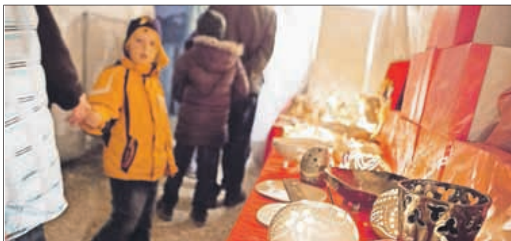
Praznično vzdušje se je začelo z razstavo božičnih in novoletnih aranžmajev, od 21. decembra naprej pa si bo moč v rovih ogledati razstavo jaslic.