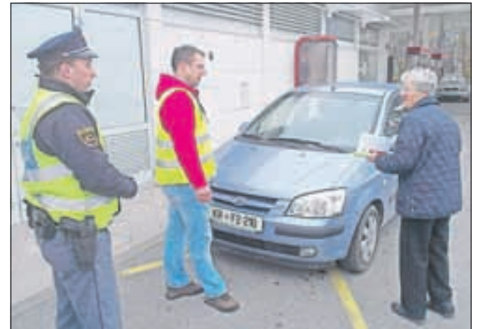
Voznike so opremili s strgali za čiščenje vetrobranskih stekel.