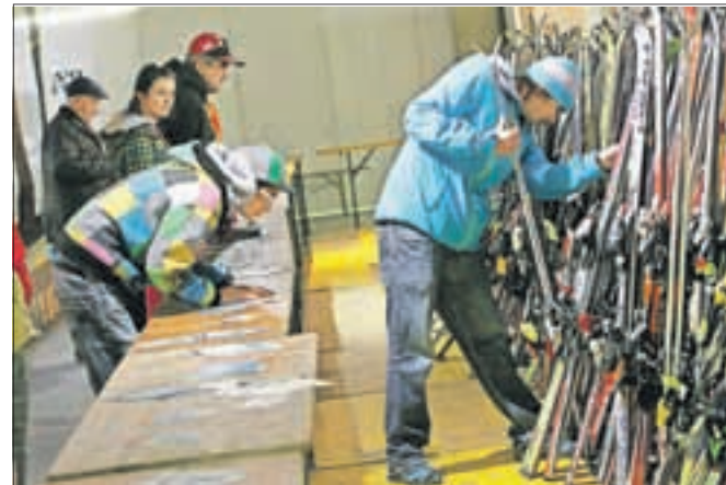
Za rabljeno smučarsko opremo je še vedno veliko zanimanje.

soč dvesto smuč, palic in snežnih desk, večina pa je zamenjala lastnika. Tudi smučarskih čevljev so dobili v prodajo skoraj dva tisoč, prodanih je bilo nekaj več kot polovico. Prodali so več kot polovico od 617 prejetih drsalk ter več kot polovico te-