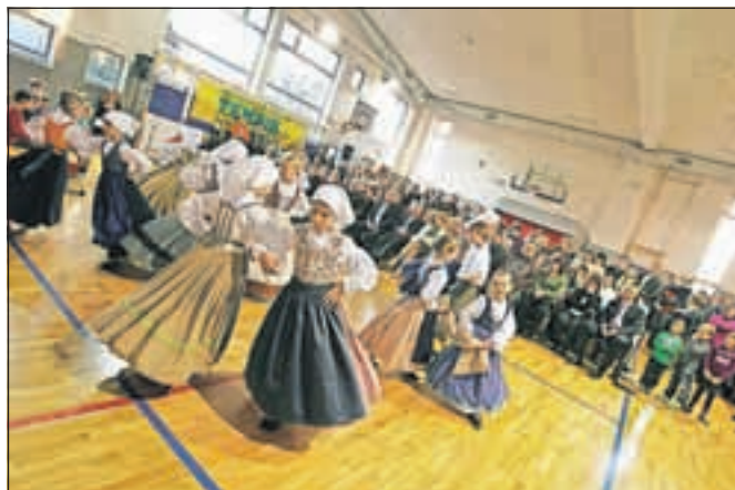
Ob odprtju nove telovadnice so šolarji številnim obiskovalcem pripravili prisrčen program.