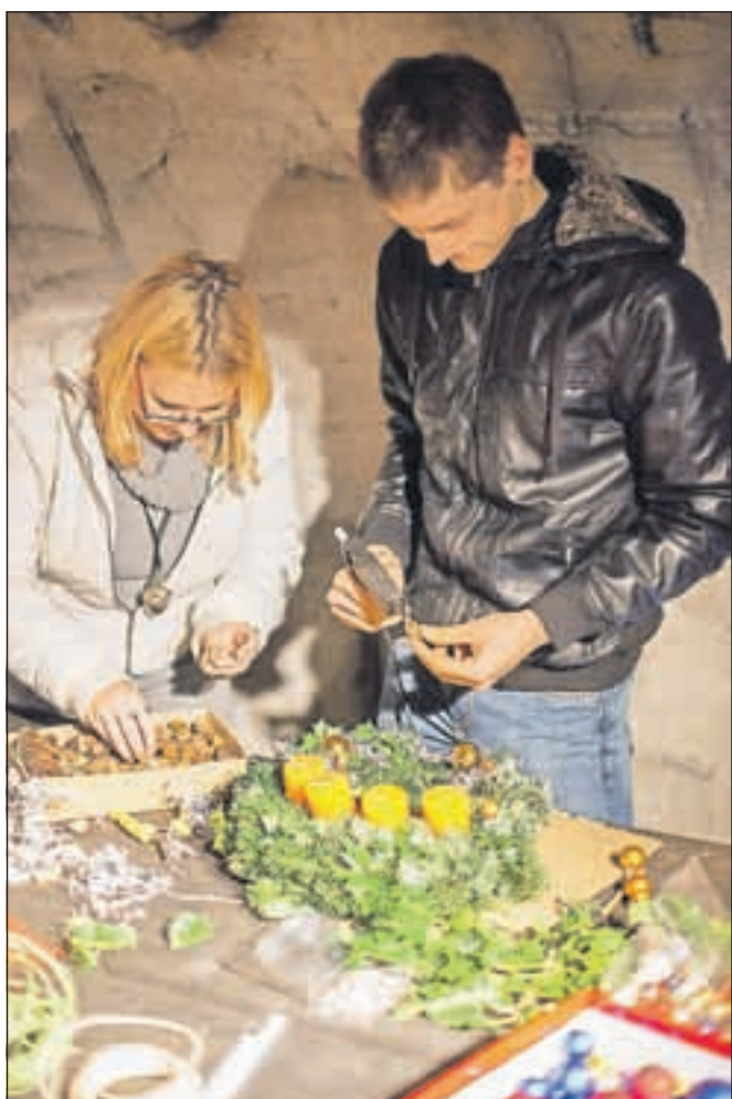
Svetovnemu mladinskemu prvaku v kolesarstvu Mateju Mohoriču tudi izdelava adventnega venčka ni povzročala večjih težav.

kolesarstvu Matej Mohorič. »Priznam, da sem tokrat prvič izdeloval adventni venček. Navdušen sem zlasti nad tem, da se iz preprostih in ne dragih stvari lahko izdelajo tako lepe venčke,« je povedal Matej Mohorič, ki sicer doma rad pomaga pri praznični okrasitvi. »Navadno je pri prazničnem okraševanju glavna mami, drugi pa pomagamo tako pri postavitvi smrekice kot jaslic,« je tudi povedal Matej, ki, kljub temu da trenutno ne tekmuje, veliko časa preživlja na kolesu. »Ravno sedaj največ treniramo, saj imamo bazične priprave,« je še dodal šampion iz Podblice.