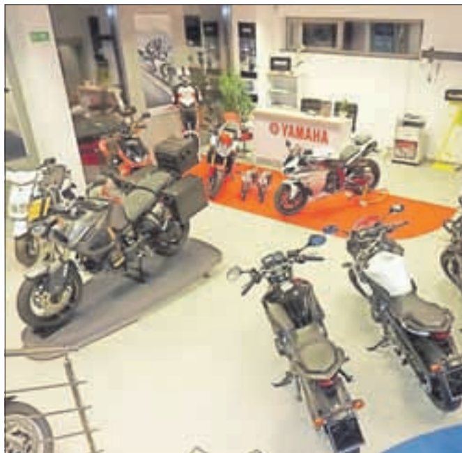
V novem salonu Štern bodo poleg motorjev ponujali tudi druge zanimive izdelke.

Poleg tega je del prostorov namenjen dodatni opremi, od dodatkov za motocikle, do čelad in motociklistične konfekcije. Na prejšnji lokaciji, ki je v neposredni bližini novega salona, podjetje Servis Štern kot pooblaščen servis in prodajalec motociklov znamke Yamaha še naprej opravlja servisno dejavnost.