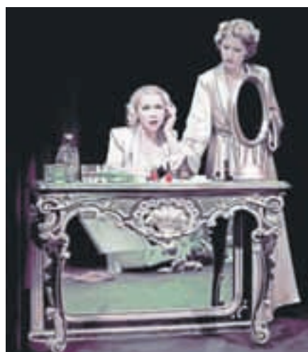
Marlene Dietrich

5., 6., 7., 8., 17., 18. in 22. decembra ob 20.00 v Stolpu Škrovec (za abonma, izven in konto)