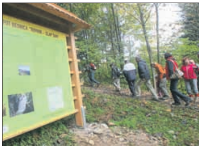
Začetek poti je dobro označen z veliko informativno tablo v Zgornji Besnici na koncu naselja Nova vas.

Začetek poti je dobro označen z veliko informativno tablo v Zgornji Besnici na koncu naselja Nova vas, avto lahko parkirate v bližini. Kako je prišlo do nastanka učne poti, je pojasnil vodja kranjske Krajevne enote Zavoda za gozdove Martin Umek, ki je pripravil projektno dokumentacijo: »Pred sedmimi leti, ko sem bil še revirni gozdar, sem opazil