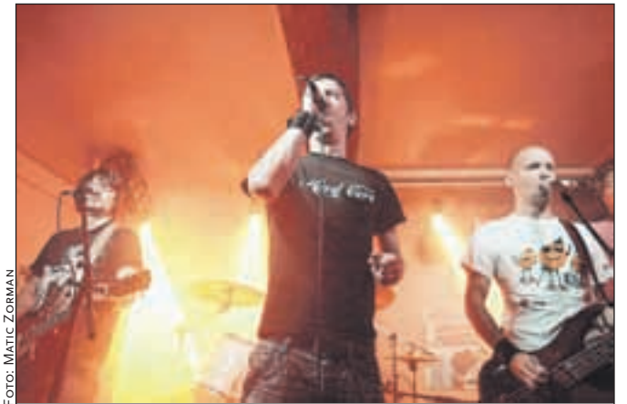
Člani skupine Niet se v Kranju počutijo kot doma.

Uspešna vrnitev skupine Niet nedvomno dokazuje, da navkljub spremembi političnega sistema po dvajsetih letih nekateri družbeni problemi ostajajo isti ali celo še hujši. Ostaja pa upanje, da je v 'srečni mladini', zbrani na koncertih skupine Niet, še zaznati sledi upornišva.