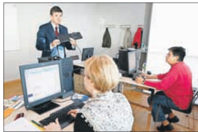
V Mestni knjižnici Kranj se je udeležencem programa simbioz@ v računalniški učilnici pridružil tudi predsednik Državnega sveta RS Blaž Kavčič.