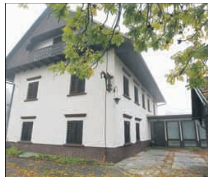
Ker stavba nekdanje gostilne Blažun propada, naj bi bil v njej medgeneracijski center.