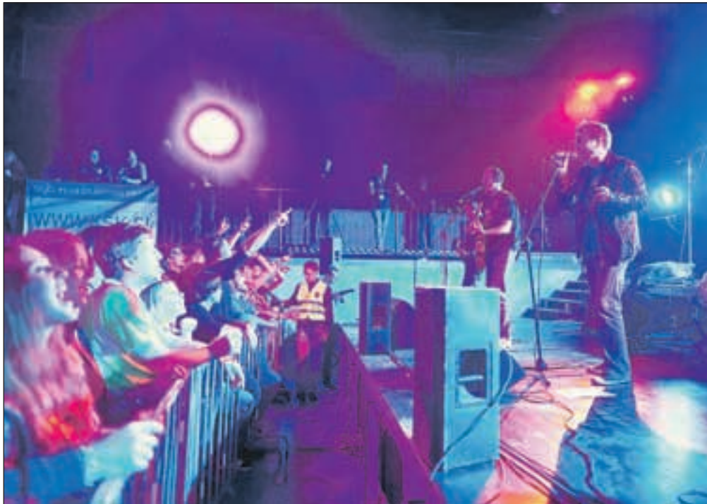
Skupina Miz je navdušila občinstvo – in obratno.