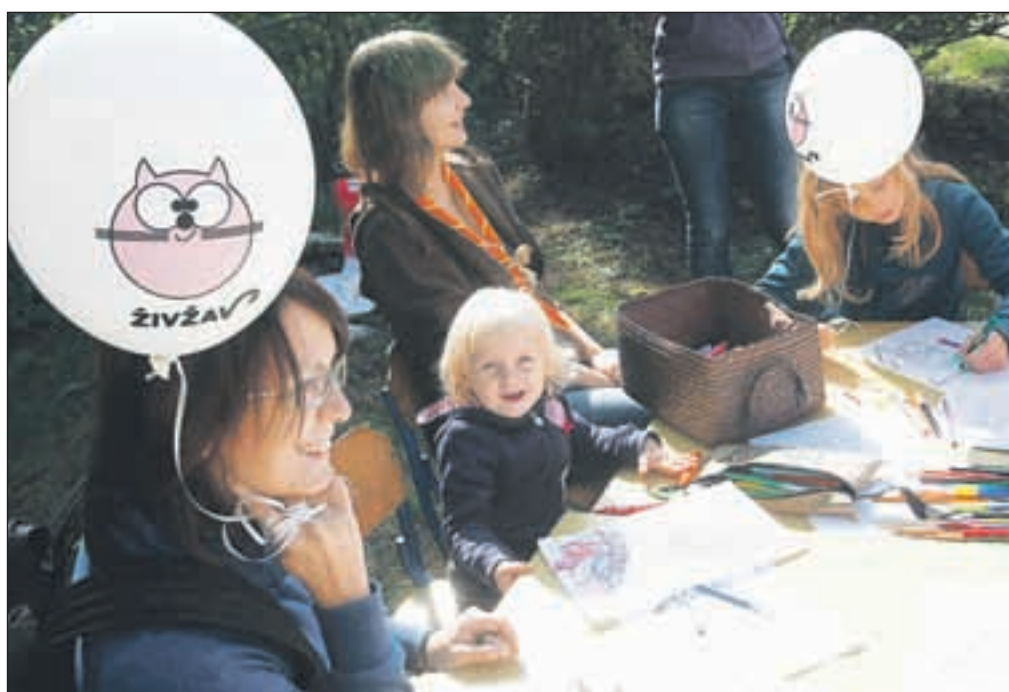
Otroci so se v mali jezikovni šoli lahko učili prvih besed v angleškem jeziku, kot vedno pa je bilo veliko zanimanja za risanje, saj so mladi radi upodabljali, kar so videli.