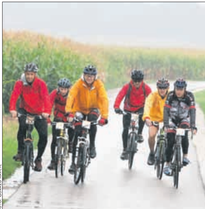
Kolesarji so na Gorenjsko pripeljali v nalivu.

Na koncu je zmagala ekipa, ki se najbolj približa povprečnemu času vožnje vseh ekip. Letos jih je sodelovalo devetintrideset, povprečen čas v cilju pa je bil 24:12:17. Najbolj se mu je približala ekipa Ta zadni, ki je osvojila prvo mesto.