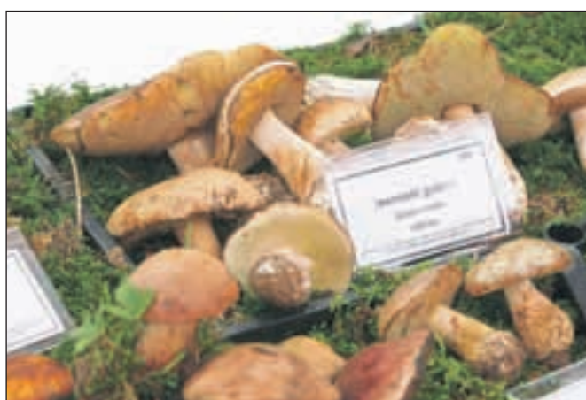
Jesenski goban ali jurček je goba, ki jo mnogi najraje nabiramo, saj jo najbolj poznamo.