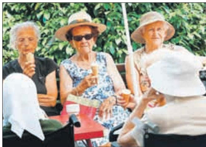
Stanovalci doma upokoјencev gradnjo in hrup potrpežljivo prenašajo, v domu pa so jim na vroč dan v parku pripravili tudi sladoleadni piknik.