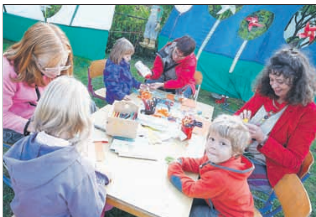
Poleg barvanja obrazkov so potekale različne delavnice, od športne, taborniške in Krice delavnica, kjer so mladi lahko ustvarjali z različnimi materiali.