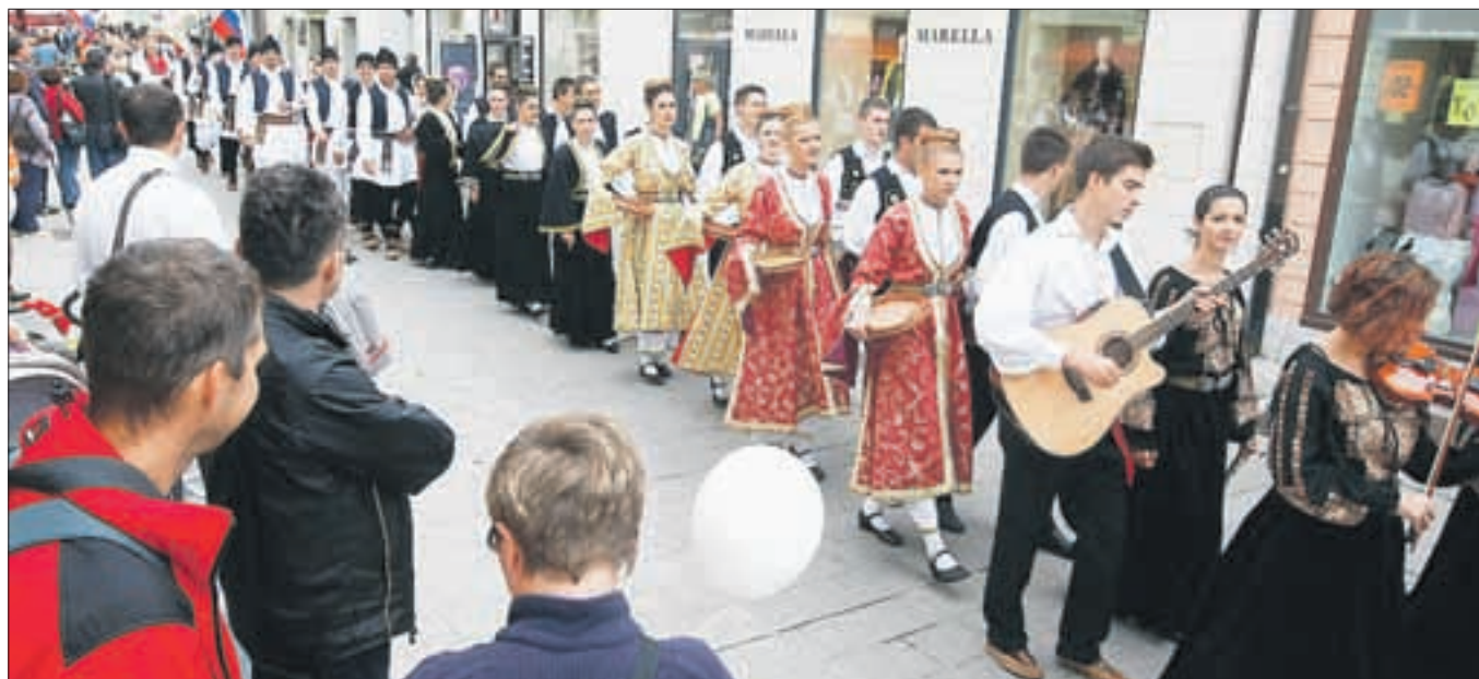
V Kranju je potekala pisana parada folklornih skupin, prav tako pa je SKPD Sveti Sava v okviru letošnjega Svetosavskega folklornega festivala pripravil vrsto prireditev, od razstav, literarnih večerov do koncerta.