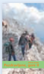
ali knjiga Pozdravljene gore II