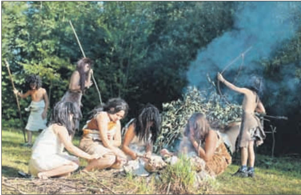
Pohodnikom so zaigrali odlomek iz predstave Življenje v času mamuta.