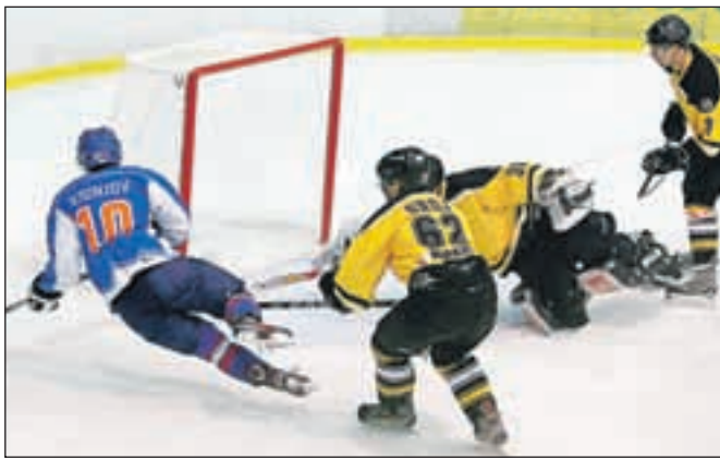
Hokejisti Triglava so mednarodno sezono doma začeli z zmago proti Slaviji (na sliki), ekipe Feldkircha minulo nedeljo pa jim ni uspelo premagati.