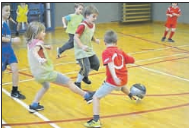
Nogomet je vedno popularnejši tudi med dekleti.