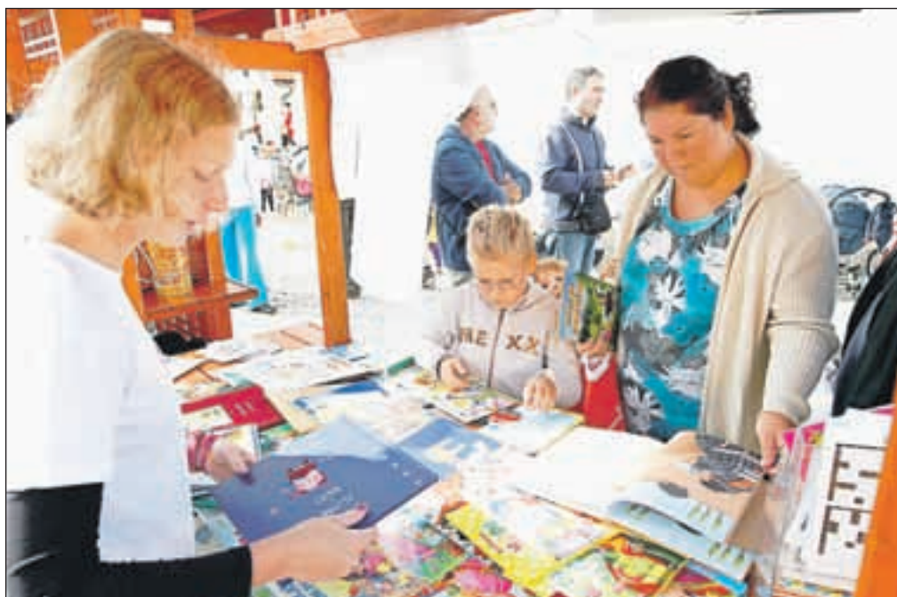
Otroci radi gledajo slikanice in berejo knjige, zato je bila dobrodošla tudi knjižna menjalnica, kjer so si otroci in straši lahko ogledali in tudi zamenjali knjige.