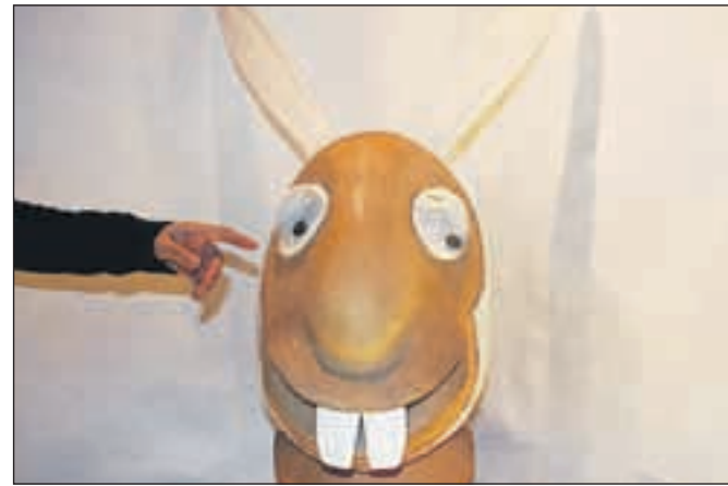
Fotoskica nekega trenutka na razstavi v peterokotnem stolpu