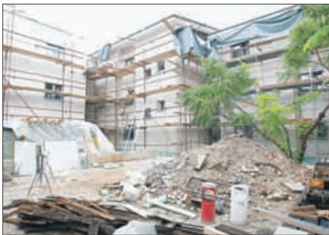
Trenutno stavbe prenavljajo, kar je le mogoče hitro, če bo gradbenikom služilo vreme, pa naj bi bila vsaj zunanja dela zaključena do konca novembra.

finančni načrt,« je tudi povedala Hočevnarjeva in pojasnila, da bodo v prihodnjem letu namestili prezračevalni sistem, sončne kolektorje in toplotne črpalke. »Zelo hvaležni smo našim stanovalcem in njihovim sorodnikom, ki z razumevanjem prenašajo hrup in vse ostalo, kar je povezano s prenovo,« je še povedala direktorica Zvonka Hočevnar in pojasnila, da stanovalcev v tem času zvečine niso selili iz sob, razen tam, kjer so menjali balkone, so jih preselili za štirinajst dni.