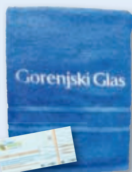
ali kopalna brisača s celodnevno vstopnico za Terme Snovik