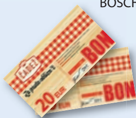
ali darilni bon mesarstva Čadež v vrednosti 20 EUR