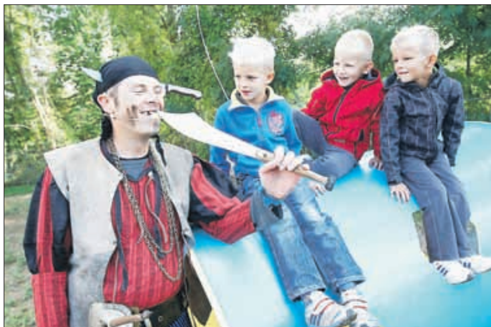
Na glavnem odru je med drugim za zabavo poskrbel Teater Cizamo s predstavo Kapitan Glista in zobati Jack, junaka pa so občudovali zlasti fantje.