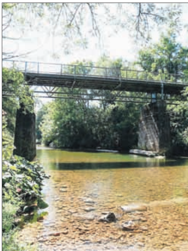
Čeprav je most v kanjonu Kokre star šele deset let, je že začel trohneti.