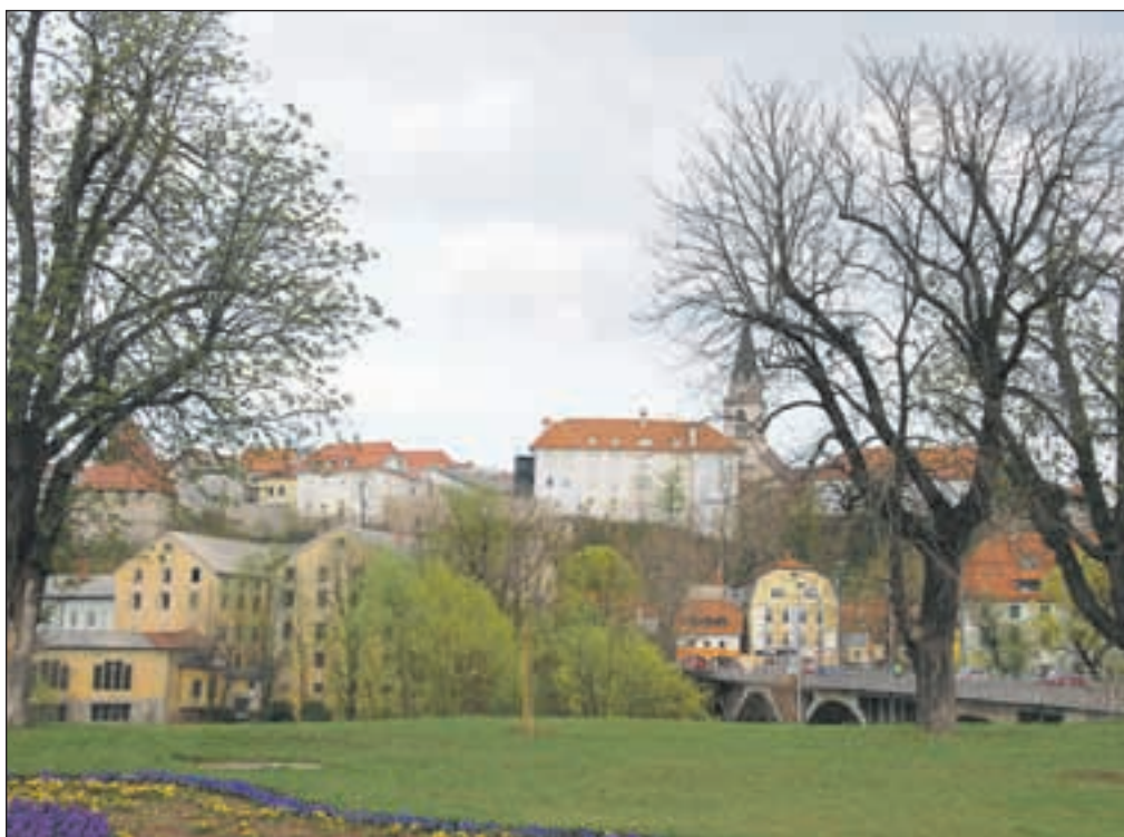
Pogled na prenovljeni kompleksu gradu Khislstein