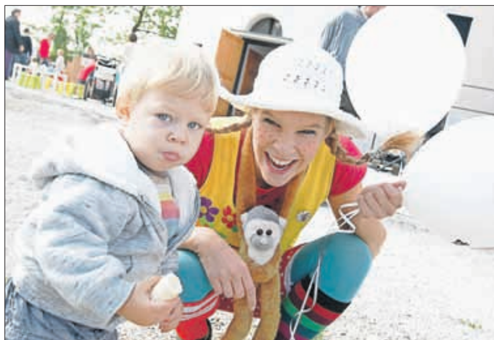
V starem Kranju so otroke pričakali klovni in različni pravljčni junaki, za dobro voljo pa je skrbela tudi vedno prikupna Pika Nogavička. / BESEDILO: VILMA STANOVNIK