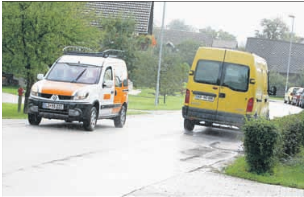
Zaradi prepovedi vožnje težkih tovornjakov po nekdanji glavni cesti med Kranjem in Jeprco ter Kranjem in Škofjo Loko se je sedaj na ozki cesti za Savo še večja gneča.

Zato pa so krajani Mavčič kar dobro povezani s sosednjo krajevno skupnostjo Orehek-Drulovka, čeprav imajo tam tudi svoje težave. »Trenutno je veliko pogovorov glede čistilne naprave, krajani pa so zelo ogorčeni zaradi sortiranja odpadkov. Po zaprtju zbiralnice na Tenetišah je smrad in hrup ve-