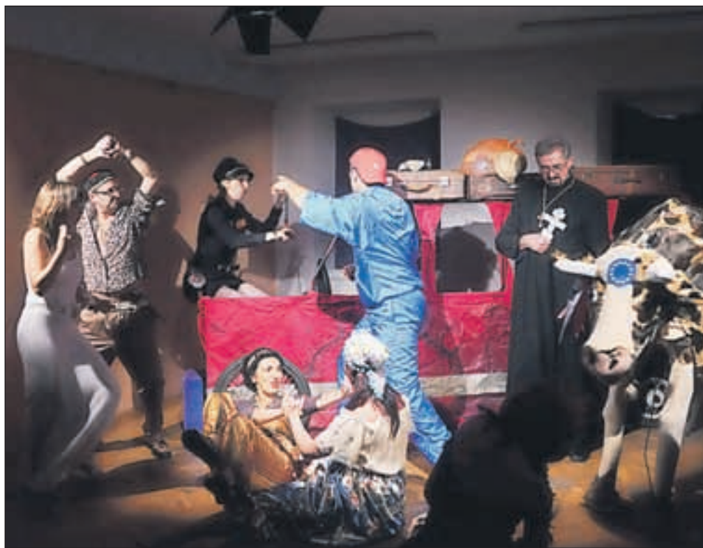
Udeleženci projekta Kovček svetlobe 2.12. v predstavi Vsi drugačni, vsi napačni ali Ljubav macht frei.