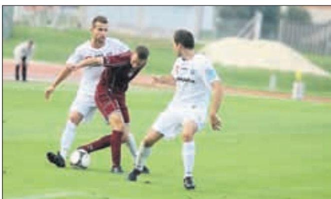
Nogometaši Triglava so minulo nedeljo na domačem igrišču gostili Celje in iztržili točko.