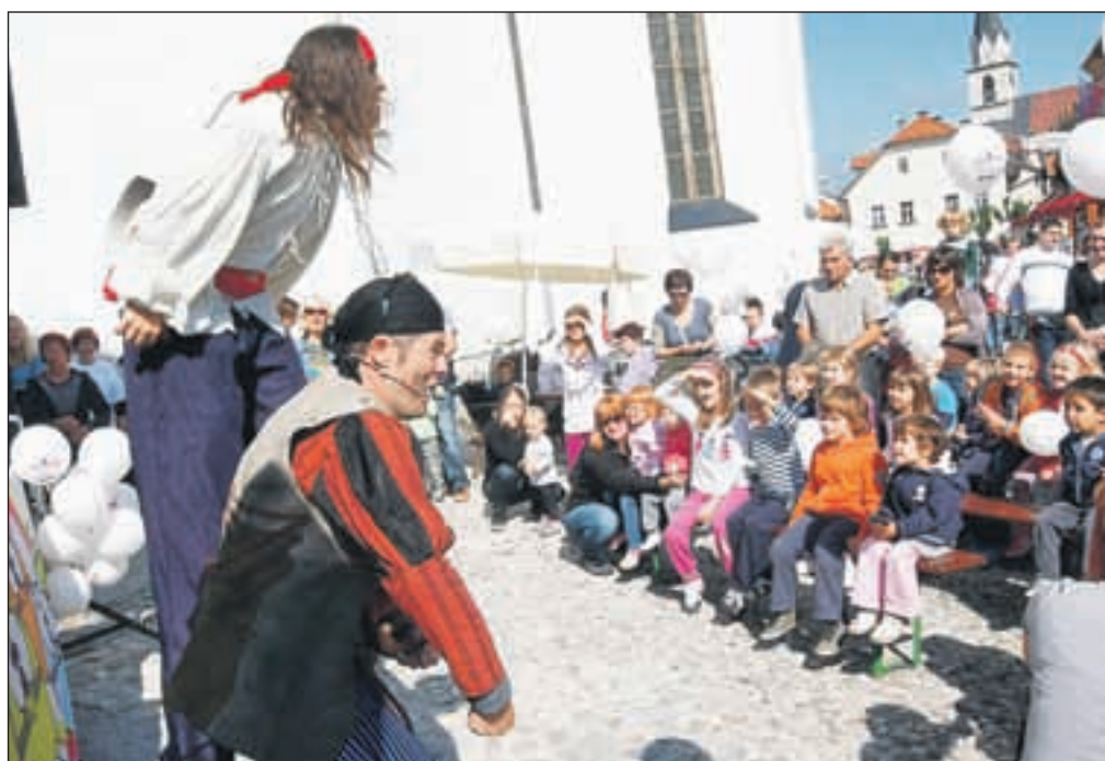
Živ žav je obiskalo vsaj 500 otrok, organizatorji iz Društva Pungert Kranj pa obljublajo, da bo drugo leto, ob desetem jubileju, ta še posebej igriv, nagajiv in zanimiv.