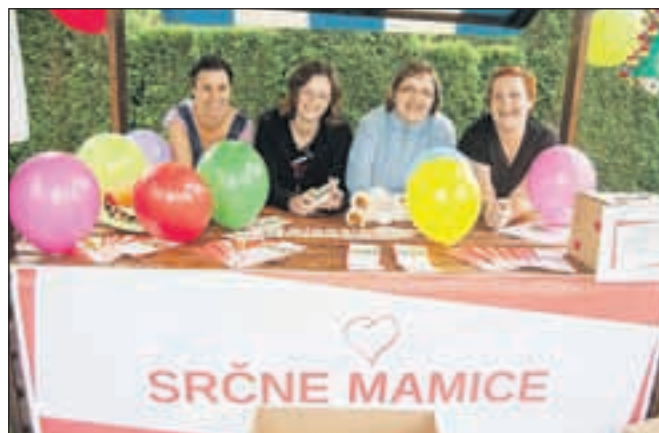
Srčne mamice na Čarobnem dnevu

Donacije za njihovo delovanje prispevajo različna podjetja po Sloveniji. Z njihovimi