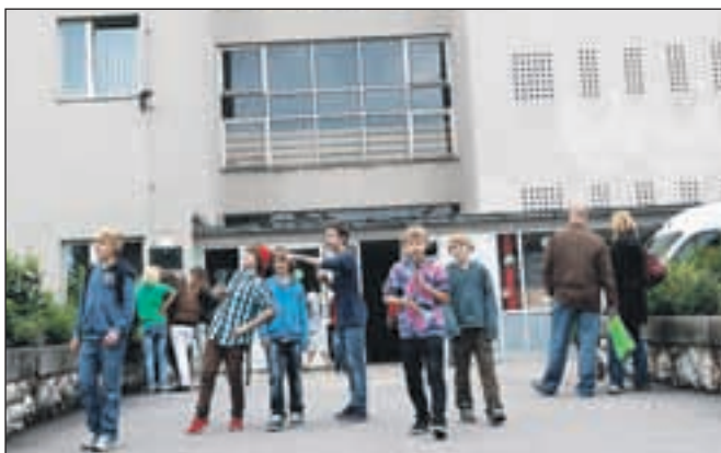
Na OŠ Staneta Žagarja so v prazničnem letu dobili nov logotip, s pomočjo obrtnikov in staršev pa so učenci in učitelji polepšali tako notranjost kot zunanost šole in uredili nove gredice z rožami.