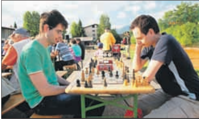
Organizirane so bile številne igre, nekateri so se pomerili tudi v šahu.

Evropski dan sosedov je bil priložnost, da so v Krajevni skupnosti Vodovodni stolp pripravili dan krajanov, druženje pa se je začelo s pohodom in končalo s prijetnim zabavnim, kulturnim in športnim programom.