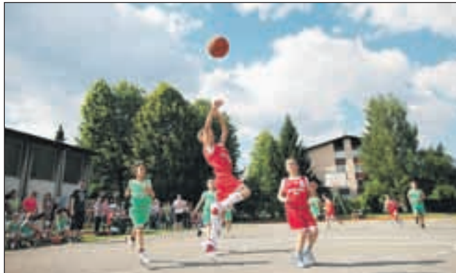
V košarki so tekmovali šolarji iz OŠ Simona Jenka in OŠ Franceta Prešerna.