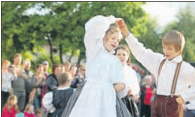
Obiskovalci so si lahko ogledali tudi kulturno-zabavni program.