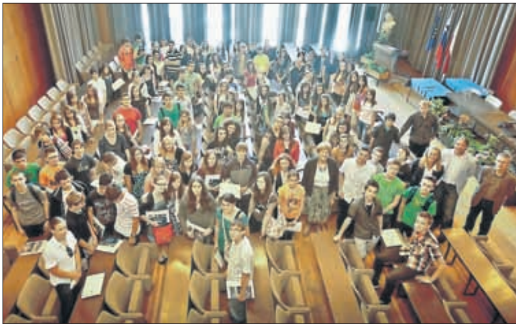
Kranjski odličnjaki, učenke in učenci, ki so vseh letih osnovnega šolanja dosegli povprečno oceno 4,5 ali več, so se zbrali v sejni dvorani MO Kranj.