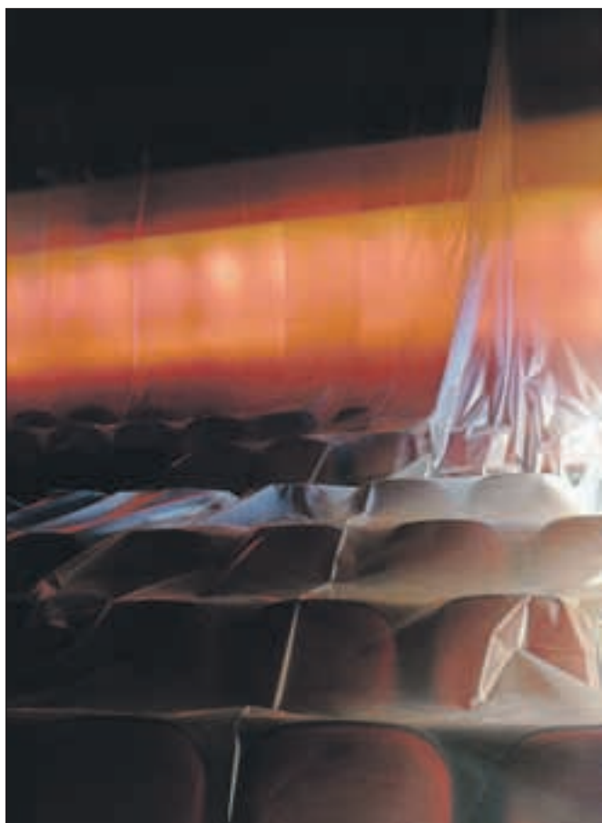
Nekoliko nevsakdanji pogled v dvorano Prešernovega gledališča ponujajo z zaščitno folijo prekrite sedeži, v delu je namreč prenova odrskih vlakov.