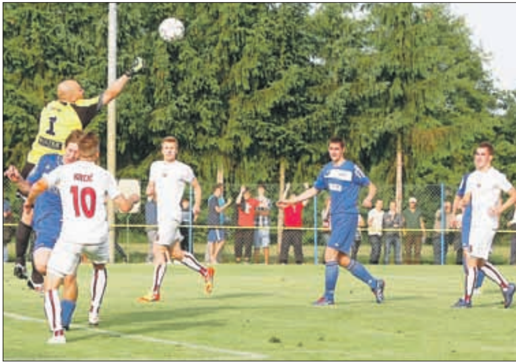
Kljub porazu na domači tekmi in drugi kvalifikacijski tekmi v Dobu, se je Triglavu uspelo odbržati med slovenskimi nogometnimi prvoligaši.

Kranjčani z odločitvijo o tem, da še naprej igrajo v slovenski elitni ligi, niso oklevali. »Na našo srečo se je vendarle izkazalo, da se je trud skozi celotni spomladanski del prvenstva poplačal, saj smo si z uvrstitvijo na deveto mesto in kvalifikacijskimi boji za obstanek v 1. SNL vendarle priigrali možnost za nadaljnje tekmovanje v elitni slovenski nogometni ligi. Strategija kluba ostaja nespremenjena. V novi sezoni želimo dokončno sanirati klub ter postaviti zdrave temelje za kontinuirano igranje v prvi ligi. Gorenjska in Kranj potrebujeta prvoligaša in želimo si, da nas širše okolje bolj podpre kot do sedaj. Verjamemo, da nam bo to uspelo, saj imamo dobro nogometno šolo in lahko tvorimo jedro ekipe iz domačih igralcev,« je povedal predsednik NK Triglav