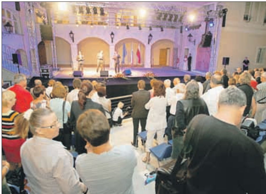
Letno gledališče že živi s prireditvami, ob slovesnem odprtju pa je obiskovalce z nastopom razveselil trio Eroika.

Sicer pa je vrednost del pri obnovi gradu Khislstein nekaj več kot 8,7 milijona evrov (od tega 2,8 nepovratnih evropskih sredstev), investicija v projekt, imenovan Trije stolpi, pa je nekaj več kot 2,1 milijona evrov, od tega je bila v višini nekaj