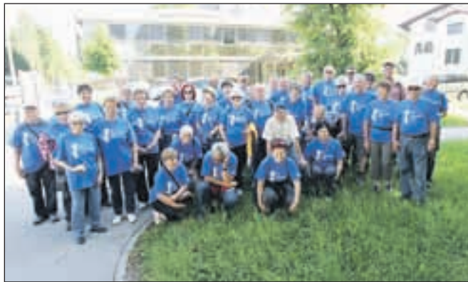
Udeleženci dopoldanskega pohoda po krajevni skupnosti Vodovodni stolp