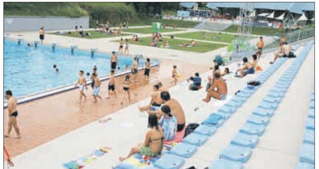
Kopalna sezona na kranjskem kopališču se je začela minuli konec tedna, v vročih poletnih dneh pa bo osvežitev v vodi še kako dobrodošla.

na bazenski keramiki okroglega otroškega bazena in v okolici obeh otroških bazenov, so popravili tudi to, prav tako pa so prenovili betonske stene na zahodnih terasah olimpijskega bazena. Prenova je znašala nekaj več kot 350 tisoč evrov, od tega je okoli sedemdeset odstotkov prispevala kranjska občina, ostalo pa Zavod za šport Kranj.