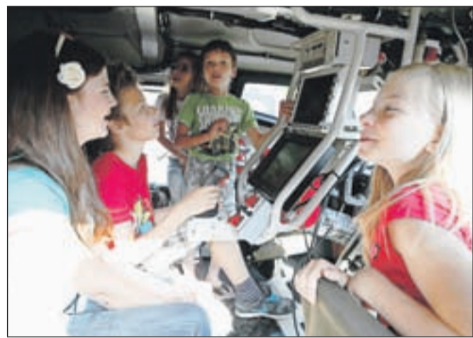
Nad sodobno vojaško tehnologijo so bili navdušeni zlasti otroci.