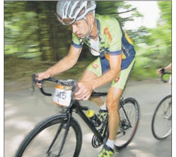
Vzpon na Jošt

Proga Maratona Franja BTC City poteka od starta v BTC Cityju levo na Šmartinsko cesto, zavije levo na Kajuhovo, nadaljuje po Zaloški, Litijški in Poljanski cesti čez Zmajski most mimo kavarne Evropa na Slovensko cesto. Prva kontrolna točka malega in velikega maratona je na Zmajskem mostu. S Slovenske ceste zavijemo na Aškerčevo in naprej po Tržaški cesti. Trasa se nadaljuje po Tržaški cesti do Brezovice, kjer je uradni start maratona (pri podjetju Prigo). Nato pot nadaljujemo do Vrhničke, naprej čez vrhniški klanec do Logatca in Kalc, kjer zavijemo desno proti Godoviču. Iz Godoviča se spustimo proti Idriji in Želinu. V Želinu zavijemo desno na cesto proti Cerknemu, kjer je na glavnem trgu okrepčevalnica. Sledi glavni vzpon na maratonu - vzpon na Kladje. Na Kladju je naslednja okrepčevalna postaja. Pot se nato spusti do Trebije. V Trebiji zavijemo levo proti Gorenji vasi. Pred občinsko stavbo v Gorenji vasi je naslednja okrepčevalna postaja. Nadaljujemo proti Škofji Loki. Na vrhu klanca v Škofji Loki je okrepčevalna