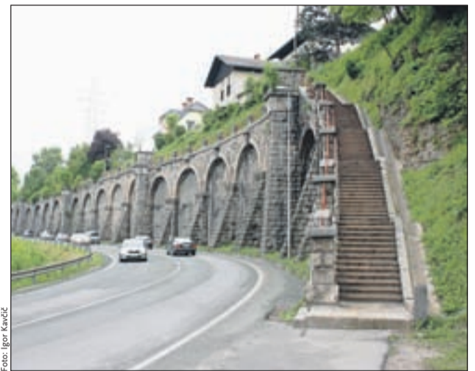
Gaštejski klanec s kamnitim opornim zidom še danes predstavlja prepoznaven arhitektonski element mesta Kranja.