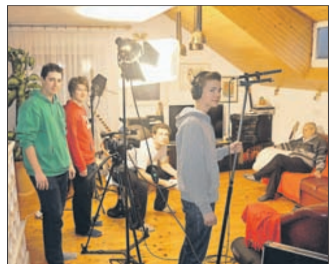
Dijaki med snemanjem intervjuja

http://www.memoriesatschool.eu/lang/sk http://www.kr.sik.si/aktualno/projekti/semas/