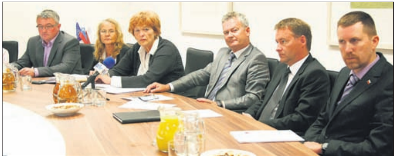
Člani občinske uprave so predlagane sklepe majske seje predstavili tudi na novinarski konferenci.

ter jo posreduje mestnemu svetu v potrditev. Svetniki so na majski seji sprejeli tudi spremenjen in dopolnjen odlok o občinskih taksah in odlok o prevozih z avtotaksijem. Izvedeli so marsikaj o delu Razvojnega centra informacijsko-komunikacijskih tehnologij na Laborah, govorili pa so tudi o obnovi kompleksa Khislstein oziroma poplačilu Vegrada, ki je v stečaju in s katerim so prekinili gradbeno pogodbo. Odločili so se, da bo občina začela sodni postopek za izplačilo 3,6 milijona bančne garancije, še prej pa bo pridobila mnenje resornega ministrstva.