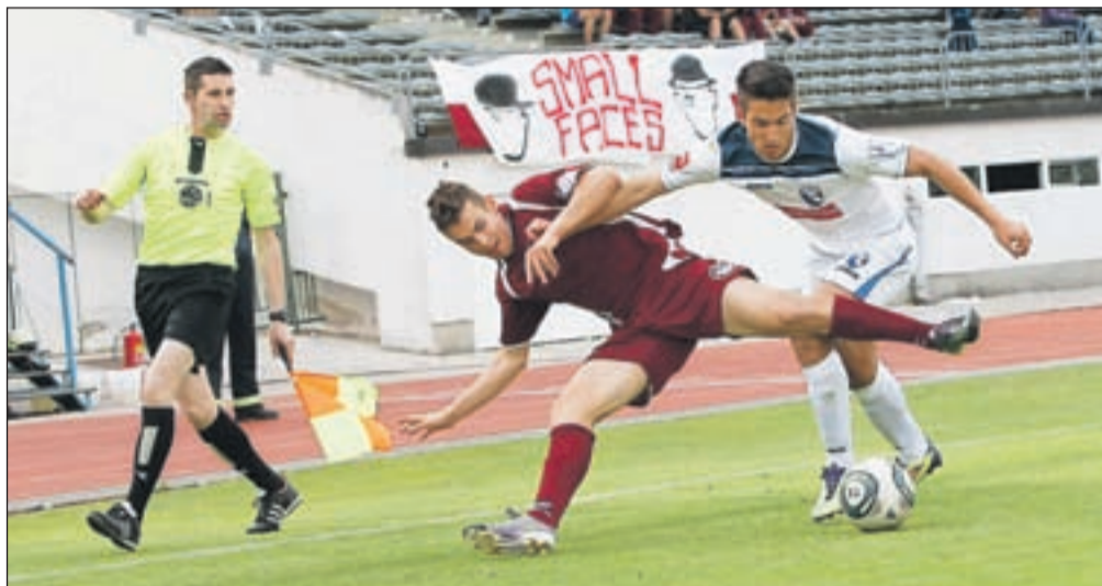
Nogometaši Triglava so v zadnji tekmi rednega dela prvoligaškega prvenstva nadigrali Hit Gorico, sedaj pa v dobri formi pričakujejo kvalifikacijski tekmi z Roltekom Dobom.

Kranj – Minuli konec tedna se je po 36 krogih končal redni del letošnjega državnega prvenstva v 1. nogometni ligi. Naslov državnih prvakov si je s kar dvajsetimi točkami prednosti pred prvim zasledovalcem priborila ekipa Maribora, drugo mesto je osvojila Olimpija, tretje pa Mura 05. Tudi ekipa Triglava, ki je pomladanski del sezone začela na dnu tekmovalne lestvice, je prvenstvo končala po željah igralcev, navijačev in vodstva kluba, saj so si že na predzadnji tekmi v Kopru zagotovili deveto mesto, ki so ga minulo nedeljo potrdili z zmago na domači zelenici, ko so v Kranju z 2 : 0 premagali moštvo Hit Gorice. Pot do zelenega devetega mesta pa ni bila tako lahka, kot na lestvici kaže končnih pet točk naskoka nad zadnjeuvrščeno ekipo Nafta. »Ko smo si pred začetkom spomladanskega dela prvenstva za cilj zastavili, da nadoknadimo razliko in se z zadnjega mesta prebijemo na deveto, so se nam mnogi samo nasmihi. Res se je zdel naš načrt neverjeten, vendar pa smo v vodstvu kluba verjeli v strokovni štab in igralce. Mi-