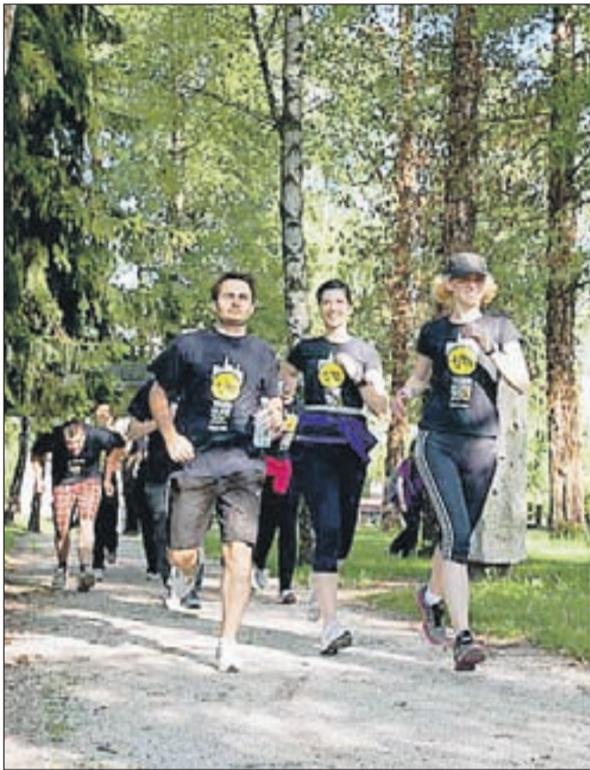
Tekaška sekcija

Klub študentov Kranj vabi vse, ki bi radi nabirali kondicijo in se zraven še dobro zabavali, da se pridružite njihovi tekaški sekciji. Treninge vodi simpatična inštruktorica Maja, ki poleg teka poskrbi še za vaje za moč in raztezne vaje. Pridruži se jim lahko vsakdo, ne glede na kondicijsko pripravljenost. Skupaj bodo trenirali in se pripravljali na cilj sezone, ki bo Ljubljanski maraton. Treningi potekajo vsak četrtek ob 17. uri na Brdu pri Kranju (stran Kokrica, pri vходу na igrišče za golf). Več informacij na tek@ksk.si ali na 041/533 135 (Maja). P. J.