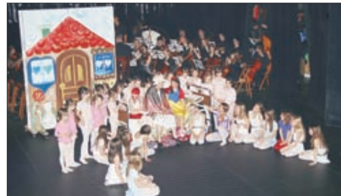
Babica in lonec pravljic, prava paša za oči in ušesa

Zaključek šolskega leta bodo v Glasbeni šoli Kranj proslavili s slavnostnim koncertom 21. junija ob 19. uri v Dvorani Grandis na Brdu. Na slovesnosti bodo podelili tudi priznanja učencem tekmovalcem in učencem, ki zaključujejo šolanje. Za zadnja dva koncerta bodo vstopnice na voljo v tajništvu Glasbene šole Kranj.