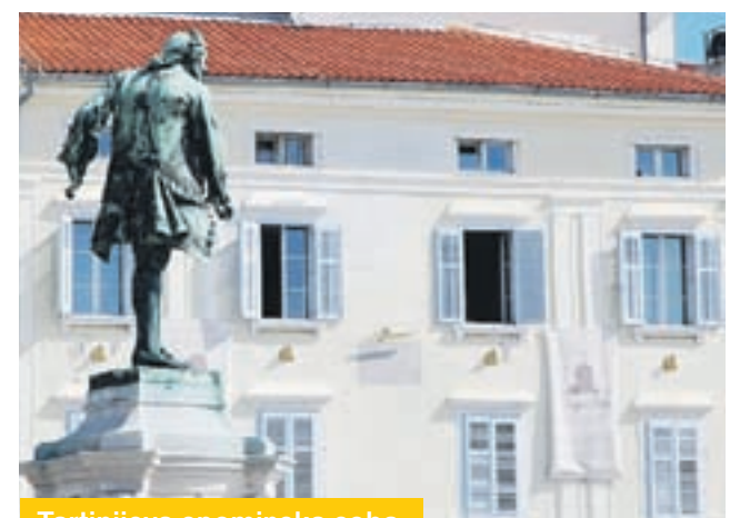
Tartinijeva spominska soba