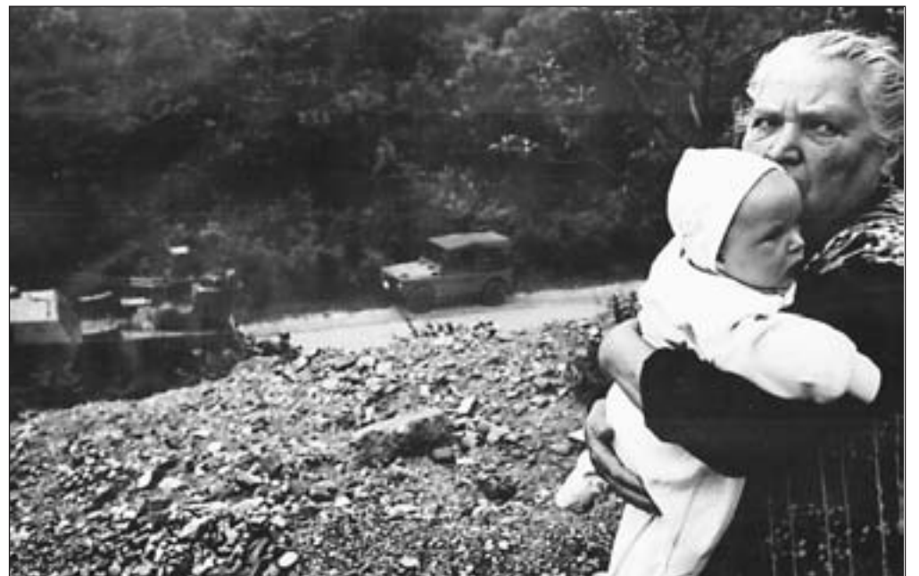
Vojni dogodki so zajeli vse generacije.