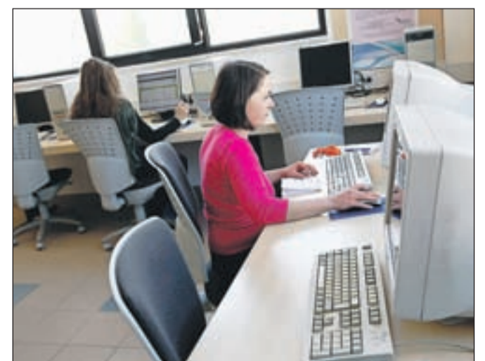
Novi prostori Zavoda za zaposlovanje v Kranju so bolje opremljeni, na enem mestu pa stranke dobijo vse, kar jim mora takšna ustanova ponuditi.