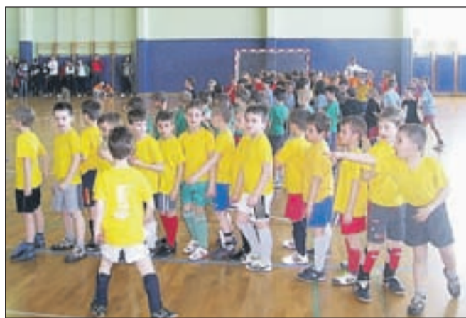
Rožletki so zaključili dvoransko sezono.

Kranj, po eno pa Sava in Britof. Otroci svoje znanje lahko preskušajo tudi na tekmovanjih, ki so potekala od oktobra do aprila, ko se je zaključil dvoranski del nogometne šole. Z majem se Rožletki selijo na zunanja igrišča, sezono pa bodo zaključili konec šolskega leta. Zaključek dvoranske sezone pa so že imeli. "Na šolah, ki jih pokriva naš klub, je v program Rožle vključenih 240 otrok, na zaključku dvoranske sezone pa jih je sodelovalo več kot 160. Potekal je v dveh delih, najprej za učence prvih, nato pa še za učence drugih razredov. Otroci so za nagrado dobili diplome,