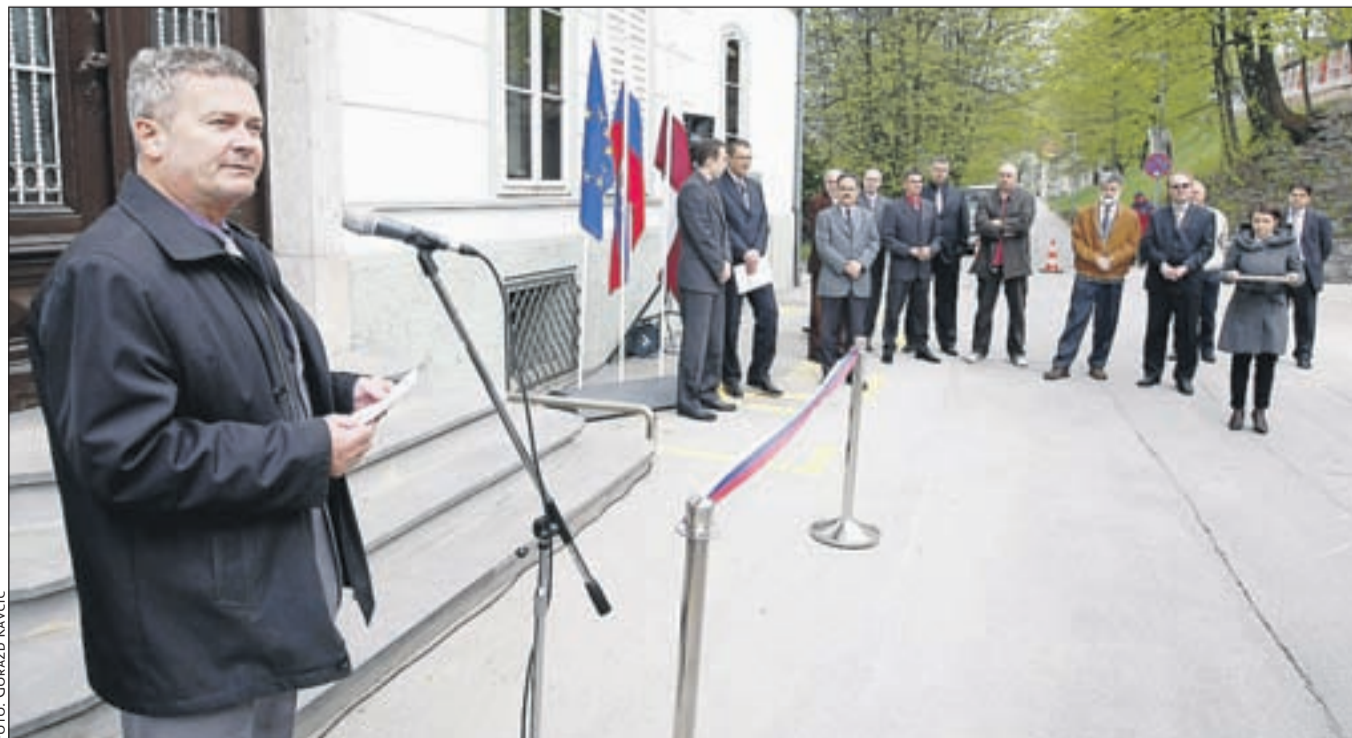
Kranjski župan Mohor Bogataj je ob odprtju prostorov Lokalne energetske agencije Gorenjske, ki so sedaj v stavbi Gorenjskih elektrarn na Stari cesti 5 v Kranju, poudaril veliko vlogo svetovanja pri uporabi obnovljivih virov energije.