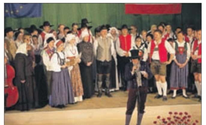
Čudovit folklorni večer domače AFS Ozara so s svojim nastopom začinili tudi folkloristi iz Tirolske.

Folkloristi Ozare v začetku aprila niso vandrali na Tirolsko, kot pravi stara slovenska ljudska pesem, ampak je k njim v goste privandrala folklorna skupina Trachtenverein "Die Amraser" iz mesta Amras pri Innsbrucku. Kranjčani so se z njimi seznanili in odlično razumeli na lanski turneji na Cipru in že takrat razmišljali o skupnem projektu, da se Avstrijci predstavijo na letnem koncertu Ozare. Primskovljani imajo po dolgih letih spet tri skupine, tako je kot prva v večeru nastopila začetna skupina, ki je po komaj štirih mesecih odlično prikazala gorenjske plesne. Vodilna skupina je nastopila s kostelškimi in gorenjskimi plesi, mladinska skupina pa je pripravila splet dolenskih plesov. Seveda so z ubranim petjem številno publiko navduševali tudi Kranjski furmani in Bodeče neže. S točkami, ki so jih