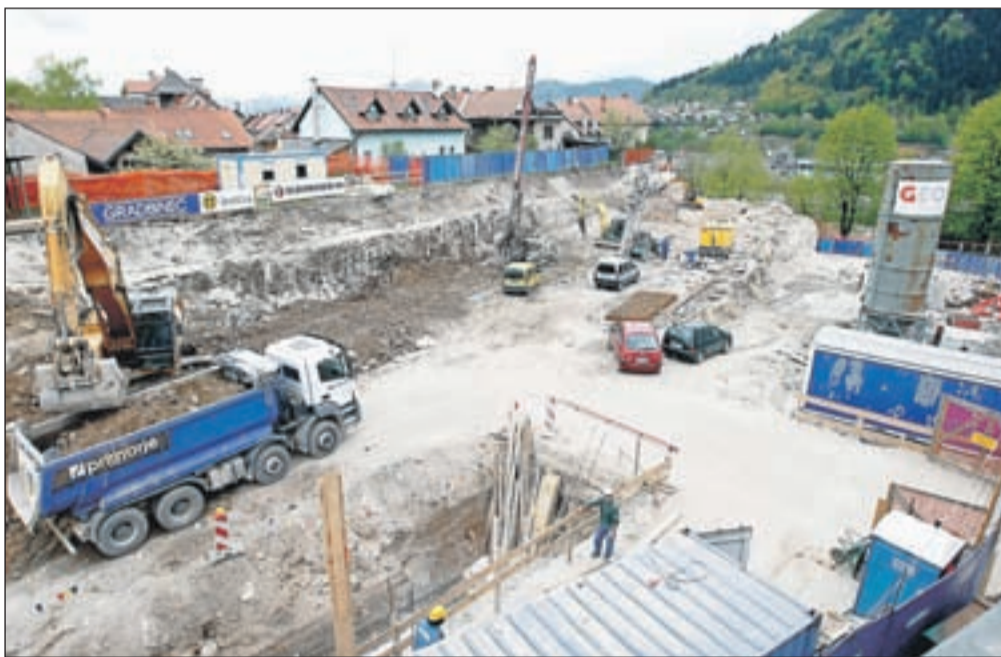
Na gradbišču bodočega dvorca Jelen je vse dni živahno.

"Cestna zapora je bila usklajena s Cestnim podjetjem, s katerim smo v istem obdobju izvedli tudi dve fazi del.