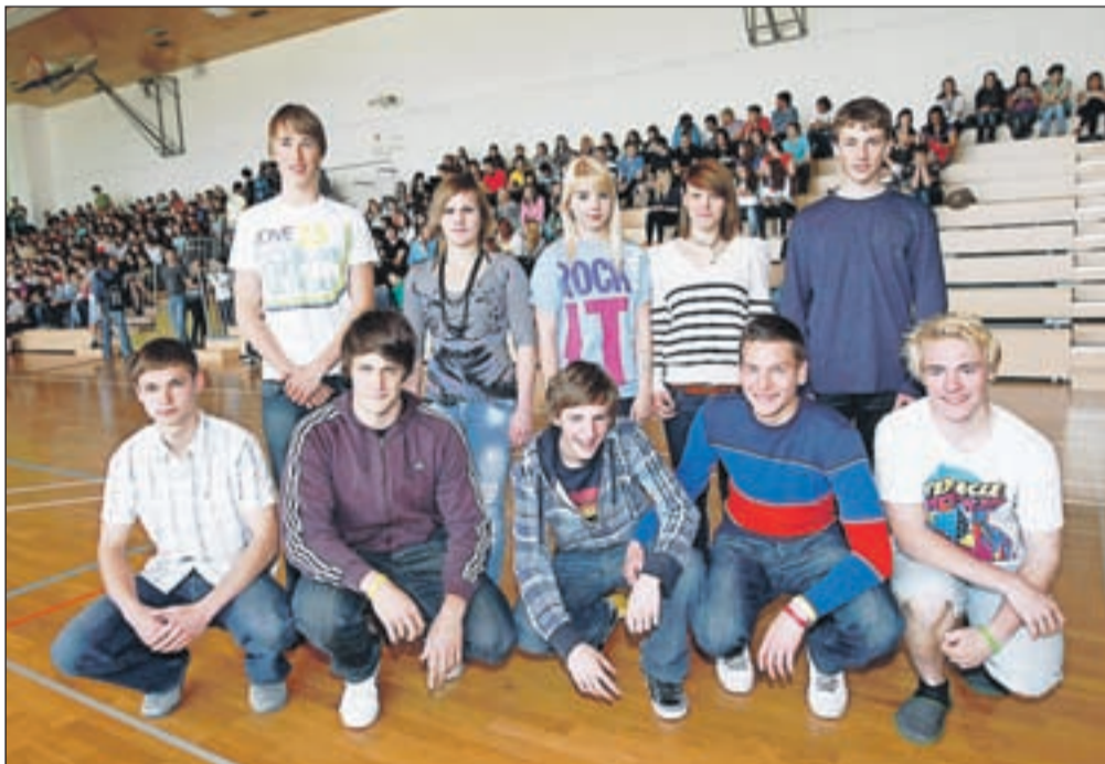
Kranjska ekonomska gimnazija je ena izmed šol, ki jo obiskuje največ vrhunskih športnikov, na posebni prireditvi pa so priznanja dobili najboljši med njimi.