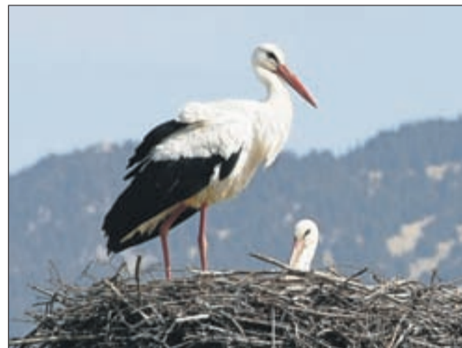
Par štorkelj je očitno zadovoljen s svojim novim domovanjem in gnezdi tudi v predstavljenem gnezdu.

Potem ko so v začetku februarja z dimnika stanovanje hiše v Tenetišah gnezdo bele štorklje prestavili na gnezdilni drog, kar je bila prva takšna premestitev gnezda na Gorenjskem, so tako domačini kot strokovnjaki iz Zavoda RS za varstvo narave - Območne enote Kranj ugibali, ali se bosta štorklji vrnili v svoje gnezdo. Očitno pa se štorklje pri nas dobro počutijo in imajo dokaj dobre razmere, zato para štorkelj ni zmotilo nekaj metrov razlike med hišo Kavčičevih in gnezdilnim drogom. V. S.