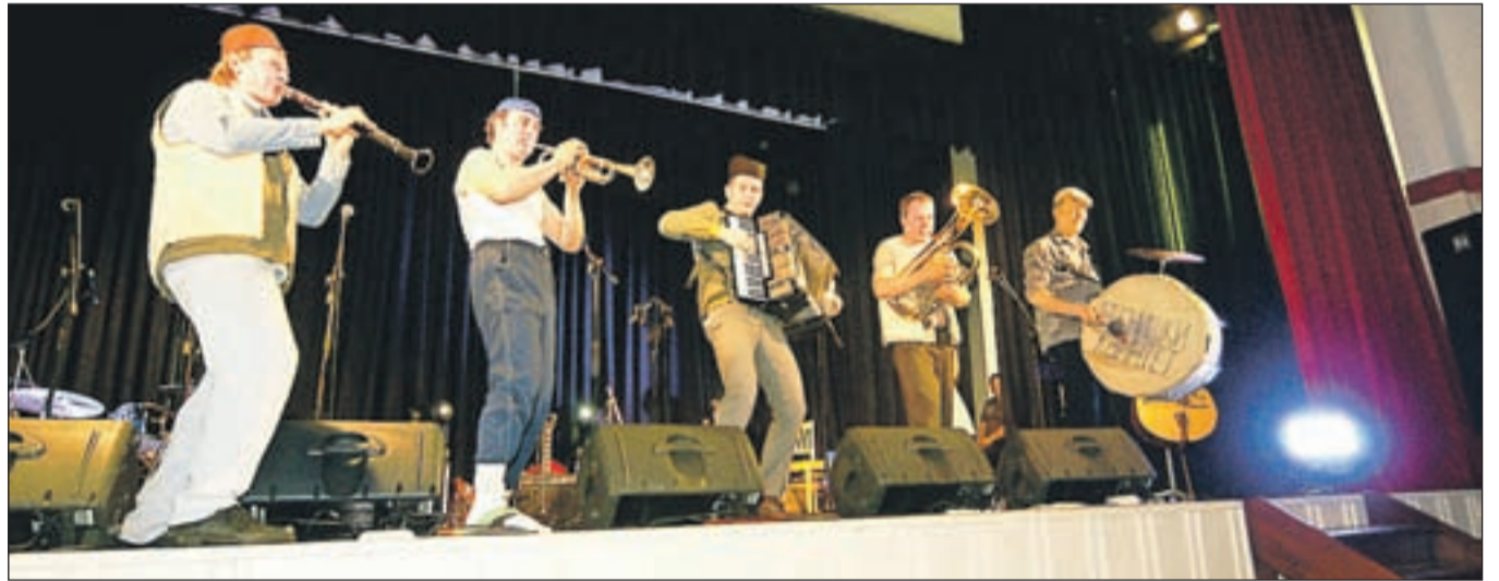
Besniški kvintet s svojimi nastopi razveseljuje že deset let. Fantje znajo poskrbeti za dober šov.