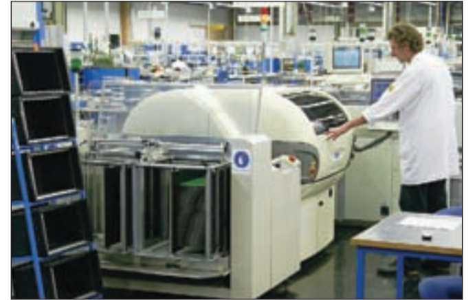
Razvojni center IKT, ki bo deloval v Iskratel, bo nudil 30 novih visoko zahtevnih delovnih mest, ustvaril vsaj 20 novih podjetij, ki bodo ustvarjala vsaj za tretjino višjo dodano vrednost od primerljivih podjetij v panogi.

"Od delovanja Razvojnega centra IKT pričakujemo ustvarjanje dodane vrednosti,