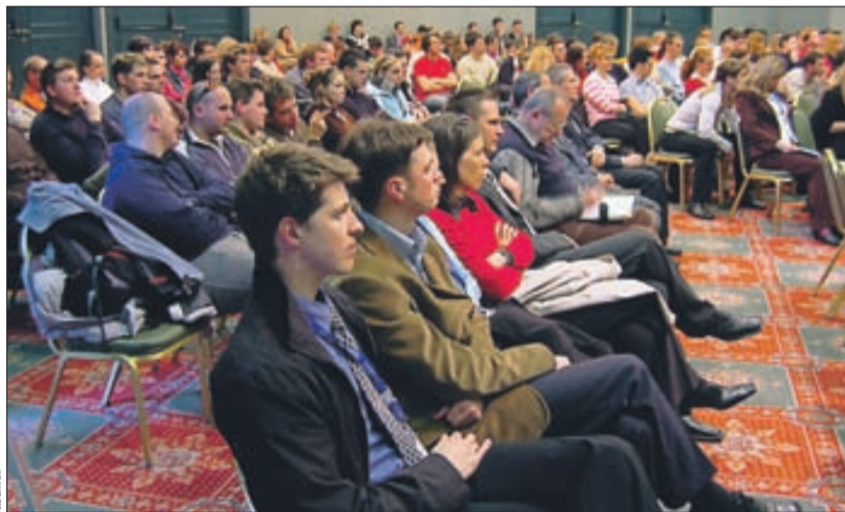
30. jubilejna mednarodna konferenca bo tudi letos na enem mestu združila mnoge ugledne domače in tuje strokovnjake.