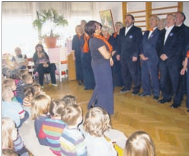
Mešani pevski zbor Iskra Kranj je malčkom v vrtcu Janina približal Prešernove pesmi in zborovsko petje.