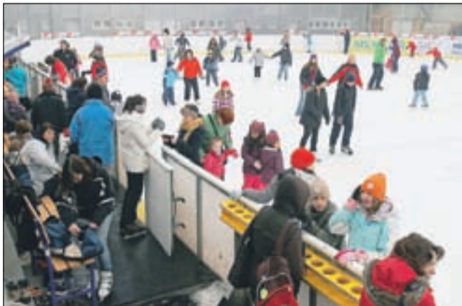
V dvorani Zlato polje, kjer poteka brezplačno počitniško drsanje, je vse dni veliko obiskovalcev.

Kranj - Na letos enotnih počitnicah v vsej Sloveniji te dni uživajo tudi kranjski malčki, ki imajo veliko možnosti, da jih preživijo z različnimi športnimi dejavnostmi. Z različnimi tečaji je poskrbljeno, da se učijo smučanja, mnogi radi obiskujejo bazen, veliko zanimanje pa je tudi letos za obisk drsališča. Pri Mestni občini Kranj so namreč poskrbeli za brezplačno drsanje v ledni dvorani Zlato polje. To poteka že ves teden vsak dan dopoldne med 10. in 12. uro, v sredo in danes pa je brezplačno drsanje tudi popoldne med 17. in