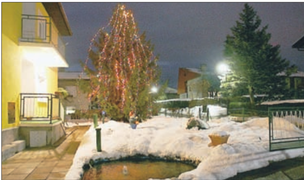
Na Žanovi ulici je pred prazniki smreka s kar dva tisoč štiristo lučkami.