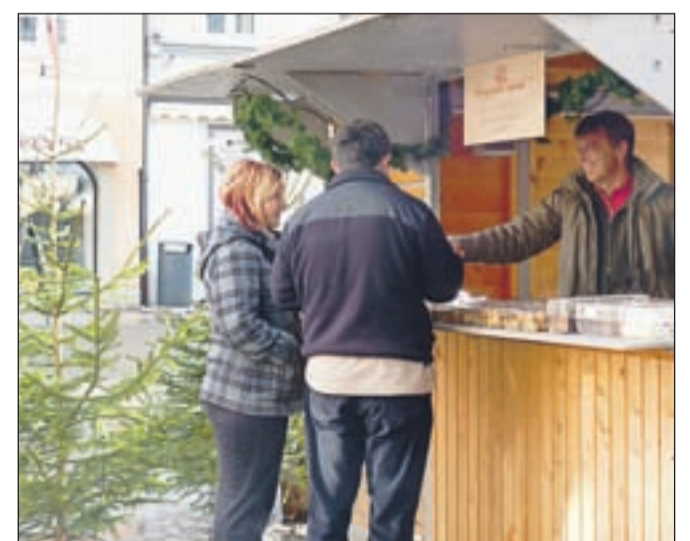
V začetku tedna se je v središču Kranja začel tradicionalni božično-novoletni sejem s praznično ponudbo.