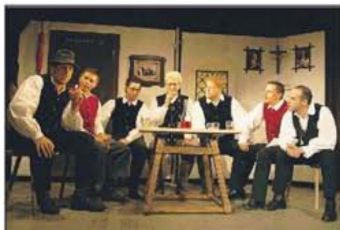
Odlična pevska ekipa Kovačevga študenta je navdušila že v uvodu, ko je ata Urban pripovedoval štorije iz starih časov, fantje pa so zapeli dve tri ljudske ...