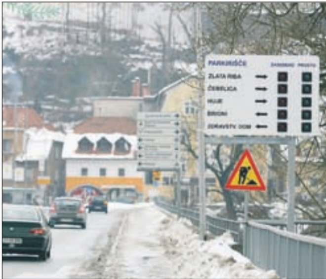
Na začetku savskega mostu je že nameščena informativna tabla z oznakami parkirišč.

Pri Mestni občini Kranj so se odločili, da bodo pred vstopi na parkirišča namestili svetlobne obvestilne table. Table bodo nameščene neposredno pred vstopi na parkirišča (Zdravstveni dom Kranj, Brioni, Čebelica, Huje ob Likozarjevi cesti), ko se bodo uskladili s KS Center, pa še na parkirišču Sejmišče oziroma Zlata riba. Na začetku savskega mostu (Ljubljanska cesta) je že nameščena velika tabla, s katere bodo vozniki razbrali informacije za vseh pet parkirišč naenkrat. Osnova tabel je prometni znak za parkirni prostor, v katerem sta dodatno vgrajena svetlobna znaka - rdeča in zelena luč o prostem oziroma zasedenem parkirišču z napisom prosto - zasedeno ter napisom, pred katerim parkiriščem je trenutno voznik. Sistem bo deloval preko sporočil v sistemu mobilne telefonije. V odstotkih bo odšteval zasedenost parkirišč, parkirišča bodo medsebojno povezana, vse informacije skupaj pa se bodo zbirale in distribuirale prek nadzornega centra. Strošek vzpostavitve sistema je 25.960 evrov (DDV ni vključen), delovati pa bo predvidoma začel najkasneje do konca letošnjega leta. V. S.