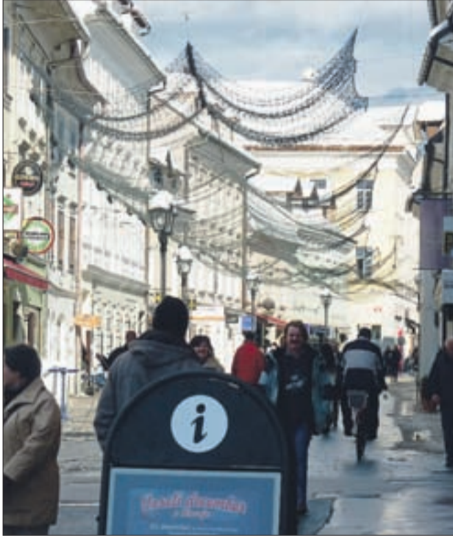
Središče mesta je okrašeno že od začetka decembra, te dni pa je v njem živahno tako podnevi kot zvečer.