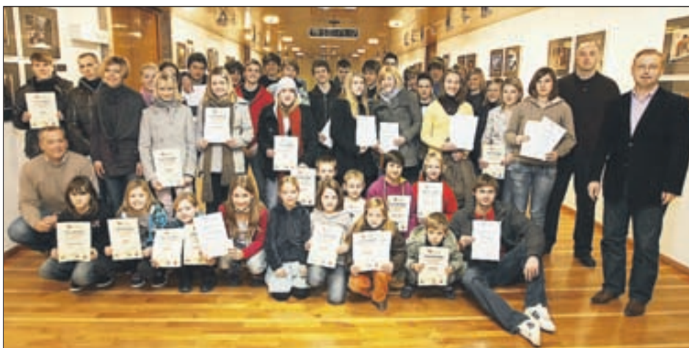
Mladih v AK Triglav ne manjka, najboljšim med njimi pa so na skupščini minuli petek podelili zaslužena priznanja.

edini bazični in vrhunski šport v Kranju brez ustrezne zimske vadbene infrastrukture, vendar nas veseli, da so na Mestni občini Kranj že izdelali projektno dokumentacijo za izgradnjo nove tribune s športno dvorano pod njo," pravijo v klubu.