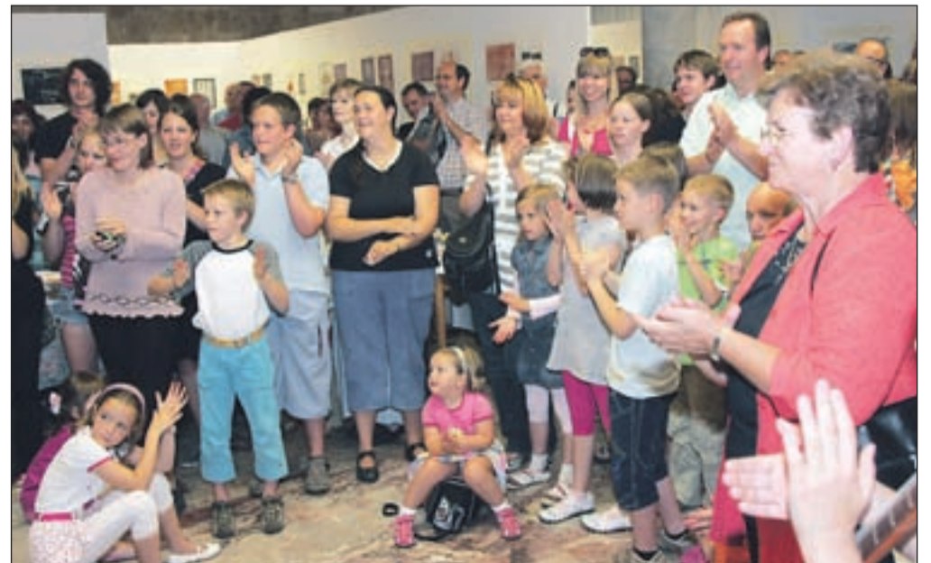
Likovna šola se je končala z odprtjem velike razstave v avli MO Kranj.