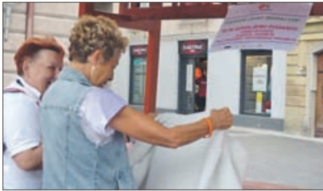
V soboto je v Kranju prvič potekal dvoriščni sejem, kljub slabšemu vremenu pa so bili obiskovalci navdušeni.

pripravil v središču Kranja. "Ideja se je prijela in začel sem razmišljati, da bi nekaj podobnega lahko pripravili v središču Kranja. Na Zavodu za turizem so bili pripravljeni sodelovati in sejem smo preselili v središče mesta. Čeprav nam je ponagajalo vreme, je izkušnja dobra, saj so predmeti hitro menjali lastnike. Nekateri so stvari prinašali, drugi odnašali. Mnogi so komaj verjeli, da je res vse zastoj, da lahko vsakdo vzame, kar pač potrebuje. Ker vemo, da bo treba tak sejem pripraviti kar nekajkrat, da se bo res prijel, pa že sedaj Kranjčane in okoličane vabim, da znova pridete na Glavni trg v soboto, 28. avgusta, med 9. in 12. uro, ko bomo sejem ponovi-