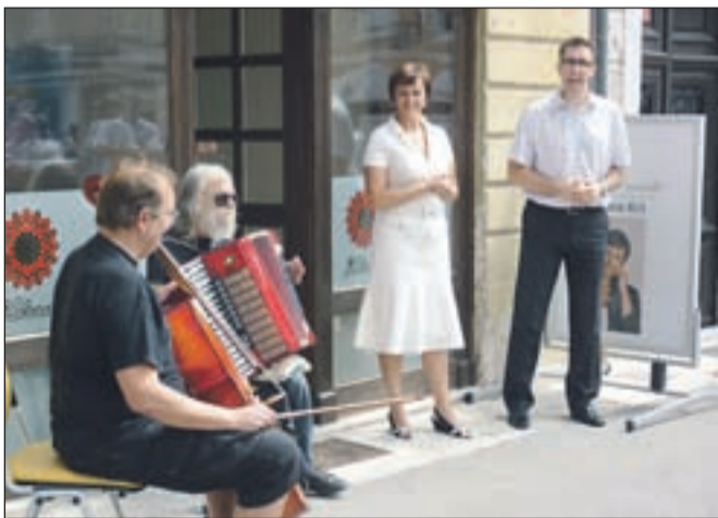
Društvo Zdravo mesto ima od prejšnjega ponedeljka naprej pisarno na Glavnem trgu v Kranju.

"Že prve pobude na naši spletni strani www.herminakrt.si/pobudnik kažejo, da številni občani in občanke razmišljajo o razvo-