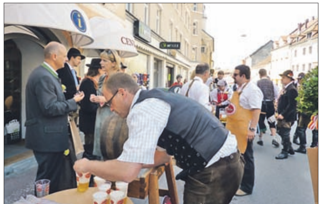
Gostje iz Beljaka, ki so že v Kranju s pivom pogostili domačine in obiskovalce, so obljubili, da hmeljnega napitka tudi na druženju v Beljaku ne bo zmanjkalo.