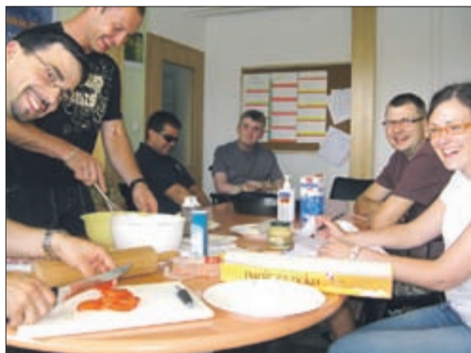
V kranjskem Zavodu Korak že od leta 2004 potekajo zanimivi študijski krožki, ki jih pripravljajo v povezavi z Andragoškim centrom Slovenije.