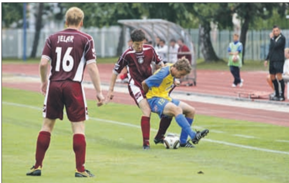
Nogometaši Triglava Gorenjske so si s srčno in do konca borbeno igro na tekmi proti CM Celju prislužili prvo točko med prvoligaši.

"Po prvi tekmi z Mariborom se je bilo težko vrniti in znova začeti delati. Tako je bilo tudi današnjih prvih deset minut tekme katastrofalnih, z napako pa smo gostom dovolili, da so dosegli gol. Vendar pa sem ve-