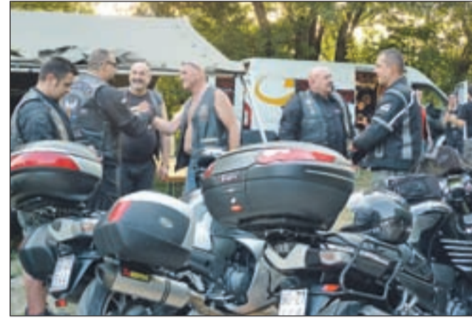
Na srečanje v Kranj so poleg domačih prišli tudi tujci, večja skupina se je prek Madžarske pripeljala tudi iz Beograda.