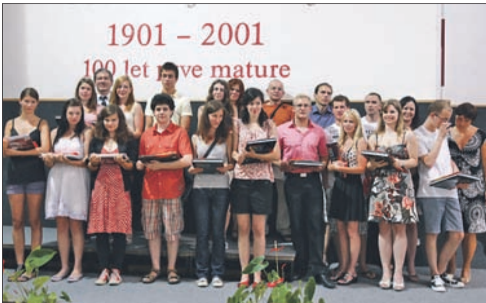
Zlati maturantje kranjske gimnazije

Na njihovi šoli je sicer maturo opravljalo 329 kandidatov. Med letošnjimi četrtošolci jih od 239 dijakov osem ni uspešno končalo 4. letnika, kar po mnenju ravnatelja priča o velikem zupanju njihovih profesorjev, ki so ga dijaki tudi upravičili. Pri maturi je bilo uspešnih 215 dijakov, pri čemer bosta le dve kandidatki morali jeseni maturo še enkrat opravljati v celoti. Maturitetni tečaj je opravljalo 42 kandidatov, v celoti pa so jo uspešno opravili štirje kandidati, kar je za njihovo šolo, je pojasnil ravnatelj, podpovprečen rezultat. Pohvalijo pa se lahko še s 17 zlatimi maturanti, kar predstavlja 7,4 odstotka popula-