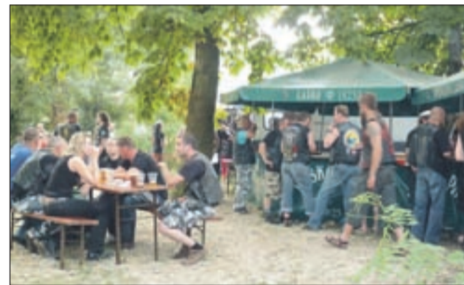
Prijetna senca ob starem zimskem bazenu je motoristom v hudi vročini ponujala prijeten hlad.

Kranju. Tudi letos se je prireditev začela v petek popoldne in trajala do nedelje popoldne. Čeprav so obiskovalce odganjale huda vročina in plohe, so bili organizatorji z obiskom zadovoljni.