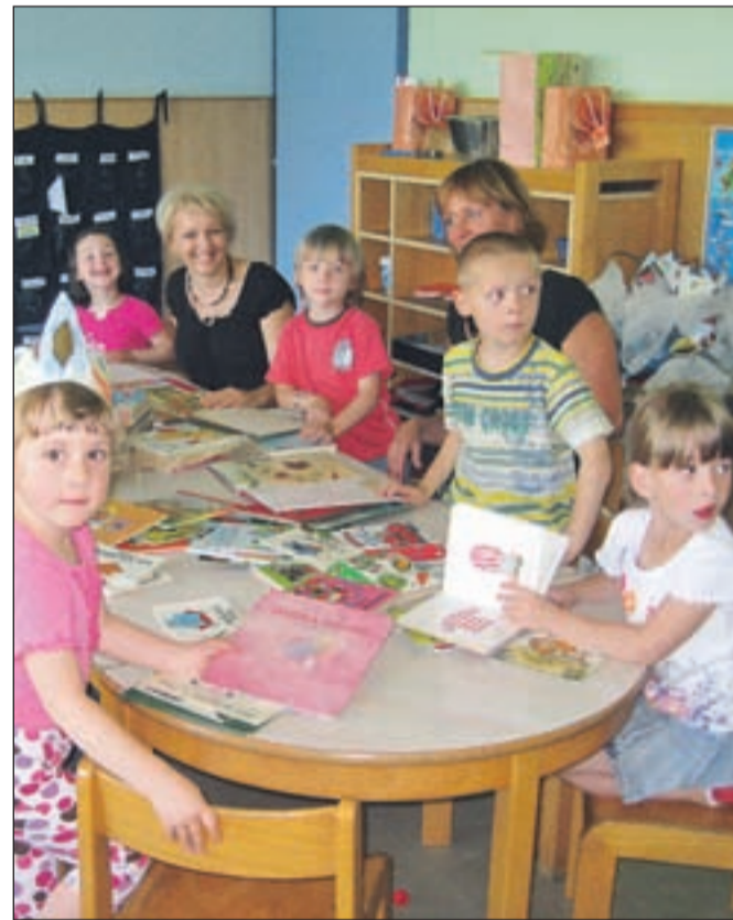
Mali Škratki so si z zanimanjem ogledovali, kakšne knjigice so dobili.