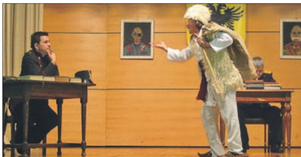
Gledališka predstava Jazbec pred sodiščem v Kulturnem domu v Stražišču