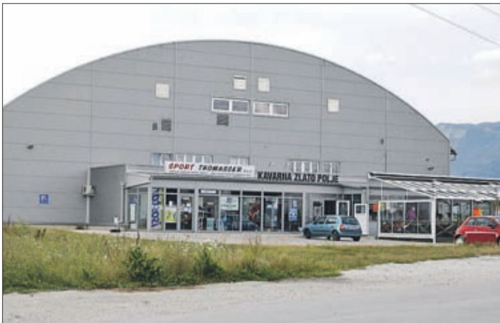
Dvorana na Zlatem polju je zgrajena z javno zasebnim partnerstvom, saj je občina prispevala zemljišče in zakupila ure, investitor pa je Expo biro iz Maribora.