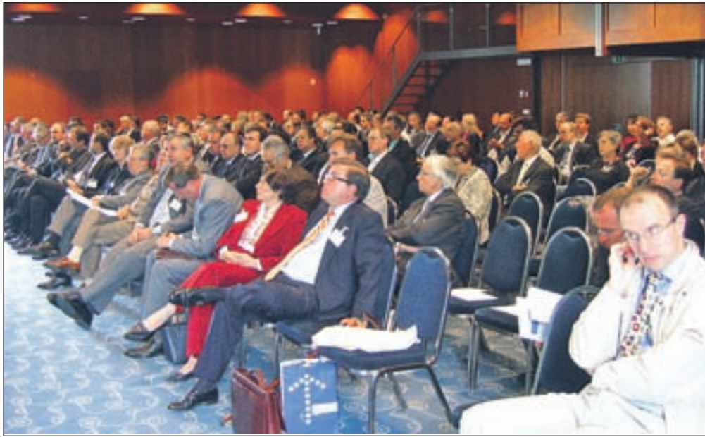
Bled bo tudi tokrat središče mnogih uglednih domačih in tujih strokovnjakov.

Tudi letošnji program konference je razdeljen na poslovni in raziskovalni del, ki se med seboj prepletata. Več informa-