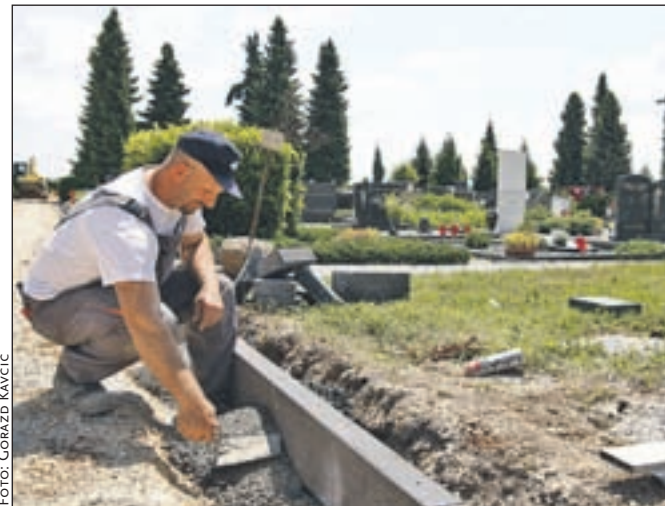
Letos je več denarja namenjenega tudi urejanju pokopališč, dela pa so se že začela na kranjskem pokopališču.