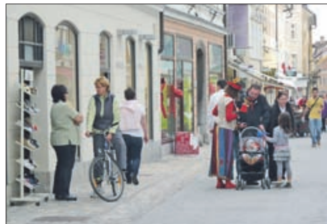
Veliko trgovcev v starem mestnem jedru se je že odločilo, da delovni čas ob četrtkih in petkih podaljša do 21. ure.