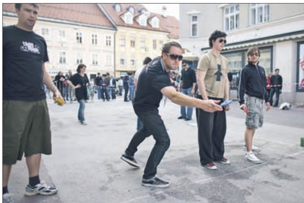
Maja lahko marsikaj počnemo tudi na ulicah, med športi, ki združujejo zabavo in miganje, pa je zadnja leta vse bolj popularno balinčkanje oziroma prstomet. To je bilo med Tednom mladih opaziti tudi na kranjskih ulicah.