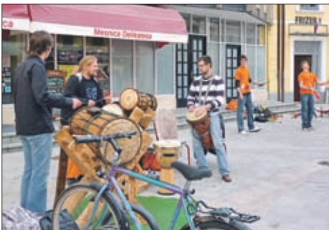
Kranjske ulice so oživili različni umetniki, minuli četrtek so nastopili tudi bobnarji The Perkakšns in žonglerji.