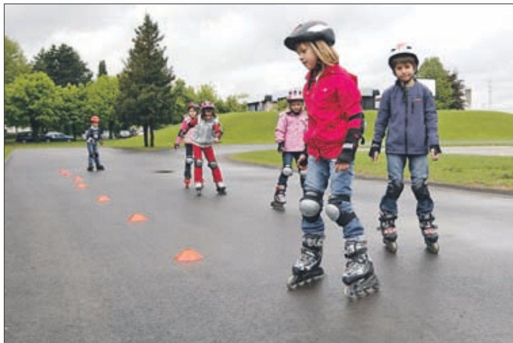
Letošnje pomladi so se razveselili tudi mladi in malce manj mladi Kranjčani, ki se navdušujejo za rolanje. Za Osnovno šolo Franceta Prešerna so namreč naredili prvo rolersko stezo v Sloveniji, ki je dolga 200 metrov.