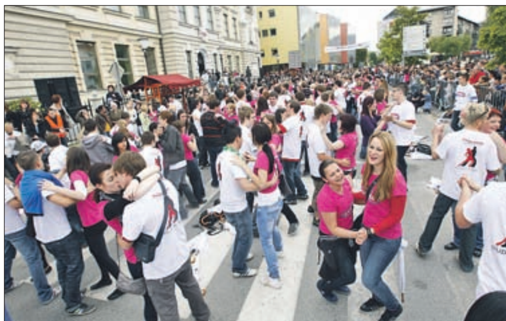
Tudi letos so maturanti plesali ulično četvorko, v Kranju se je po taktih Straussove glasbe prejšnji petek točno opoldne zavrtelo 764 parov. Kljub malce kislemu vremenu dobre volje, pred napornim učenjem za maturo, ni manjkalo.