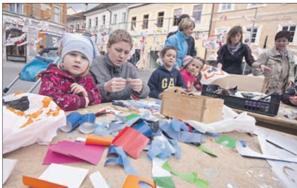
Otroci komaj čakajo, da se v mestu kaj dogaja, skupaj s starši pa so izkoristili tudi zanimivo ponudbo ob letošnjem Tednu mladih in se udeleževali različnih delavnic, s katerih so domov odnesli prave umetnine.