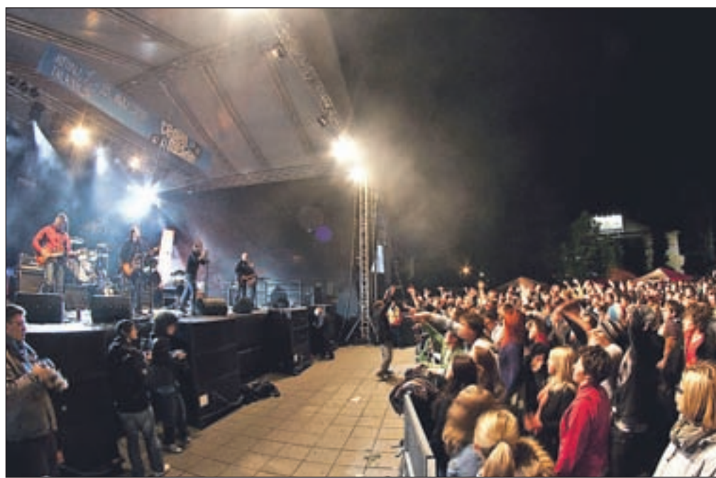
Na Tednu mladih je tradicionalno dobro poskrbljeno za obilico dobre glasbe. Letos se je začelo s koncertom skupin Crvena jabuka in Nude v Planetu Tuš in končalo s koncertom Dan D in M2 na Slovenskem trgu.

Mesec maj je po vremenu sicer bolj podoben aprilu, saj predvsem čakamo sonce, ki nam svoje žarke bolj skopo odmerja. Kislo majsko vreme pa ni zmotilo mladih po letih in srcu, ki so tudi letos v Kranju imeli svoj Teden mladih, ki so plesali po ulicah in kavarnah, ki so se zabavali in živeli s športom.