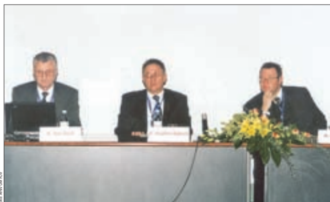
Člani programskega odbora

Fakulteta za organizacijske vede iz Beograda velja za eno najuglednejših izobraževalnih ustanov na področju držav bivše Jugoslavije, ki je v lanskem letu obeležila visok jubilej - 40. obletnico svojega delovanja. V tem času je uspela vzpostaviti široko mrežo poslovnih partnerjev, v katero so vključene tako izobraževalne ustanove, kakor tudi mnoga uspešna podjetja. Rezultat takšnega sodelovanja se kaže predvsem v več kot 4.000 vpisanih študentov in več kot sto zlatih maturantov v vpisni generaciji.