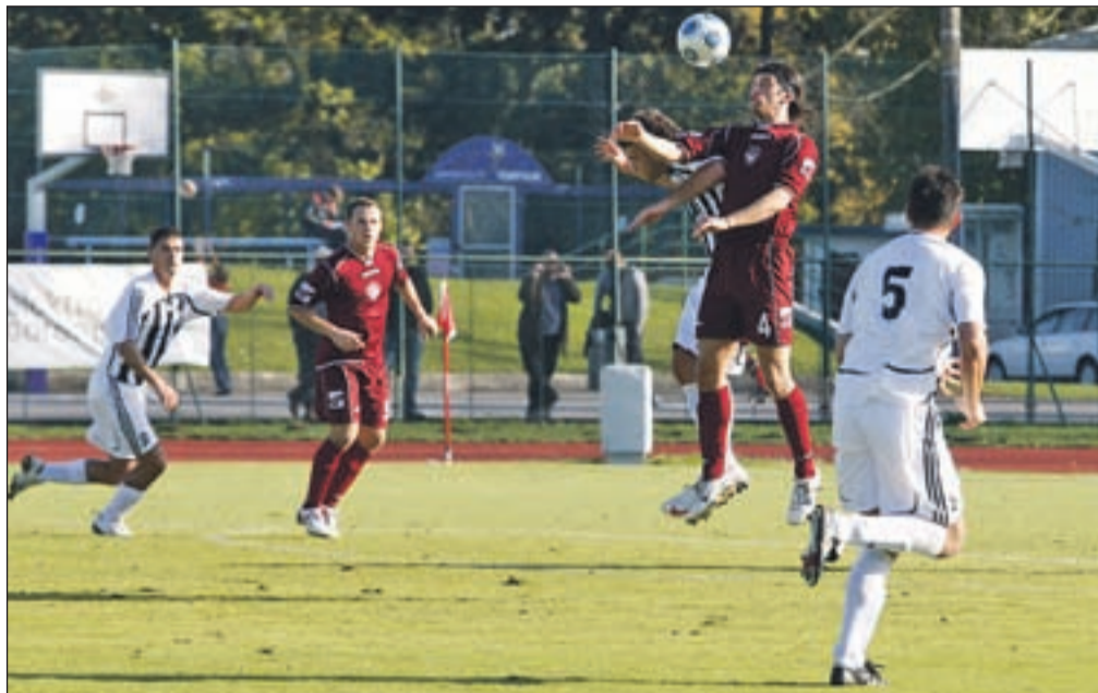
Nogometaši Triglava Gorenjske so bili jeseni neporaženi zaporedoma 12 tekem, zdaj pa jih čaka pomladni del sezone, ki se bo začel naslednjo nedeljo, 7. marca, ko Kranjčani gostujejo pri Aluminiju.