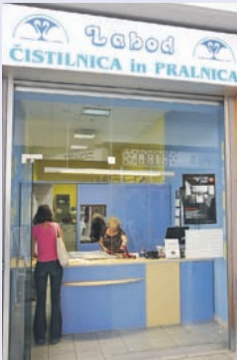
Labod, čistilnica in pralnica, poslovna enota v Mercatorjevem centru v Kranju

akcijami in popusti (v mesecu februarju 15-odstotni popust na čiščenje plaščev), stranke pa lahko pridobijo tudi Labodovo kartico, s katero so deležni še dodatnih ugodnosti. Ker se zavedajo, da vedno zmanjkuje časa za prijetne trenutke, ponujajo servis srajc, kjer srajce operejo in zlikajo po zelo ugodni ceni. V Labodu, čistilnici in pralnici, uporabljajo tudi profesionalna dodatna sredstva, kamor sodijo posebni ojačevalci za temeljitejšo nego in razne zaščite (UV zaščita, vodoodbojna zaščita, zaščita proti moljem, statičnosti). Svetujejo, da oblačila, za katere Gorenjci niso prepričani, kako bi jih negovali, prinesejo v njihovo čistilnico, kjer bodo zanje strokovno poskrbeli. Zelo pomembna je tudi pravočasna storitev, zato so lahko v posebnih primerih nared že naslednji dan, običajno pa delo opravijo v dveh do treh delovnih dneh.