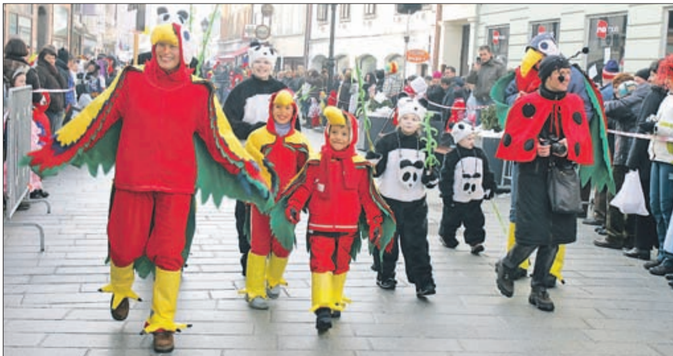
Med pustnimi skupinami, ki so pri Zavodu za turizem Kranj prijavile za tekmovanje, je najbolj navdušila skupina Živali na P.