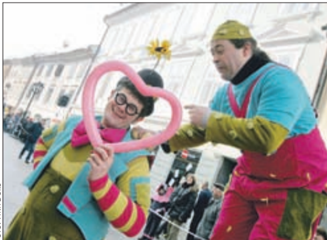
Ker sta letos pust in Valentin združila moči, je bilo med maškarami tudi precej zaljubljenecv.