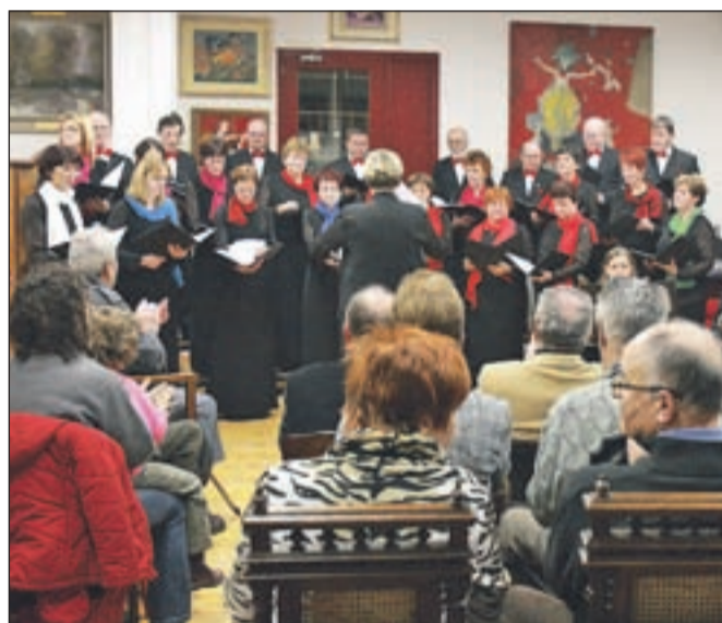
Ob kulturnem prazniku se je v galeriji mizarstva Ovsenik predstavil mešani pevski zbor Musica viva Kranj-Primskovo.