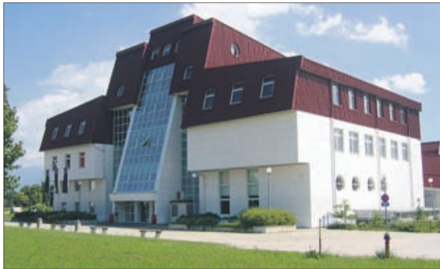
Fakulteta za organizacijske vede velja za eno najbolj opremljenih fakultet v Sloveniji.

V petdesetletni zgodovini izobraževanja in znanstvenega raziskovanja je Fakulteta za organizacijske vede dosegla številne uspehe. Najboljši pokazatelj dobrega dela fakultete so kariere diplomantov. Diplomante Fakultete za organizacijske vede, teh je bilo v vseh letih