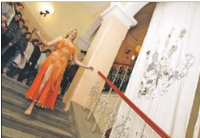
Na gimnazijskem stopnišču so dijaki prvih letnikov pustili svoje sledi.