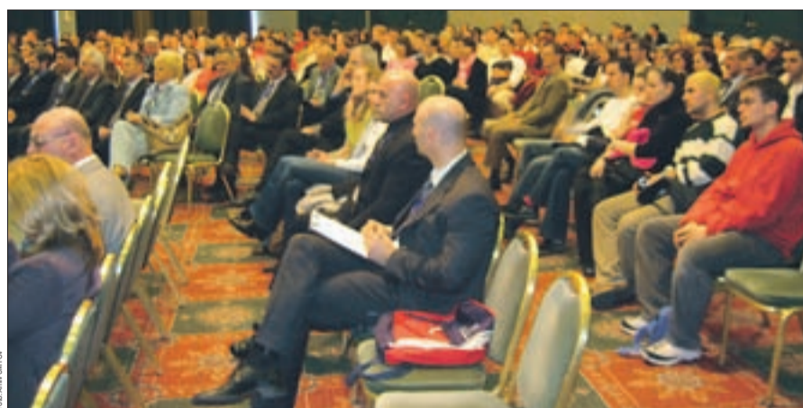
Tridnevni dogodek, ki združuje ugledne domače in tuje strokovnjake iz gospodarstva in javne uprave.