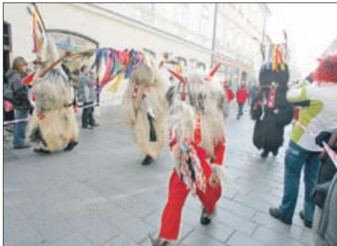
Kurenti so tudi iz mrzlega Kranja preganjali zimo, čeprav jim zaenkrat še ni uspelo, pa je pomlad vsekakor pred vrati.