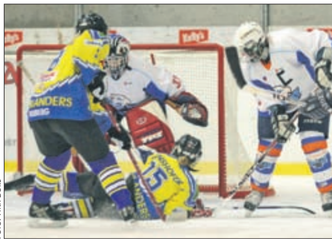
Hokejistke Triglava (v belih dresih) so z borbeno igro v razširjeni avstrijski ligi DEBL osvojile tretje mesto.