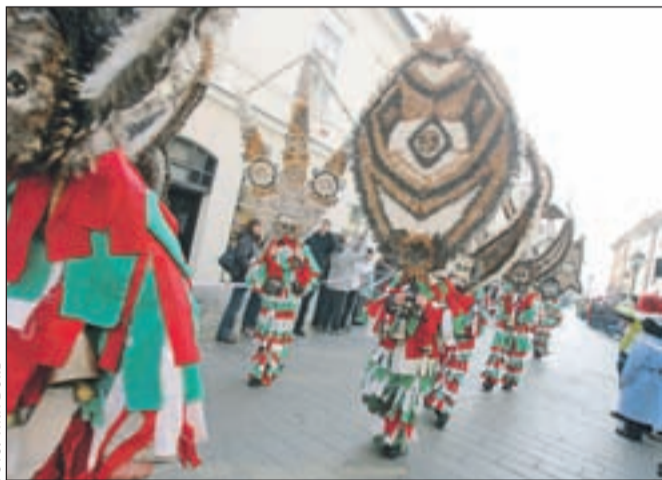
Obiskovalci so bili navdušeni bolgarsko skupino Sourvakar, ki predstavlja avtentično folklorno pustno tradicijo.

Pihalni orkester MO Kranj, Krančkova družina, Teater Cizamo na hoduljah, Slovenska obalna straža (društvo Vrtačarji Lesce), Suho-krajinska resna alkoholna družba - SRAD s šnopceta mi in Krajnški Romi z medvedom, Zametske maškare s Hrvaške, Kurenti Turističnega društva Podgorci, orači in pokači iz Rogoznice, Kurenti turističnega društva Podbrežje, ... Poleg njih je na pustovanje prišlo tudi šest skupin, ki so se prijavile na tekmovanje za najpustno skupino. Zmagala je skupina Živali na P, ki je prejela nagrado v vrednosti 1650 evrov, izkoristili pa jo bodo lahko za tedenski najem apartmajev na otoku Pagu, za storitve v Mega centru in učenje v švicarski šoli. Drugo mesto je osvojila ekipa Gosenic in dobila nagrado v vrednosti 800 evrov, tretje pa je bila Indijanska družina in prejela nagrado v vrednosti 350 evrov.