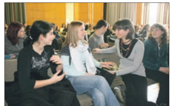
Srečanja so se udeležili predstavniki učencev z mentorji iz osnovnih šol v občinah Kranj, Cerklje, Jezersko, Naklo, Predvor in Šenčur.

Sklepe, pobude in predloge iz parlamenta bodo posredovali Zvezi prijateljev mladine Slovenije, da jih bodo vključili v temeljni dokument 19. otroškega nacionalnega parlamenta, ki bo zasedal 23. marca v dvorani državnega zbora v Ljubljani. Mladi so predlagali tudi nekaj tem za otroški parlament prihodnje leto. Te so Vzorniki mladih: Smo se sposobni sami organizirati?, Nasilje v šoli, Nasilje na splošno, Homoseksualnost in Razlike med mladimi.