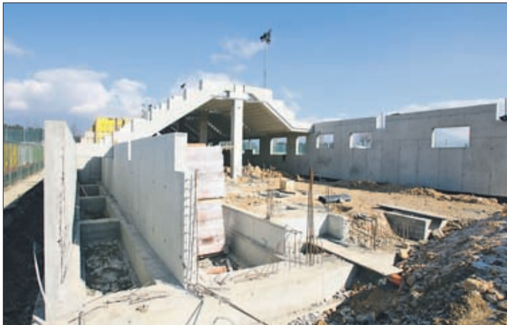
Dela na tribuni Hribček kljub zimi potekajo po načrtih.