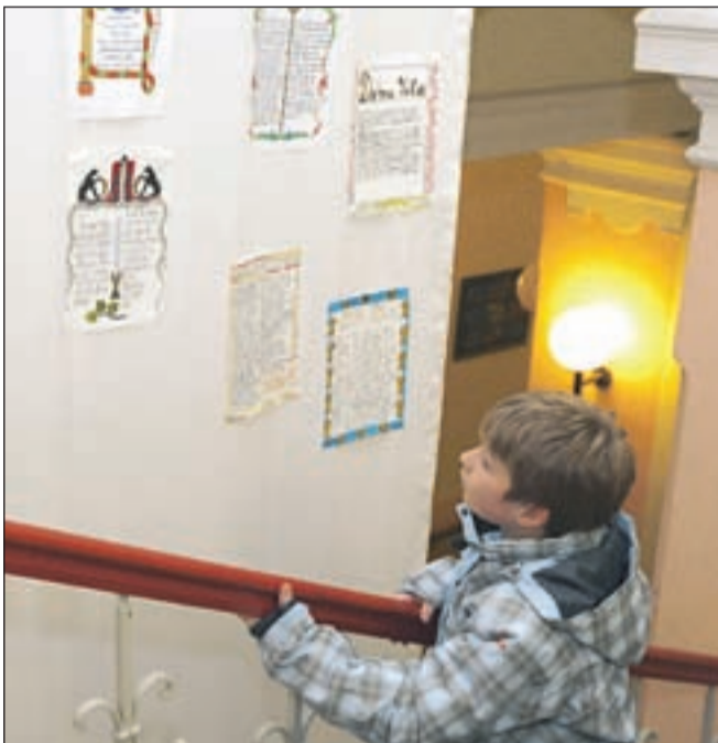
Pri grški carmen figuratum so dijaki telo posameznega božanstva upodobili v pesmi.