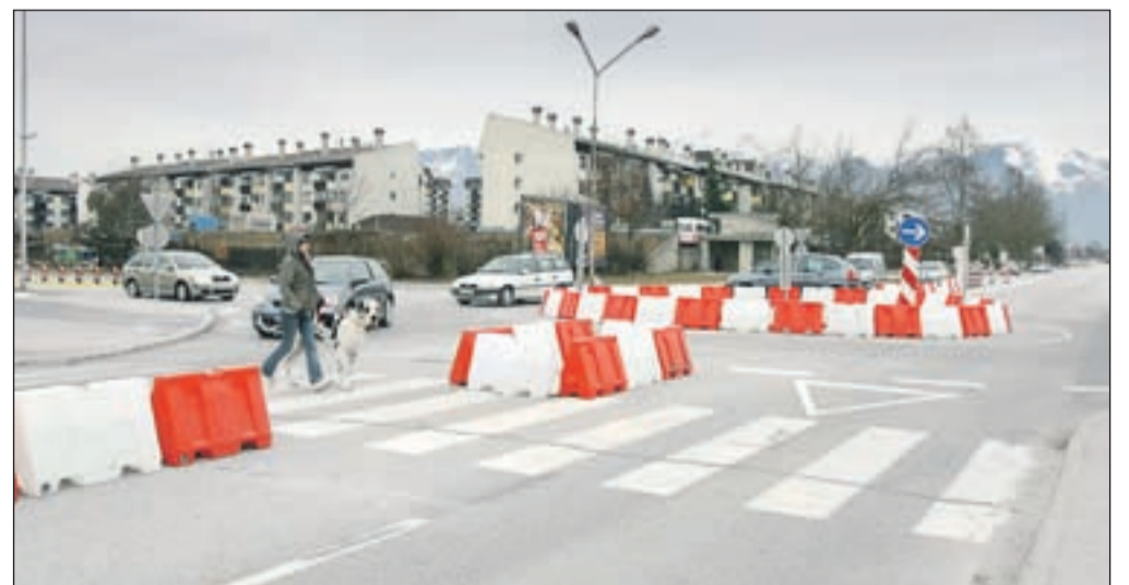
Za krožišče je sicer malo prostora, naj bi pa vendarle umirilo promet in zmanjšalo število prometnih nesreč.

Na občini so se na pritožbe odzvali in so pred dobrim tednom dni postavili mon-