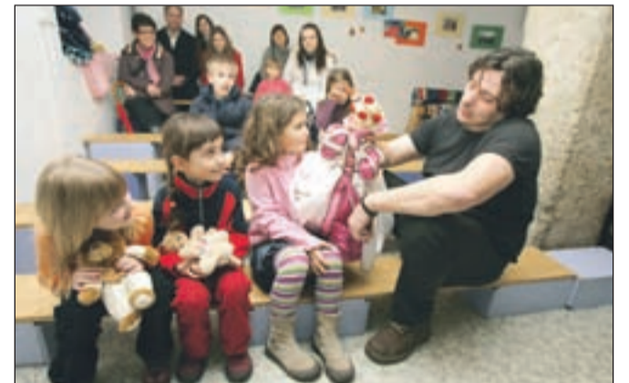
V Otroškem kulturnem centru Kriče krace na Glavnem trgu je Lutkovno gledališče Fru Fru najmlajšim zaigralo Turjaško Rozamundo.