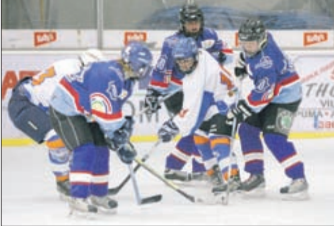
Hokejistke Merkurja Triglava so v polfinalu avstrijske lige DEBL zanesljivo ugnale ekipo Young Birds iz Kitzbühla.

Letošnja sezona je najuspešnejša v zgodovini gorenjskega ženskega hokeja, za to pa so poskrbele hokejistke kranjskega Merkur Triglava. Gorenjke namreč letos uspešno nastopajo v razširjeni avstrijski ligi DEBL, po kar šestnajstih tekmah pa so še vedno brez poraza! Potem ko so vse svoje nasprotnice ugnale v rednem delu, so še bolje zaigrale v polfinalu, kjer so se pomerile z ekipo Young Birds iz Kitzbühla. Na domačem ledu so jih premagala kar s 7:0, v gosteh pa so slavile s 4:1. Tako so si prislužile veliki finale, kdo pa bodo njihove nasprotnice, pa bo jasno konec tedna. "Nič nas ne more več ustaviti!" optimistično pravijo Triglavanke, ki se za podporo zahvaljujejo svojim zvestim navijačem. V. S.