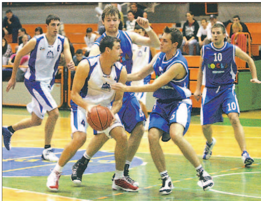
Košarkarji Triglava so v prvi domači prvenstveni tekmi premagali ekipo Rogle, jutri pa v Kranju prihaja ekipa Radenske Creativ.

Znano je namreč, da zadnja sezona za košarkarje kranjskega Triglava, ki so igrali v 1. B ligi, še malo ni bila spodbudna. "Pet kol pred koncem sezone je bilo člansko moštvo celo pred izpadom v še nižjo ligo, klub pa je bil finančno tako podhranjen, da je bilo sploh sporno kakšno koli igranje. Tako si