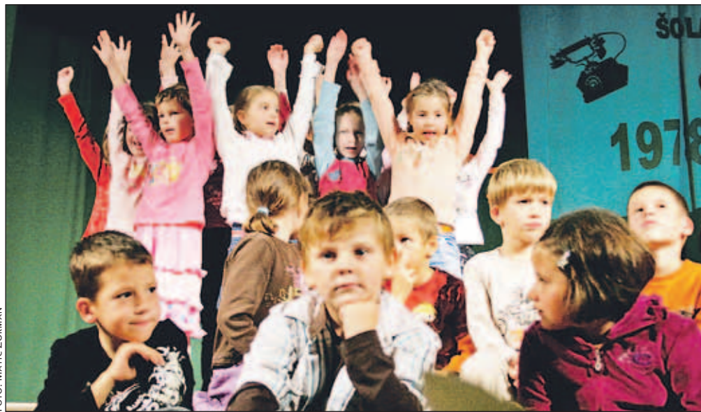
Prireditev so z igro, pesmijo in plesom popestrili učenci šole in otroci tamkajšnjega vrtca.