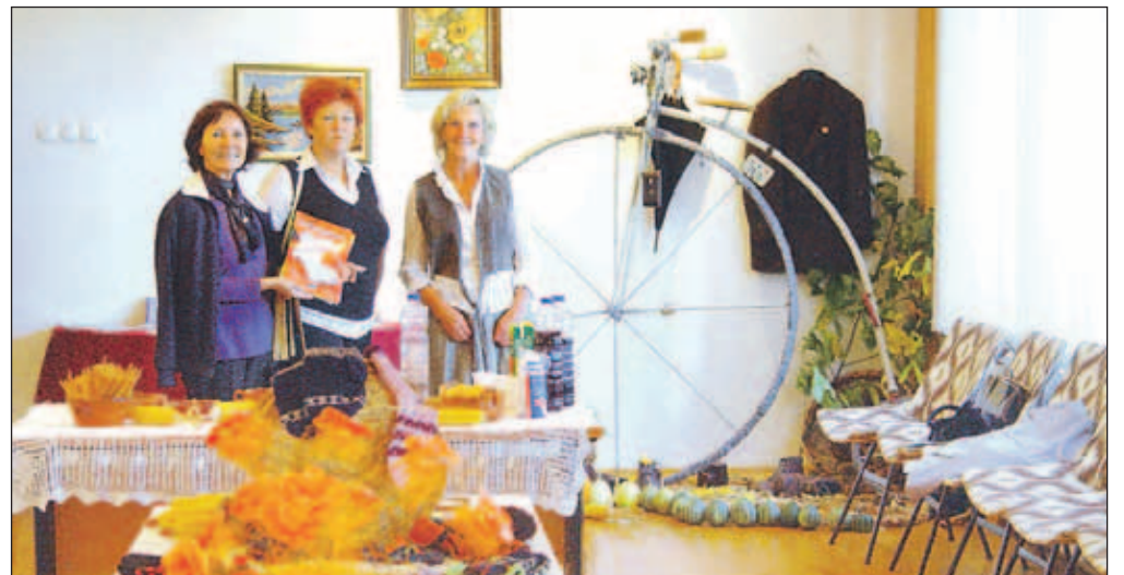
Četrta razstava ročnih del je poseben pečat dalo starodobno kolo.