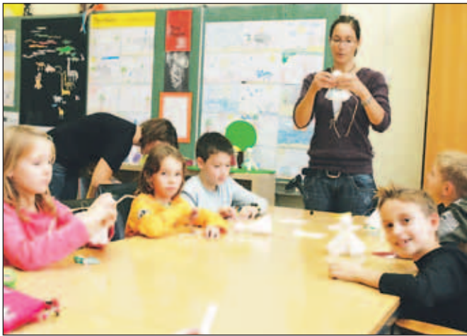
Izkupiček od prodaje punčk iz cunj so namenili otrokom iz socialno ogroženih družin.

Z omenjenim projektom so se pridružili tudi svetovni kampanji proti revščini z naslovom Vstani in ukrepaj, s katero se potegujejo za vpis v Guinnessovo knjigo rekordov. Letos naj bi namreč pri kampanji v slabih dveh mesecih sodelovalo 67 milijonov ljudi ali odstotek svetovnega prebivalstva.