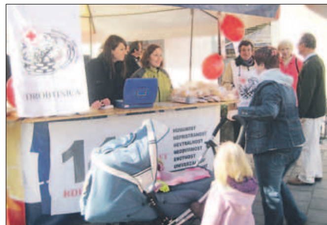
V akciji Drobtinica pomagajo tudi številni prostovoljci.

"V preteklih šestih letih (obdobje 2002-2007) smo z menjava peciva in donacijami zbrali 8.667,16 evra, kar je zadoščalo za brezplačna šolska kosila 37 otrokom iz socialno šibkih družin za osem mesecev šolskega leta," je še povedala Miklavčičeva.