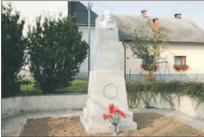
Spomenik na Podreči