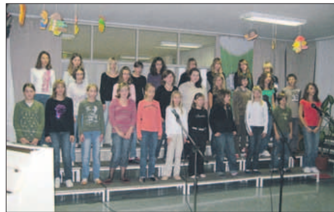
Ob prazniku sveta krajevne skupnosti Orehek-Drulovka so pripravili slovesnost v tamkajšnji šoli.