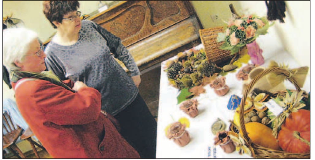
Mnogi slepi in slabovidni kljub okvari vida dobro obvladajo ročne spretnosti. Na sliki so izdelki z razstave njihovih ročnih del.