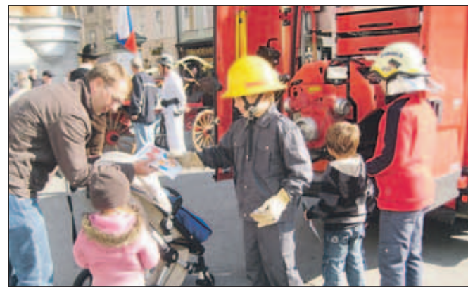
V soboto je bila pri vodnjaku na Glavnem trgu v Kranju delavnica z gasilsko vsebino. Mimoidoči so si lahko ogledali tudi gasilsko vozilo PGD Mavčiče, gasilci PGD Predoslje pa so se oblekli v stare uniforme in pokazali več kot sto let staro gasilsko opremo.

Tema letošnjega meseca požarne varnosti je Varujmo naravo pred požari. Gasilska zveza Mestne občine Kranj (GZ MOK) je pripravila nekaj dogodkov, med drugim so imela prostovoljna gasilska društva Dan odprtih vrat, gasilci so imeli preventivne preglede hidrantov in demonstrativne vaje, v Goričah je bil kviz mladih gasilcev. V Trgovskem centru Merkur na Primskovem so na ogled nagrajena likovna in literarna dela osnovnošolcev iz natečaja GZ MOK. S. K.