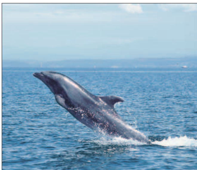
Delfin - velika pliskavka pred Piransko punto