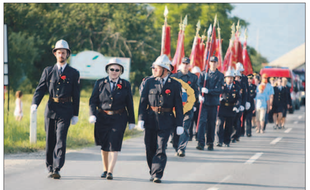
Ob 80-letnici so v PGD Bitnje pripravili gasilsko parado.

K ustanovitvi gasilskega društva pred osemdesetimi leti je vaščane navedla potreba po zavarovanju njihovega premoženja, saj so bili v tistem času požari na pretežno lesenih in s slamo kritih poslopih zelo pogosti. Na ustanovnem občnem zboru se je zbralo 45 članov, članstvo pa od takrat ves čas narašča, tako da društvo danes šteje že več kot tristo članov. Za vaje in gašenje požarov so si sprva izposajali motorno črpalko pri sosednjih društvih Žabnica in Stražišče, že leto po ustanovitvi društva pa so kupili lastno motorno črpalko skupaj z gasilskim vprežnim vozom. Leta 1934 so končali gradnjo gasilskega doma, ki še danes stoji na istem me-