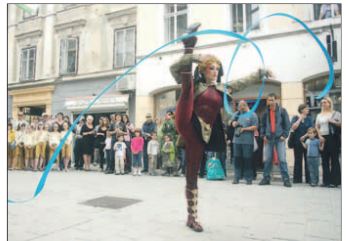
Magično gledališče Serpentes