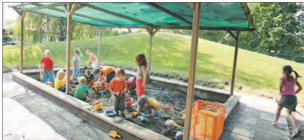
Otroci se ob največji vročini sami umaknejo v senco.