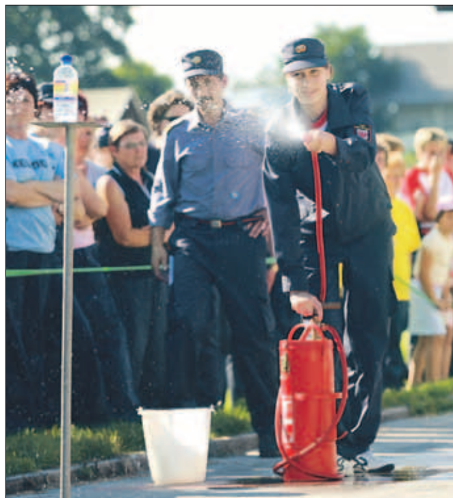
Regijsko srečanje članic v Mavčičah so spodbujali številni navijači. PGD Mavčiče je med tistimi društvi, ki se lahko pohvalijo z velikim številom gasilk, od najmlajših pa vse do članic.