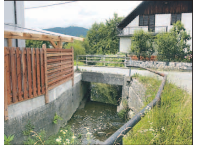
V potok Žabnica so številni prebivalci speljali izpuste iz greznic in meteorno vodo.

segli, da so gradnjo kanalizacije v občinskih načrtih premaknili za pet let in se bo, če bodo seveda dobili soglasja vseh lastnikov zemljišč, začela prej, kot je bilo prvotno načrtovano. Po operativnem planu izgradnje kanalizacije v kranjski občini so namreč gradnjo kanalizacije v Bitnjah predvideli šele v letih 2010 oziroma 2012, končali naj bi jo do leta 2015 oziroma 2017. "Ker je bilo to za nas krajane