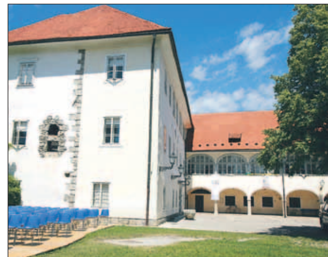
Na vrtu gradu Kieselstein ta čas opravljajo arheološka izkopavanja.

nim razstavam. V pritličju gradu bodo med drugim uredili kavarno oziroma čajnico in prostor za multimedijško predstavitev. V pritličju muzeja bo delovala tudi muzejska knjižnica. "Po novem bodo izkoriščeni vsi prostori, tudi dve mansardi," je razložila Barbara Ravnik Toman. Zato jim bo še toliko bolj prišla prav nova pridobitev, to je panoramsko dvigalo na zunanji strani grajskega stolpa. Na dvorišču gradu Kieselstein pa bodo uredili prireditveni prostor, nad kate-