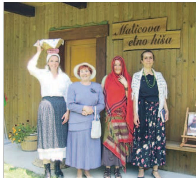
Članice bralnega krožka Sorško polje so sodelovale na bralni karavani v Ravnem dolu.

zdaj že tradicionalnih prireditev. Tako vsako leto poskrbijo za obdarovanje otrok ob novem letu, aprila pa se skupaj veselijo Prihoda pomladi, ki ponavadi sovпада s krajevnim praznikom. "Ob tej priložnosti osebno povabimo vse krajane nad 80 let, za katere pripravimo simbolična darila." Zadnja sobota v avgustu pa je rezervirana za Dierendaj na otroškem igrišču.