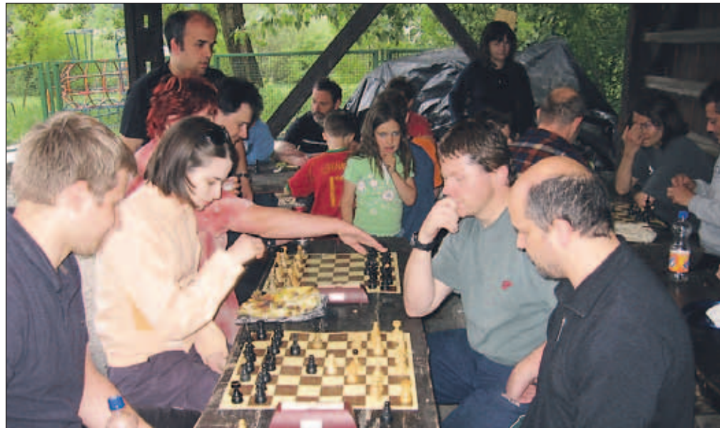
Kranjski šahisti so se zbrali na prijetnem druženju v Struževem.