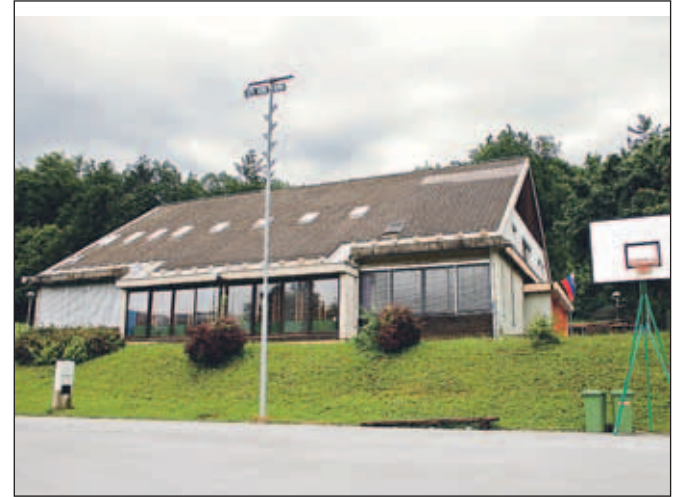
Podružnična šola Besnica naj bi leta 2010 dobila telovadnico oziroma kar večnamenski objekt.

ge. Nekoč je bila to telovadnica, danes pa ta prostor ne ustreza več standardom; pod je slab, v telovadnici ni toaletnih prostorov, skozi okna piha in pozimi gre ogromno kurjave, ki gre na račun šole, v nič. Prostor je zunaj šolskega poslopja in kadar je slabo vreme, moramo z učenci v mrz in po uri telovadbe vsi pregreti nazaj v šolo. Pogoji za telovadbo so zares slabi, tudi zunanji sodelavci ne želijo izvajati popoldanskih dejavnosti v takem prostoru." Dubravica je še izpostavila: "Želimo, da se v prvi vrsti zadovolji potrebam šole, da imamo šole v občini enake pogoje, saj bomo le na ta način obdržali otroke v domačem kraju, ne pa da jih bodo starši zaradi boljše kvalitete vpisovali drugam. Seveda je tudi prav, da se omogoči popoldanske dejavnosti za krajane, vsaj možnosti rekreacije." Novogradnja je mišljena kot prizidek k šoli, investicijski stroški zasebnega investitorja, ki bi ga izbrali na jav-