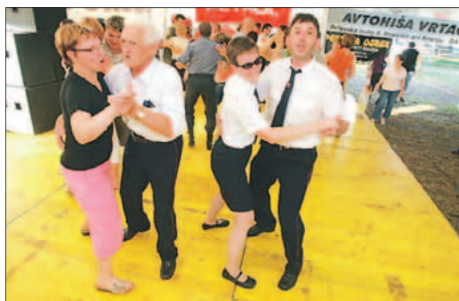
Gasilci so ob obletnici poskrbeli tudi za zabavo. En večer so plesali v družbi Navihank.