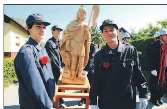
Mladi gasilci nosijo kip sv. Florjana, zaščitnika gasilcev. S. K., foto: Tina Dokl