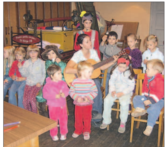
Vsakah 14 dni so pripravili pravljicne urice, ki so bile zelo dobro obiskane.