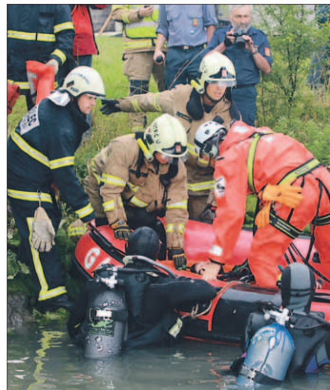
Demonstrativna vaja reševanja iz vode, postopki v primeru razlitja nevarnih snovi in prikaz gašenja. V vaji so sodelovali kranjski poklicni gasilci, Prostovoljna gasilska društva Gasilske zveze Mestne občine Kranj, 15. HEB (helikopterski bataljon) Slovenske vojske, Prehospitalsna enota nujne medicinske pomoči Kranj, enote Civilne zaščite Kranj (Podvodna reševalna služba Kranj, Klub vodnikov reševalnih psov Kranj, kranjski taborniki).