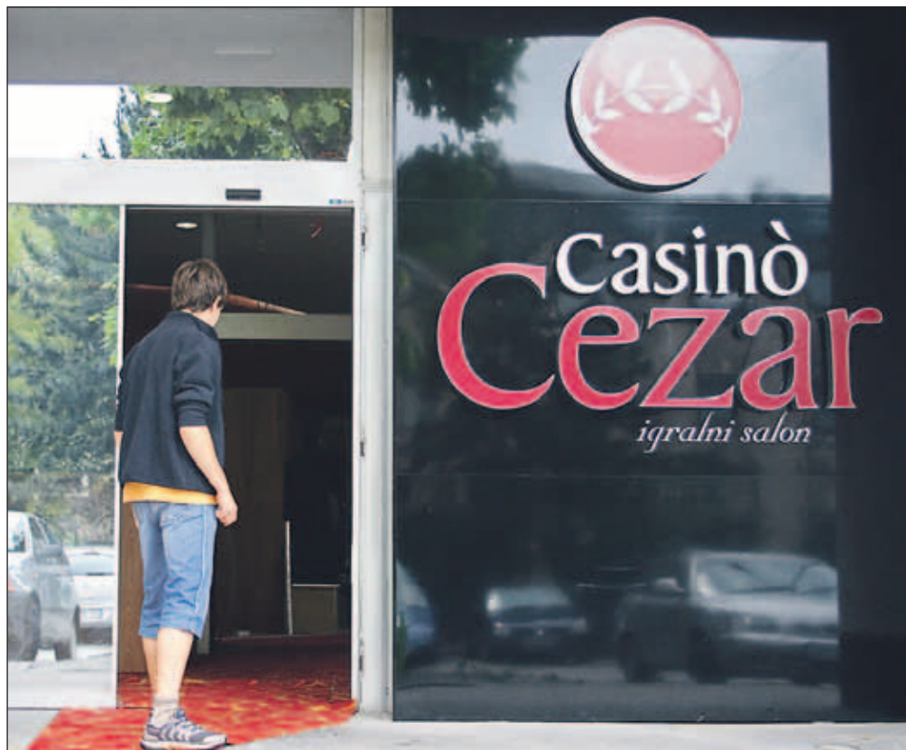
Vrednost naložbe v Casino Cezar je po trenutnih ocenah nekaj čez milijon evrov.

Novi Casino Cezar bo na dan odprtja začel poslovati s 70 igralnimi mesti, kar pomeni 62 igralnih avtomatov in eno elektronsko ruleto. "Do začetka septembra bomo delno preselili še igralne naprave iz Casinaja Nebotičnik, delno pa kupili nove, tako da bo končno število igralnih mest v Casinaju Cezar 120; od tega bodo 104 igralni avtomati in dve elektronski ruleti," je povedal Vratarič.