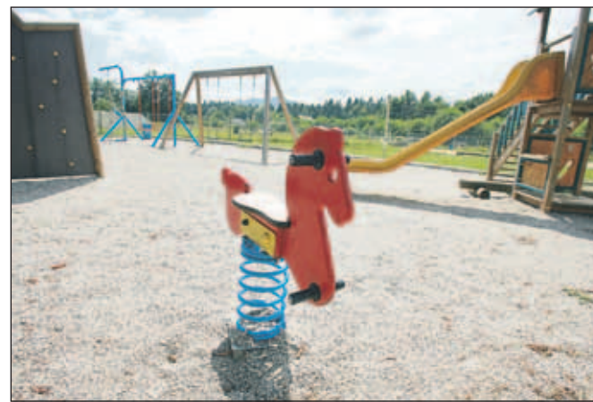
Na območju nogometnega igrišča naj bi v prihodnje zraslo športno in kulturno središče.

Tako so že v proračunu za minulo leto rezervirali 35 tisoč evrov za legalizacijo objekta. "A se je legalizacija zavlekla, ker je bilo treba še odkupiti zemljišče. Zdaj bomo to le uredili," je napovedal Oblak in dodal, da bodo z obnovo in dograditvijo stavbe pridobili prostore za vseh osem društev v kraju. "Tja bi preselili tudi prostore krajev-