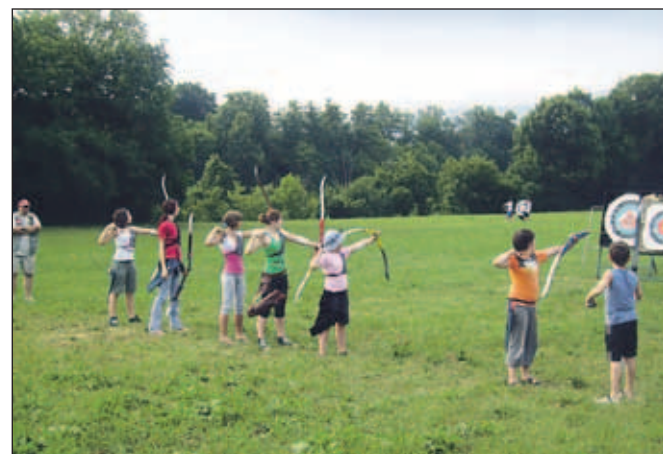
Lokostrelci poleti že vrsto let trenirajo na Fockovem travniku na Hujah.