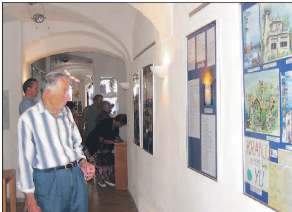
Vsaka od evropskih držav se teden dni predstavlja v Kranjski hiši, veliko zanimanje pa je bilo za razstavo ob tednu Francije, ki je bila posvečena 50-letnici pobratenja Kranja z mestom La Ciotat.