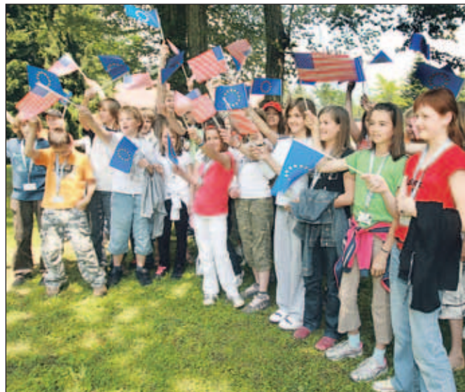
Kranjski petošolci so amerškemu predsedniku mahali z zastavicami.