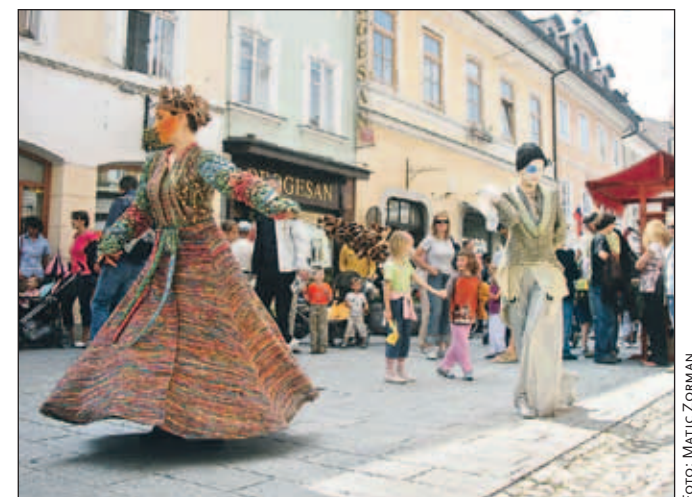
Kranj zadnje tedne živi z glasbo, plesom in zabavo.