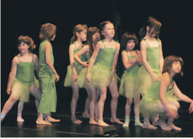
Plesna skupina Malčki