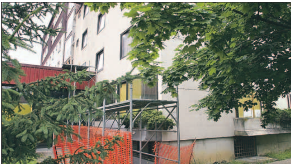
S pročelja starega študentskega doma odpada omet, zato ga bodo jeseni začeli obnavljati.