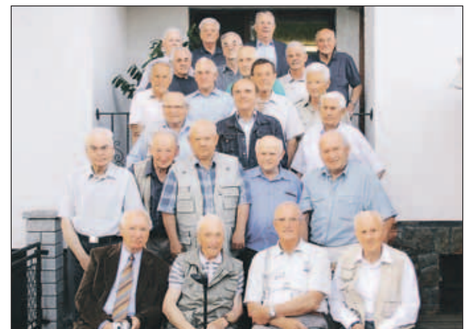
Iskrini diplomanti iz leta 1953 na letošnjem srečanju v Kranju.

Industrijsko kovinarsko šolo Iskra so obiskovali učenci iz vseh krajev Slovenije, v neposredni bližini je imela internat. "Velika večina učencev te šole je ostala v industriji, veliko od njih prav v Iskri. Nekateri so šolo nadaljevali ob delu in prišli do univerzitet-