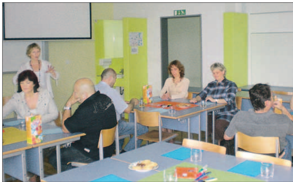
Na zadnji delavnici so starše usposobili, da znajo sami voditi starševske delavnice.