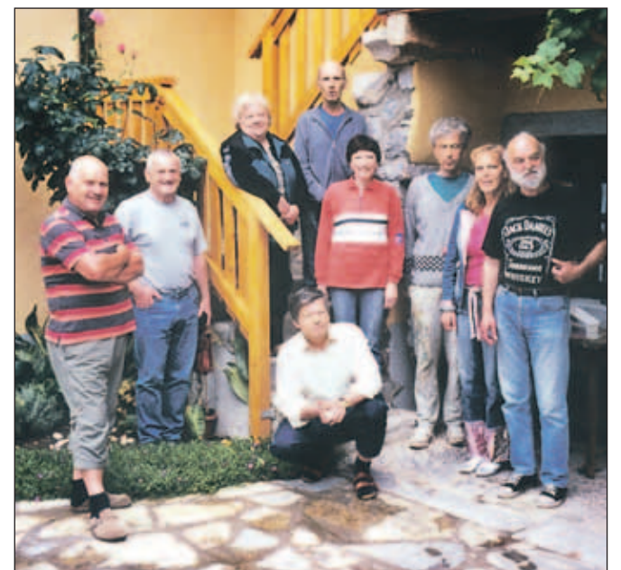
Večji del sodelujočih z letošnje "Jasne"

del. Ob zaključku tokratne kolonije so prijaznim gostiteljem podarili sliko njihove domačije, vsa dela, ki