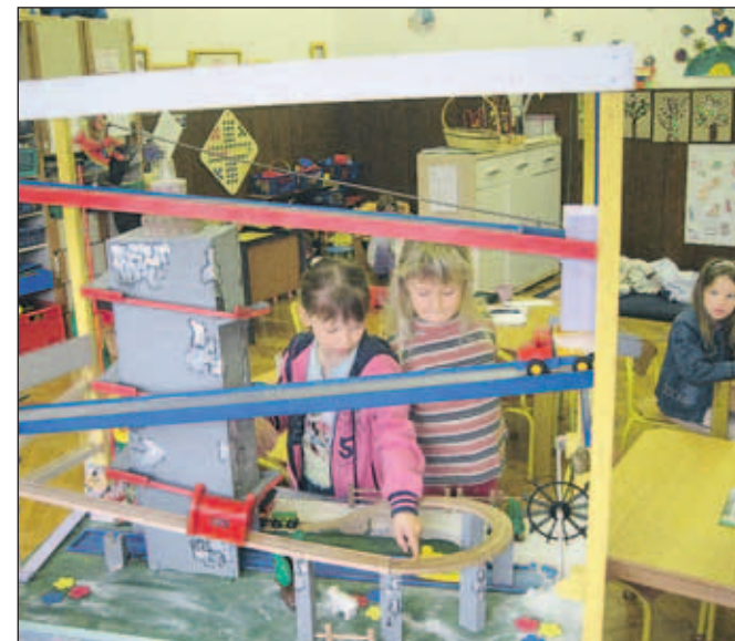
Otroci v vrtcu Čirče so nad eksperimentom, ki so ga izdelali njihovi starši in dedki, navdušeni.