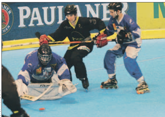
Domače hokejiste ekipe Shot team (v črnih dresih) so v boju za tretje mesto ugnali hokejisti City park strel.

Prejšnji konec tedna je nova hokejska dvorana Arena Zlato polje gostila hokejiste v in line hokeju oziroma hokeju na rolerjih, ki so se pomerili v velikem finalu elitne in prve lige. V obračunu za tretje mesto v prvi ligi sta igrali ekipi Sebbri team orli iz Stražišča in Strele tigersi. Boljša je bila ekipa Strel tigerson, ki je zmagala s 7 : 4, tako da je ekipa Sebbri team orli na koncu osvojila zgolj četrto mesto. V tekmi za prvo mesto je ekipa Kengo Kingsov s 6 : 4 ugnala moštvo TNT Dinamitov. Zanimivi pa so bili nato tudi obračuni za naslov prvakov v elitni ligi, kjer sta najprej za tretje mesto igrali moštvi City park strele in domača ekipa Shot team, z 8 : 6 pa je slavila ekipa City park strel. Tako so se Kranjčani, ki so bili razočarani že zato, ker niso igrali v velikem finalu, morali zadovoljiti s končnim četrtim mestom. Naslov prvakov je osvojilo moštvo Dinamitov iz Horjula, ki je bilo boljše od ekipe Troha Pub. Zanimiv mednarodni Paulaner turnir v in line hokeju pa se v novi dvorani Arena obeta spet naslednjo soboto, 28. junija. Na njem bo nastopilo osem ekip, začel se bo ob 9. uri, finale pa naj bi odigrali ob 19. uri. Med tekmami bodo organizatorji pripravili tudi igre za gledalce, ki se bodo lahko preizkusili v hokejskih spretnostnih igrah. Po turnirju bo razglasitev najboljših ekip in zabava s skupino Joške v'n. Vstopnine ne bo. V. S.