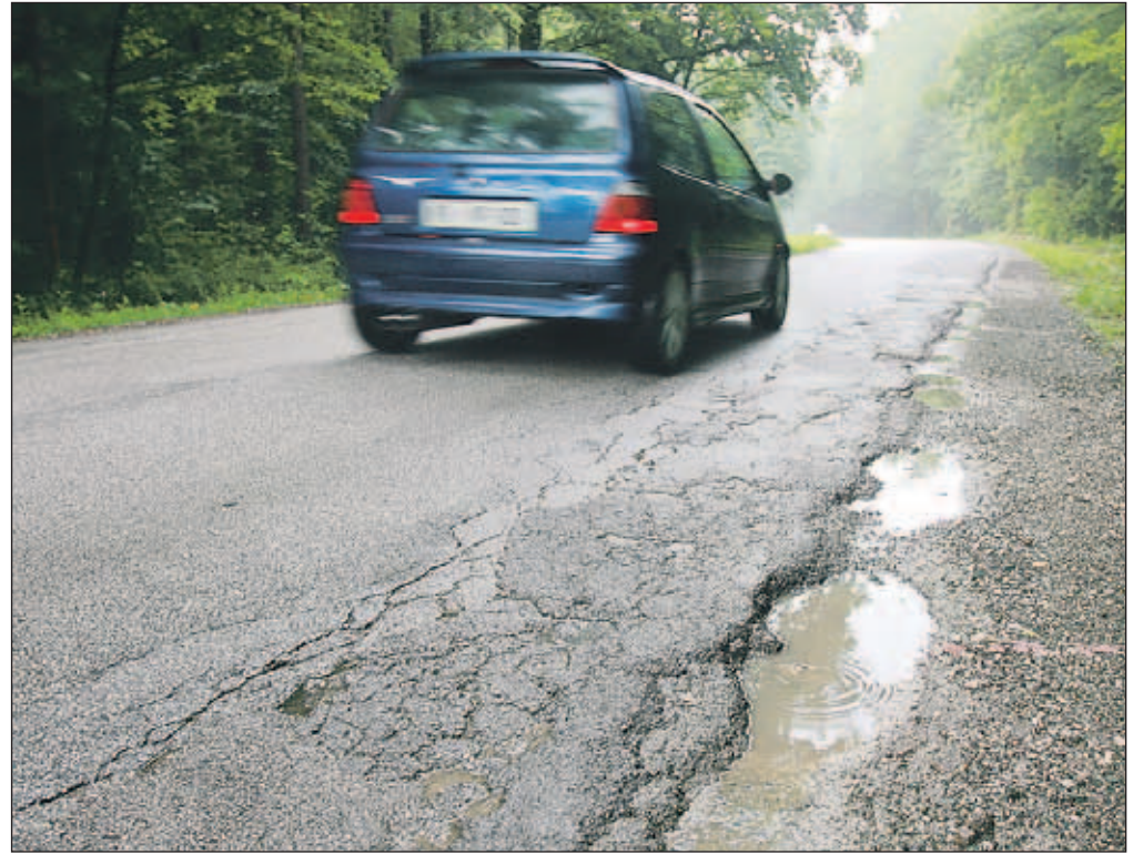
Cesto proti Bregu bodo začeli urejati še letos.