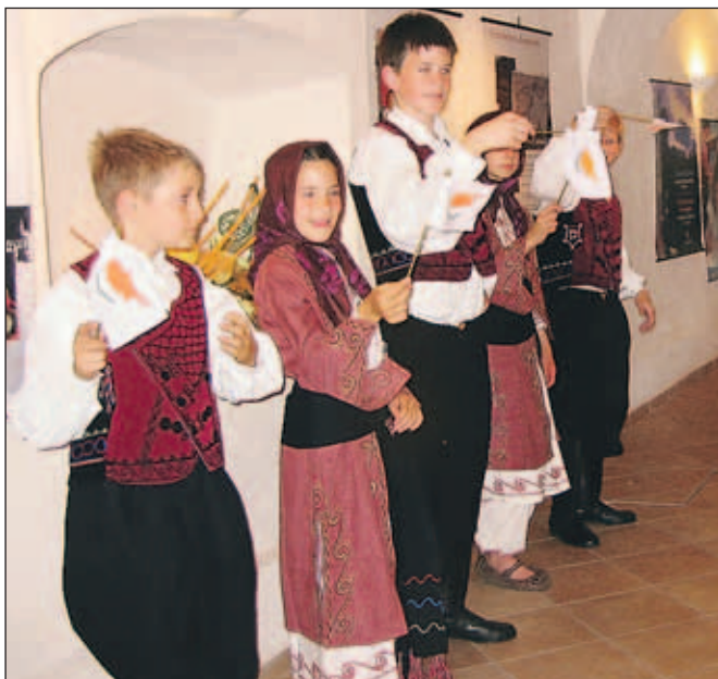
Ob razstavi o Cipru so mladi predstavili tudi njihove narodne noše.