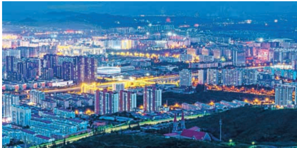
Zhangjiakouju s 4,65 milijona prebivalci zaradi strateške lege pravijo tudi severna vrata Pekinga.

Mesto, ki leži severozahodno od Pekinga, bo februarja 2022 eno od prizorišč zimskih olimpijskih iger, na katerem se bodo merile reprezentance v smučarskih skokih, smučarskem teku, biatlonu, nordijski kombinaciji, deskanju na snegu in smučanju prostega sloga. Prav šport je tisto, kar najmočnejše povezuje Kranj in kitajsko pobrateno mesto. Zhangjiakou se ponaša z naj sodobnejšo infrastrukturo v zimskih športih, Kranj pa je znan po dobro postavljenem šolskem sistemu za