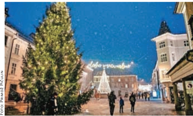
Mestno jedro Kranja tudi letos krasita dve novoletni drevesi.