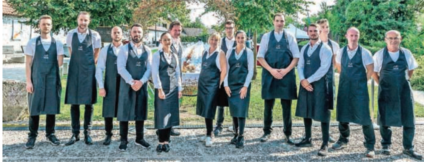
Ekipe nataric in natarjev iz osmih kranjskih lokalov na Kranjski dolgi mizi

Zavod za turizem in kulturo Kranj je kljub nepredvidljivim razmeram začel delati prve večje korake za razvoj domače gastronomije.