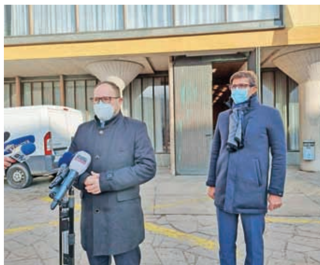
Minister Jernej Vrtovec je napovedal skorajšnji začetek gradnje ceste Britof–Hotemaže.