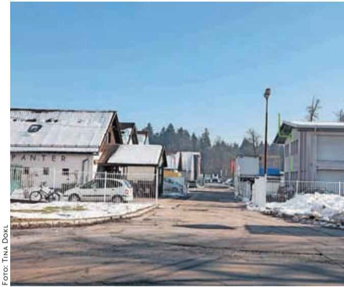
Širitev Poslovne cone Hrastje bo zagotovila še večji gospodarski razvoj v Kranju, so prepričani na občini.

Ker del lastnikov zemljišč za gradnjo javne infrastrukture ni pripravljen prodati zemljišč po ceni, določeni s cenitvijo, so bili v MOK zaradi javnega interesa prisiljeni zagnati postopke razlastitve, pojasnjujejo na občini. »Obžalujem, da smo morali povleči takšno potezo, a verjamem, da se bo ob zaključku projekta izkazalo, da je bilo vredno vztrajati. Projekt bo namreč zagotovil boljše pogoje za poslovanje in s tem razcvet gospodar-