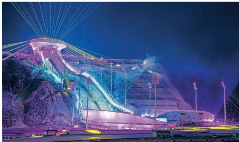
Pri izgradnji skakalne infrastrukture v Zhangjiakouju je sodelovalo tudi kranjsko podjetje MANA Original.

Naslednji teden je predviden samo en cepilni dan, podatki o terminih cepljenja pa so sproti objavljeni na spletni strani Zdravstvenega doma Kranj in Mestne občine Kranj. Pristojni še opozarjajo, da je pred cepilnim centrom v kranjski vojašnici po novem na voljo le še 69 parkirnih mest, zato pozivajo vse, ki prihajajo na cepljenje, naj izkažejo prednost pri parkiranju starejšim, invalidnim in drugim ranljivim skupinam.