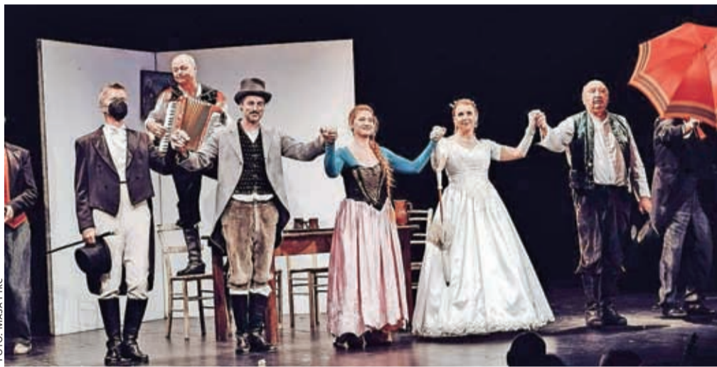
Ekipa Županove Micke – tudi po dvajsetih letih brhka, živahna in občinstvu v veselje

Ekipa Županove Micke je prepričana, da bo prihodnje leto na vrsti tudi jubilejna, tristota predstava.