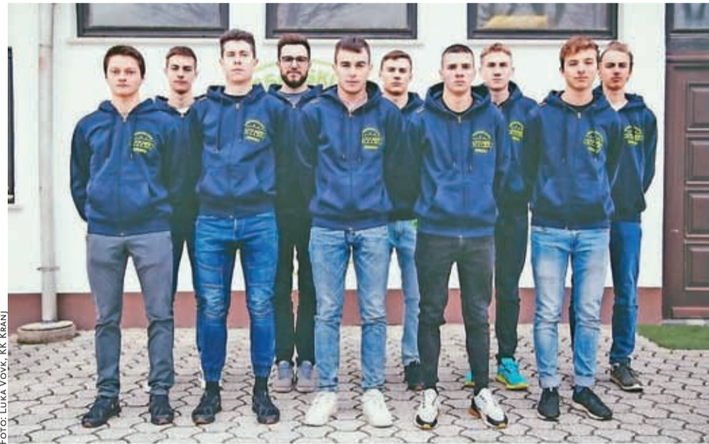
Članska ekipa Kolesarskega kluba Kranj je močno spremenjena in pomlajena.