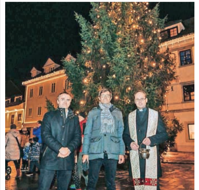
V Kranju se lučke že tradicionalno prižgejo 3. decembra. Prižig lučk spremlja županovo božično-novoletno voščilo in blagoslov novoletne smreke.

znak zelene sheme slovenskega turizma. Velik korak naprej smo pod okriljem projekta Evropska gastronomska regija 2021 naredili na področju gastronomije. Z novo strategijo smo začrtali smernice v turizmu za nadaljnjih šest let. Izpeljali smo več oglaševalskih akcij in izdali nekaj novih turističnih brošur. Spletna stran je bogatejša za prodajni sistem namestitev in doživetij ter spletno trgovino s spominki. Imamo dva nova turistična produkta: Digitalni potep – mesto skriva, podzemlje odkriva ter Zvonik cerkve sv. Kancijana. Utrjevali smo poslovne vezi in tkali nove. Skupaj že načrtujemo aktivnosti, projekte in dogodke, ki bodo bogatili našo destinacijo prihodnje leto. Zelo nas veseli tudi, da smo v času strogih epidemioloških ukrepov uspešno izpe-