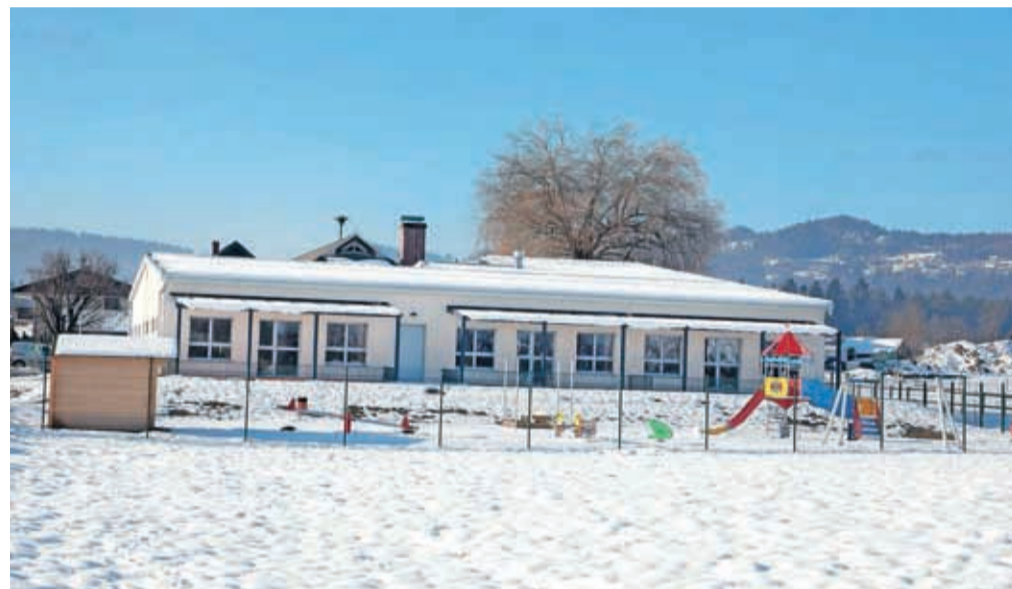
Iz novega Vrta Biba v Bitnjah se bo kmalu slišal otroški vrvež.

Po enoletnem premoru zaradi epidemije so se znova obudila mednarodna povezovanja. MOK je začela postavljati doprnskih kipov Prešernovih sodobnikov v Parku La Ciotat, pobratila se je s kitajskim mestom Zhanjiakou.