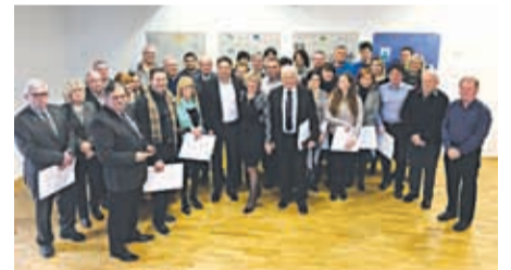
Podelitev jubilejnih priznanj s preteklih let

laga s podatki, a vas vseeno pozivamo, da nam sporočite začetek vaše dejavnosti.