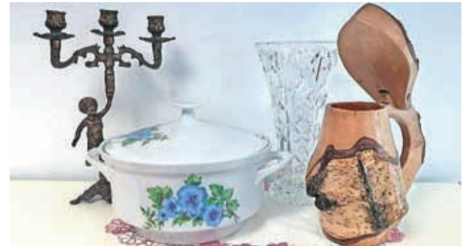
Starejši predmeti so po obnovi lepi in koristni.

Vabimo vas, da zlasti v tednu od 14. do 19. septembra pobrsate po stanovanju in najdete stvari, ki jih ne potrebujete več, imajo pa še uporabno vrednost, ter jih podarite Fundaciji Vincenca Drakslerja za namen ponovne rabe. Enos-