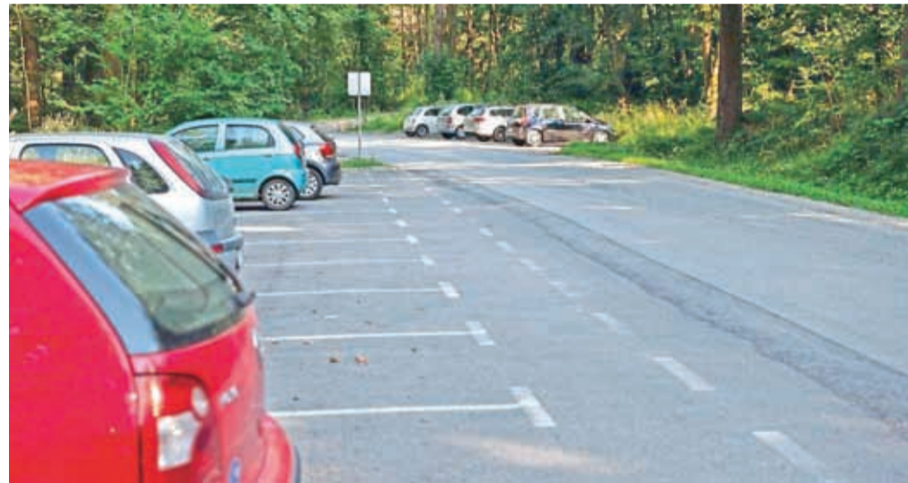
Na Mestni občini Kranj si med drugimi projekti prizadevajo občanom in obiskovalcem še bolj približati tudi dostopnost izhodišč za vzpone na Sv. Jošt nad Kranjem.

Z lastnikom zemljišč so se že dogovorili za izdelavo pločnika ob IBI centru v sklopu izboljšanja varnosti poti v šolo do podružnične šole Primskovo in čakajo na vpis nove parcele v kataster. Projekt bo predvidoma realiziran v zadnji četrtini letošnjega leta.