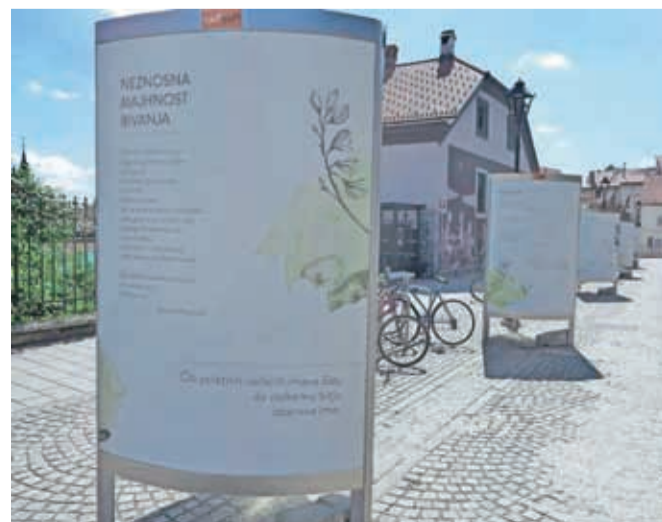
Postoj, pogled, preberi in razmisli.