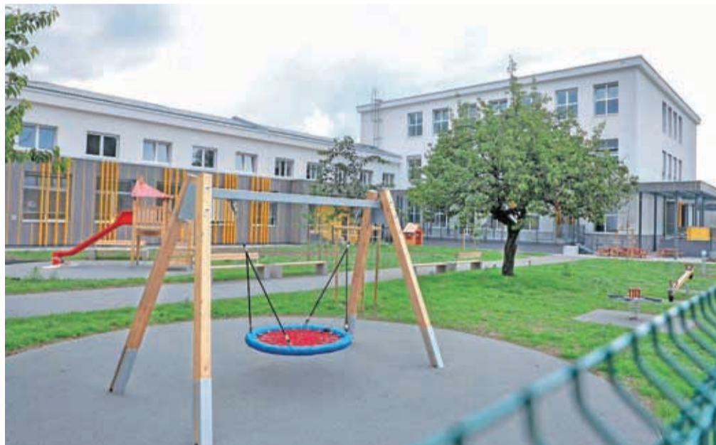
Svetle učilnice, nova igrala, zunanji pitniki za vodo, novo zasajena drevesa in vrtički že čakajo na otroški vrvež.

»Celovita prenova je velika pridobitev za MOK, saj s tem rešujemo tudi prostorsko stisko v vrtcih in šolah, skrbimo za vzgojo in izobraževanje našega podmladka, prizadevamo si, da bi vsi imeli enake pogoje za osebnostni in intelektualni razvoj. Časi, ko so generacije, ki so mladost preživele v delu stavbe, ki je