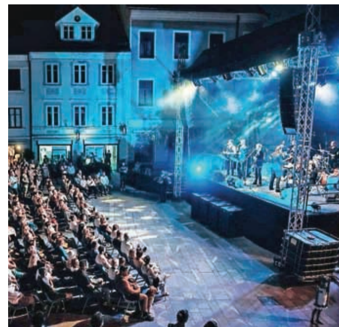
Prešerno poletje je Kranj napolnilo s čarobno energijo koncertov, kulturnih in kulinarčnih užitek.