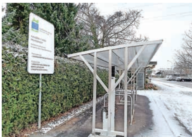
Kolesarnica pri pokopališču v Kranju

Na vseh teh lokacijah so postavljeni osvetljeni nadstreški in stojala za kolesa, kolesarji pa bodo veseli tudi stebrička za popravilo koles. Vsi, ki že uporabljajo električna kolesa, pa bodo svoje električne konjičke pod nadstrešnicami lahko odslej tudi napolnili.