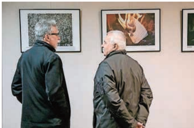
Knjige v fotografskih podobah

V Mestni knjižnici Kranj je do konca januarja na ogled zanimiva fotografska razstava Podobe knjige.