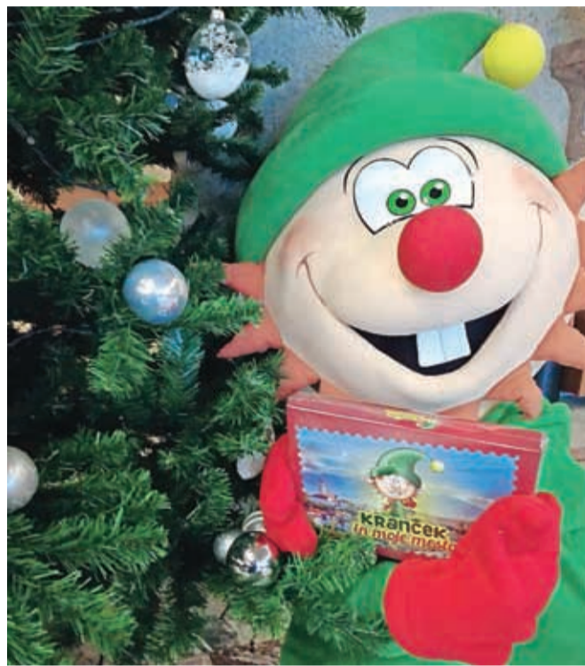
Škrat Kranček z novo igro

Kranj – "Živijo, se že poznava?" je Krančekov pozdrav, ki nagovarja mlade in mlade po srcu z zadnje strani škatle nove namizne igre. V njej je zbranih kar nekaj vsebin, na katere Kranjčani in Kranjčanke nikakor ne smemo pozabiti. Dotikajo se tako varovanja okolja kot tudi raziskovanja skritih kotičkov Kranja ter tudi tistih vsebin, s katerimi Kranček predstavlja, kaj novega se je naučil od zemeljskih otrok in odraslih. Namreč, kot pravi sam, rad raziskuje mesto in spoznava nove prijatelje. Od njih se vedno kaj novega nauči in je tudi sicer odprte glave za novosti. Posebnost letošnje obeležitve praznika naše mestne občine je zagotovo tudi družinska didaktična namizna igra Kranček in moje mesto, namenjena tako otrokom kot odraslim, ki v spoznavanju Kranja in zanimivosti, ki jih Kranj ponuja, vabi celotno družino. Gre za kombinacijo igranja vsem znanih iger človek ne jezi se in acti-