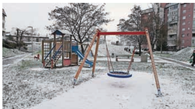
Igrišča so dopolnili z gugalnicami, imenovanimi gnezda.

Kranj – Mestna uprava je skupaj s KS Bratov Smuk v prednovoletnem času razveselila tamkajšnje otroke. Tri njihova igrišča so dopolnili z gugalnicami, imenovanimi gnezda. Gre za urbana igrala za manjše otroke, stare od enega do šest let. Sestavni del igral so trdna konstrukcija, debela varovalna vrvi in polnjena notranjost, ki zagotavljajo varnost med igro. Igrala dopolnjuje tudi varovalna podlaga, kljub temu pa mestna uprava pri uporabi vseh igral svetuje prisotnost odrasle osebe, predvsem pa izdatno previdnost.