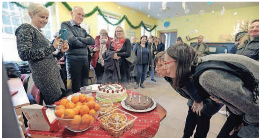
Ob obletnici so na Sejmišču 4 minuli torek upihili deset svečk.

Kranj – S priložnostnim programom so minuli torek na Sejmišču 4 v Kranju zabeležili deseto obletnico delovanja Zavetišča za brezdomce Kranj. Hkrati mineva tudi deset let od selitve programov razdelilnice hrane, Centra za pomoč, terapijo, socialno rehabilitacijo in reintegracijo zasvojenih ter stanovanjske skupine Katalp v prostore na Sejmišču. "Pred desetimi leti je padla odločitev, da hiši, ki je bila potrebna obnove, damo nov program. V Kranju in na Gorenjskem takrat ni bilo zavetišča za brezdomce, zato smo se odločili, da del tega objekta namenimo brezdomcem, del pa Centru za odvisnost. Oba programa sedaj tukaj uspešno delujeta in mislim, da imamo enega najlepših zavetišč za brezdomce, prav tako pa tudi zelo dobro vodstvo, ki skrbi za dom. Prepričana sem, da bo tako tudi naprej," je povedala vodja Urada za družbene dejavnosti Nada Bogataj Kržan, zbrane pa je pozdravila tudi v. d.