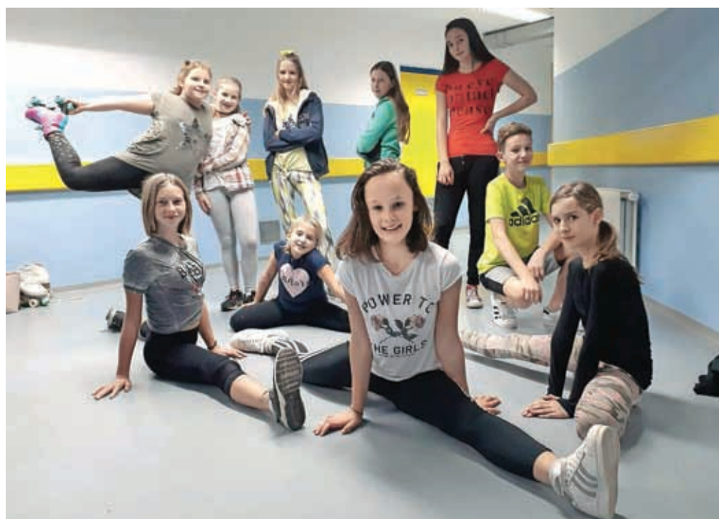
Mladi kotalkarji in kotalkarice so pripravljani na kotalkarsko revijo.