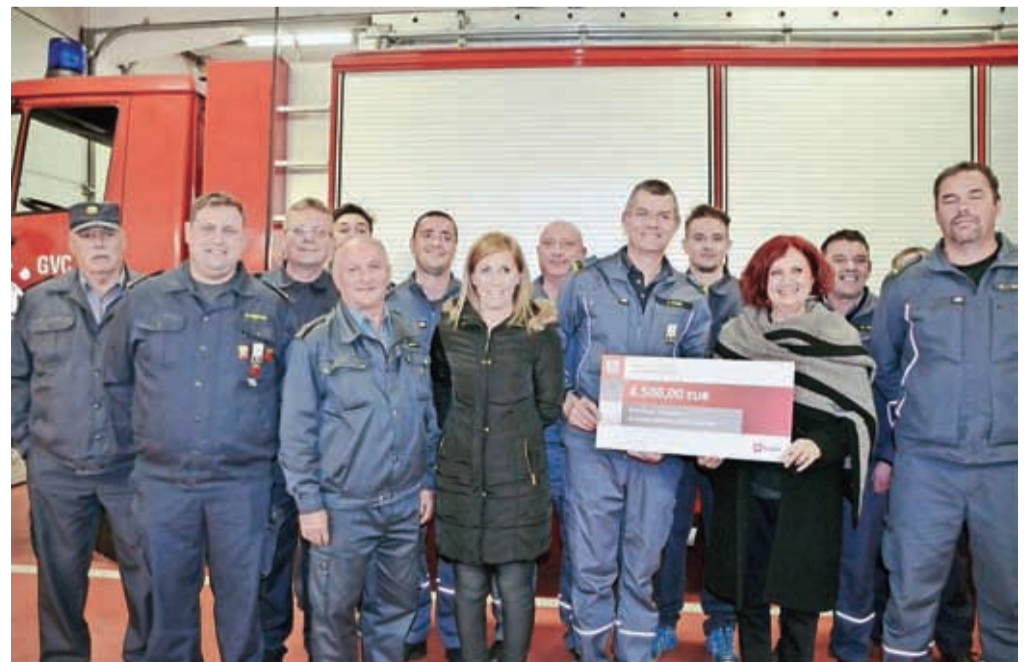
Podpore največje slovenske zavarovalnice so se razveselili tudi v PGD Kranj Primskovo.