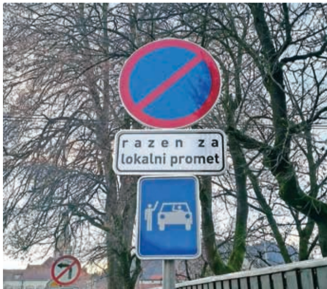
Oznaka točke "postoj in odpelji"

Kranj – Kranjska občina se lahko pohvali s prvo točko "postoj in odpelji" (Kiss & Ride) pri mestnem središču. Za obiskovalce brez osebnega avtomobila, predvsem pa za otroke in mladostnike, ki obiskujejo Glasbeno šolo Kranj, so v Mestni upravi uredili točko "postoj in odpelji". To pomeni, da bodo vozniki osebnih avtomobilov svoje vozilo ustavili na točno določenem mestu ter počakali, da sovoznik oziroma sopotnik varno izstopi iz vozila ter stopi na območje za pešce. Prvi tovrstni sistem je urejen pri podaljšanem avtobusnem postajališču Huje pri Čebelici.