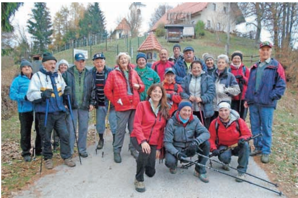
Prijatelji Jošta so se ob koncu sezone podali na izlet proti Planici.

moje žene in Prijatelj Jošta smo jih postavili na običajnih mestih," je povedal Zelnik.