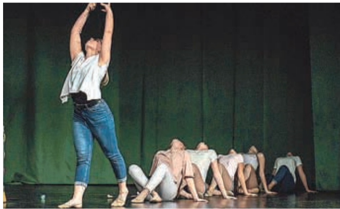
Dekleta so navdušila občinstvo na Primskovem.

V začetku decembra so dekleta Mažoretnega in twirling kluba Kranj v Domu krajanov na Primskovem navdušila z božično-novoletno prireditvijo Twirling Mamma Mia.