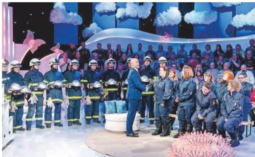
Prostovoljnim gasilkam PGD Jošt, ki so se pol leta trudile, da bi zbrale dovolj denarnih sredstev za nakup uniform in zaščitnih oblek, so se uresničile sanje.