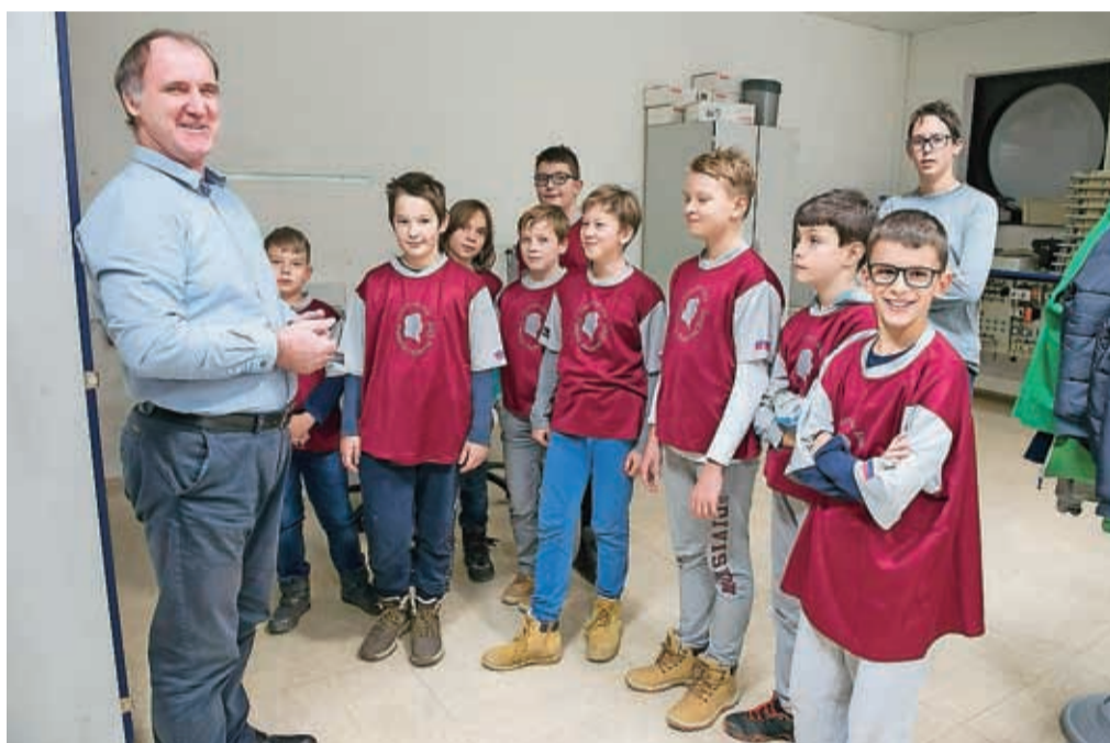
Iz okoliških osnovnih šol so se učenci Robotkovega dneva udeležili v spremstvu učiteljev.