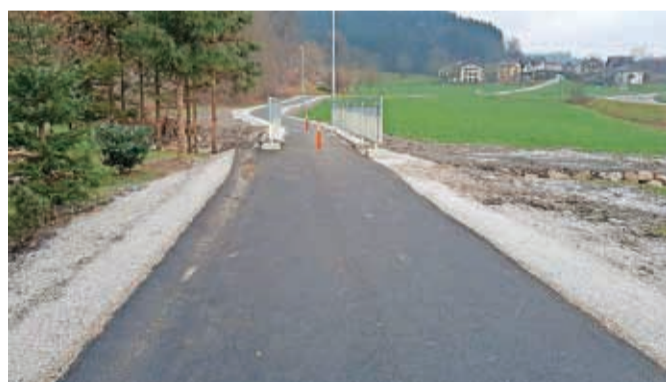
Prvi del pločnika Golnik–Goriče je dokončan.

Golnik – Projekt urejanja varnejše poti v šolo je tudi zaradi visoke investicijske vrednosti razdeljen v več delov. Gre za državno cesto in MO Kranj je že v jesenskem času zaključila kar dva odseka (prvi in zadnji), vmesni odsek pa je načrtovan za pomlad drugo leto. Dobra novica prihaja tudi od države, saj naj bi sofinancirala gradnjo tega vmesnega odseka, ki je finančno zagotovo največji zalogaj. Letos načrtovana dva odseka v projektu ureditve varnejše poti v šolo na državni cesti Goriče–Golnik sta zaključena, brežine potoka in bankine na odseku iz smeri Gorič so urejene, čez potok je urejen most z varovalno ograjo, oba letos urejena odseka sta že tudi osvetljena. Mestna uprava in pristojne državne institucije so tudi že začele pripravljati javno naročilo za izvedbo vmesnega odseka, ki bo povezal oba že izvedena dela pločnika, ki jih je MO Kranj izvedla letos.