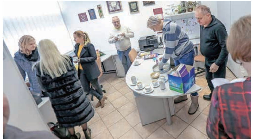
Novi prostori so v pritličju, veliki so štirideset kvadratnih metrov, poleg dveh pisarn pa imajo invalidi sedaj tudi svoje sanitarije.