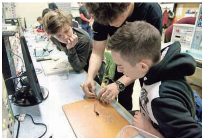
Na Robotkovem dnevu so osnovnošolci lahko tudi v praksi preskusili svoje spretnosti in veščine.