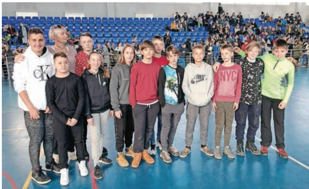
Kranjska rokometna ekipa v Banjaluki

Na poti v Banjaluko so obiskali tudi spominsko območje koncentracijskega taborišča Jasenovac. Šola slovi kot ena najuspešnejših šol, tudi prireditve, ki so jih pripravili, so bile izvedene na visoki ravni. Ob tem je potekal tudi rokometni turnir, na katerem je sodelovala ekipa sedmošolcev in osmošolcev, ki je bila zaradi napačnih pogojev, ki so jih prejeli, leto dni mlajša in je nastopila v težji konkurenci. Kljub temu so bili dostojni nasprotniki in so se srčno borili na tujem terenu. Slovenski tekmovalci so pustili zelo dober vtis in prejeli pohvale tujih trenerjev.