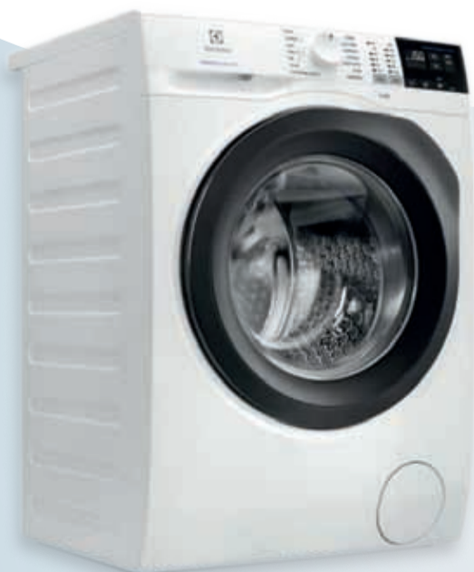
Pralni stroj Elektrolux

Spoštovani naročnice in naročniki Gorenjskega glasa, če ste na naš časopis brez prekinitve naročeni že vsaj deset let, potem ste z malo sreče pri žrebu lahko dobitniki enega od lepih novoletnih daril, ki jih Gorenjski glas poklanja svojim zvestim naročnikom: