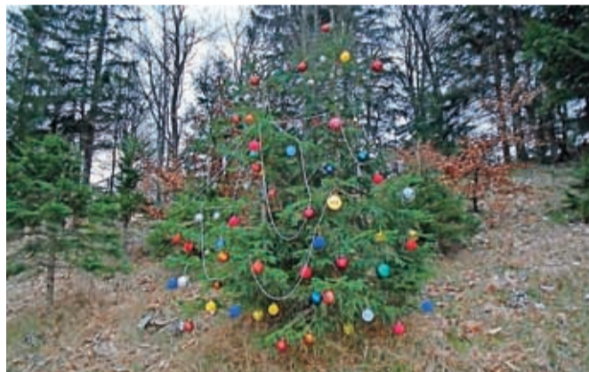
Na poti proti Sv. Joštu si te dni lahko ogledate smrečico in jaslice.