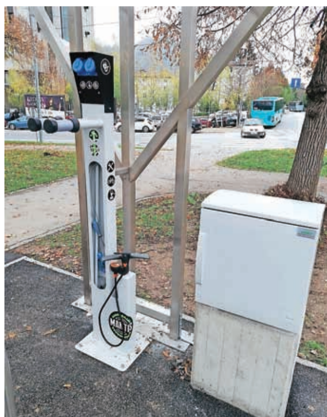
Stebriček za popravilo koles ob kolesarnici pri Avtobusni postaji Kranj